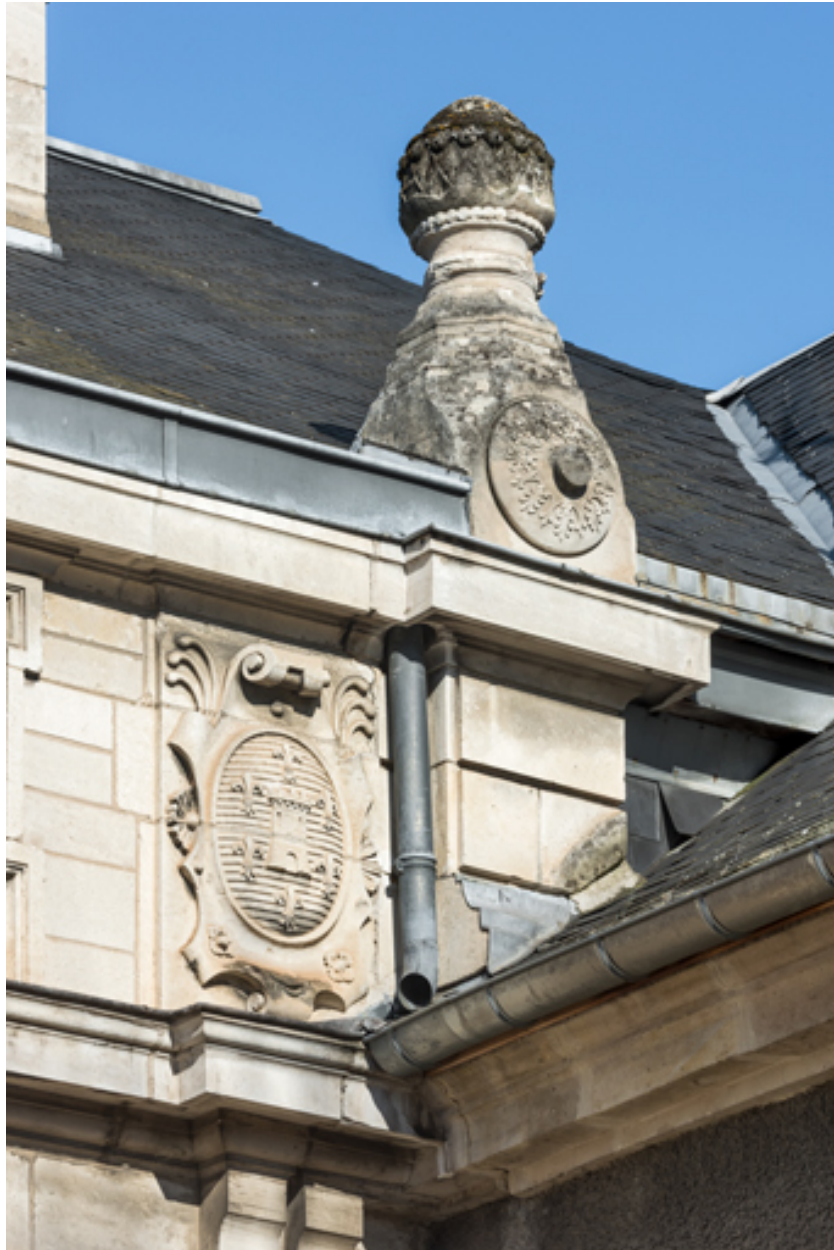
Façade latérale droite, attique : armoiries de la ville et amortissement sur l'angle droit.