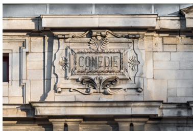
Façade latérale droite, attique : inscription Comédie.