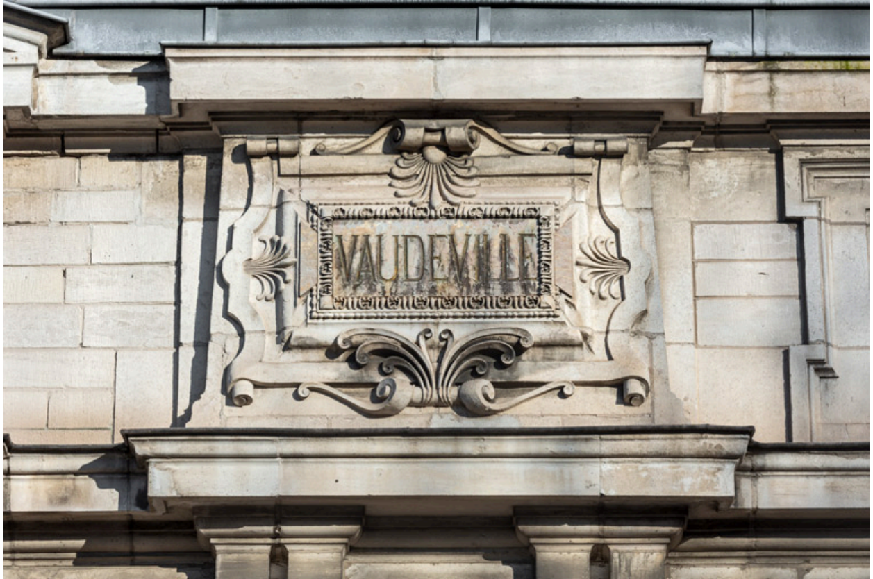
Façade latérale droite, attique : inscription Vaudeville.