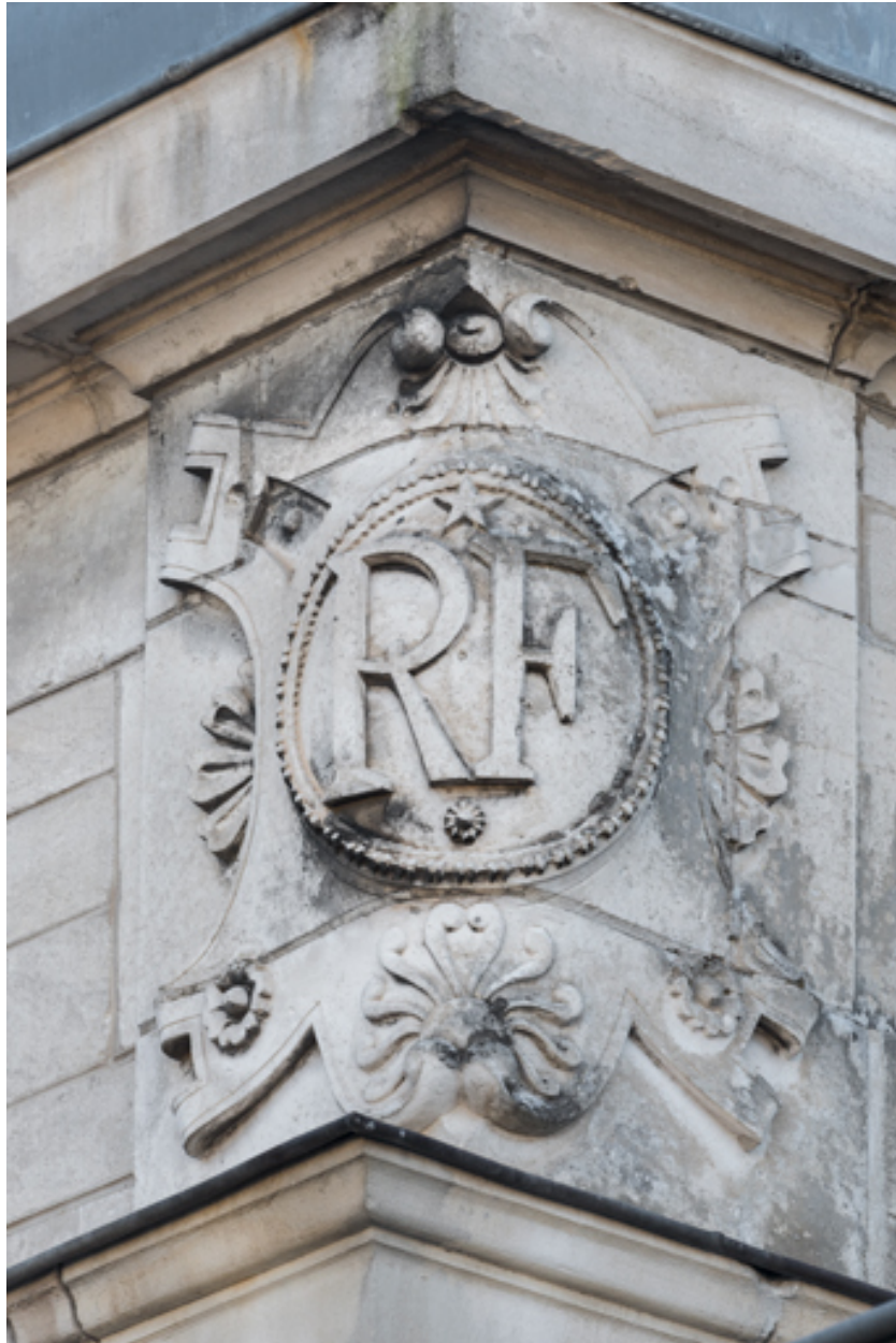
Façade latérale gauche, attique : inscription RF sur l'angle droit.