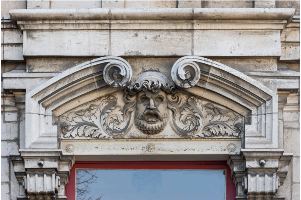
Façade latérale gauche, étage carré : linteau avec le masque de la Tragédie.