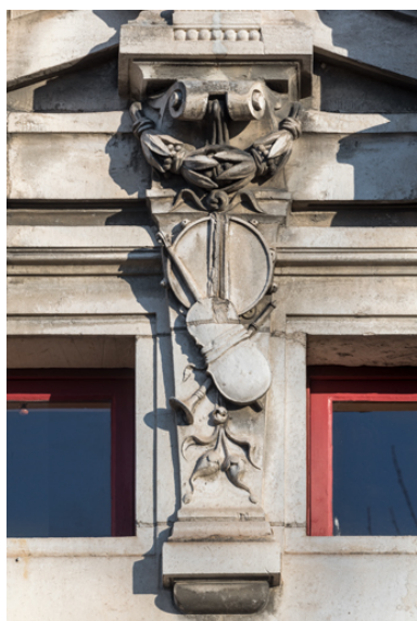
Façade latérale droite, attique : trophée de musique sous le fronton formant l'amortissement de la travée centrale.