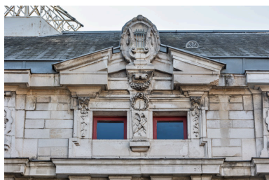
Façade latérale gauche, attique : baies et fronton formant l'amortissement de la travée centrale.