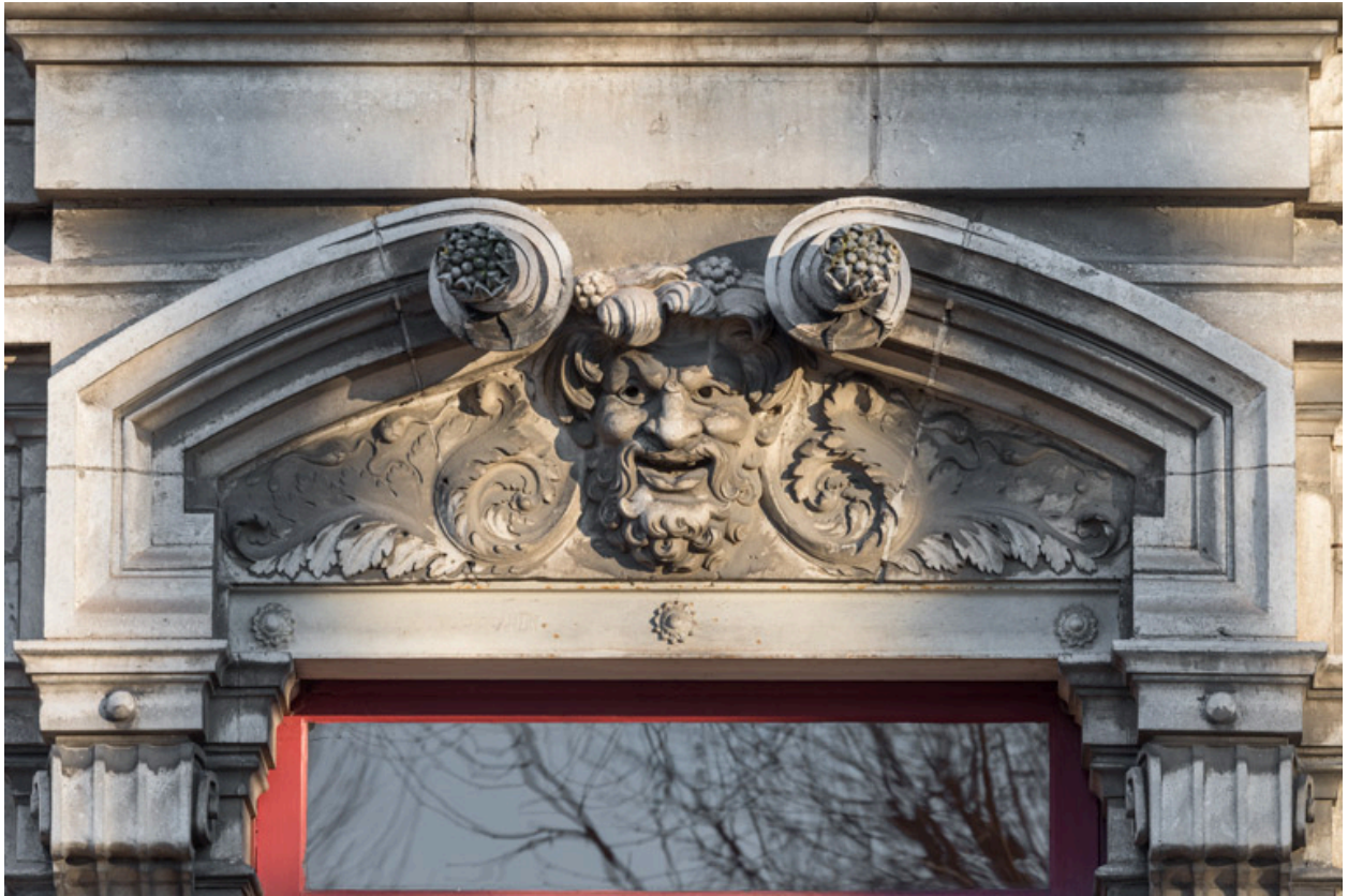
Façade latérale droite, étage carré : linteau avec le masque de la Comédie.