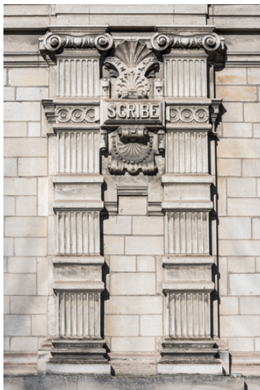
Façade latérale droite, étage carré : pilastres et inscription Scribe. IVR26_20238900209NUC4A