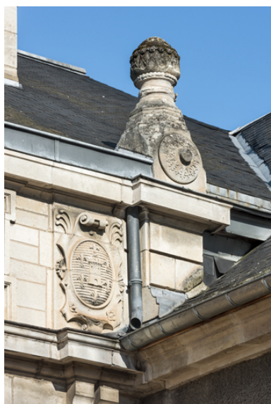
Façade latérale droite, attique : armoiries de la ville et amortissement sur l'angle droit. IVR26_20238900207NUC4A