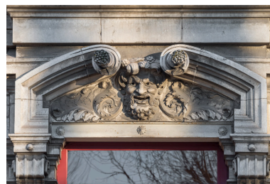
Façade latérale droite, étage carré : linteau avec le masque de la Comédie. IVR26_20238900193NUC4A