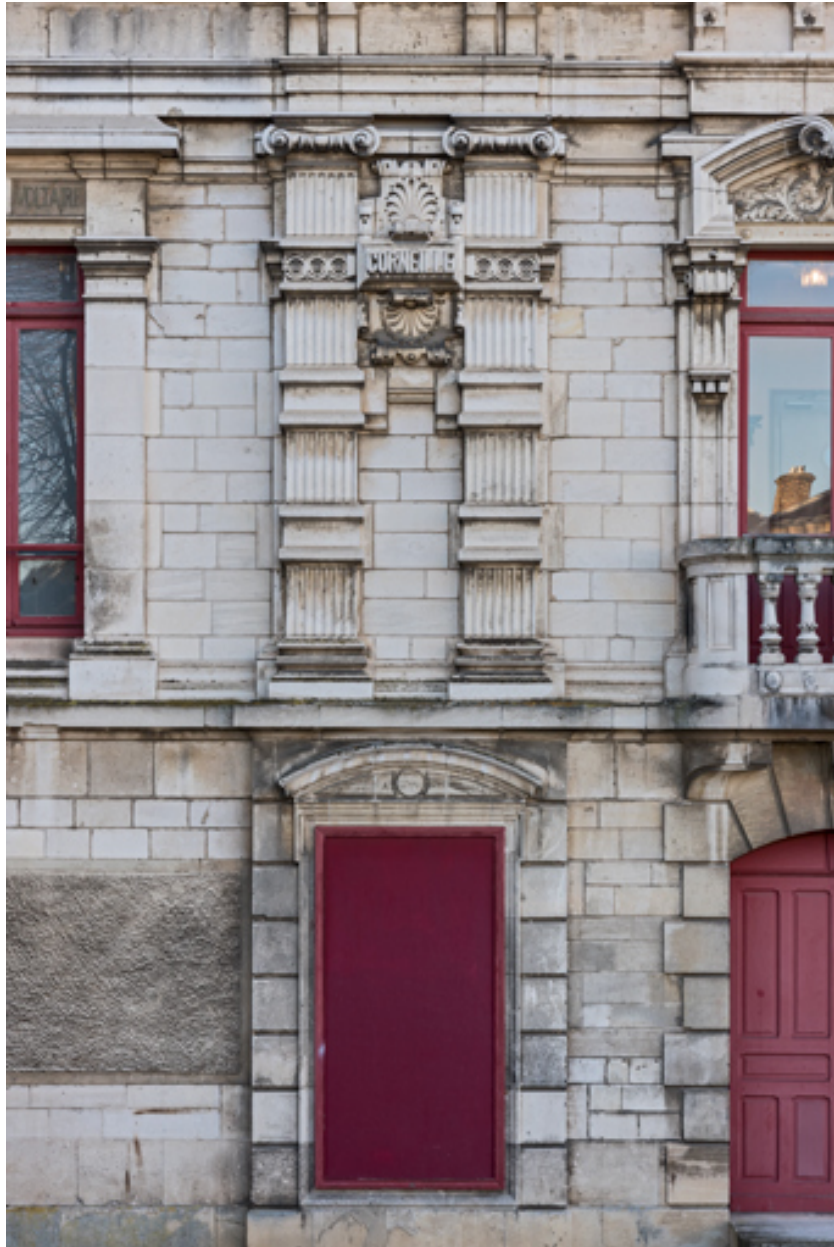
Façade latérale gauche : travée à gauche de l'entrée.