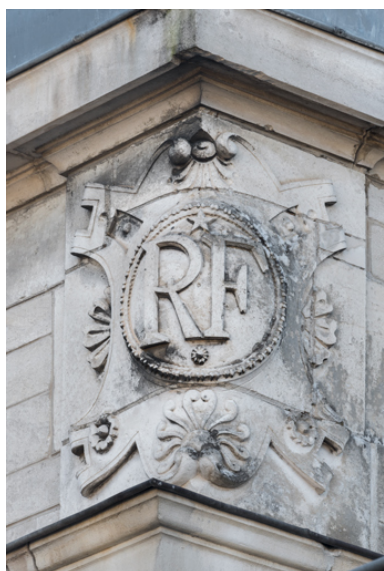
Façade latérale gauche, attique : inscription RF sur l'angle droit. IVR26_20238900201NUC4A