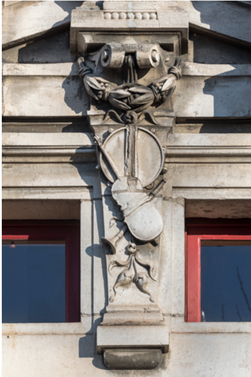
Façade latérale droite, attique : trophée de musique sous le fronton formant l'amortissement de la travée centrale.