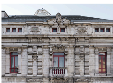
Façade latérale gauche : étage carré et attique. IVR26_20238900155NUC4A