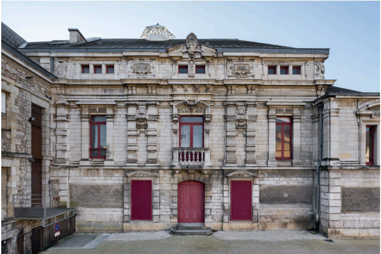
Façade latérale gauche (côté jardin).