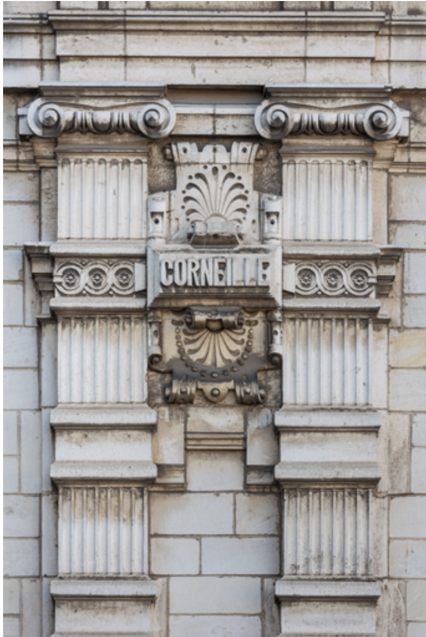
Façade latérale gauche, étage carré : pilastres et inscription Corneille.