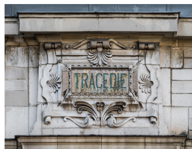
Façade latérale gauche, attique : inscription Tragédie. IVR26_20238900144NUC4A