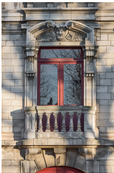
Façade latérale droite, étage carré : baie centrale. IVR26_20238900194NUC4A