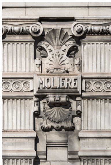
Façade latérale droite, étage carré : inscription Molière.