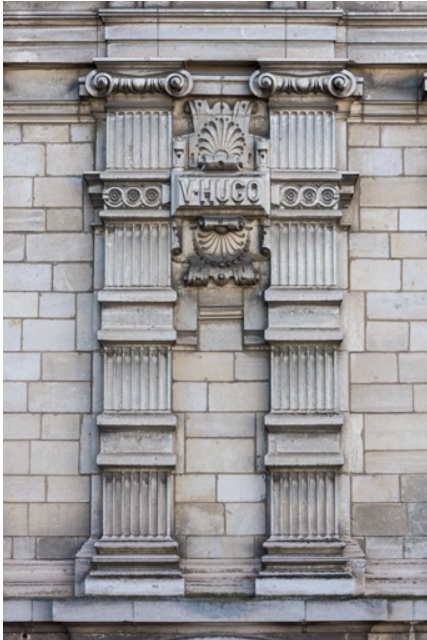
Façade latérale gauche, étage carré : pilastres et inscription V. Hugo.