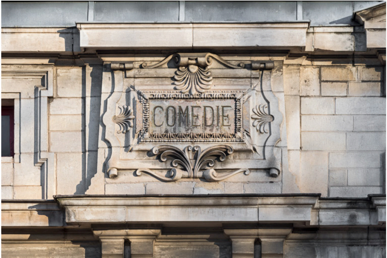
Façade latérale droite, attique : inscription Comédie.