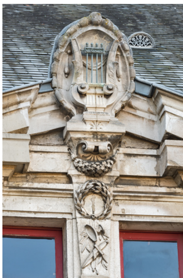
Façade latérale gauche, attique : amortissement de la travée centrale. IVR26_20238900147NUC4A