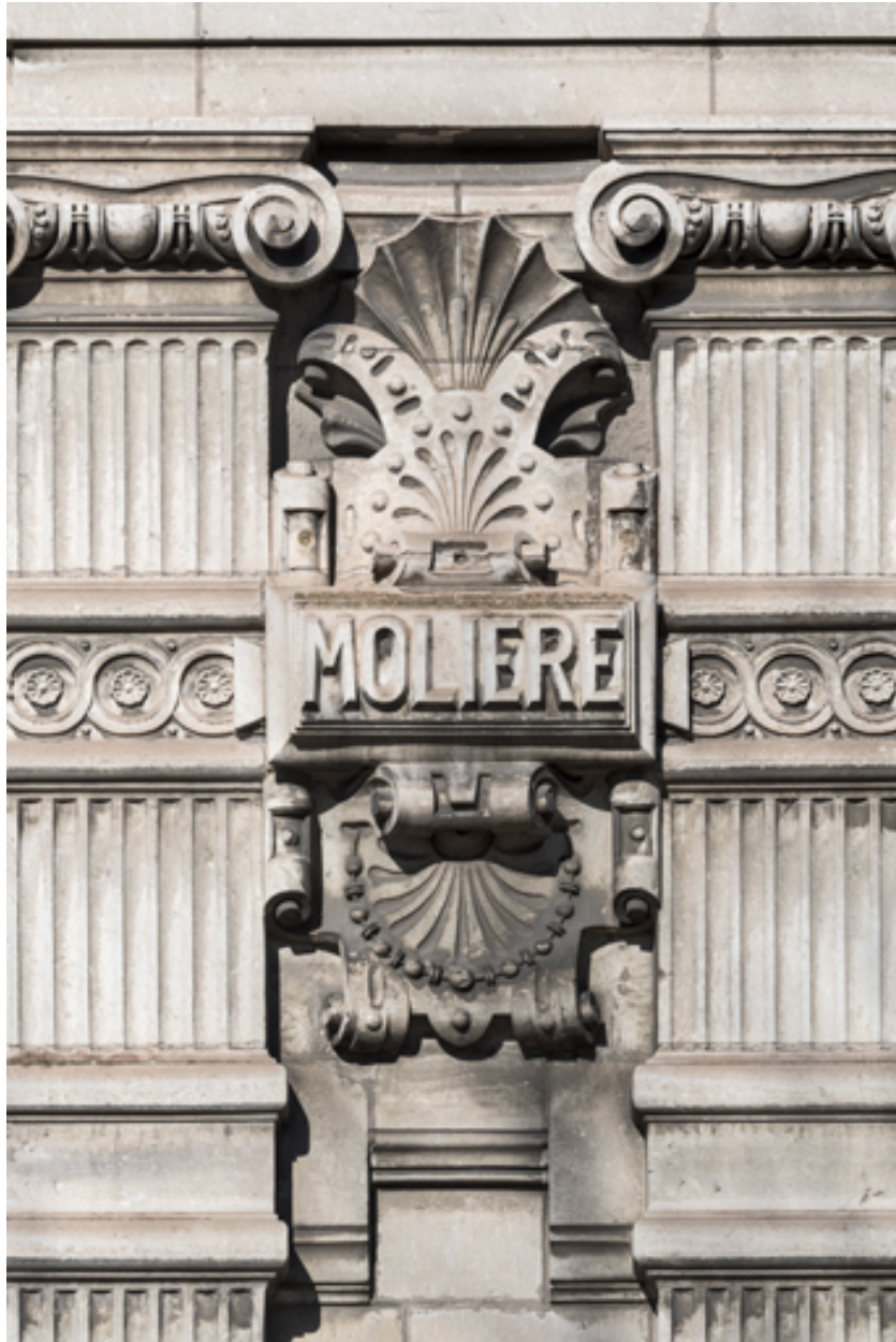
Façade latérale droite, étage carré : inscription Molière.