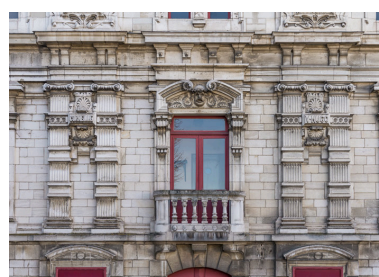
Façade latérale gauche : étage carré.