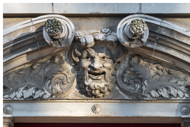
Façade latérale droite, étage carré : masque de la Comédie. IVR26_20238900195NUC4A