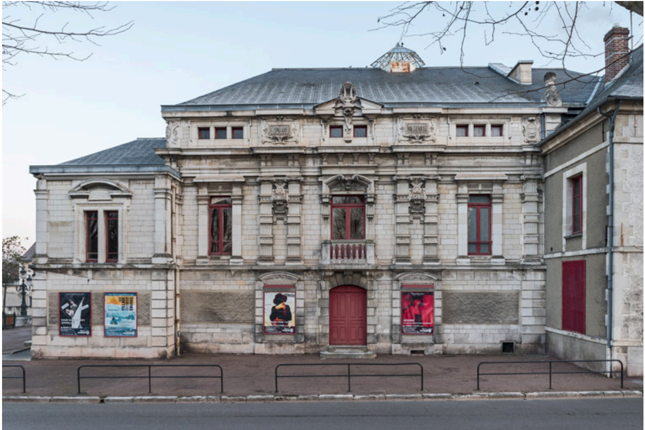
Façade latérale droite (côté cour).