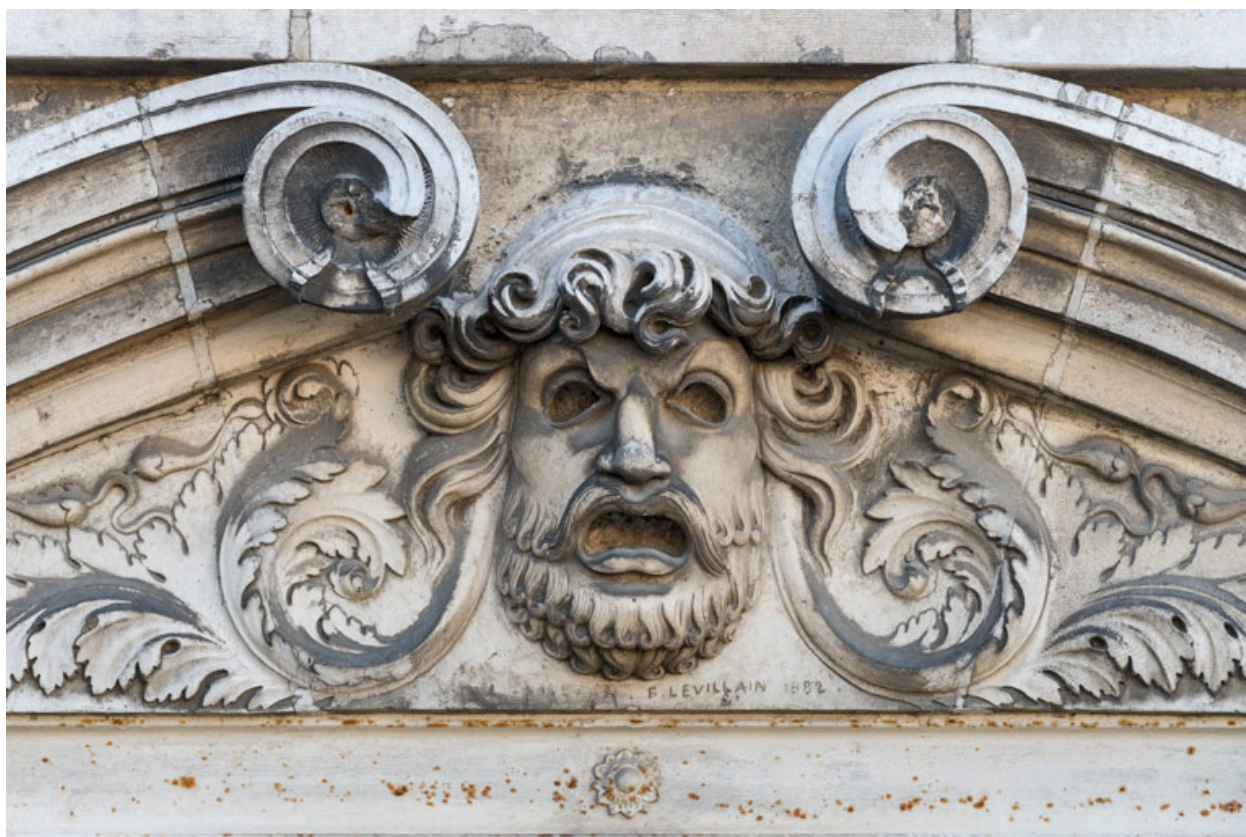
Façade latérale gauche, étage carré : masque de la Tragédie, signature F. Levillain et date 1882.