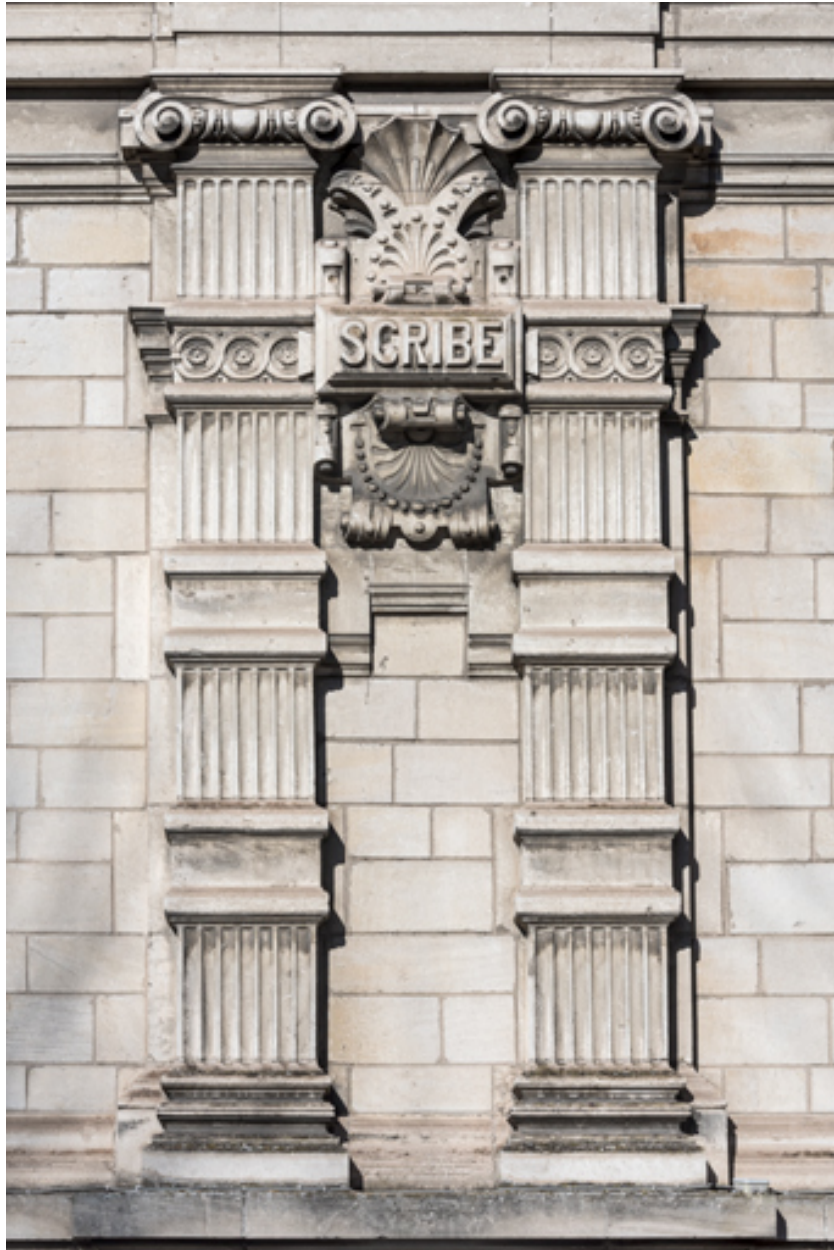
Façade latérale droite, étage carré : pilastres et inscription Scribe.