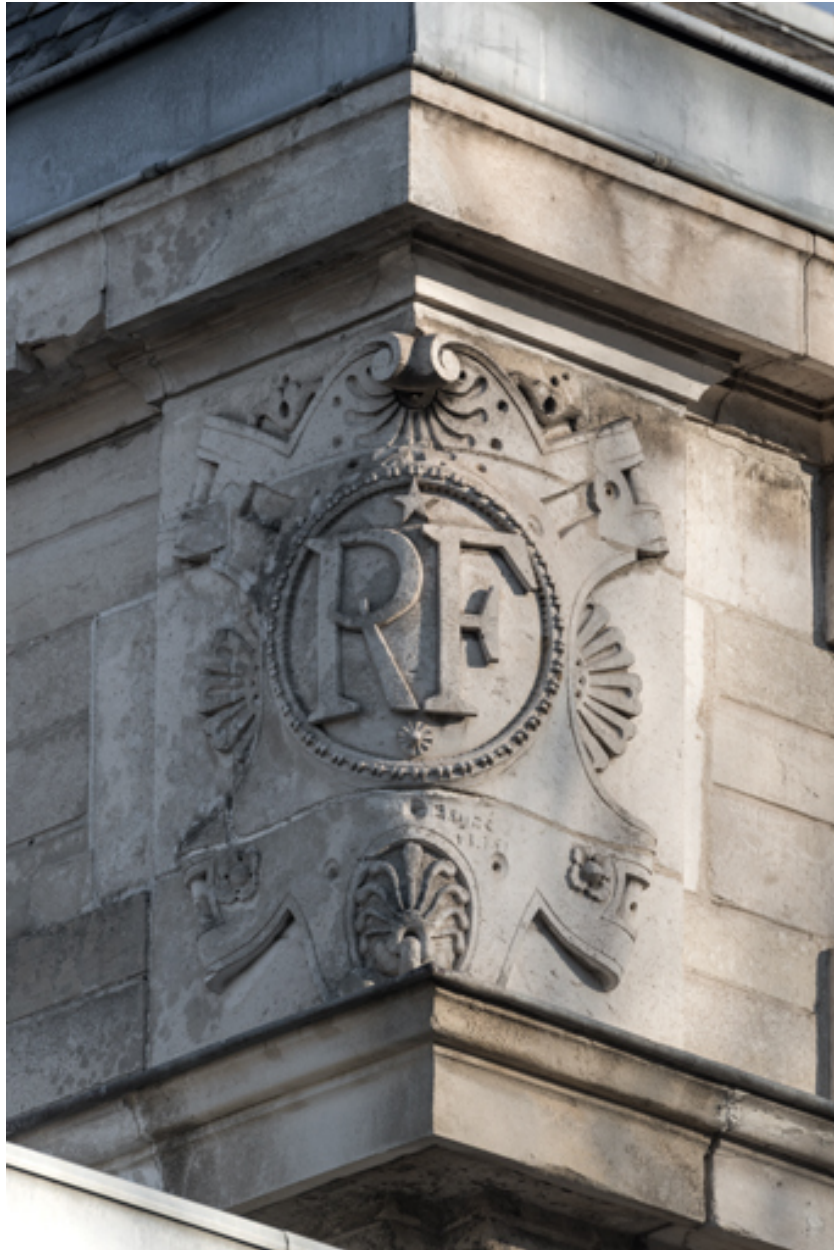
Façade latérale droite, attique : inscription RF sur l'angle gauche.