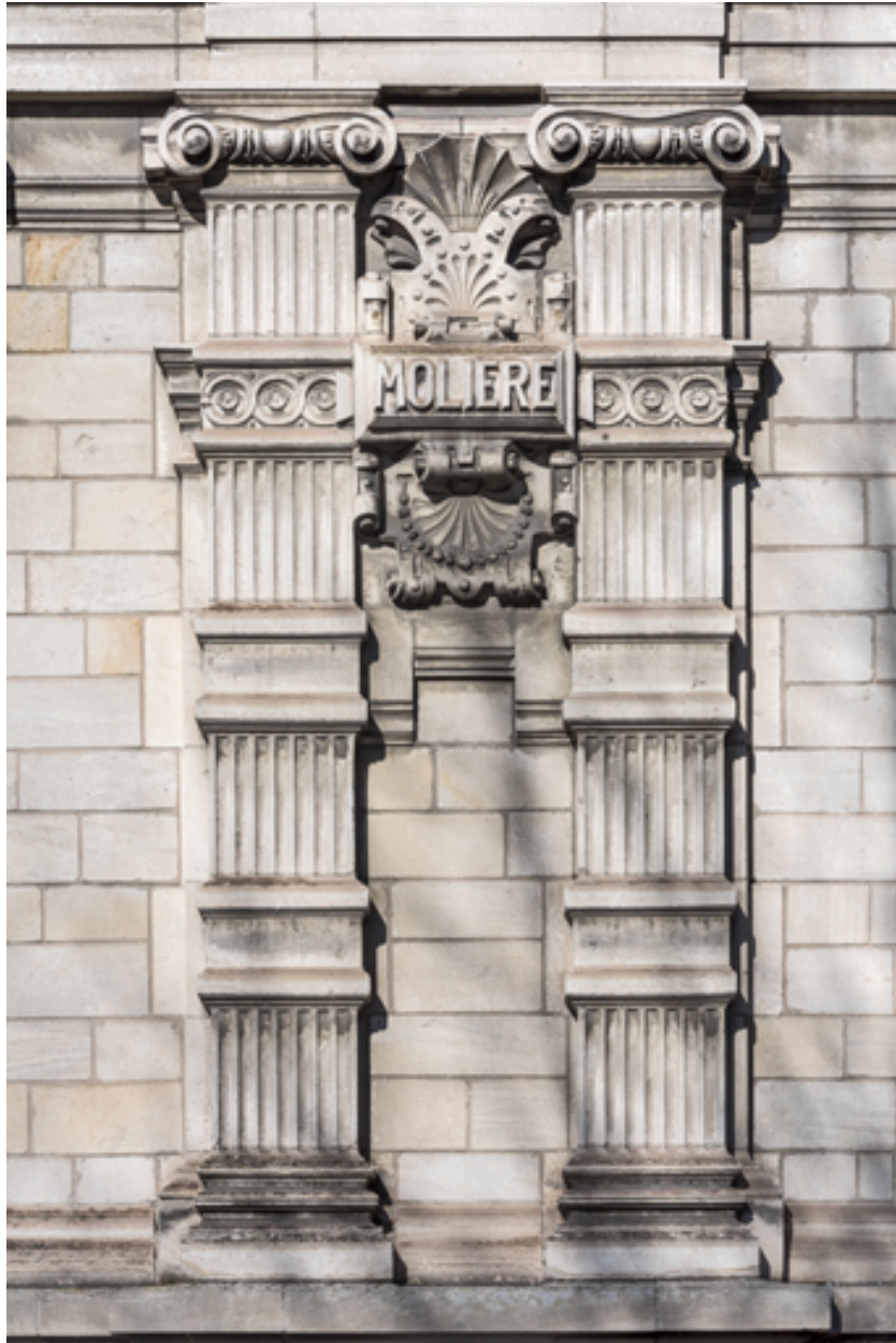
Façade latérale droite, étage carré : pilastres et inscription Molière.