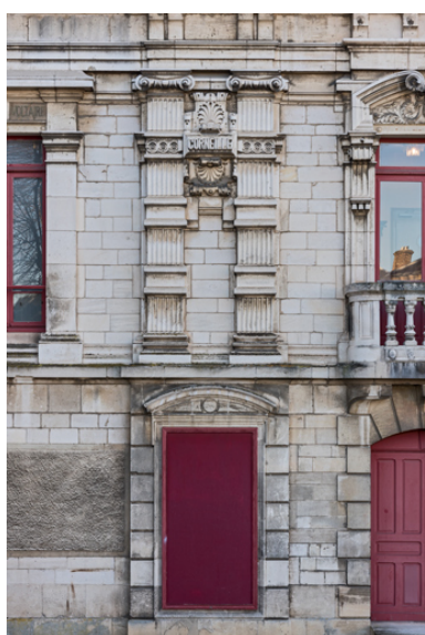
Façade latérale gauche : travée à gauche de l'entrée. IVR26_20238900143NUC4A