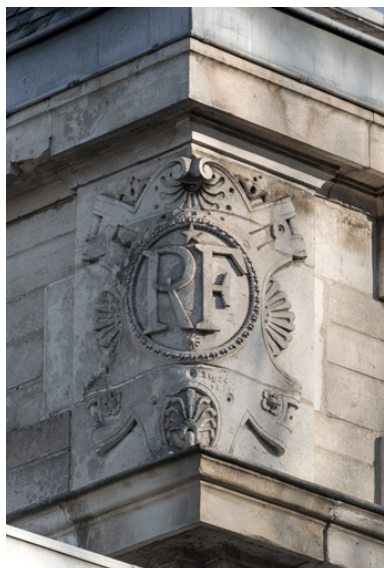
Façade latérale droite, attique : inscription RF sur l'angle gauche. IVR26_20238900200NUC4A