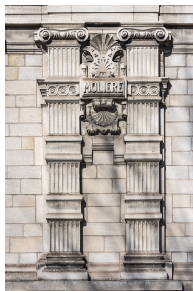
Façade latérale droite, étage carré : pilastres et inscription Molière. IVR26_20238900205NUC4A