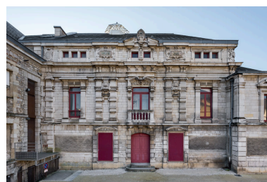
Façade latérale gauche (côté jardin). IVR26_20238900154NUC4A