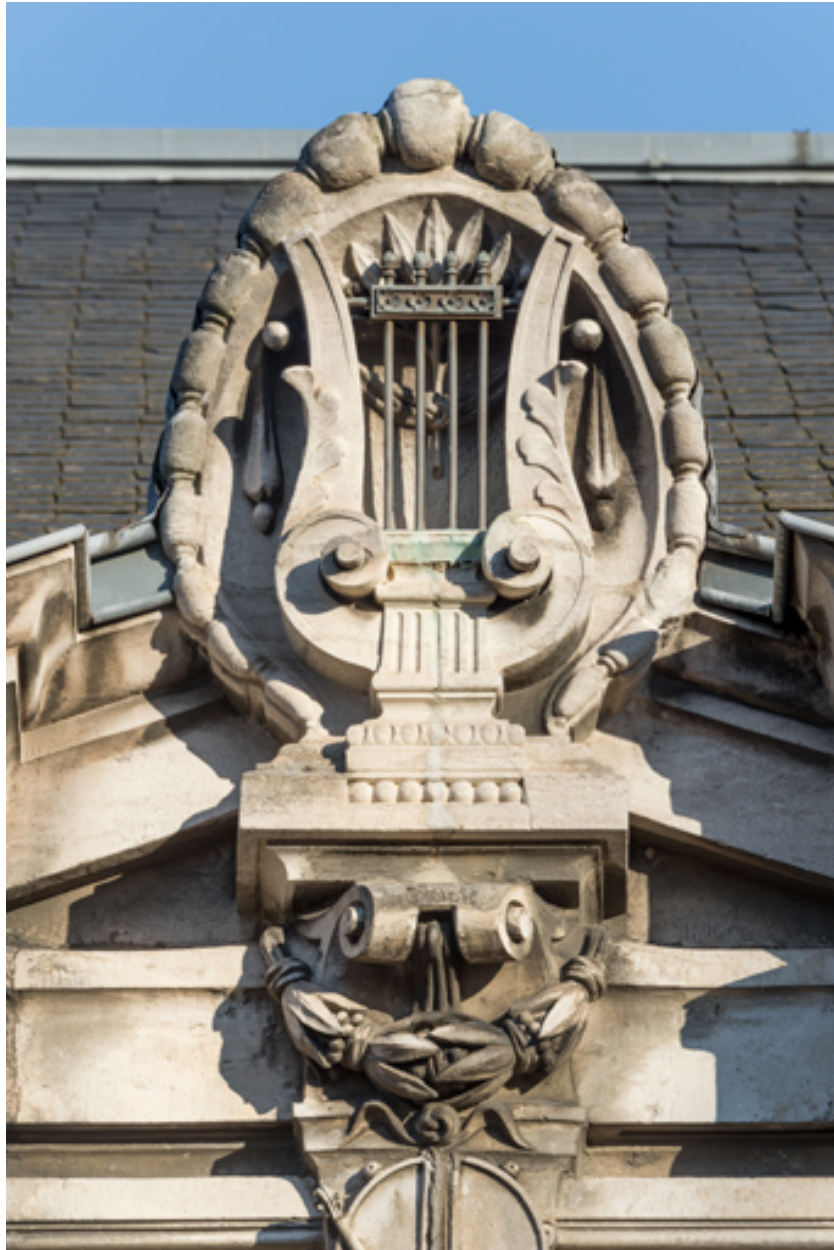
Façade latérale droite, attique : amortissement de la travée centrale.