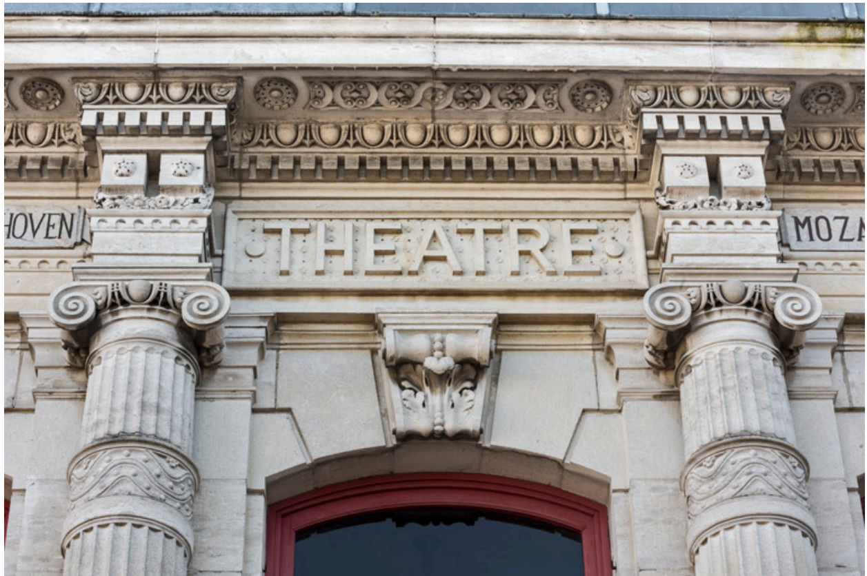
Façade antérieure : inscription Théâtre sur la travée centrale.