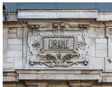
Façade latérale gauche, attique : inscription Drame. IVR26_20238900158NUC4A