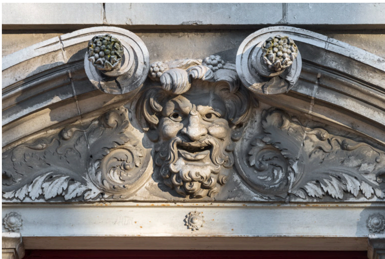
Façade latérale droite, étage carré : masque de la Comédie.