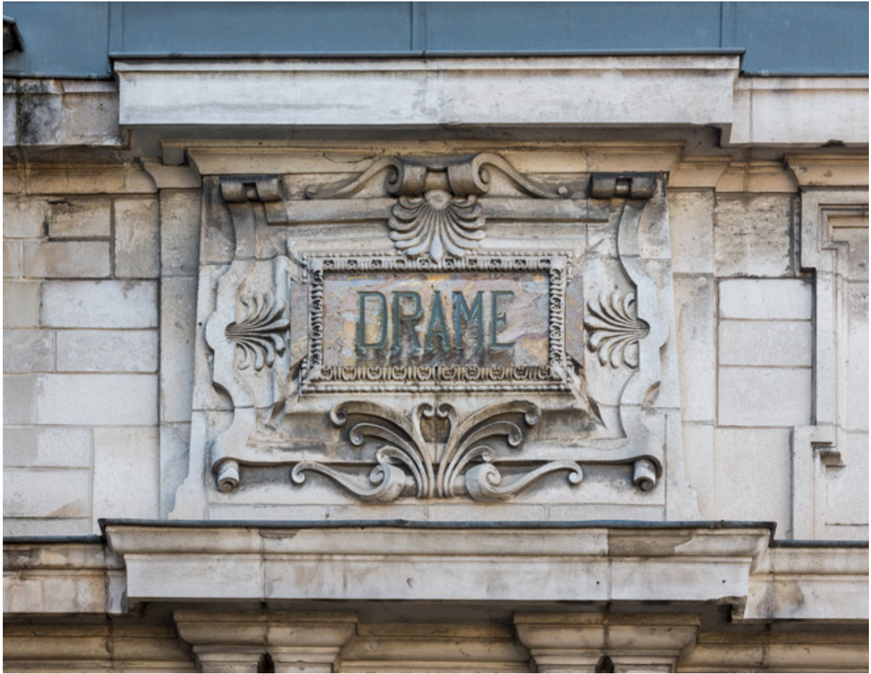
Façade latérale gauche, attique : inscription Drame.