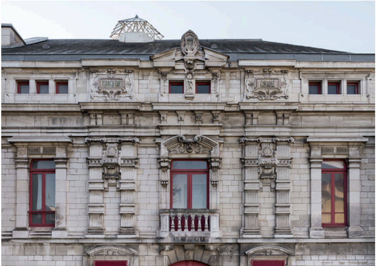
Façade latérale gauche : étage carré et attique.