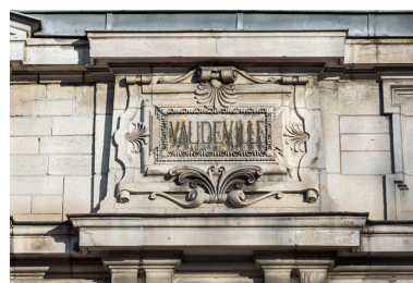
Façade latérale droite, attique : inscription Vaudeville. IVR26_20238900199NUC4A