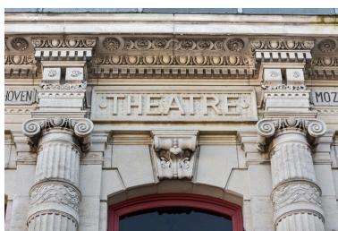
Façade antérieure : inscription Théâtre sur la travée centrale.