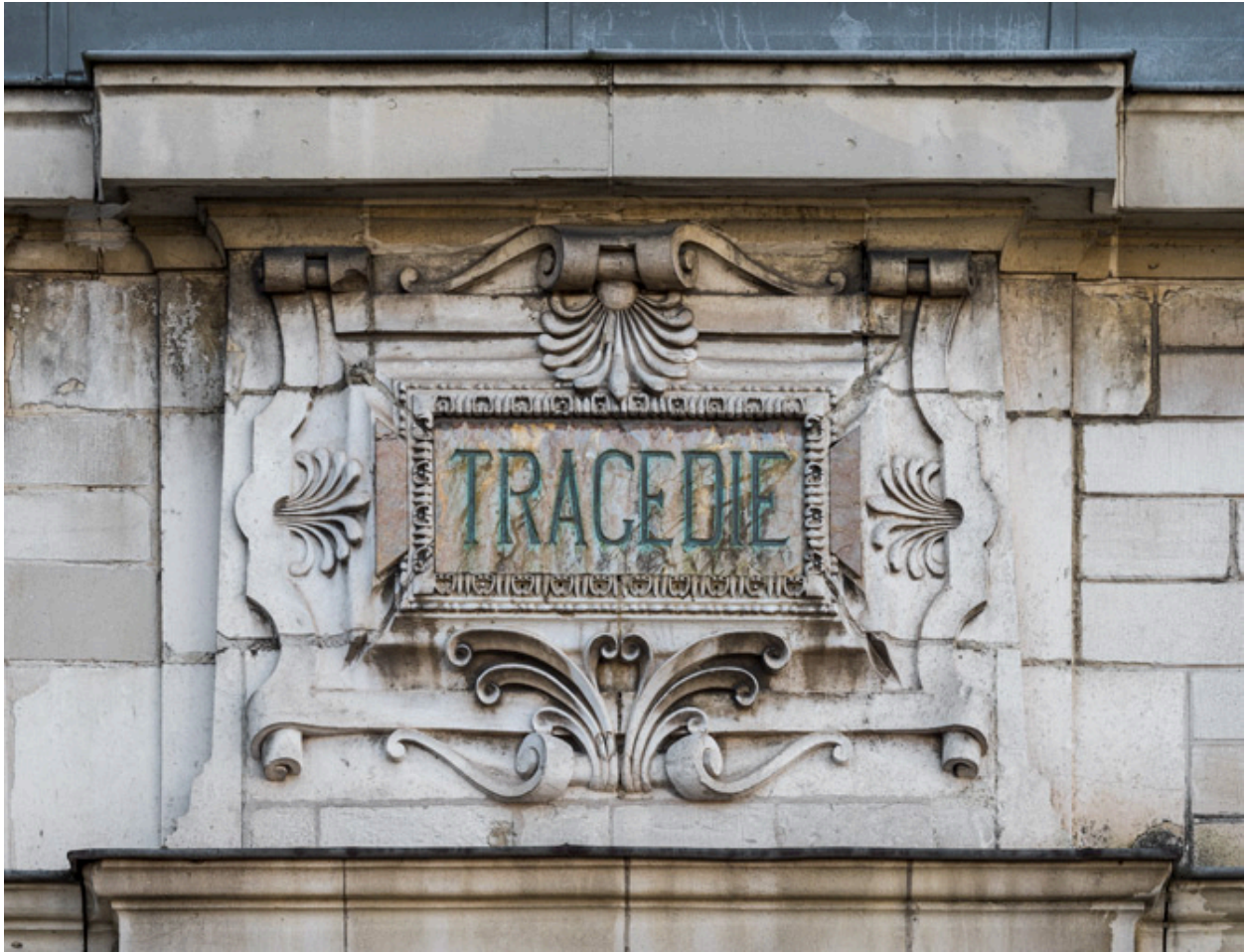
Façade latérale gauche, attique : inscription Tragédie.