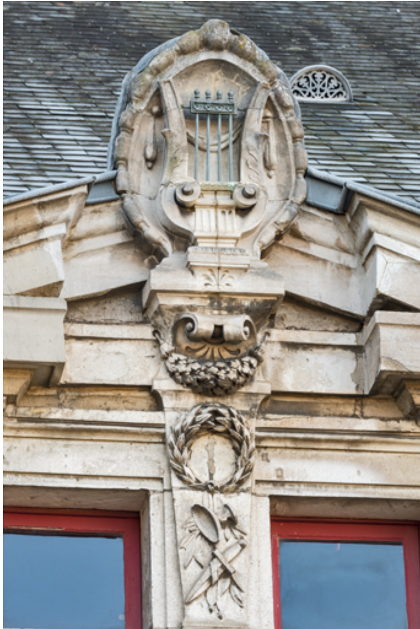
Façade latérale gauche, attique : amortissement de la travée centrale.