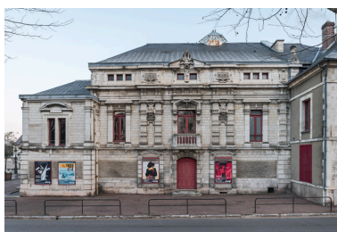
Façade latérale droite (côté cour). IVR26_20238900222NUC4A