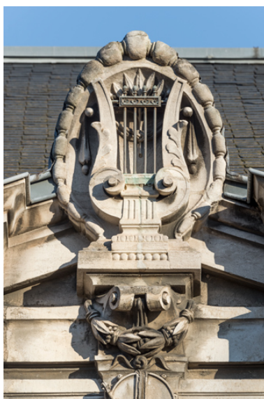
Façade latérale droite, attique : amortissement de la travée centrale. IVR26_20238900198NUC4A