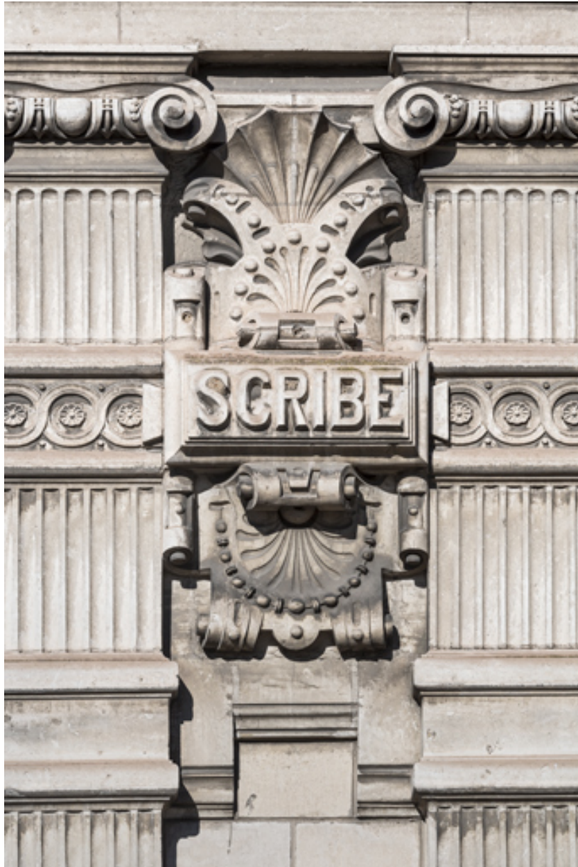
Façade latérale droite, étage carré : inscription Scribe.