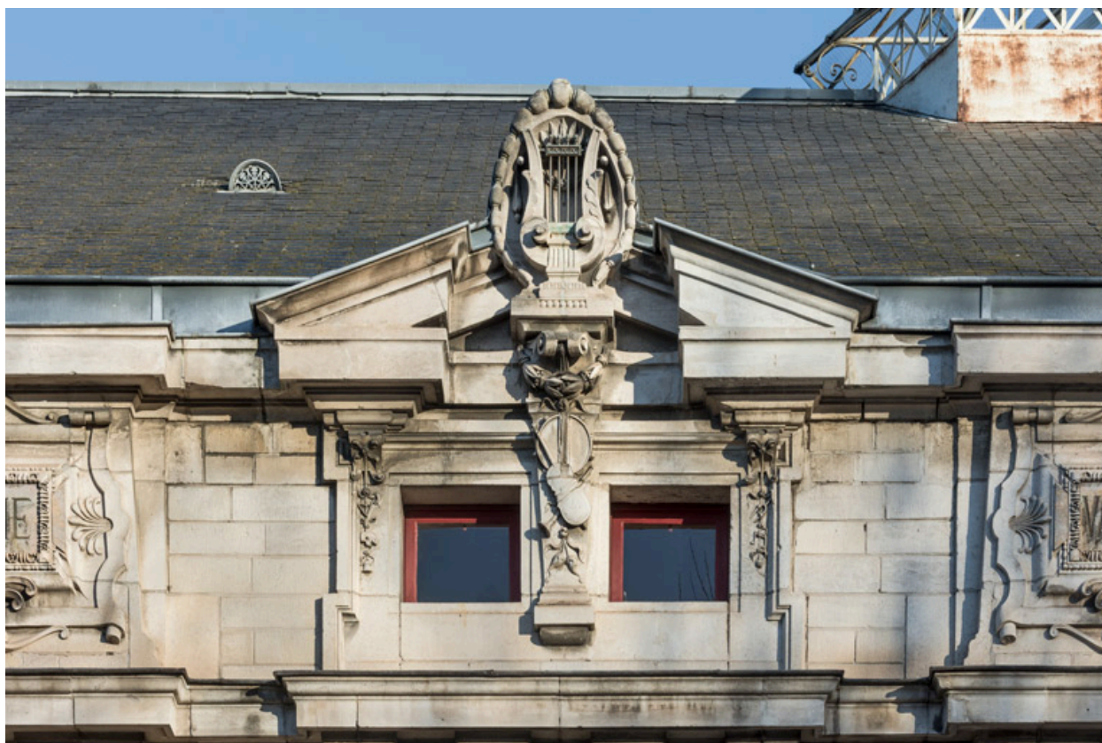
Façade latérale droite, attique : baies et fronton formant l'amortissement de la travée centrale.