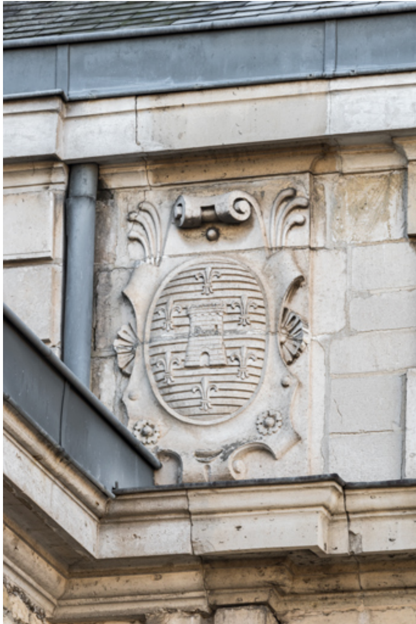
Façade latérale gauche, attique : armoiries de la ville.