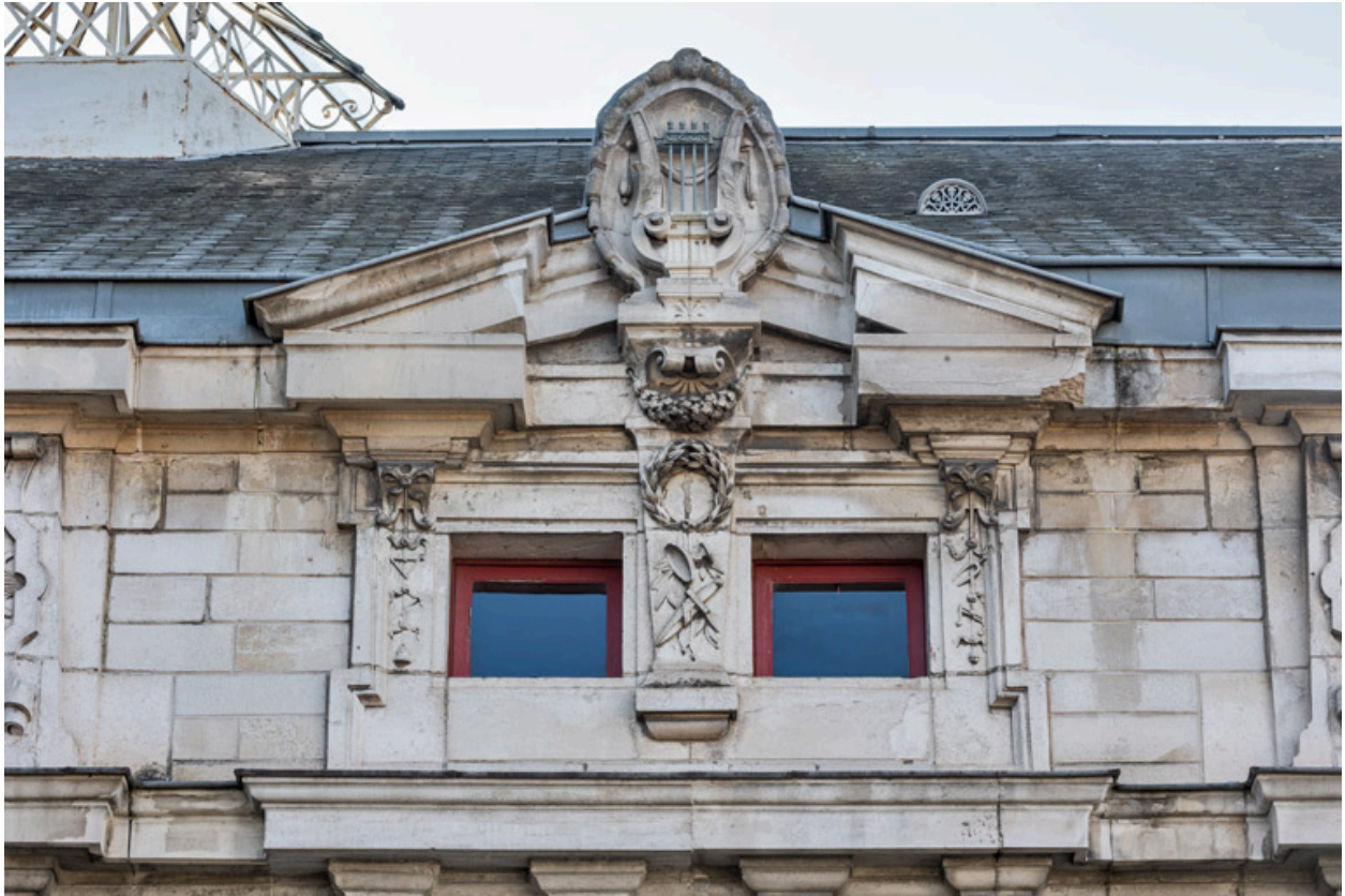
Façade latérale gauche, attique : baies et fronton formant l'amortissement de la travée centrale.