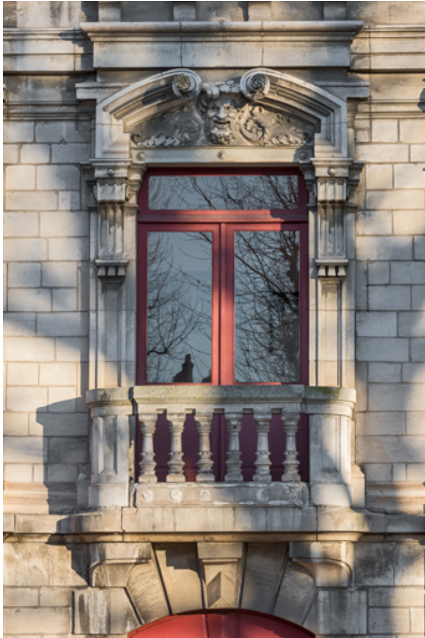
Façade latérale droite, étage carré : baie centrale.