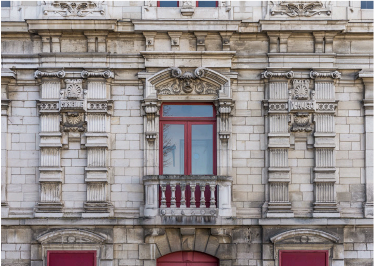
Façade latérale gauche : étage carré.