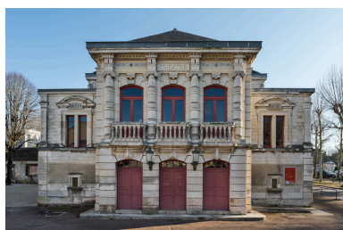
Façade antérieure. IVR26_20238900162NUC4A