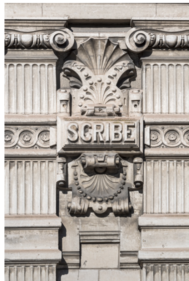
Façade latérale droite, étage carré : inscription Scribe. IVR26_20238900208NUC4A