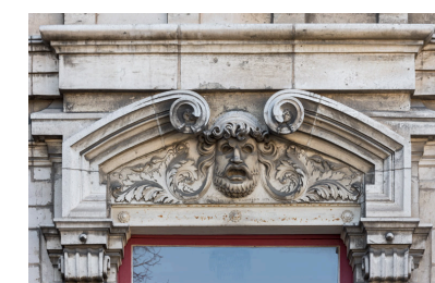
Façade latérale gauche, étage carré : linteau avec le masque de la Tragédie. IVR26_20238900150NUC4A