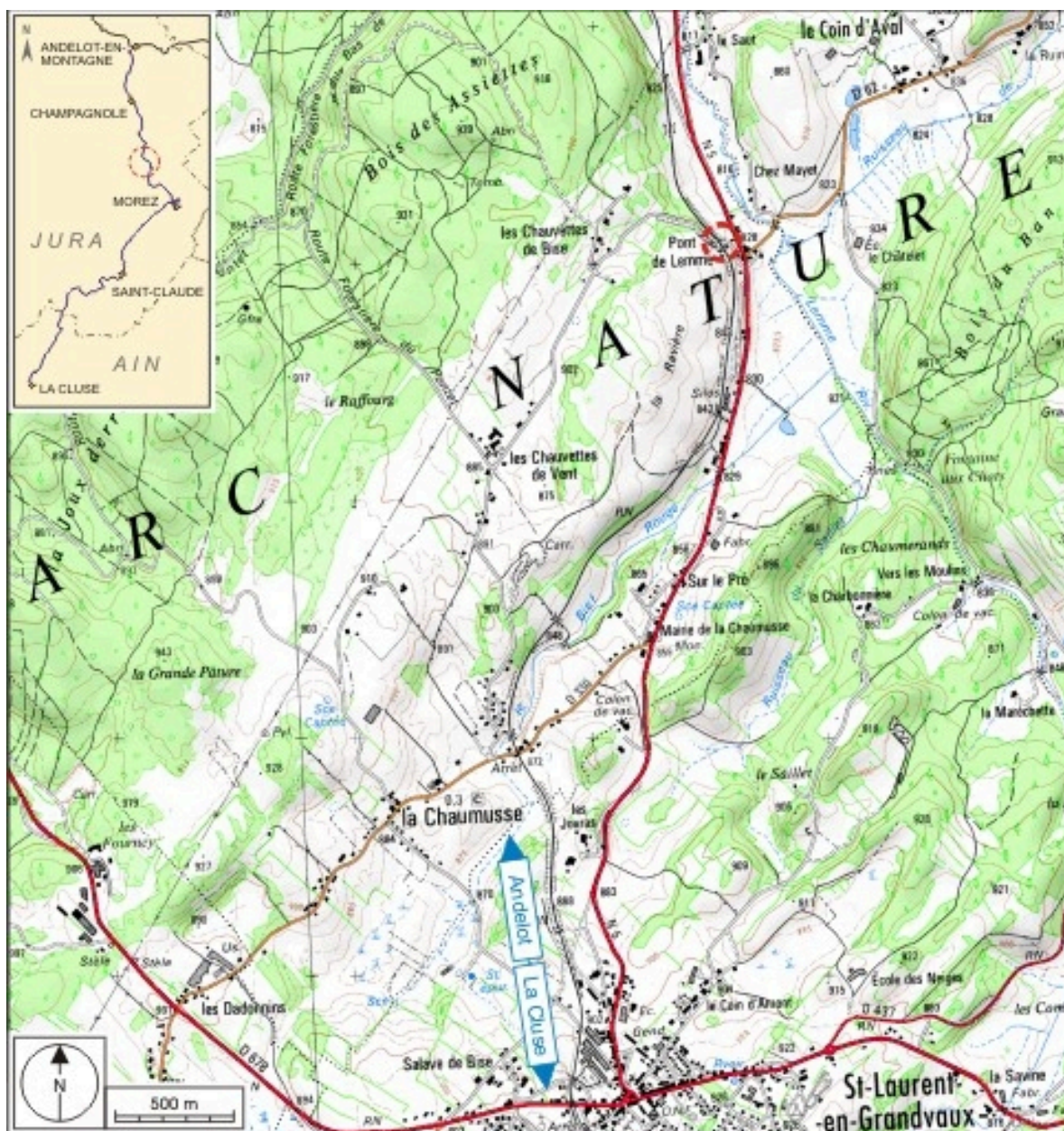
Carte et schéma de localisation. Carte topographique, IGN, 2000, dalle F087_049, échelle 1:25 000. Scan 25, licence n° 2008/CISE/2968.