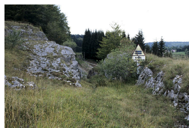
Vue d'ensemble. IVR43_20043900229ZA