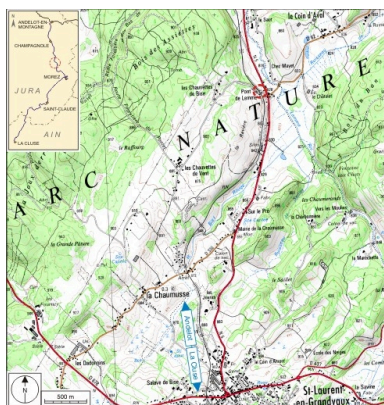
Carte et schéma de localisation. Carte topographique, IGN, 2000, dalle F087_049, échelle 1:25 000. Scan 25, licence n° 2008/CISE/2968. IVR43_20093900022NUDA