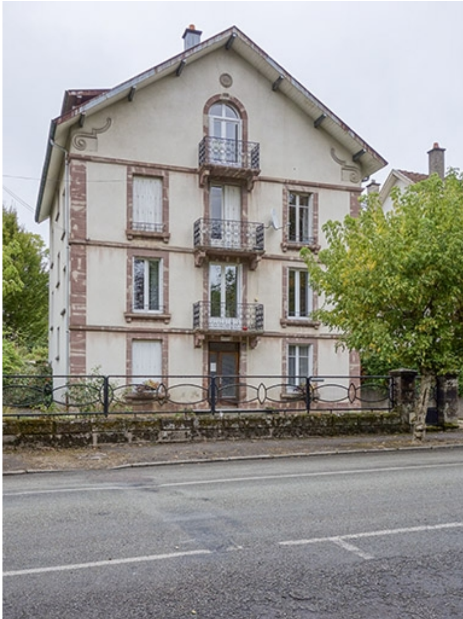
Vue depuis la rue.