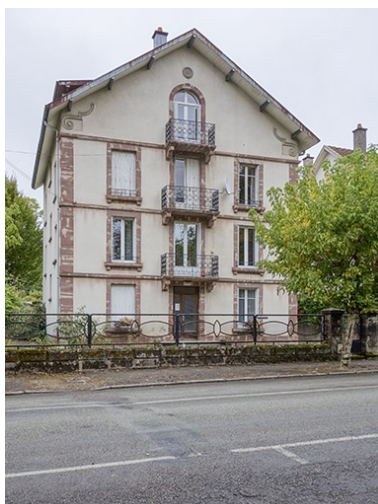
Vue depuis la rue. IVR43_20217000201NUC4A