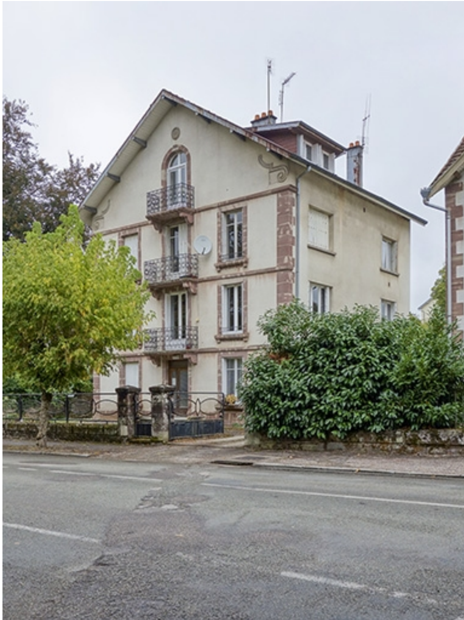
Vue depuis la rue.