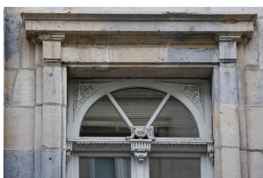
Détail du décor du tympan de la porte-fenêtre donnant sur le balcon. IVR43_20072500232NUCA