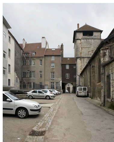
Vue de l'arrière de l'immeuble depuis le fond de l'impasse.