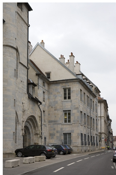
Vue d'ensemble rapprochée depuis la rue Mégevand.