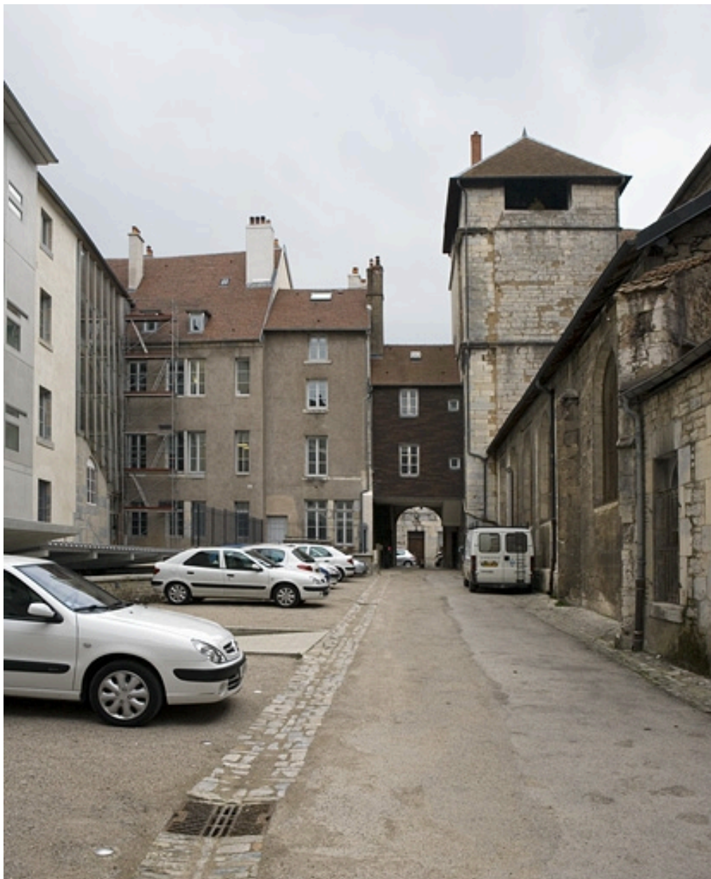
Vue de l'arrière de l'immeuble depuis le fond de l'impasse.