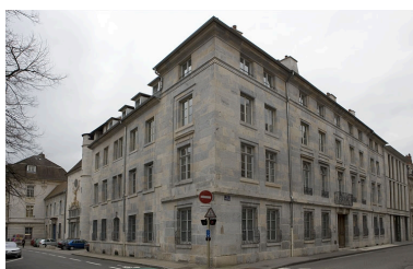
Vue d'angle de l'immeuble.