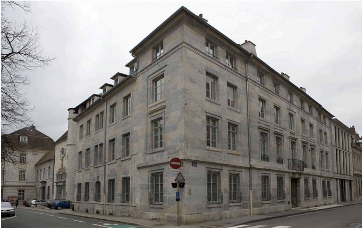
Vue d'angle de l'immeuble.