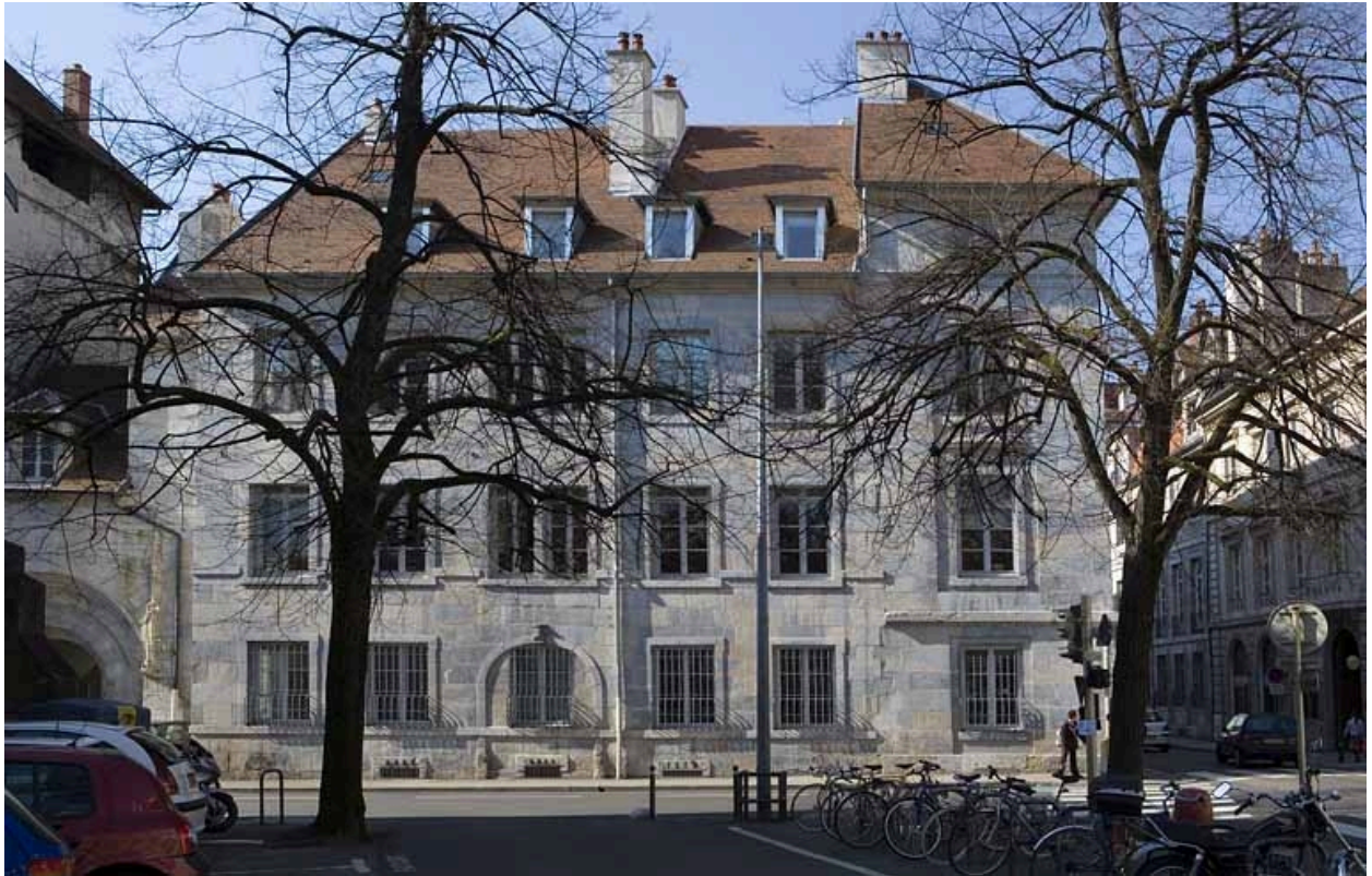
Vue d'ensemble de la façade latérale gauche depuis la promenade Granvelle.