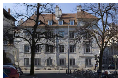
Vue d'ensemble de la façade latérale gauche depuis la promenade Granvelle. IVR43_20072500222NUCA