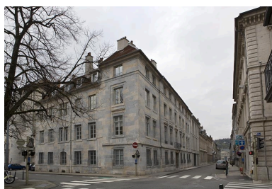
Vue d'angle de l'immeuble avec l'alignement de la rue.