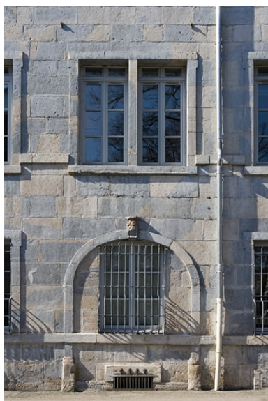
Détail de quelques baies sur la façade latérale gauche.