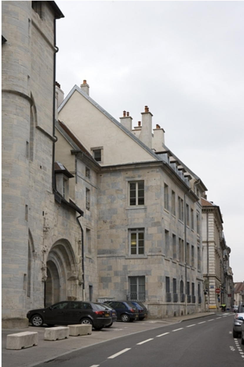
Vue d'ensemble rapprochée depuis la rue Mégevand.