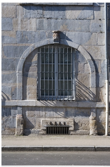
Détail d'une arcade boutiquière murée sur la façade latérale gauche.