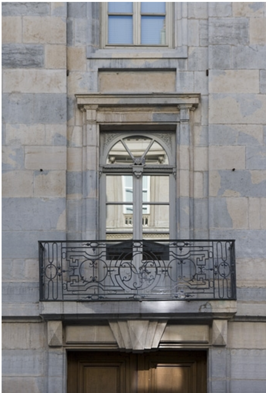
Détail du balcon en ferronnerie sur la façade principale.