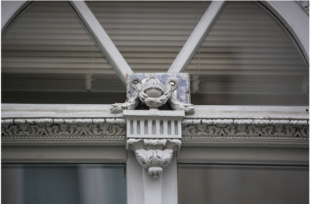
Détail de l'urne décorant la traverse dormante de la porte-fenêtre donnant sur le balcon.