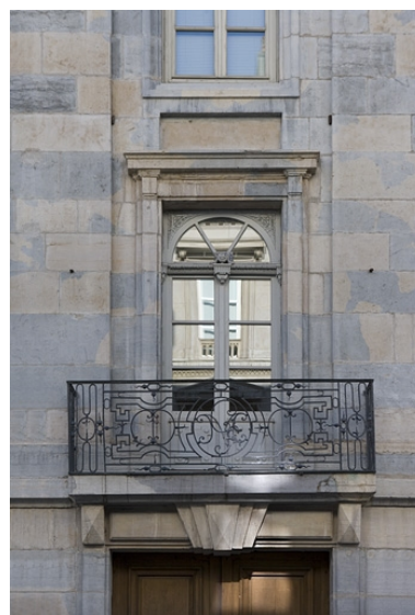
Détail du balcon en ferronnerie sur la façade principale.