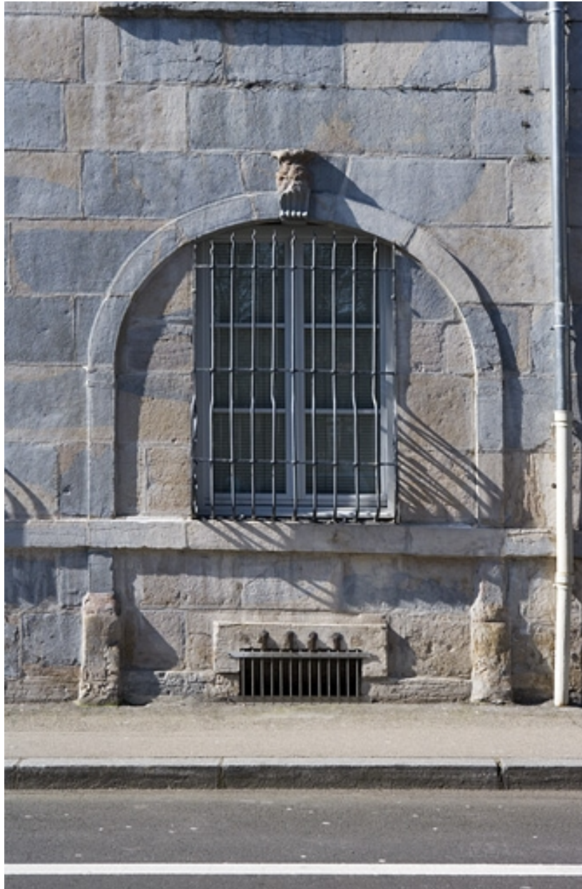
Détail d'une arcade boutique murée sur la façade latérale gauche.