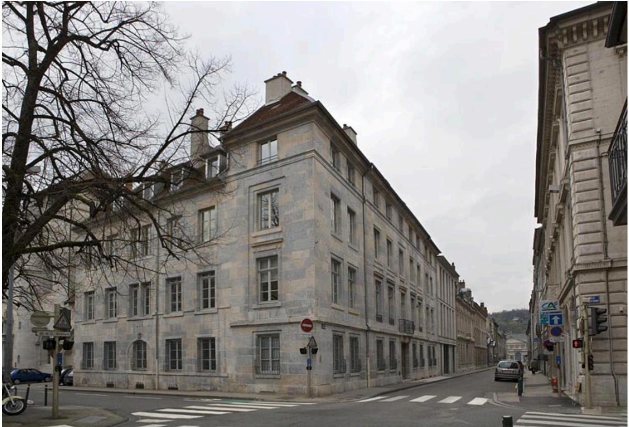
Vue d'angle de l'immeuble avec l'alignement de la rue.