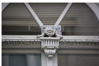
Détail de l'urne décorant la traverse dormante de la porte- fenêtre donnant sur le balcon.