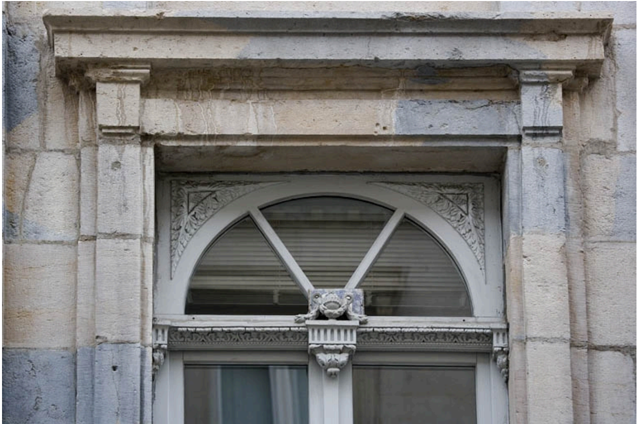
Détail du décor du tympan de la porte-fenêtre donnant sur le balcon.