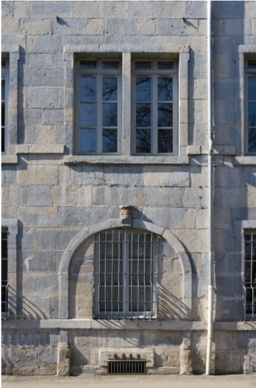
Détail de quelques baies sur la façade latérale gauche.