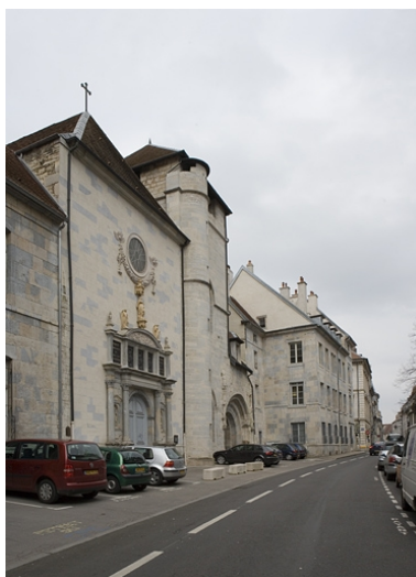
Vue d'ensemble depuis la rue Mégevand avec l'église Notre-Dame.

Dess. André Céréza IVR43_20072500051NUDA