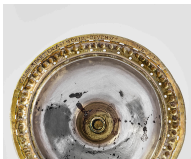
Détail sous le pied : inscription et poinçons.