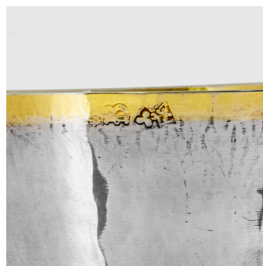
Détail de la coupe : poinçons. IVR26_20248900268NUC2A