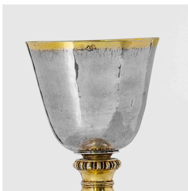
Détail : coupe. IVR26_20248900267NUC4A