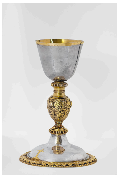
Vue d'ensemble. IVR26_20248900266NUC4A