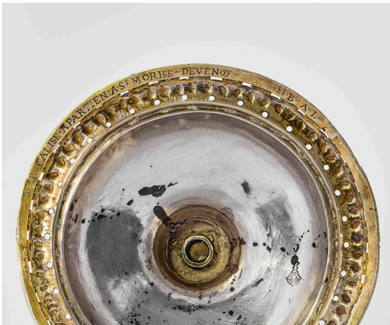
Détail sous le pied : inscription et poinçons.