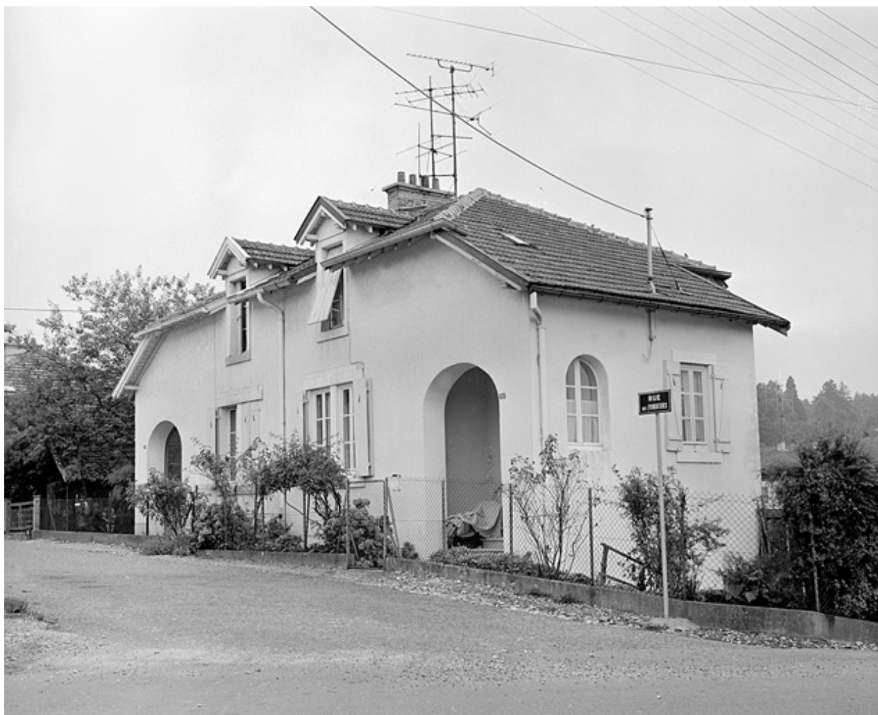
Maison jumelée rue des Fondeurs.SRI. Enquête régionale sur les bâtiments industriels (1979-1981).