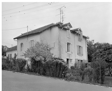
Maison jumelée rue des Fondeurs : façade postérieure.SRI. Enquête régionale sur les bâtiments industriels (1979-1981).