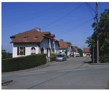
Vue de la rue des Fondeurs depuis l'est.