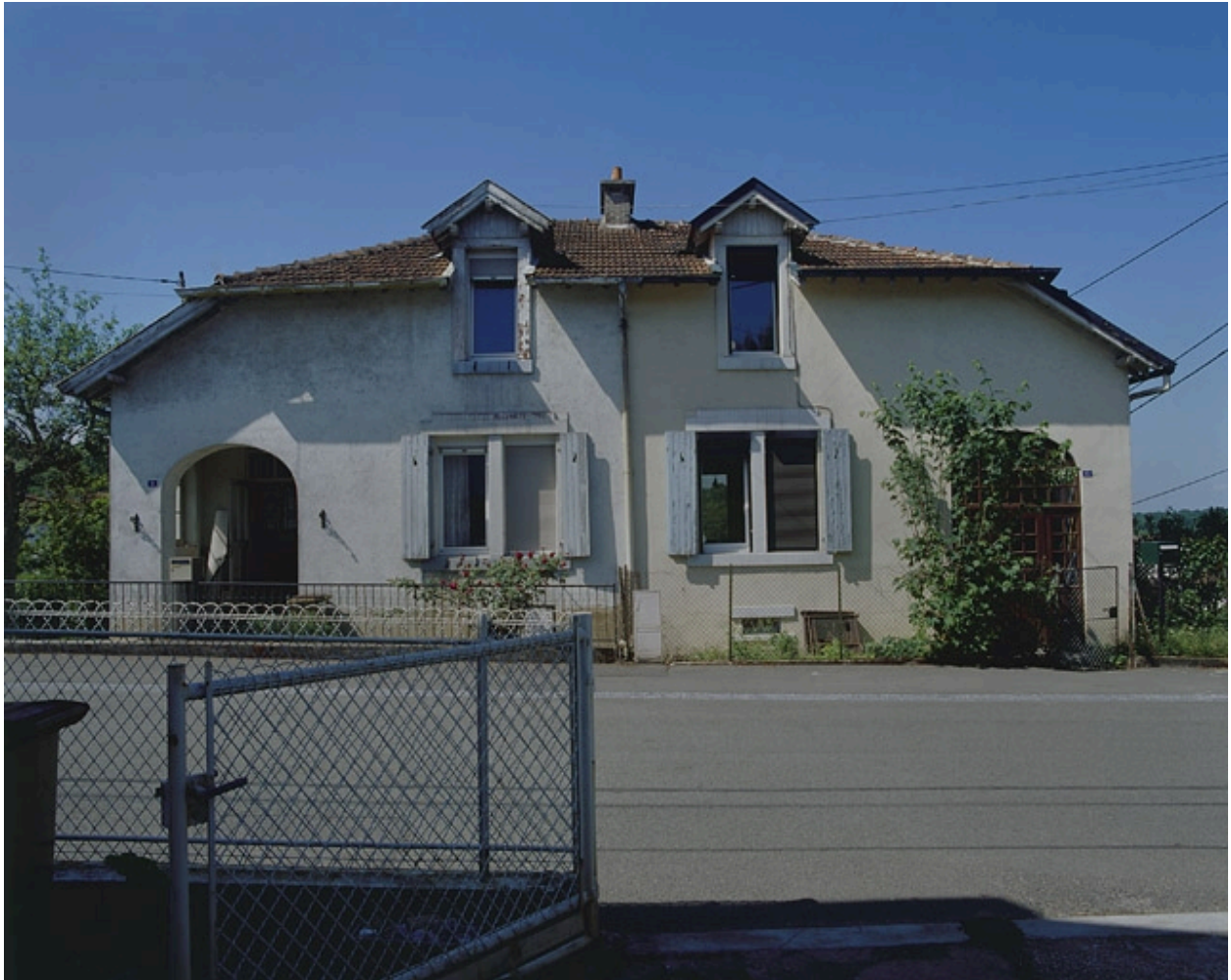
Maison jumelée rue des Fondeurs : vue de face.