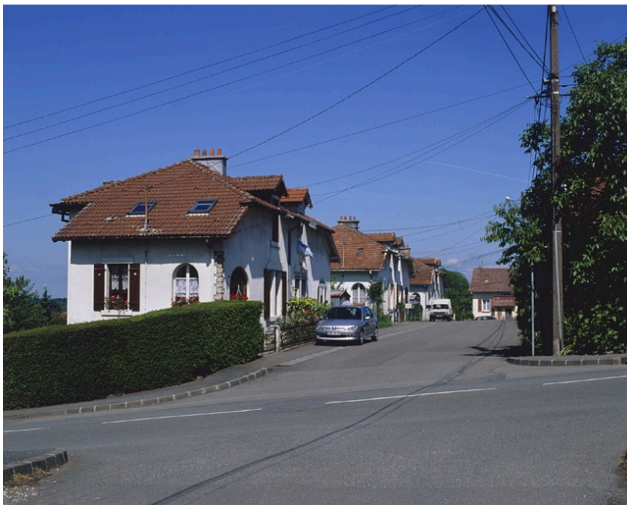
Vue de la rue des Fondeurs depuis l'est.