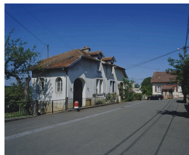
Maison jumelée rue des Fondeurs : vue de trois quarts. IVR43_20029000360XA