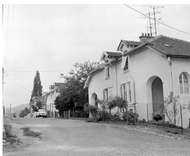
Vue de la rue des Fondeurs.SRI. Enquête régionale sur les bâtiments industriels (1979-1981).