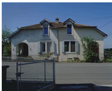
Maison jumelée rue des Fondeurs : vue de face.