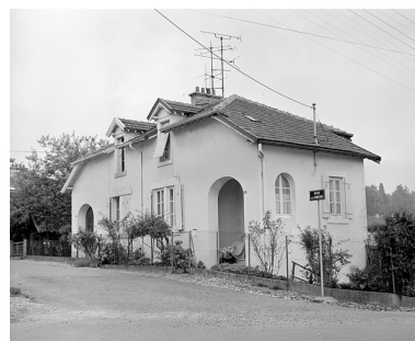
Maison jumelée rue des Fondeurs.SRI. Enquête régionale sur les bâtiments industriels (1979-1981). IVR43_19819000091X