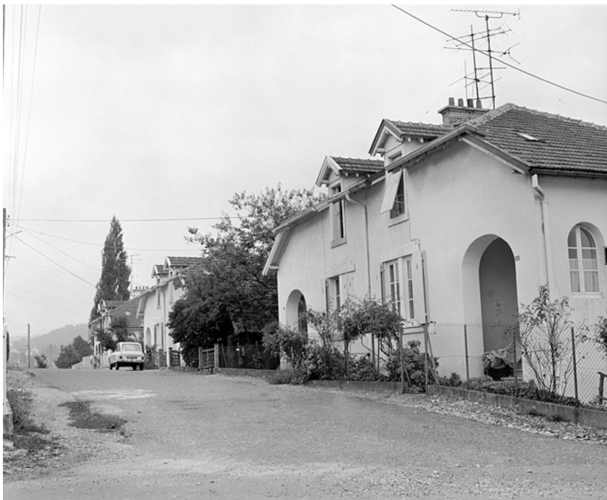
Vue de la rue des Fondeurs.SRI. Enquête régionale sur les bâtiments industriels (1979-1981).