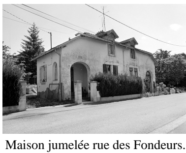
Maison jumelée rue des Fondeurs. IVR43_20029000358X