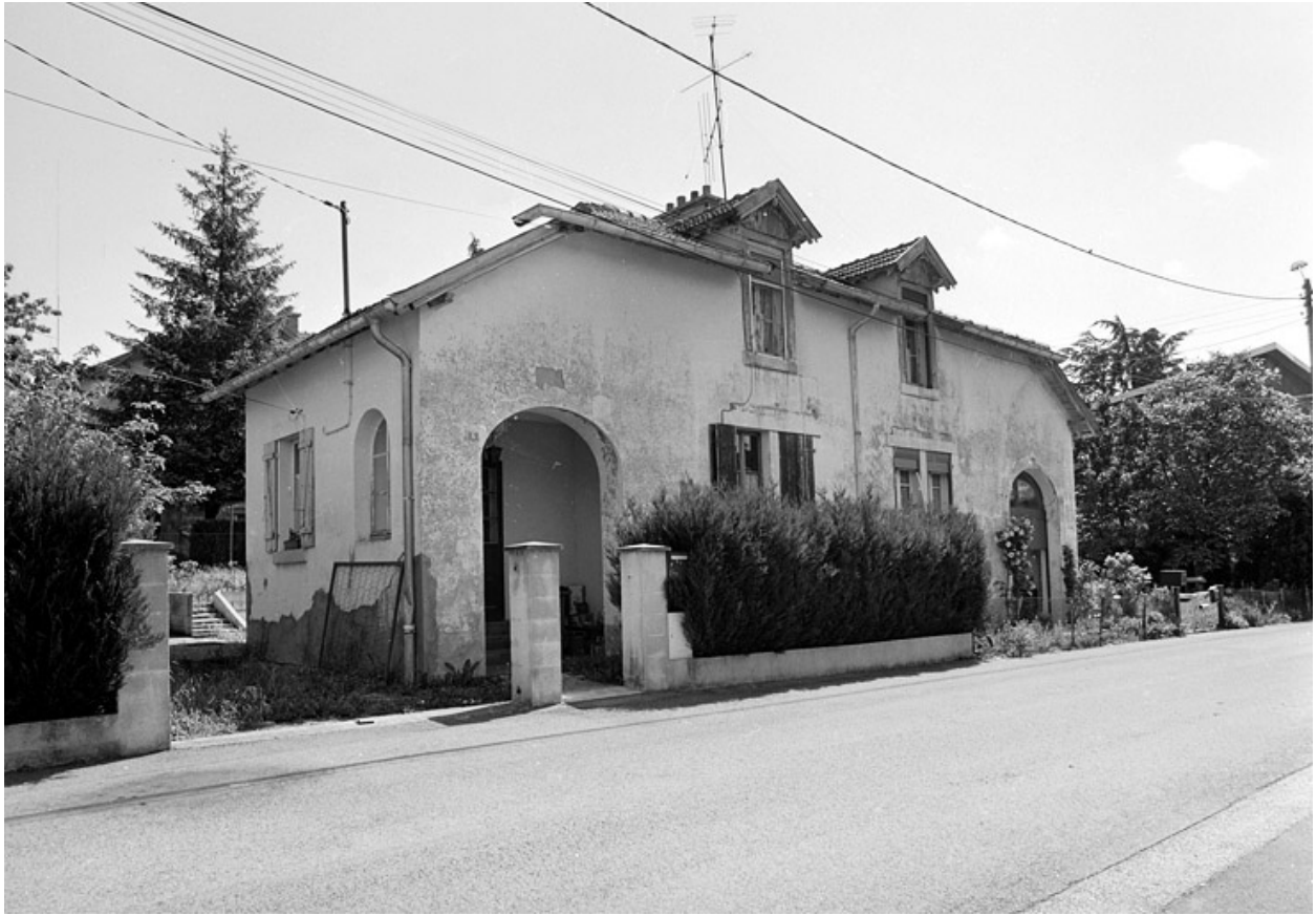
Maison jumelée rue des Fondeurs.