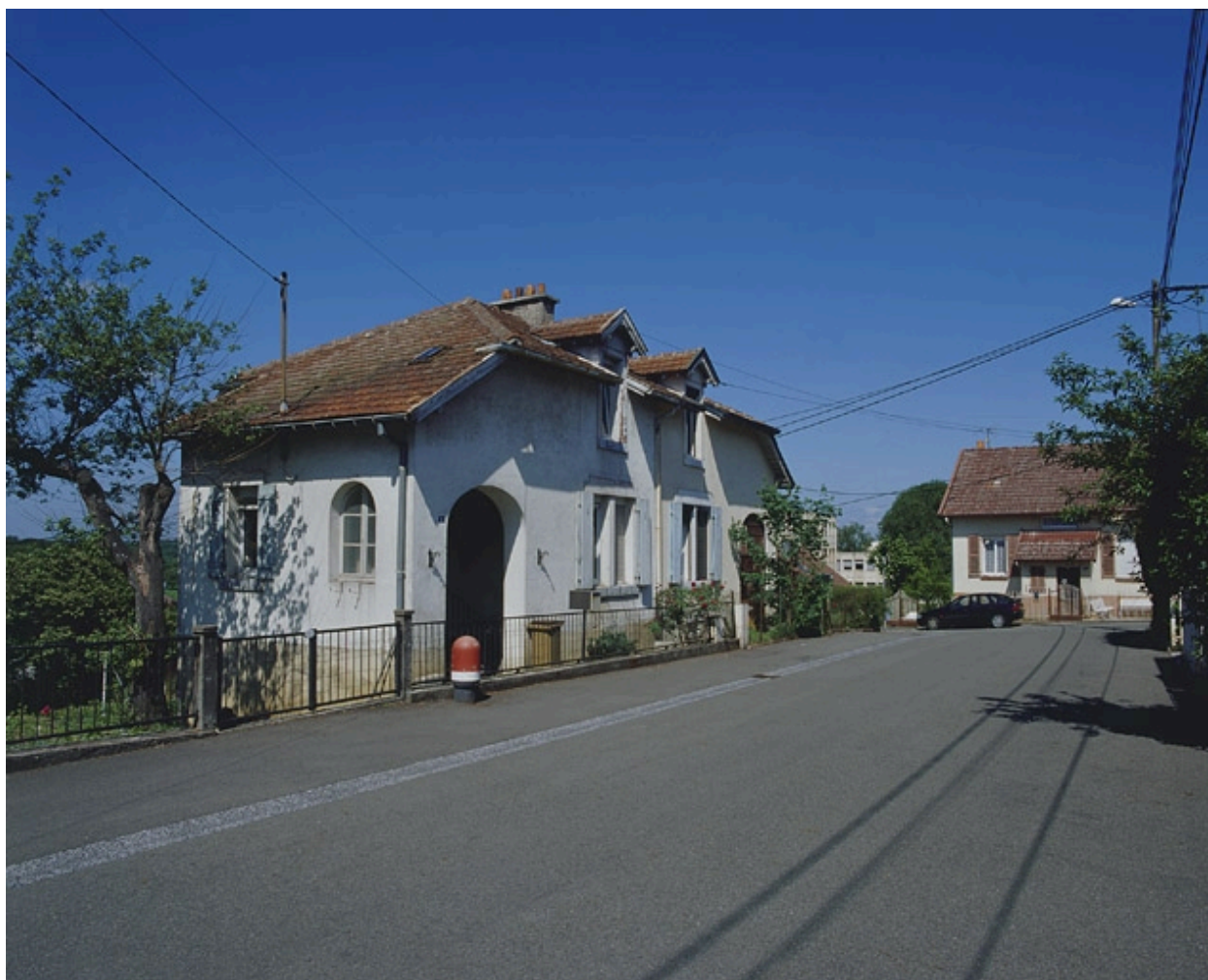
Maison jumelée rue des Fondateurs : vue de trois quarts.