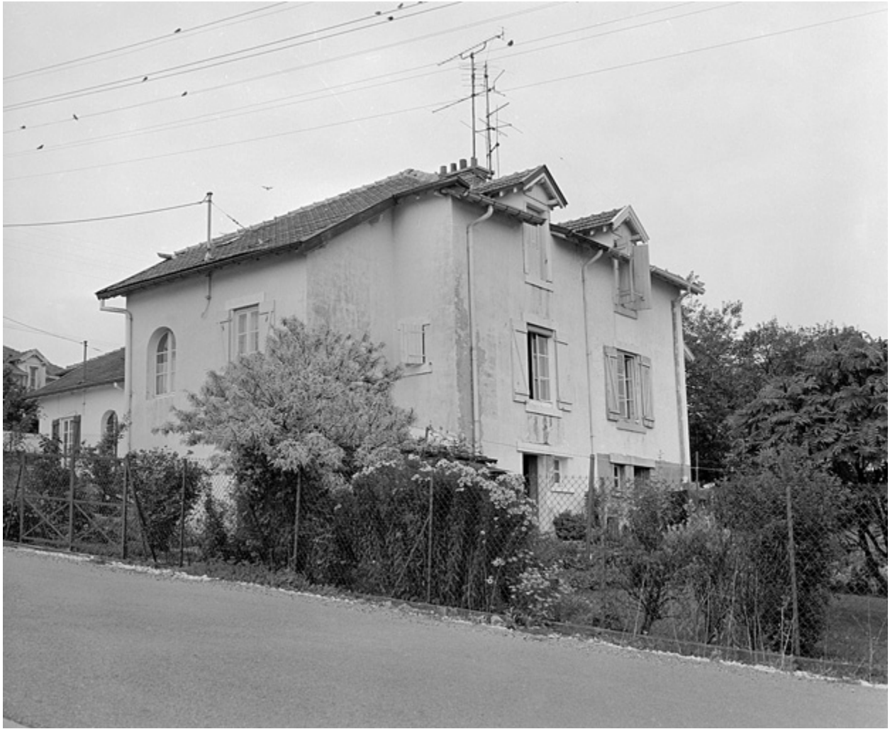
Maison jumelée rue des Fondeurs : façade postérieure.SRI. Enquête régionale sur les bâtiments industriels (1979-1981).