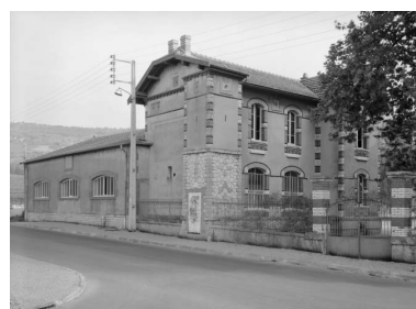
Bâtiment du forage et grille de clôture, vue depuis l'avenue des Sources, état en 1979.