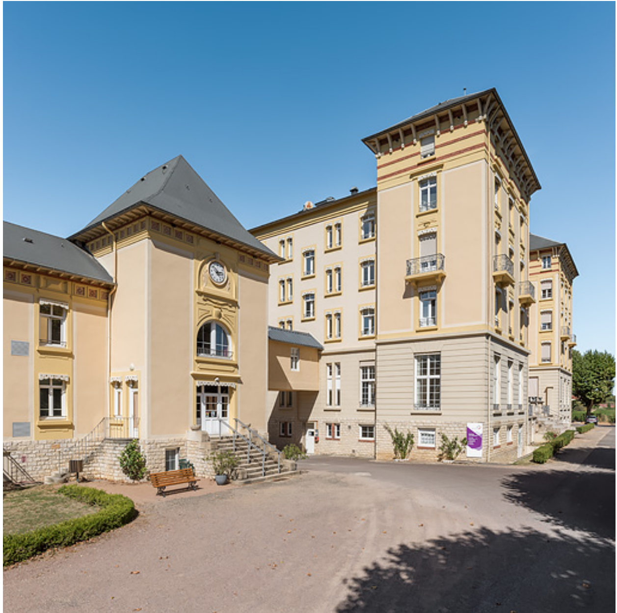
Situation du bâtiment des bains par rapport à l'hôtel, vue depuis le sud.