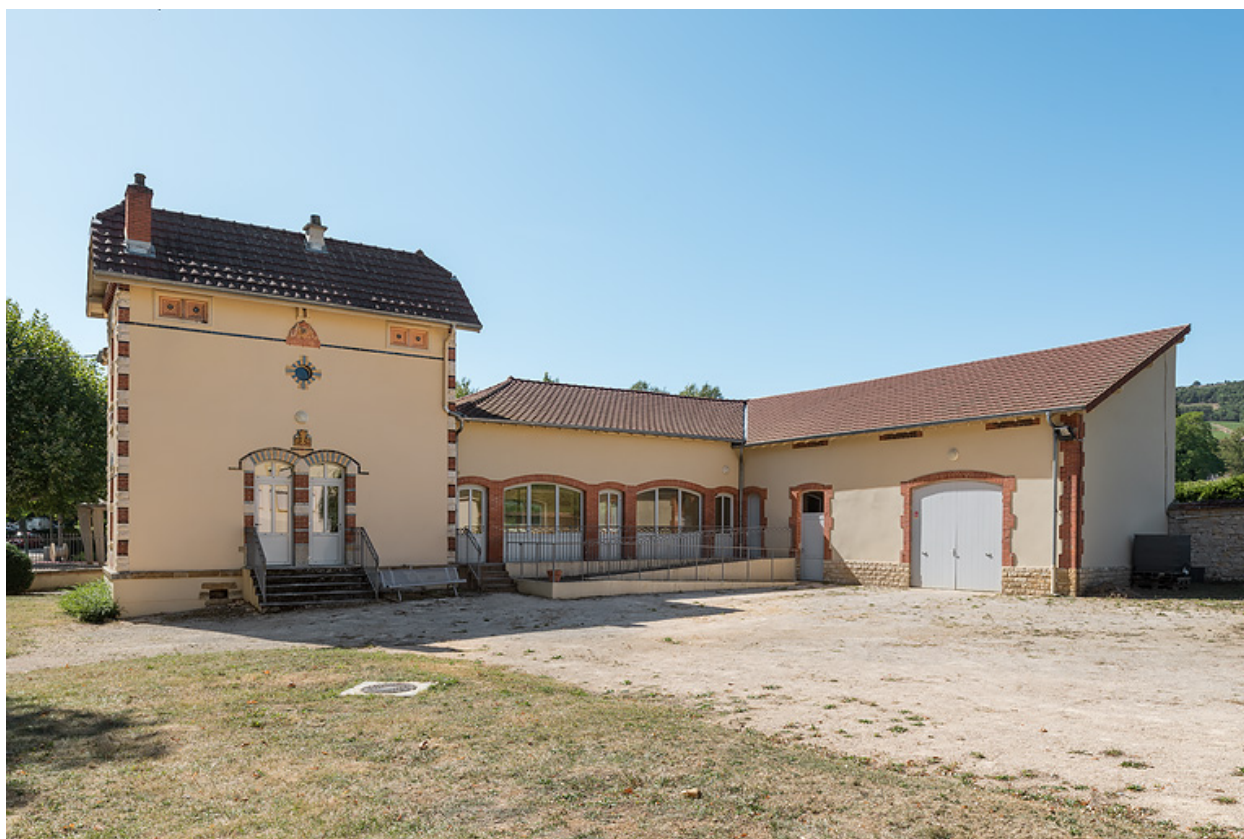
Bâtiment du forage (à gauche) avec hangar et usine d'embouteillage (à droite).