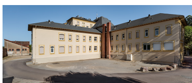
Bâtiment des bains, élévation postérieure, vue depuis l'ouest. IVR26_20192100317NUC4AQ