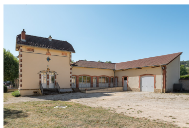
Bâtiment du forage (à gauche) avec hangar et usine d'embouteillage (à droite).