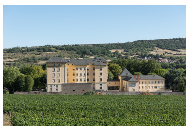
Situation du bâtiment des bains par rapport à l'hôtel, vue depuis le nord.