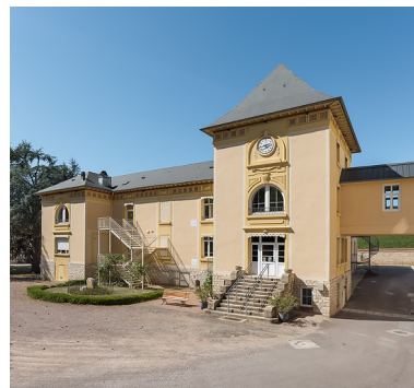
Bâtiment des bains, façade principale vue depuis le sud-est, et passerelle vers l'hôtel (à droite). IVR26_20192100306NUC4AQ