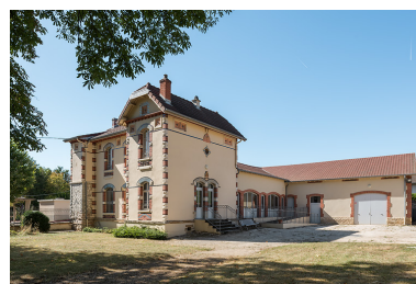
Bâtiment du forage (à gauche) avec hangar et usine d'embouteillage (à droite).