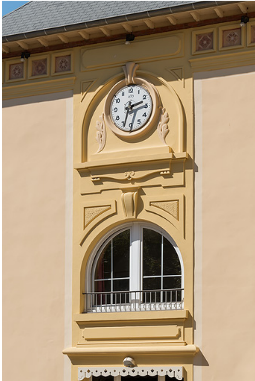
Bâtiment des bains, façade principale vue depuis le sud-est, baie et cadran du pavillon de droite.