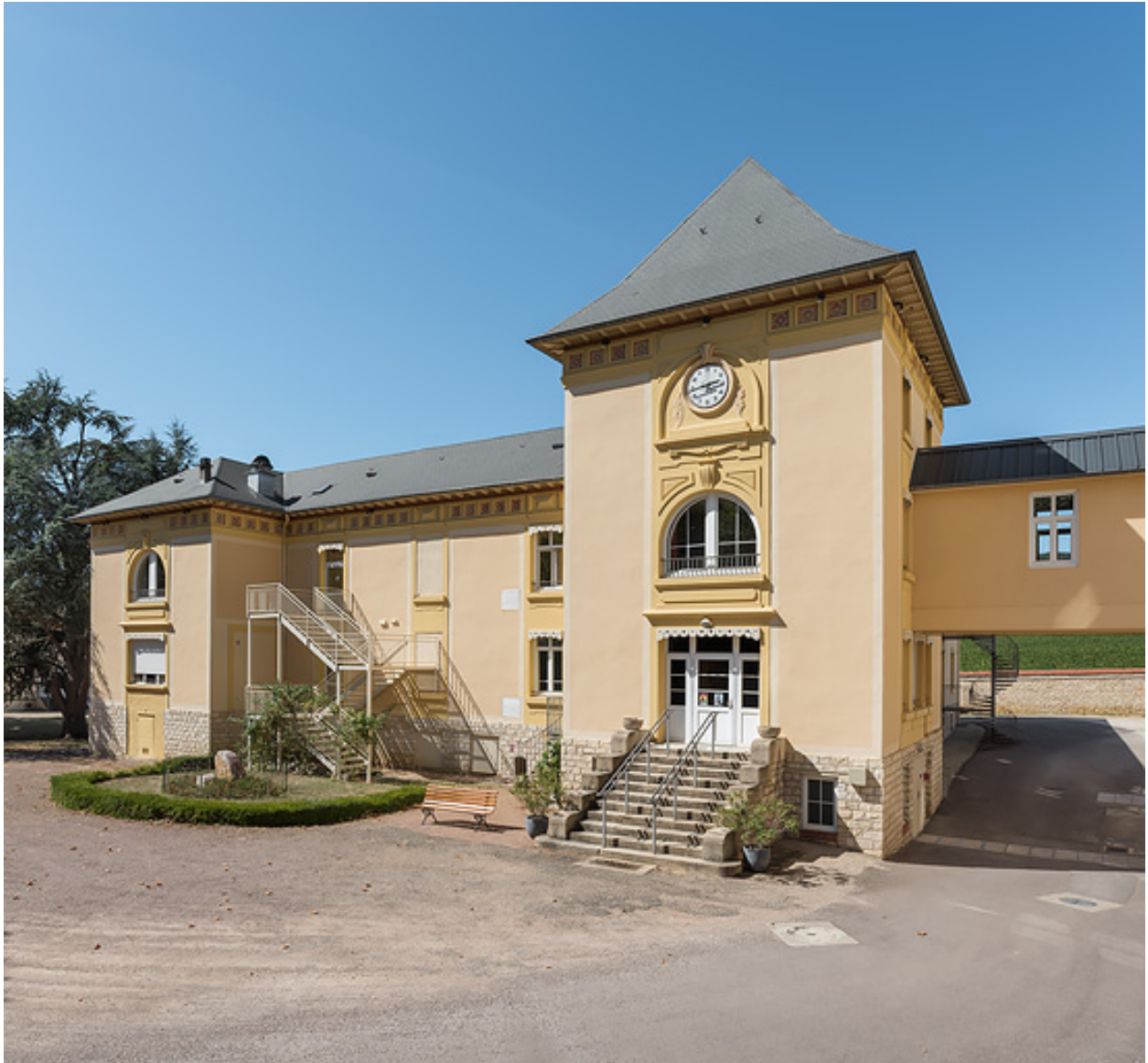
Bâtiment des bains, façade principale vue depuis le sud-est, et passerelle vers l'hôtel (à droite).