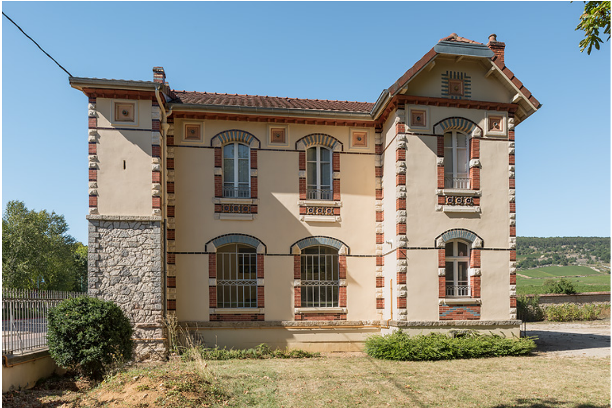
Bâtiment du forage avec logement du gardien à l'étage, façade principale.