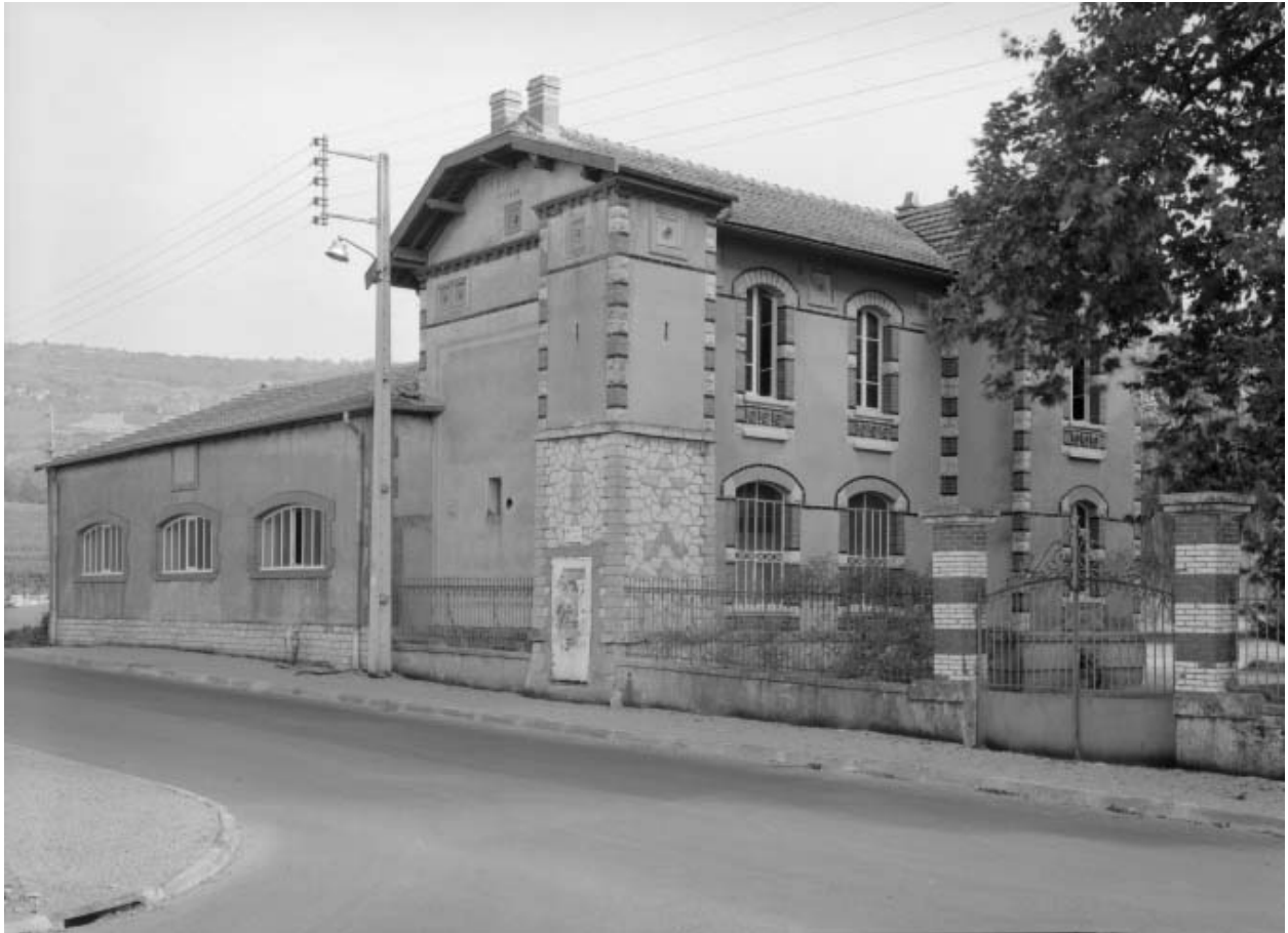
Bâtiment du forage et grille de clôture, vue depuis l'avenue des Sources, état en 1979.