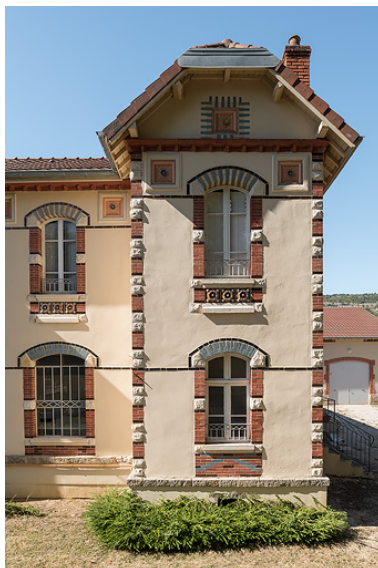
Bâtiment du forage avec logement du gardien à l'étage, façade principale, détail. IVR26_20192100314NUC4A