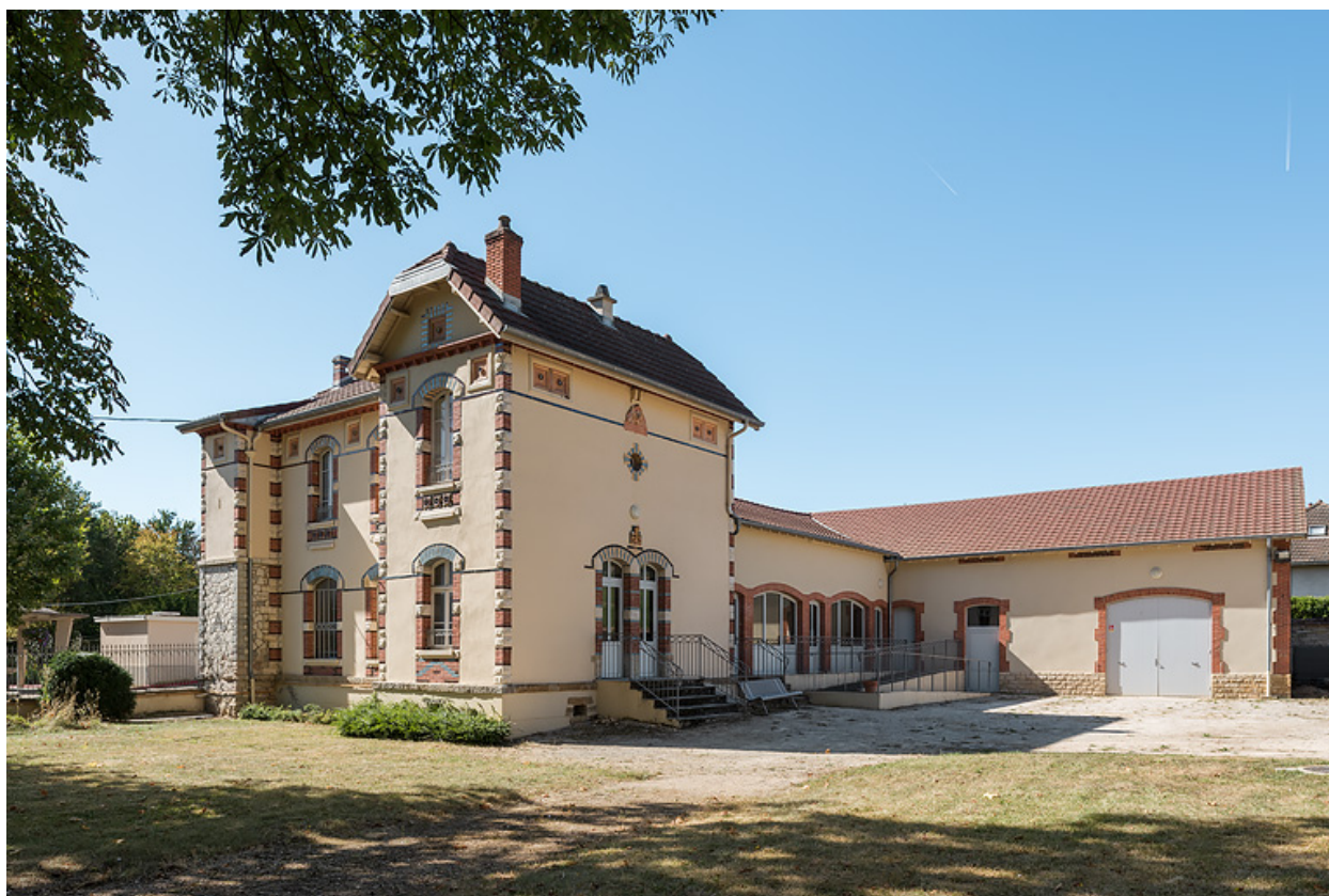
Bâtiment du forage (à gauche) avec hangar et usine d'embouteillage (à droite).