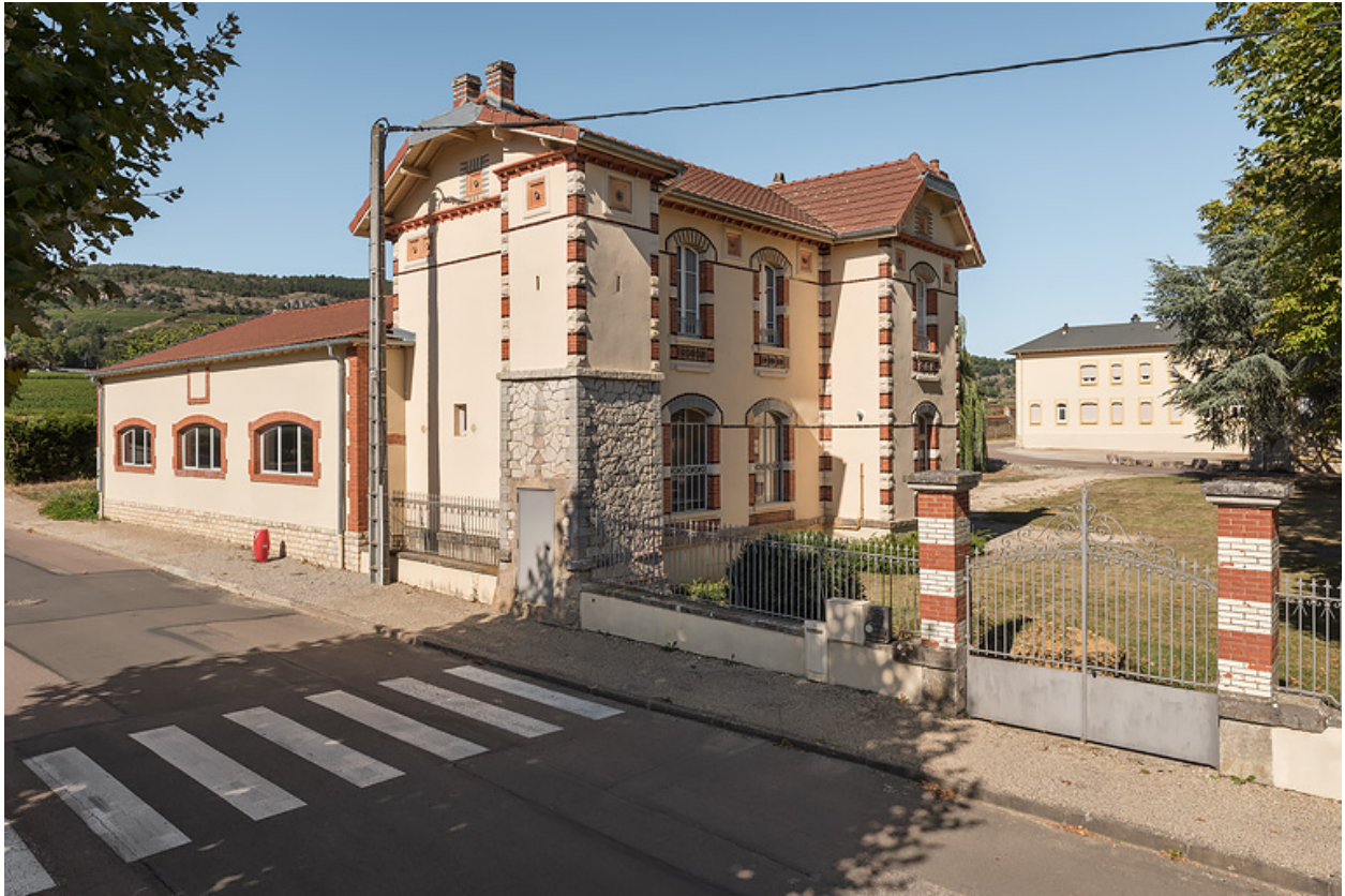
Bâtiment du forage et grille de clôture, vue depuis l'avenue des Sources, état actuel.