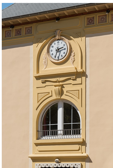
Bâtiment des bains, façade principale vue depuis le sud-est, baie et cadran du pavillon de droite.