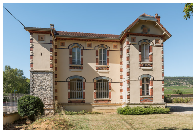
Bâtiment du forage avec logement du gardien à l'étage, façade principale. IVR26_20192100313NUC4A