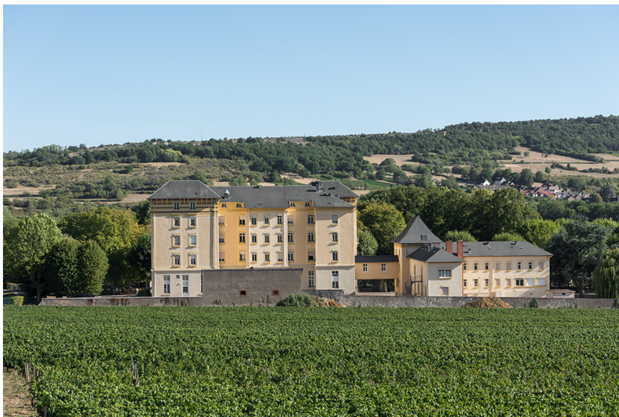
Situation du bâtiment des bains par rapport à l'hôtel, vue depuis le nord.