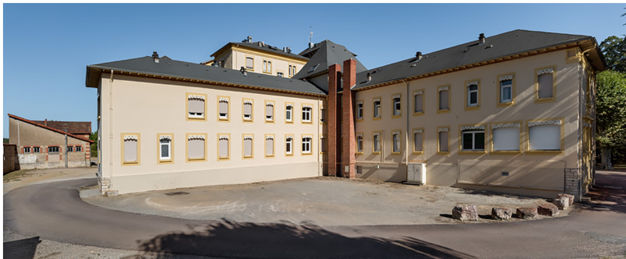
Bâtiment des bains, élévation postérieure, vue depuis l'ouest.