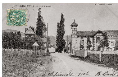
Vue depuis l'avenue des Sources (établissement à droite). IVR26_20192100321NUC4A