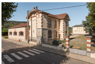
Bâtiment du forage et grille de clôture, vue depuis l'avenue des Sources, état actuel.