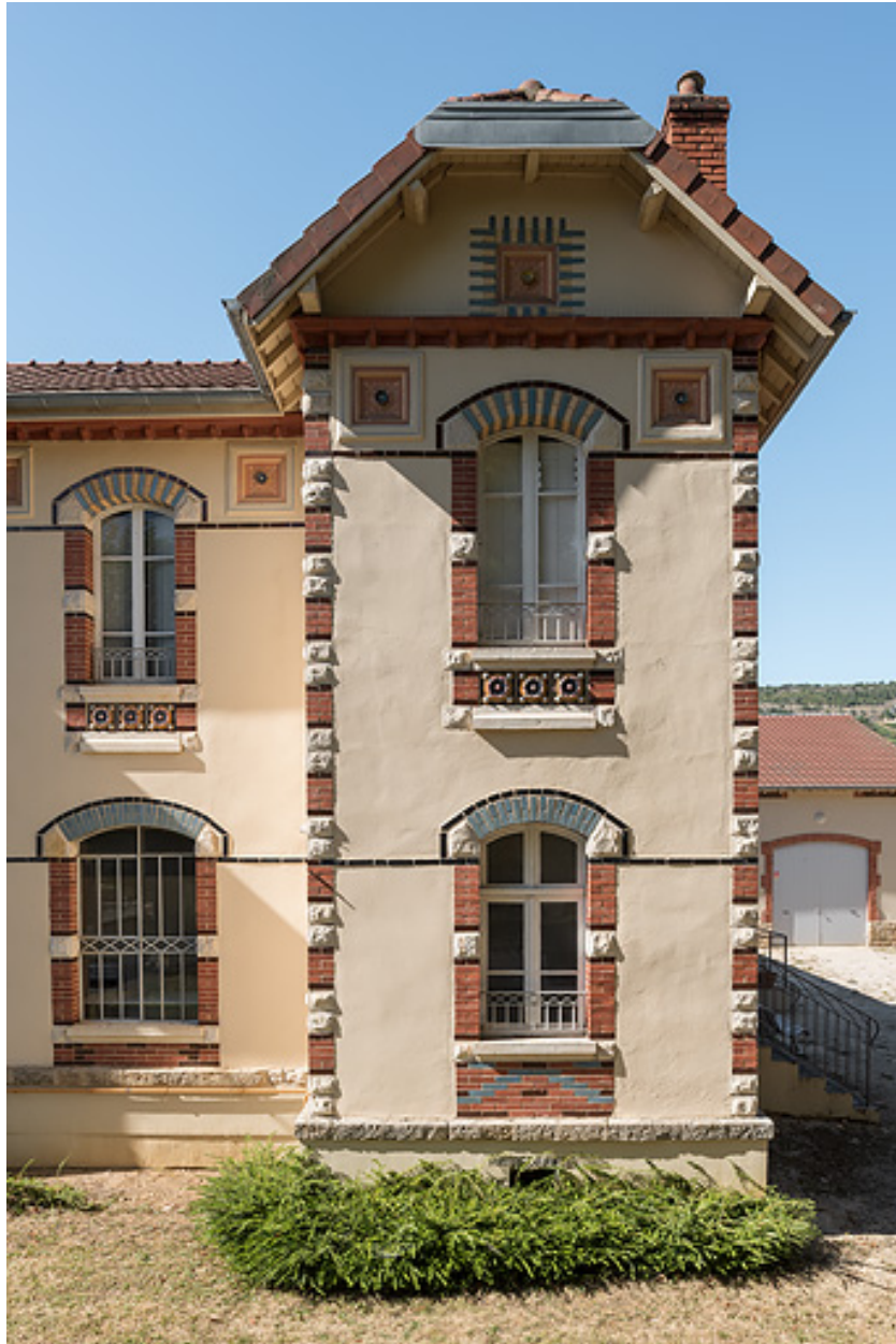
Bâtiment du forage avec logement du gardien à l'étage, façade principale, détail.