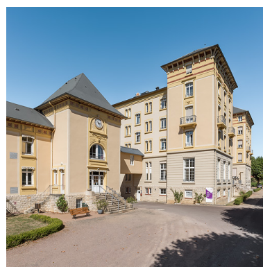
Situation du bâtiment des bains par rapport à l'hôtel, vue depuis le sud.