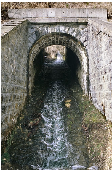
Pont : vue d'ensemble, depuis le sud (aval). IVR43_20053900395ZA