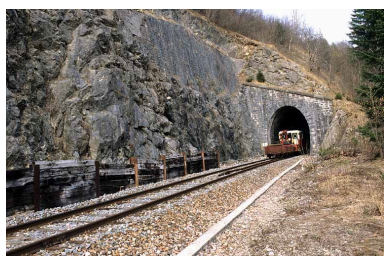
Tunnel : tête sud-ouest (côté La Cluse), avec draisine.