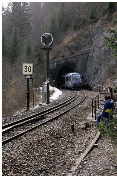
Vue d'ensemble, depuis le nord-est (côté Andelot-en-Montagne), avec autorail X 73500.