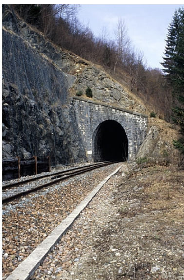
Tunnel : tête sud-ouest (côté La Cluse). IVR43_20053900387ZA