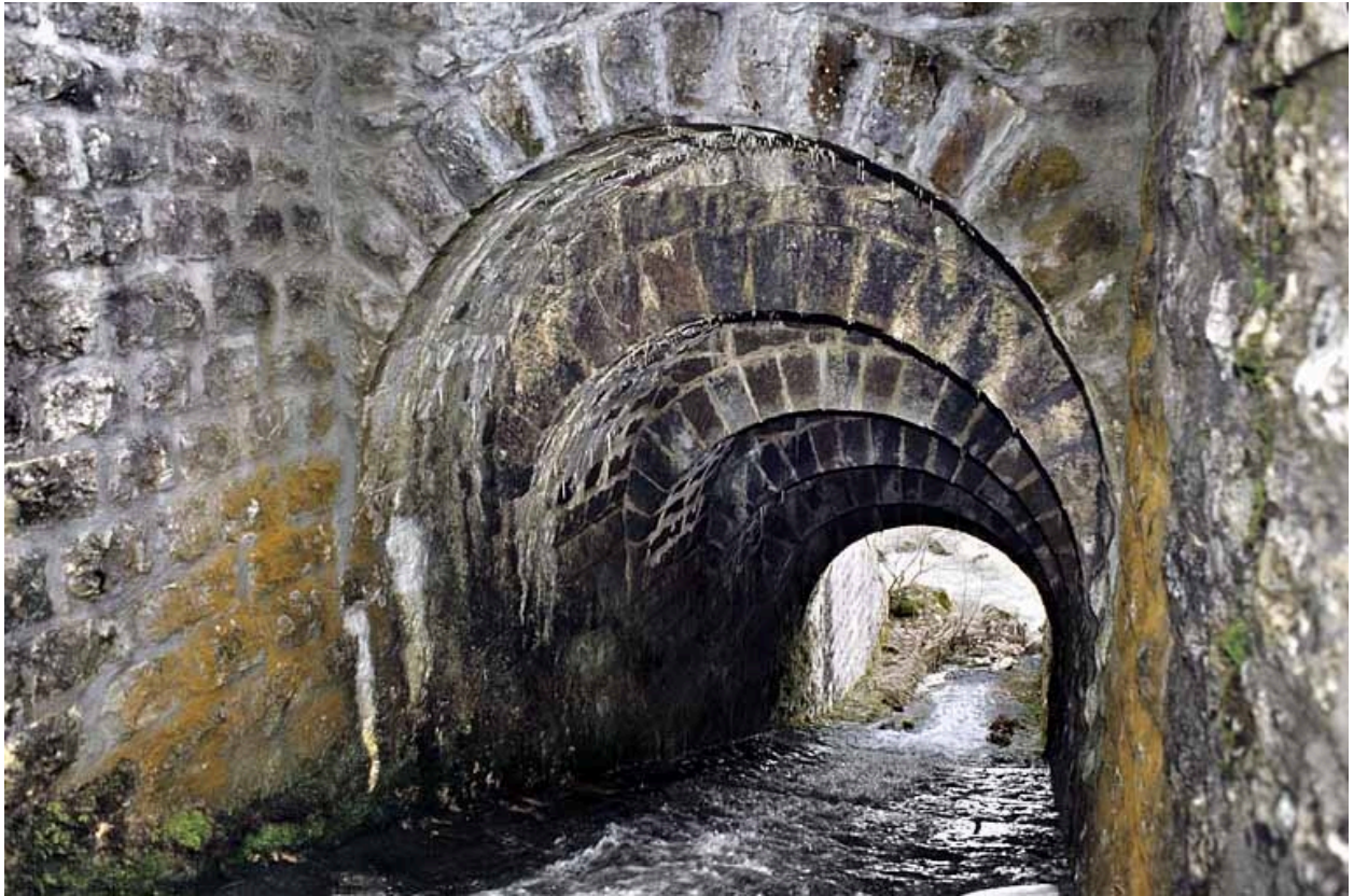
Pont : voûte appareillée en rouleaux à ressauts, depuis le nord (amont).