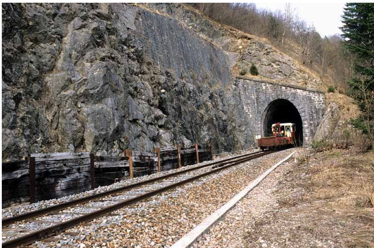
Tunnel : tête sud-ouest (côté La Cluse), avec draine.