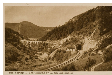
Morez - Les Viaducs et la Grande Roche, milieu 20e siècle.