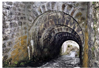
Pont : voûte appareillée en rouleaux à ressauts, depuis le nord (amont).