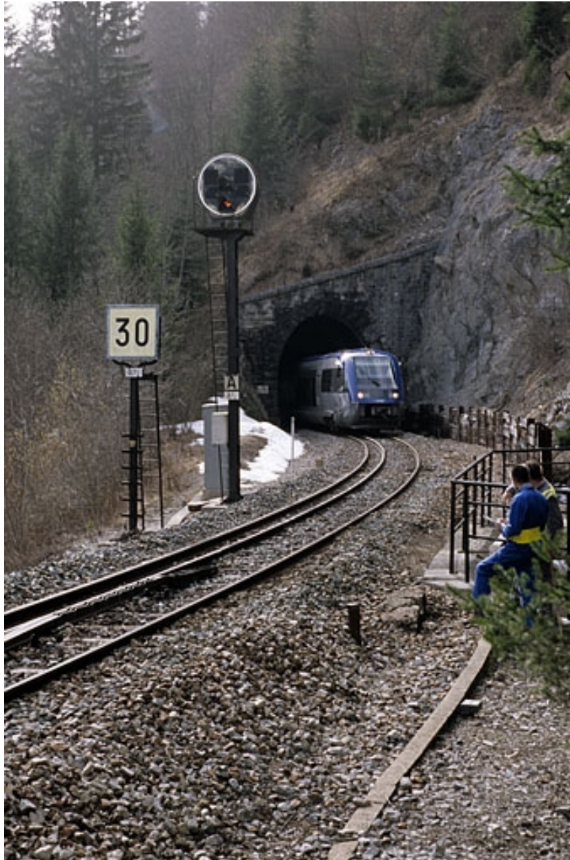
Vue d'ensemble, depuis le nord-est (côté Andelot-en-Montagne), avec autorail X 73500.