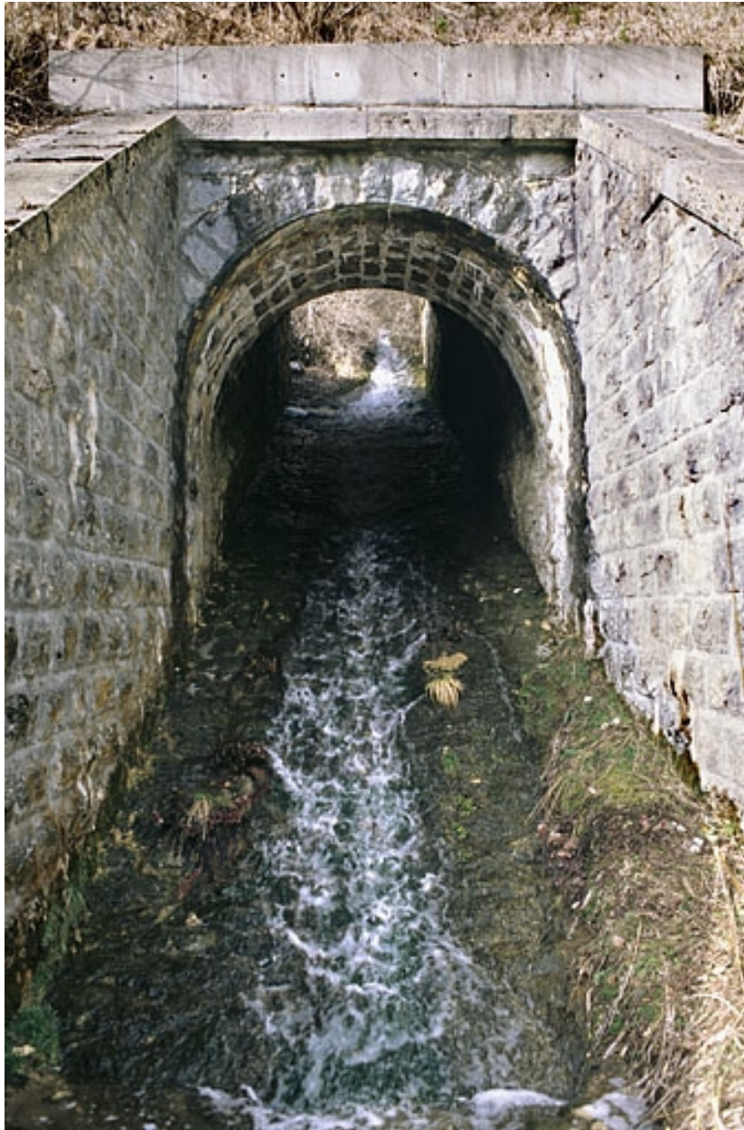
Pont : vue d'ensemble, depuis le sud (aval).