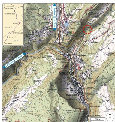
Carte et schéma de localisation. Carte topographique, IGN, 2000, dalles F087_050 et F088_050, échelle 1:25 000. Scan 25, licence n° 2008/CISE/2968. IVR43_20073900454NUDA