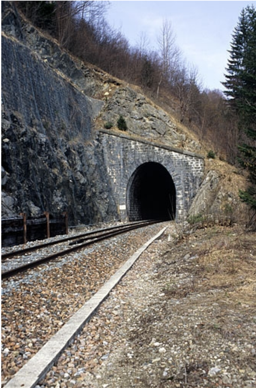
Tunnel : tête sud-ouest (côté La Cluse).