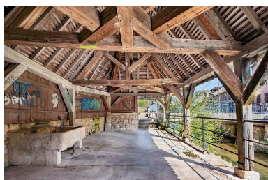
Vue de la charpente, depuis le sud.