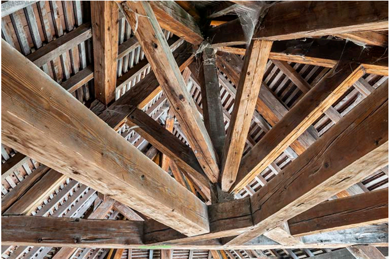
Charpente. Détail de l'enrayure sud.