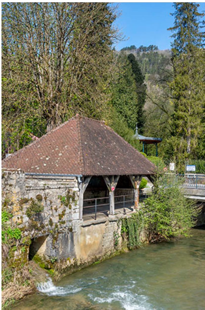
Vue depuis le sud-est.