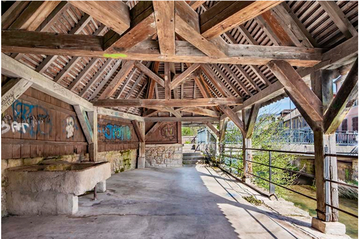
Vue de la charpente, depuis le sud.