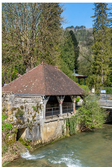
Vue depuis le sud-est. IVR43_20233900234NUC4A