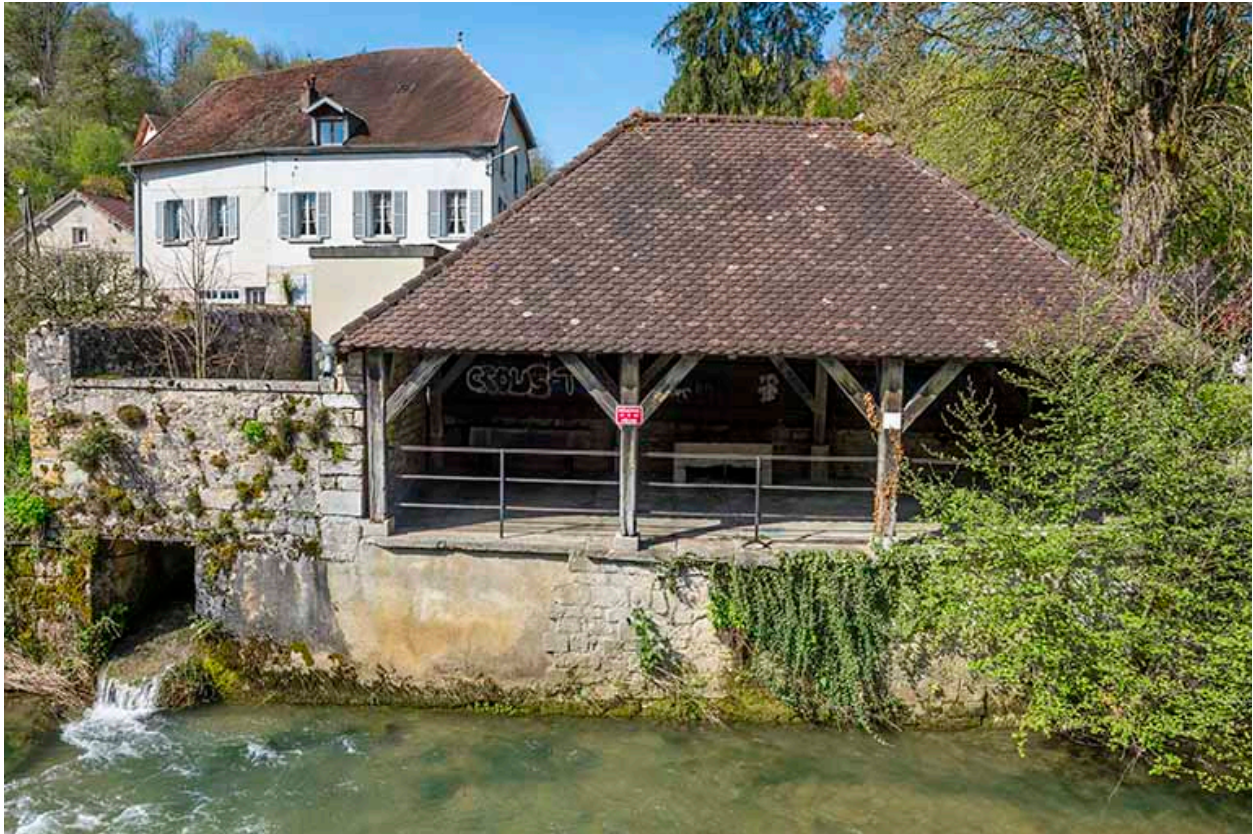
Vue depuis la rive droite de la Furieuse.