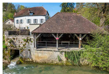
Vue depuis la rive droite de la Furieuse.