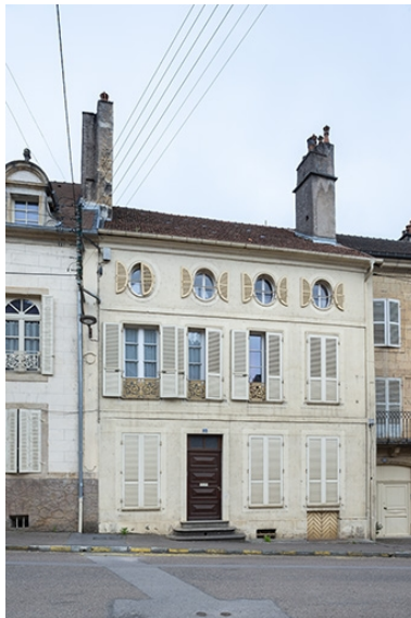
Façade antérieure. IVR43_20217000226NUC4A