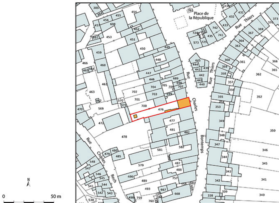
Plan-masse et de situation. Extrait du plan cadastral numérisé de la direction générale des finances publiques, 2025, 1/1 000.