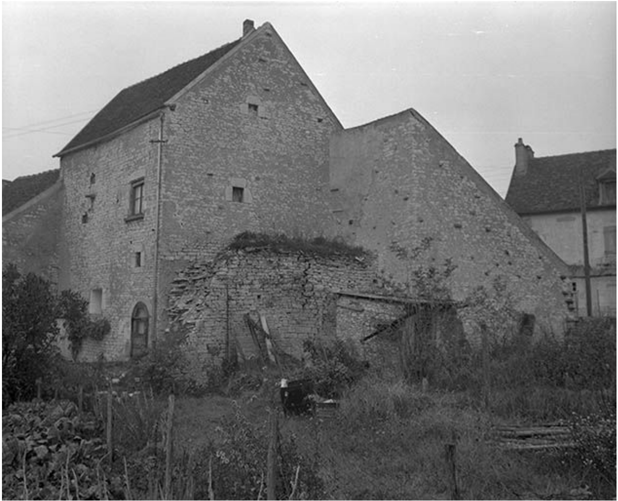
Vestiges de remparts sis parcelle AB 233, du cadastre de 1964 (C.V. 7).