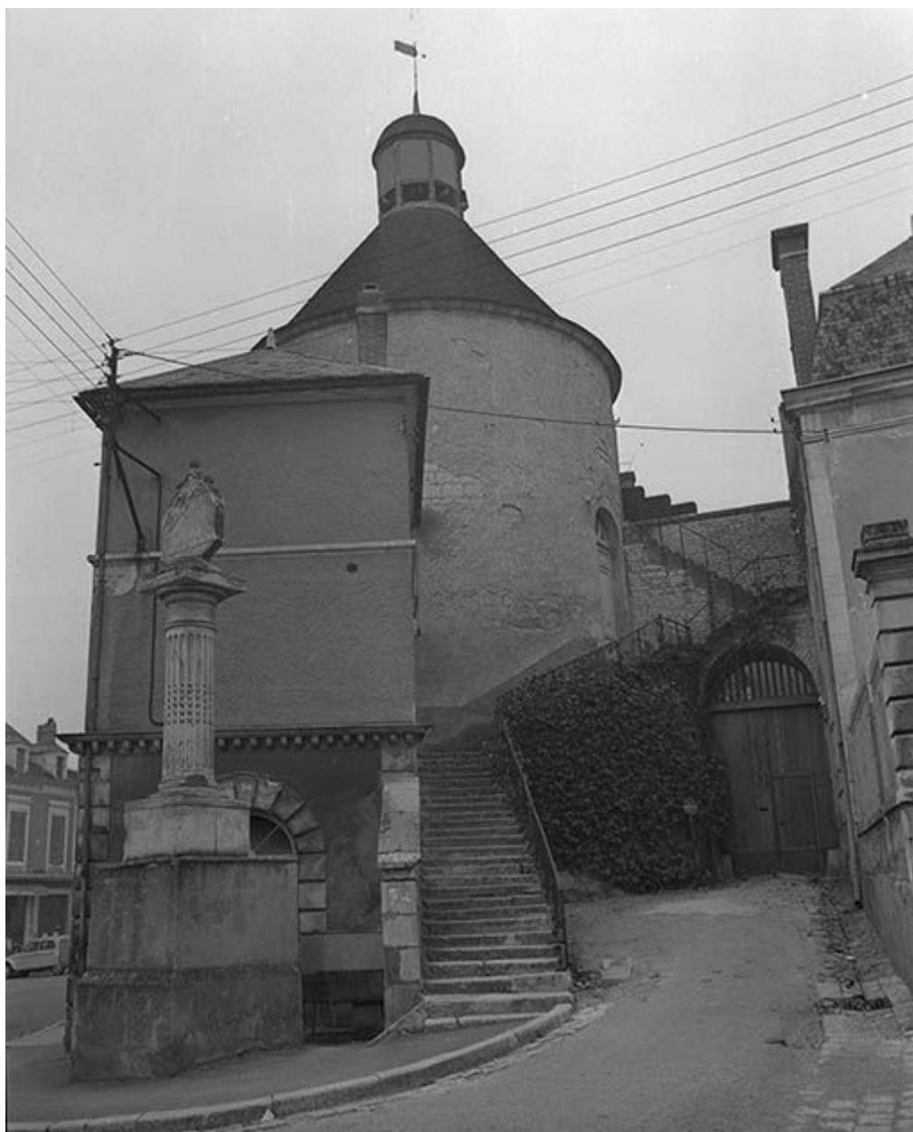
Tour du Méridien, sise parcelle AB 541, du cadastre de 1964 : tour et escalier.