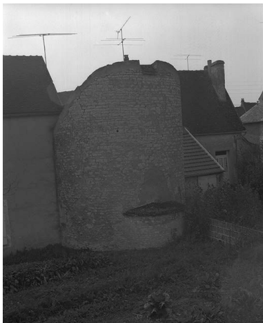
Tour sise parcelle AB 69, du cadastre de 1964 (C.V. 7) : vue d'ensemble. IVR26_19728900900X