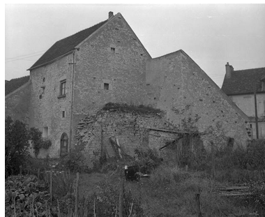
Vestiges de remparts sis parcelle AB 233, du cadastre de 1964 (C.V. 7). IVR26_19728900869X