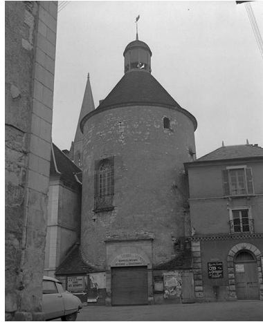
Tour du Méridien, sise parcelle AB 541, du cadastre de 1964 : face. IVR26_19728900849X