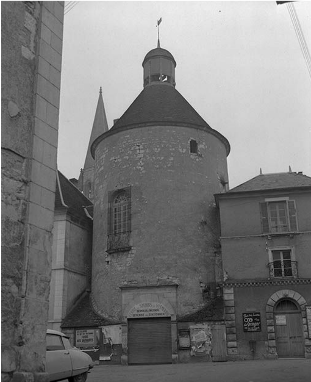
Tour du Méridien, sise parcelle AB 541, du cadastre de 1964 : face.