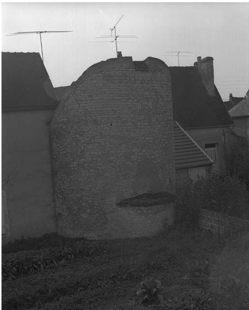
Tour sise parcelle AB 69, du cadastre de 1964 (C.V. 7) : vue d'ensemble.