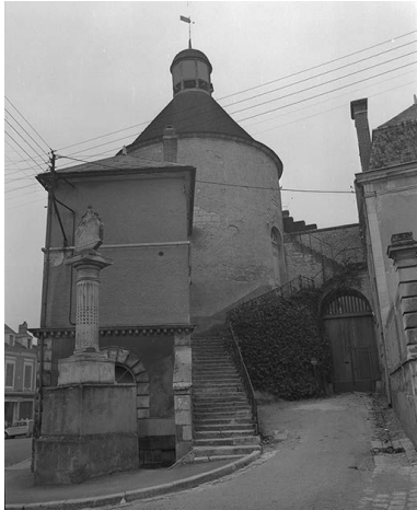
Tour du Méridien, sise parcelle AB 541, du cadastre de 1964 : tour et escalier. IVR26_19728900851X