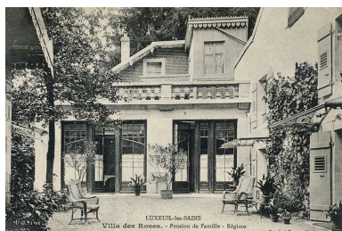
Un exemple d'hébergement modeste : la Villa des Roses.