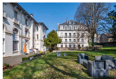
Hôtel Métropole (à gauche) et Hôtel des Thermes (à droite).