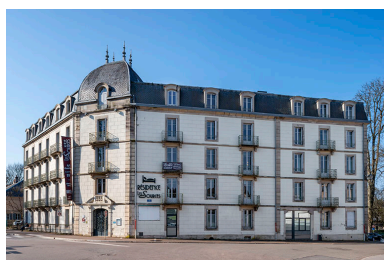
Hôtel des Sources. IVR43_20227000057NUC4A