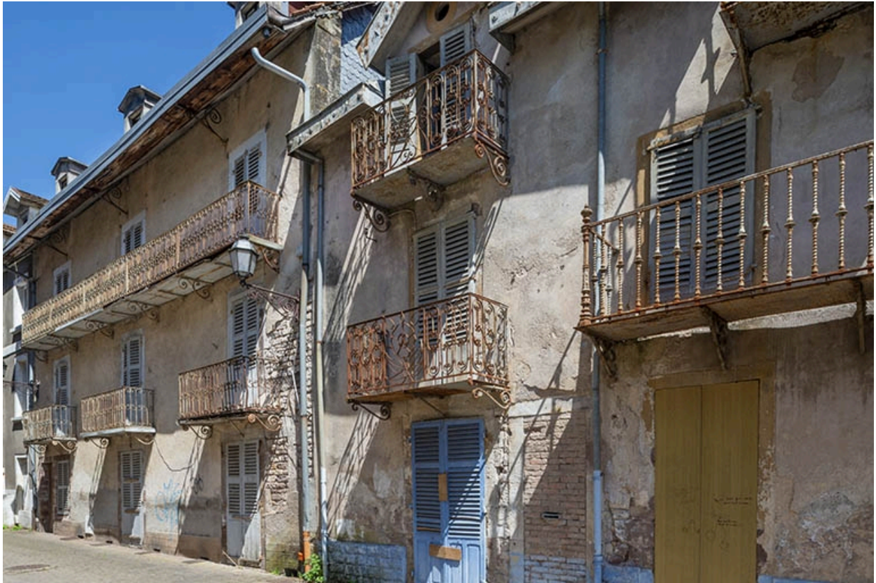
Balcons de la rue de la Fosse Pageot (actuelle allée des Romains).