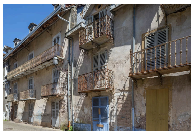
Balcons de la rue de la Fosse Pageot (actuelle allée des Romains). IVR43_20207000558NUC4A