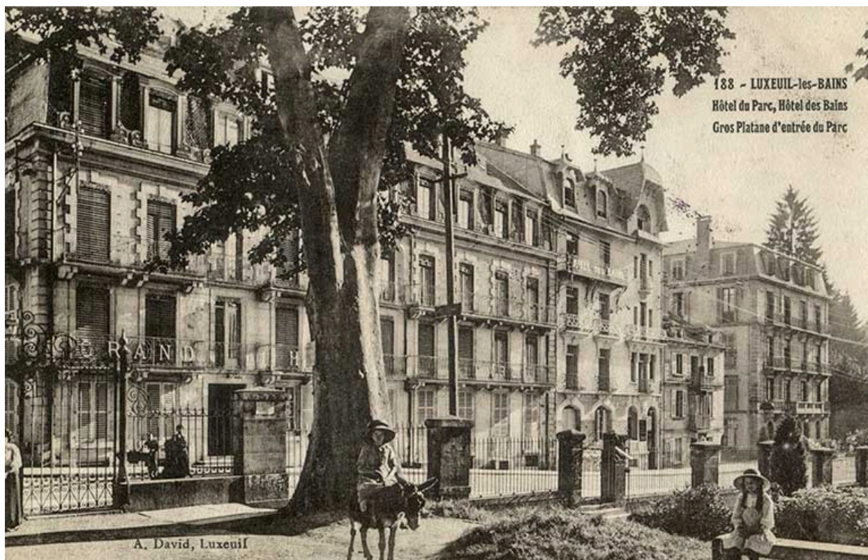
Rue des Thermes, façades de l'Hôtel du Parc et de l'Hôtel des Bains.