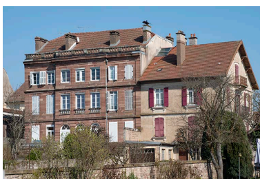
Maison Ganeval puis hôtel de La Terrasse (à gauche) et Villa Élisabeth (à droite).