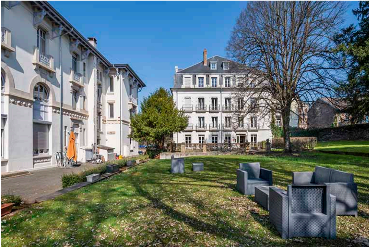
Hôtel Métropole (à gauche) et Hôtel des Thermes (à droite).