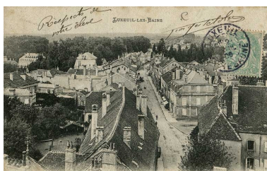
Rue Carnot, vue en direction du nord. IVR43_20217000093NUC4A