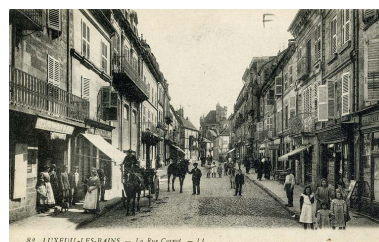
Rue Carnot, vue en direction du sud.