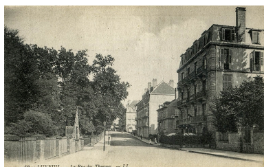
Rue des Thermes, vue en direction de l'est.