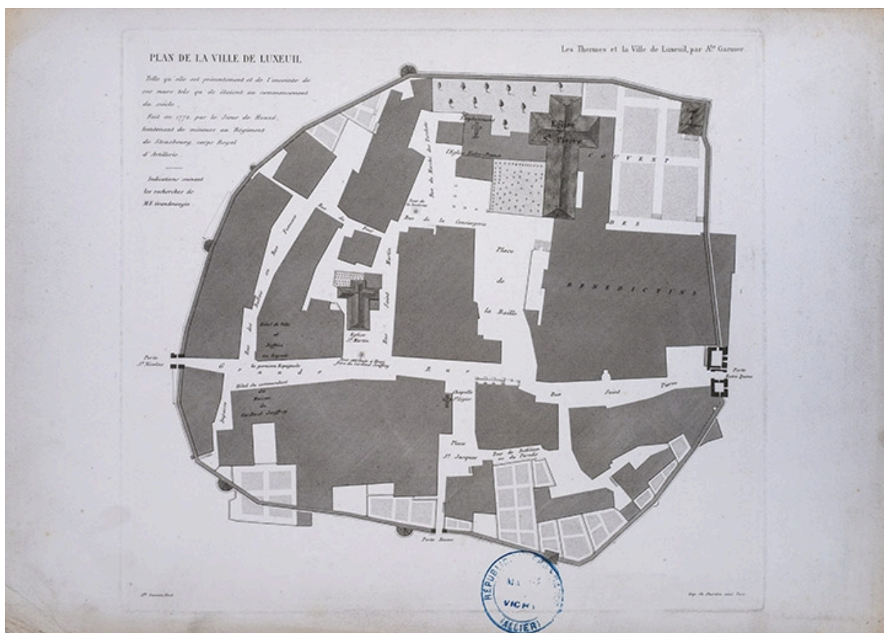
Plan du centre ancien en 1866.