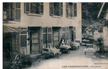
Un exemple d'hébergement modeste : la Villa des Pâquerettes.