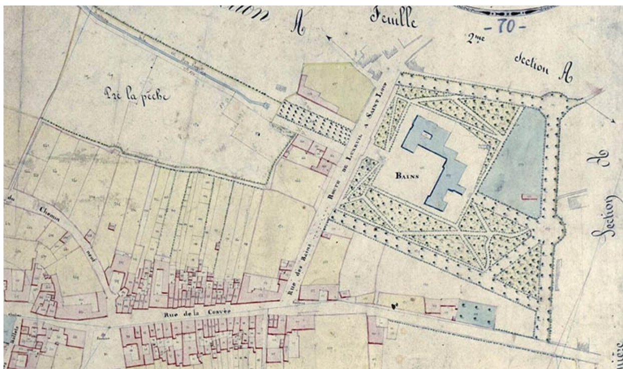
Plan des abords de l'établissement thermal en 1827.