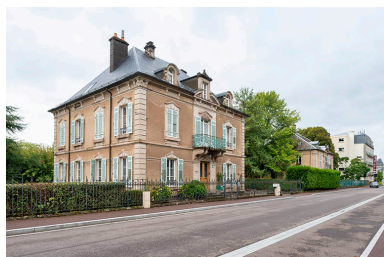
Rue de Grammont avec la Villa des Platanes. IVR43_20207000658NUC4A