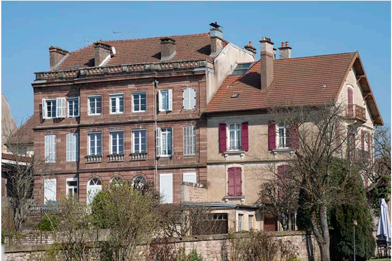
Maison Ganeval puis hôtel de La Terrasse (à gauche) et Villa Élisabeth (à droite).