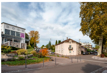
Croisement de l'avenue des Thermes et de la rue Georges Clemenceau.