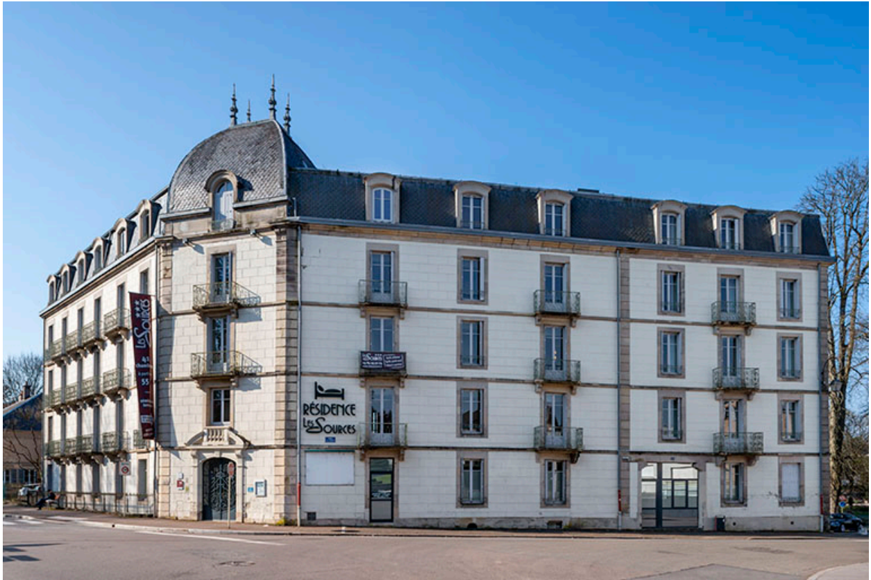
Hôtel des Sources.