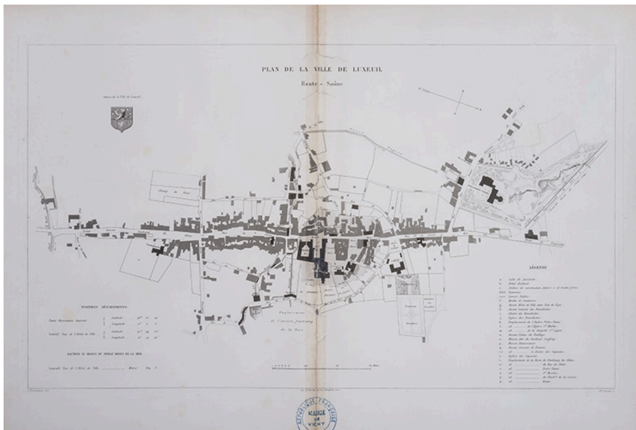
Plan d'ensemble de la commune en 1866.