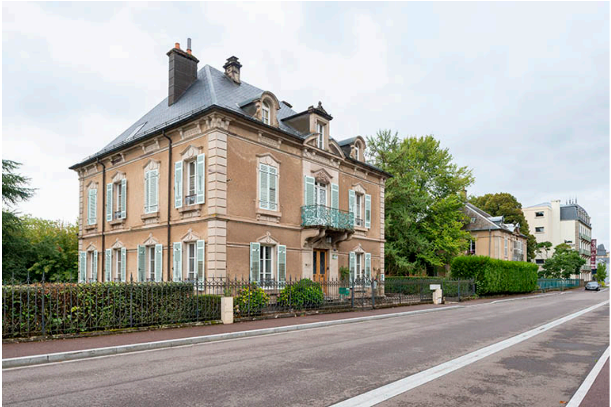
Rue de Grammont avec la Villa des Platanes.