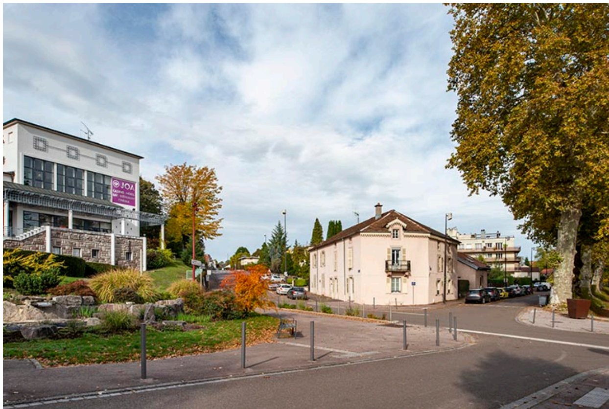
Croisement de l'avenue des Thermes et de la rue Georges Clemenceau.