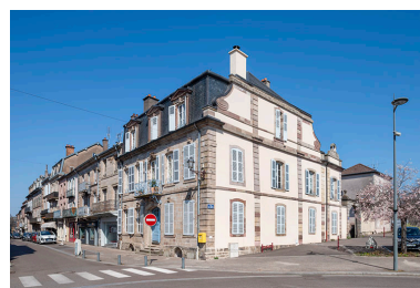
Rue Carnot avec la Maison Nicot.