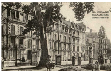
Rue des Thermes, façades de l'Hôtel du Parc et de l'Hôtel des Bains.