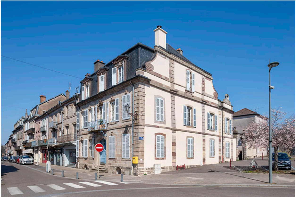
Rue Carnot avec la Maison Nicot.