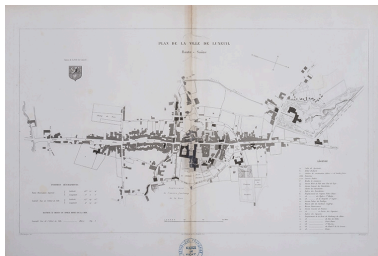
Plan d'ensemble de la commune en 1866.