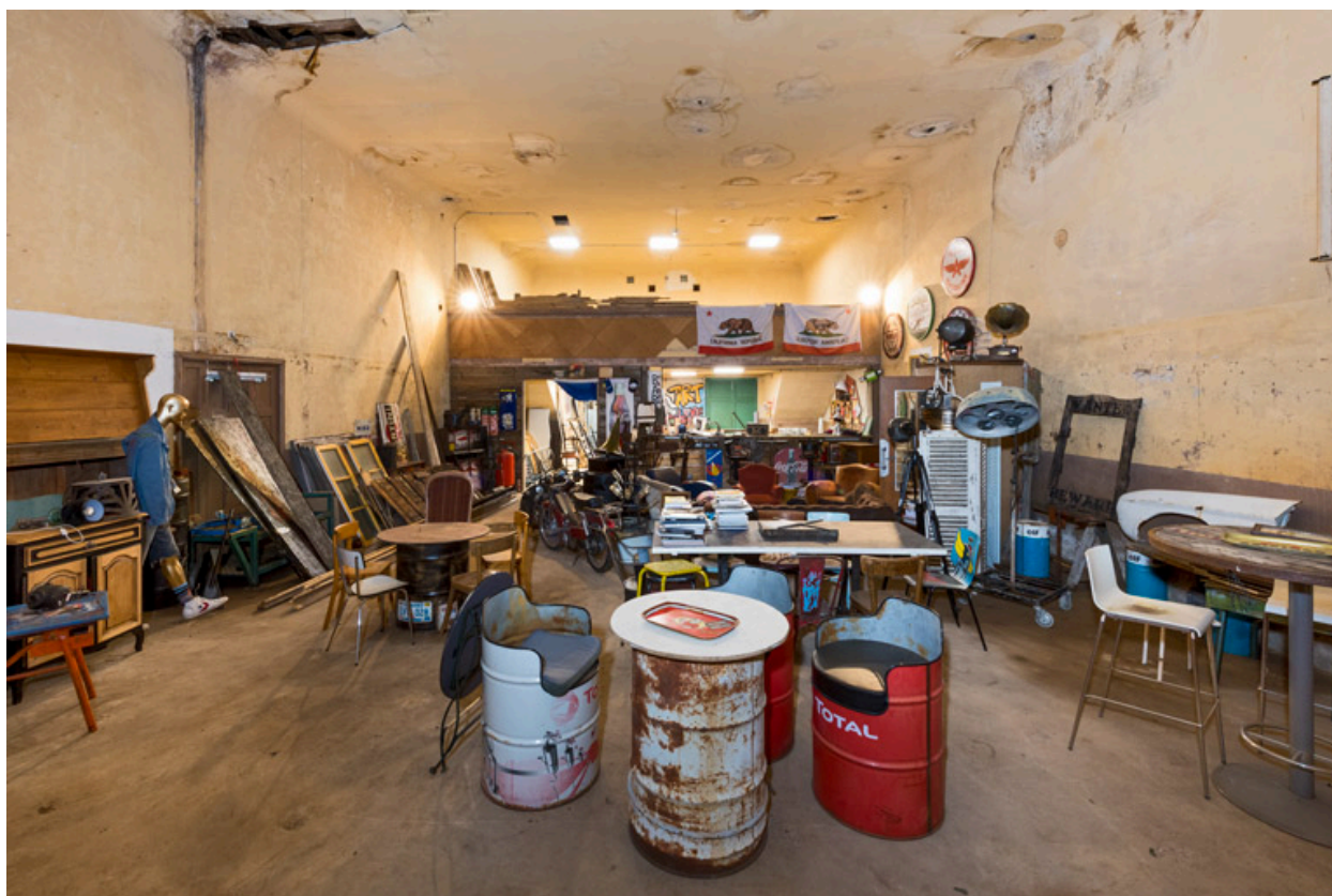
La salle, vue vers le balcon.