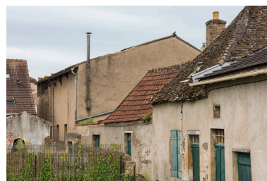
Façade postérieure, de trois quarts gauche. IVR26_20257100362NUC4A