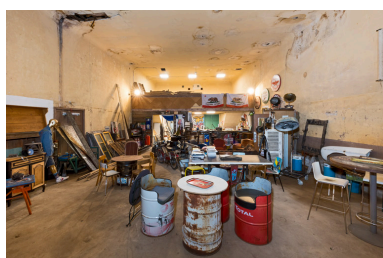
La salle, vue vers le balcon. IVR26_20257100363NUC4A