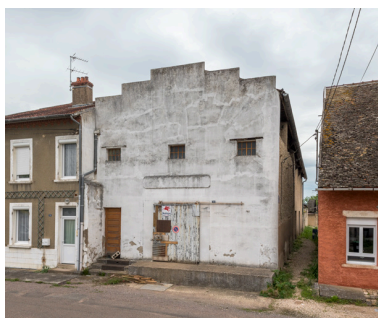
Façade antérieure, de trois quarts droite. IVR26_20257100361NUC4A