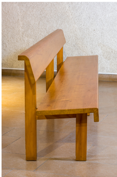
Vue d'un banc de temple (de côté). IVR26_20227100235NUC4A