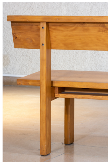
Détail de l'extrémité du banc de temple. IVR26_20227100236NUC4A