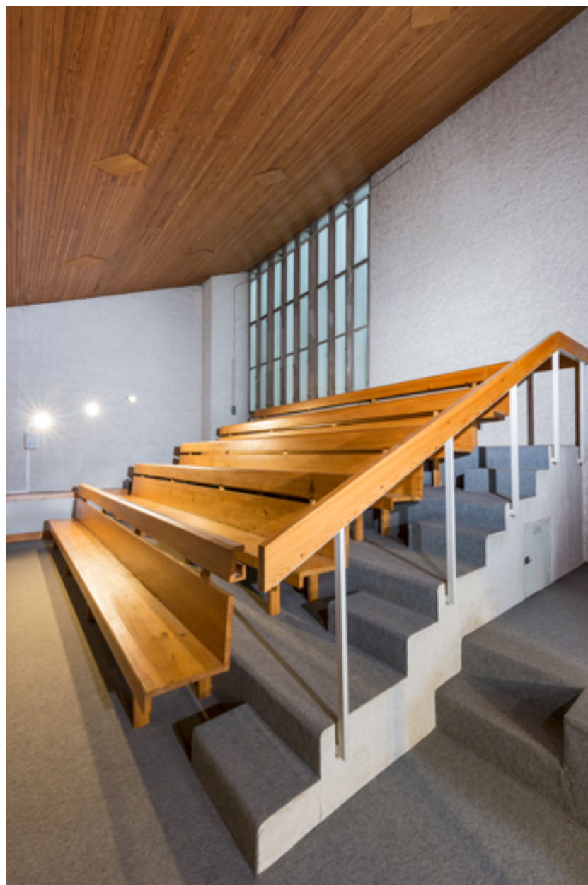
Vue des bancs de la tribune.