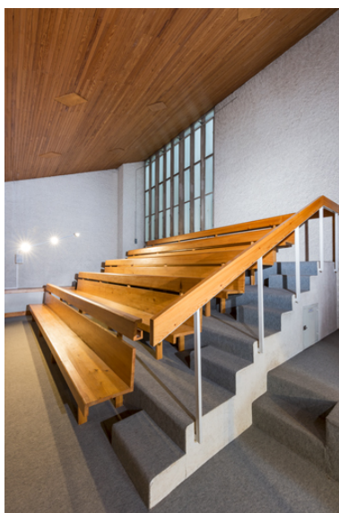
Vue des bancs de la tribune.