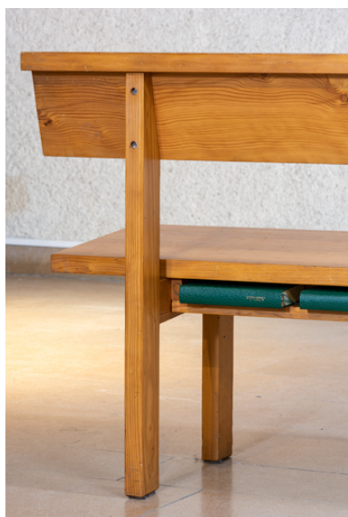
Détail du casier pour les livres de cantiques, placés sous l'assise du banc.

Phot. Pierre-Marie Barbe-Richaud IVR26_20227100237NUC4A