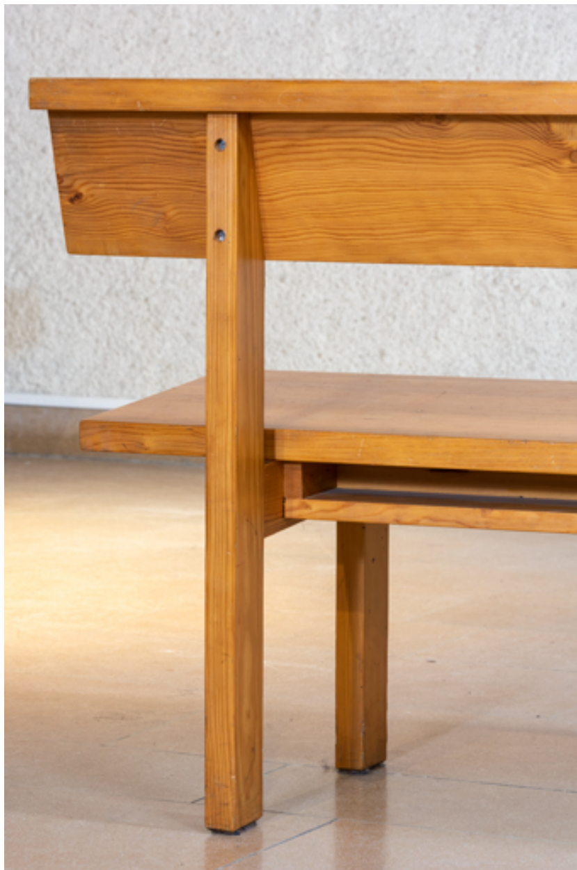
Détail de l'extrémité du banc de temple.