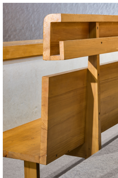
Détail du dossier d'un banc de la tribune. IVR26_20227100241NUC4A