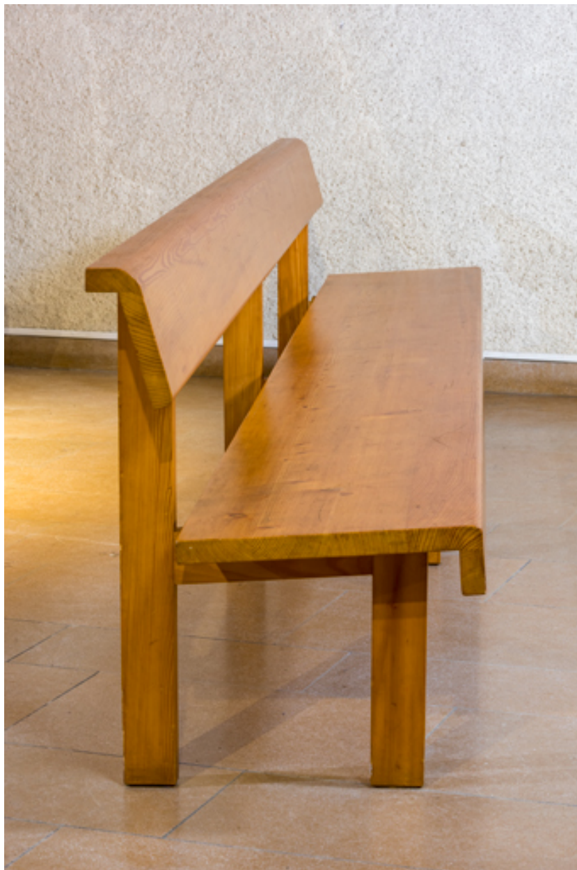
Vue d'un banc de temple (de côté).