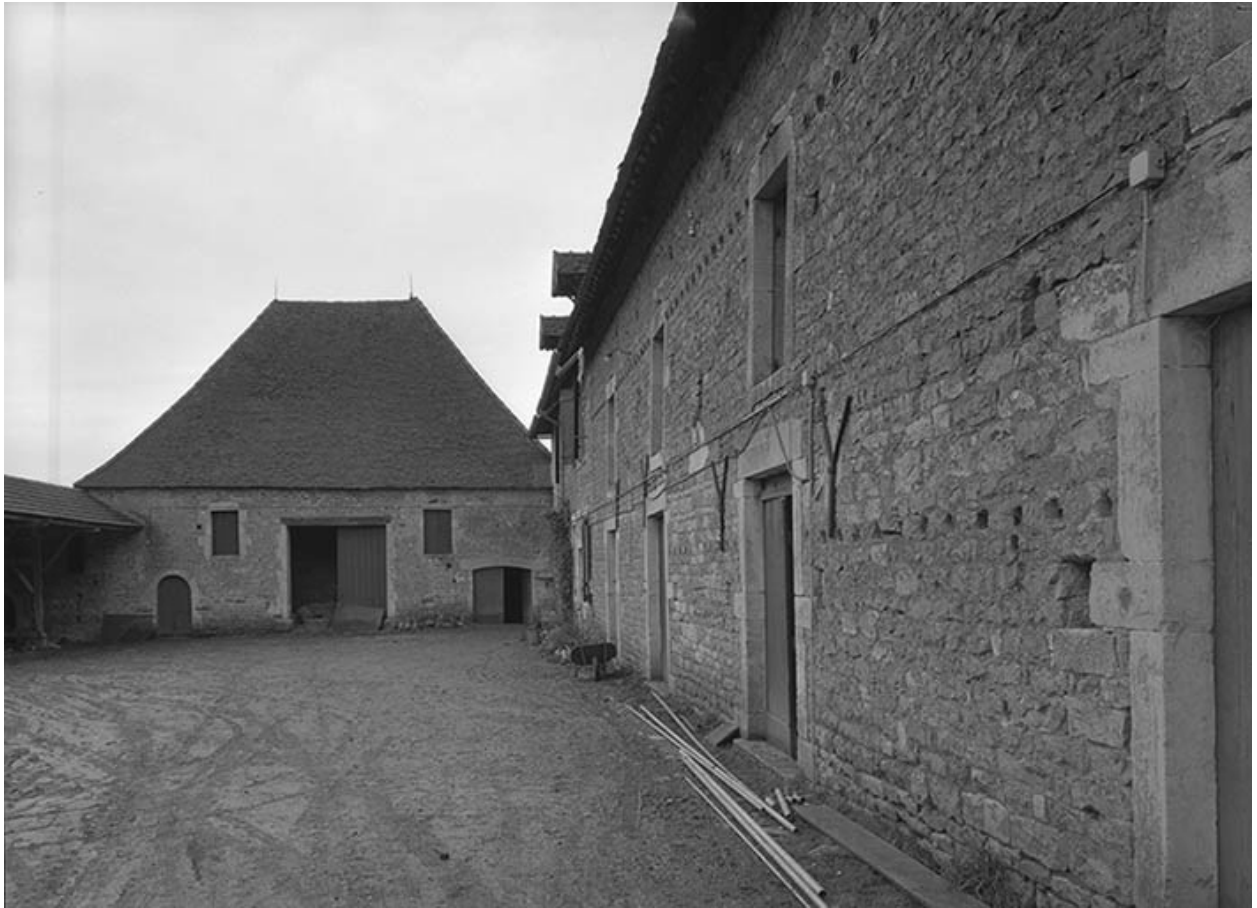
Vue d'ensemble depuis le portail.