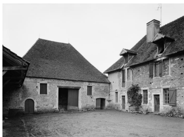
Grange et logis. IVR26_19792101962V