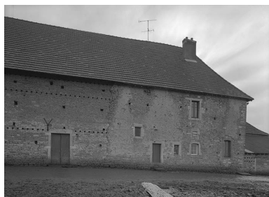
Façade postérieure du logis. IVR26_19792101965V