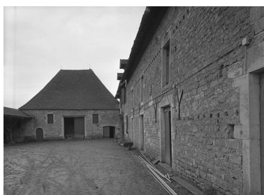
Vue d'ensemble depuis le portail.