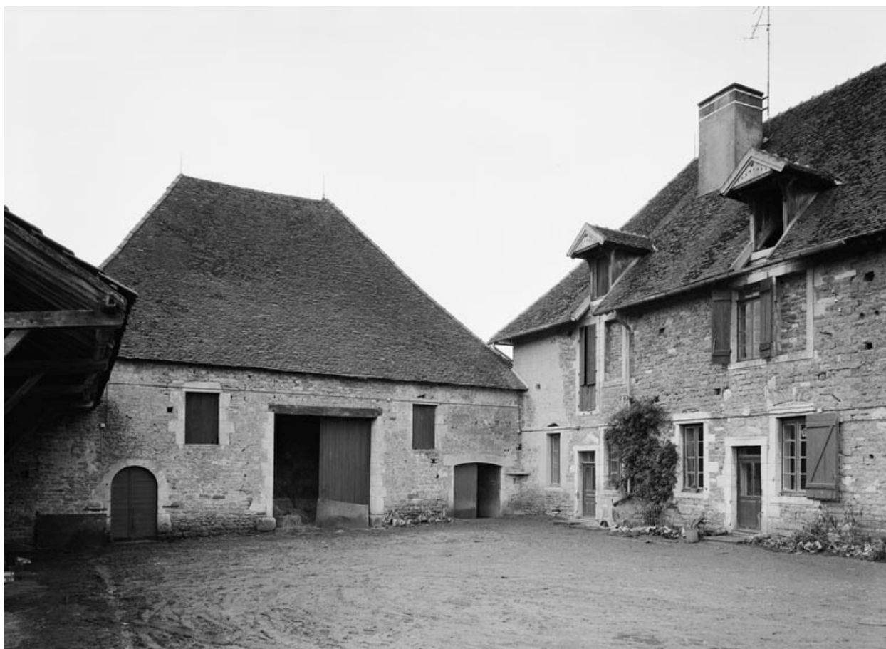
Grange et logis.