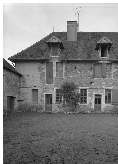
Logis. IVR26_19792101964V