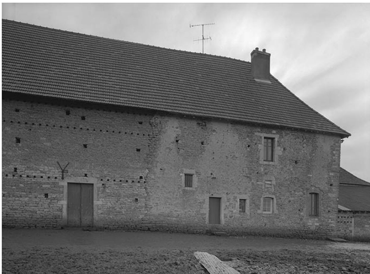
Façade postérieure du logis.