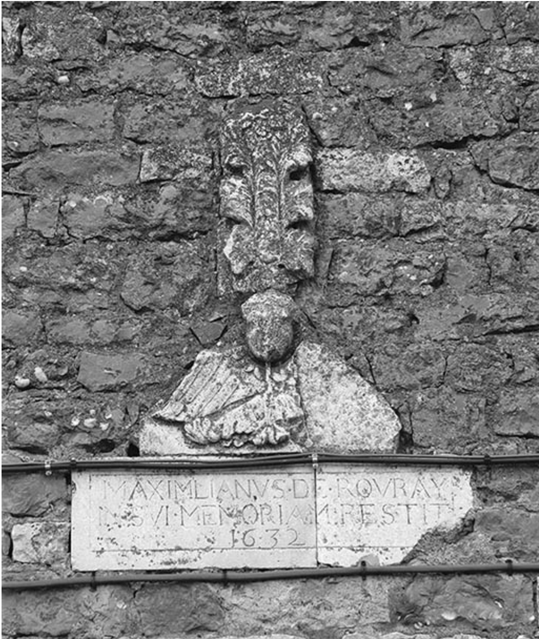
Détail de l'inscription en remploi.