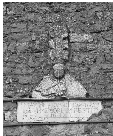
Détail de l'inscription en remploi.