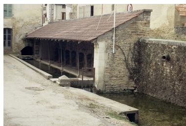
Vue extérieure.