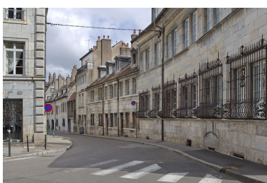
Vue d'ensemble du logis principal dans l'alignement de la rue.