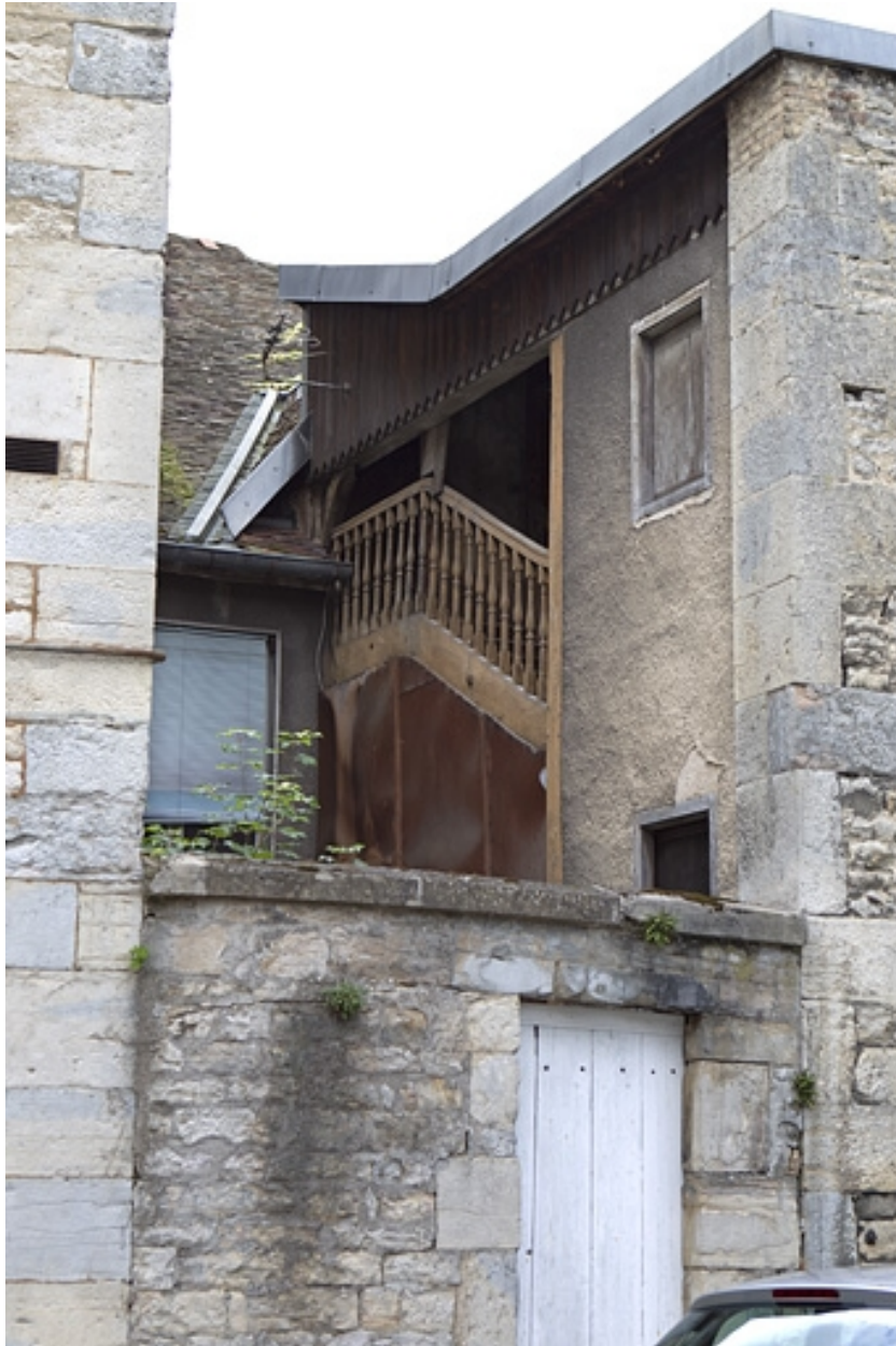
Détail de l'escalier à cage ouverte depuis la cour de l'hôtel Alviset.