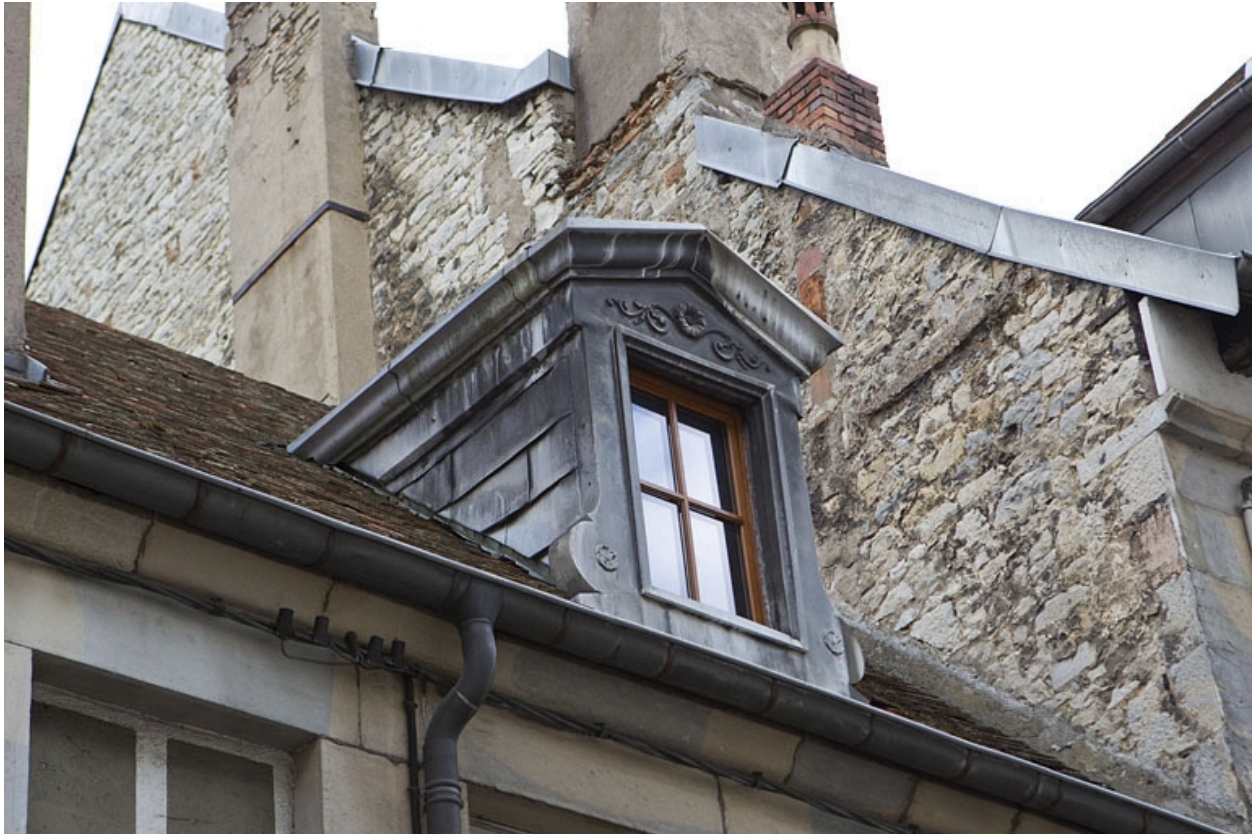
Détail de la fenêtre du comble.