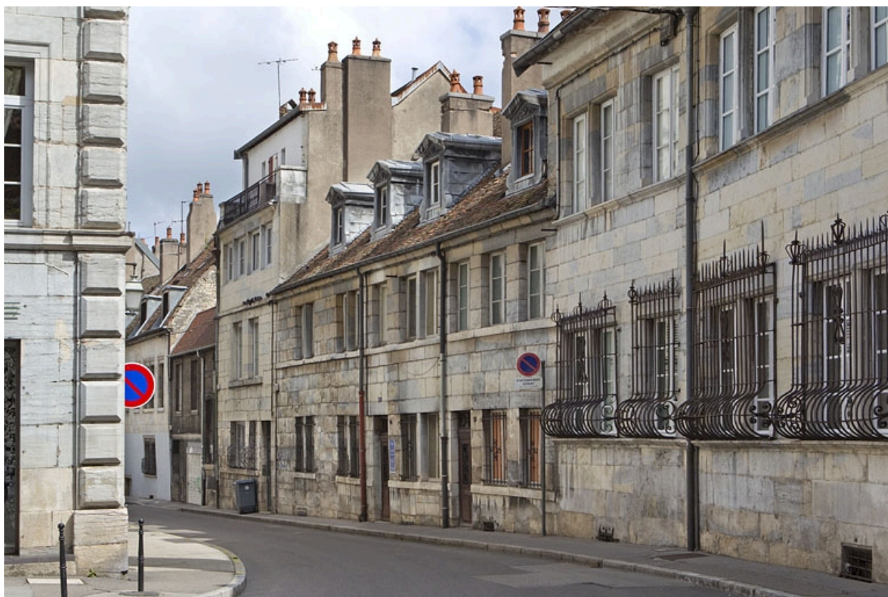
Vue d'ensemble du logis principal depuis la rue de trois quarts droit.