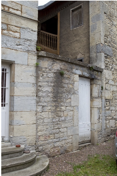
Détail du mur de clôture de la cour depuis celle de l'hôtel Alviset.