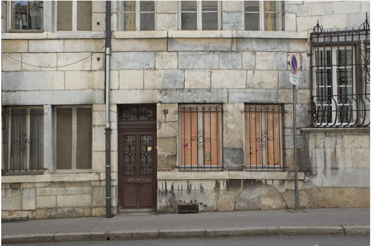
Façade antérieure du logis : détail du rez-de-chaussée.