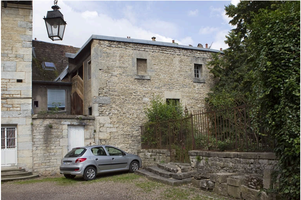
Vue d'ensemble de l'arrière de la maison depuis la cour de l'hôtel Alviset.