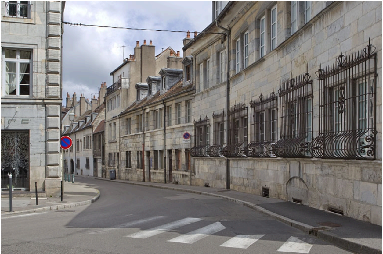
Vue d'ensemble du logis principal dans l'alignement de la rue.