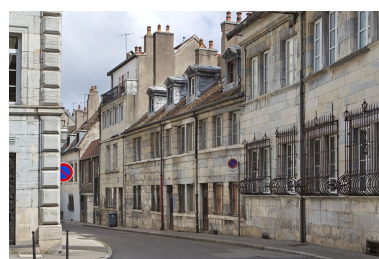
Vue d'ensemble du logis principal depuis la rue de trois quarts droit.