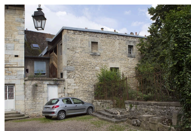
Vue d'ensemble de l'arrière de la maison depuis la cour de l'hôtel Alviset.