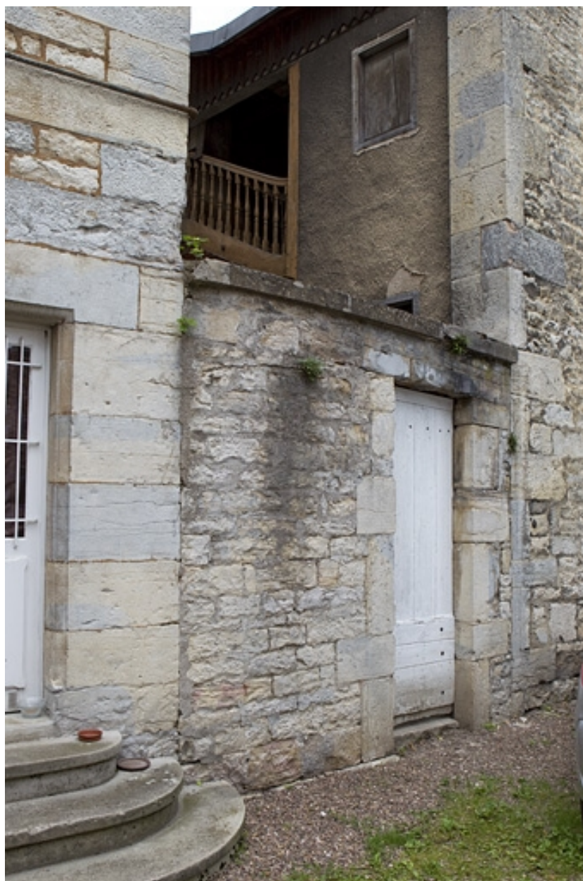
Détail du mur de clôture de la cour depuis celle de l'hôtel Alviset.