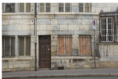
Façade antérieure du logis : détail du rez-de-chaussée.