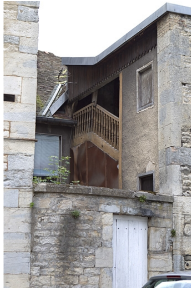
Détail de l'escalier à cage ouverte depuis la cour de l'hôtel Alviset. IVR43_20102500791NUC2A