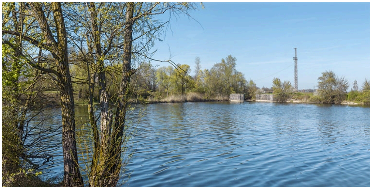
Les vestiges de l'ancien barrage de Saint-Jean-de-Losne au niveau de la digue.