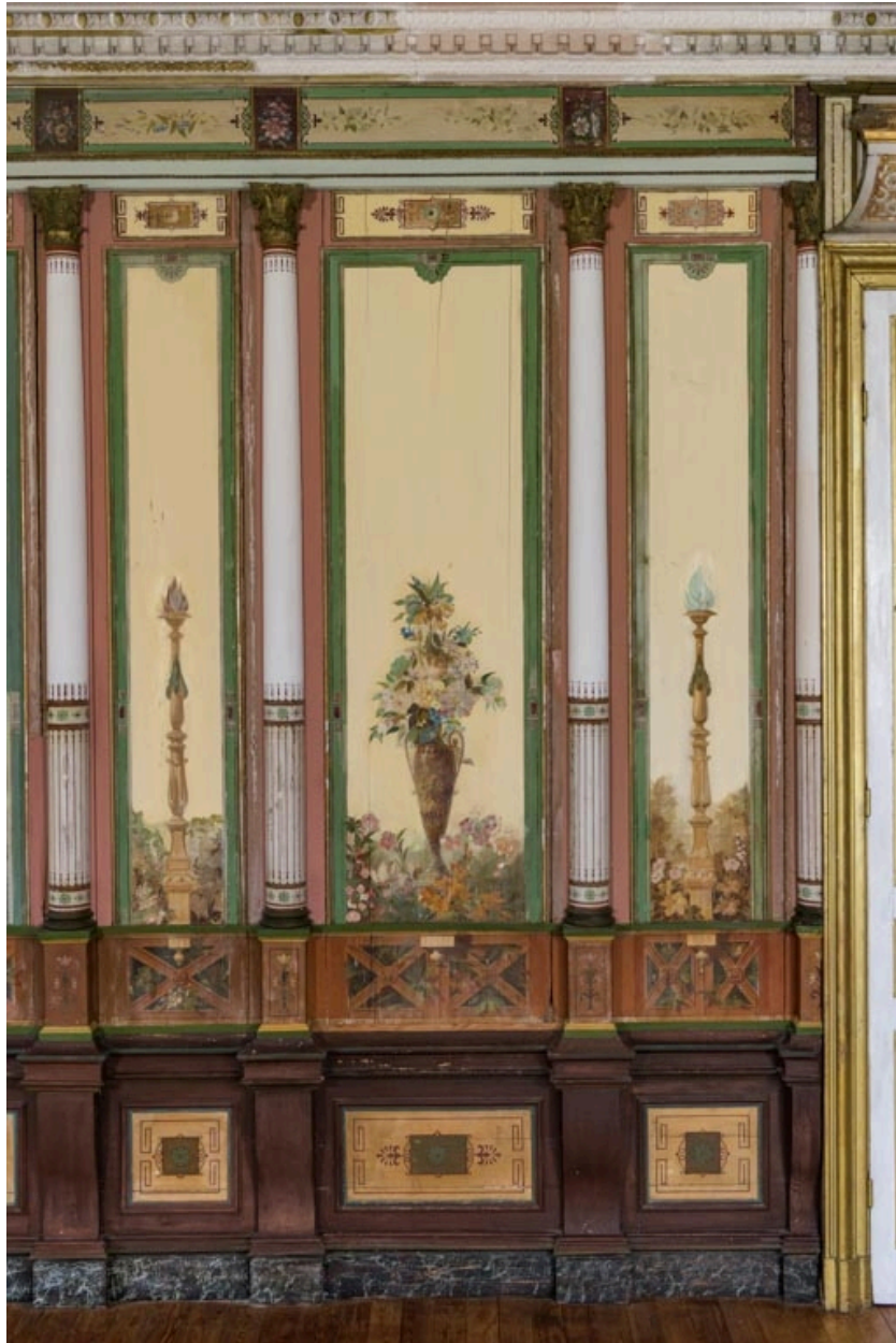
Décor peint et colonnes corinthiennes.