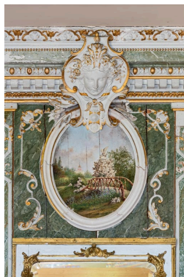
Panneau ovale surmontant le trumeau occidental : pont et décor de rocailles portant la statue du phénix.