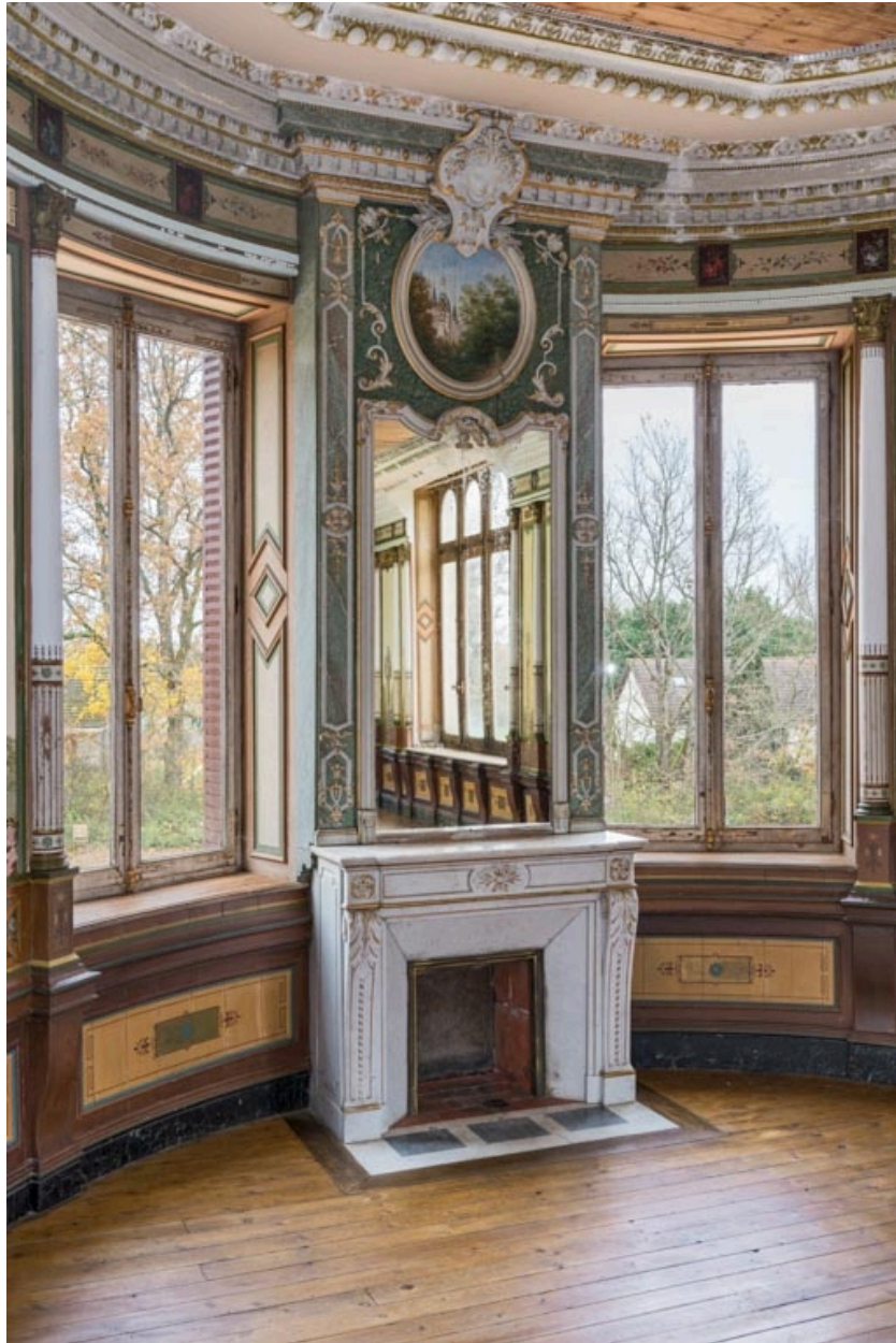
Cheminée à l'est.