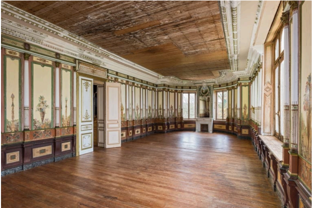
Vue vers l'est.