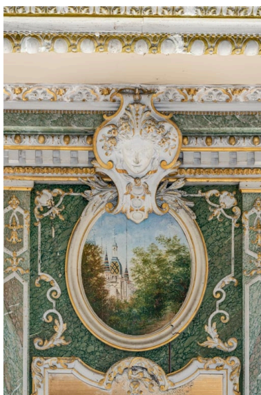
Panneau ovale surmontant le trumeau oriental : dôme du château. IVR26_20212100503NUC4A