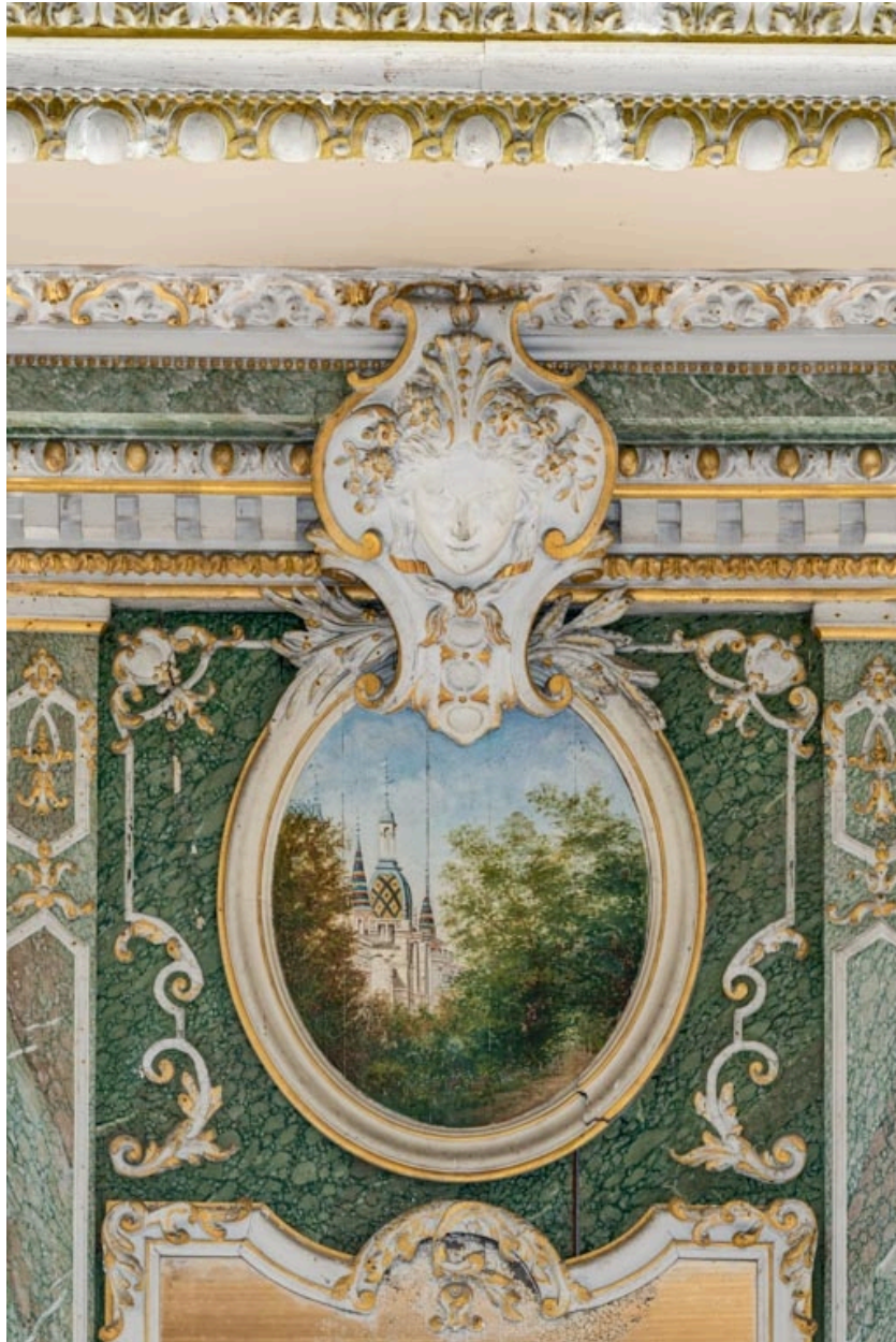
Panneau ovale surmontant le trumeau oriental : dôme du château.