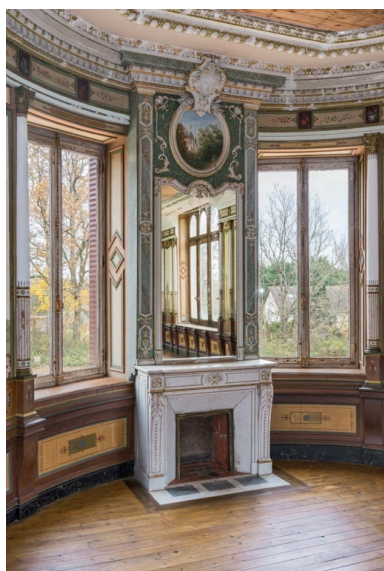
Cheminée à l'est. IVR26_20212100478NUC4A