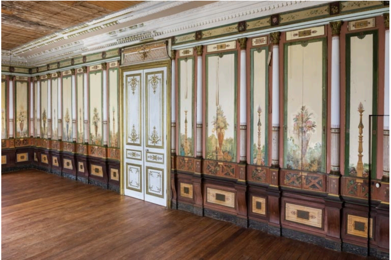
Lambris de hauteur sur le mur nord.