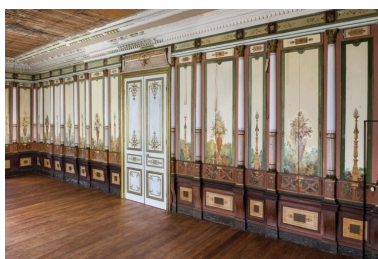
Lambris de hauteur sur le mur nord. IVR26_20212100479NUC4A