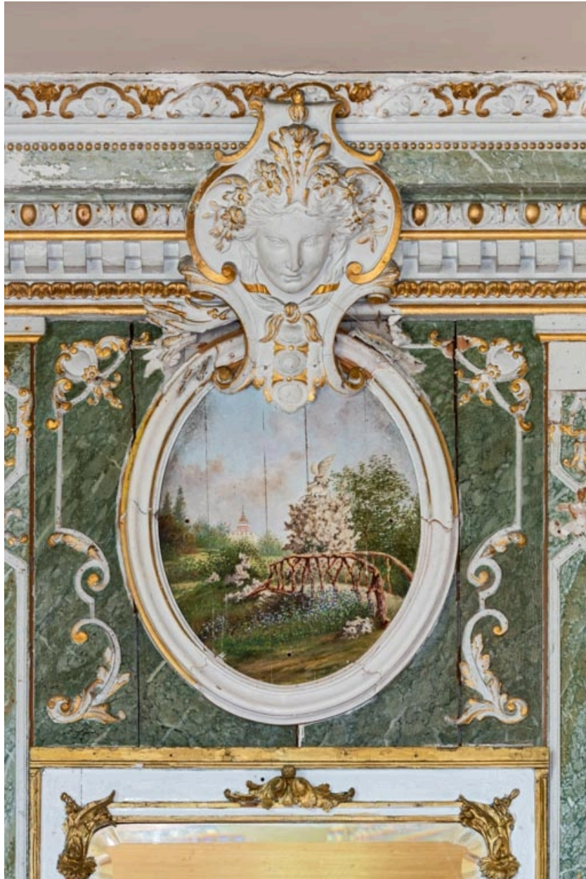
Panneau ovale surmontant le trumeau occidental : pont et décor de rocailles portant la statue du phénix.