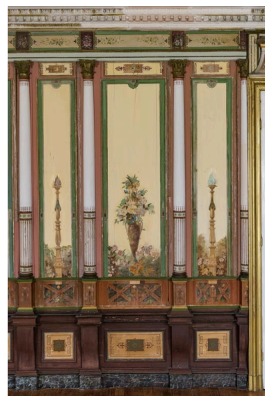
Décor peint et colonnes corinthiennes.