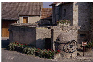
Vue extérieure. IVR26_19987100723ZA