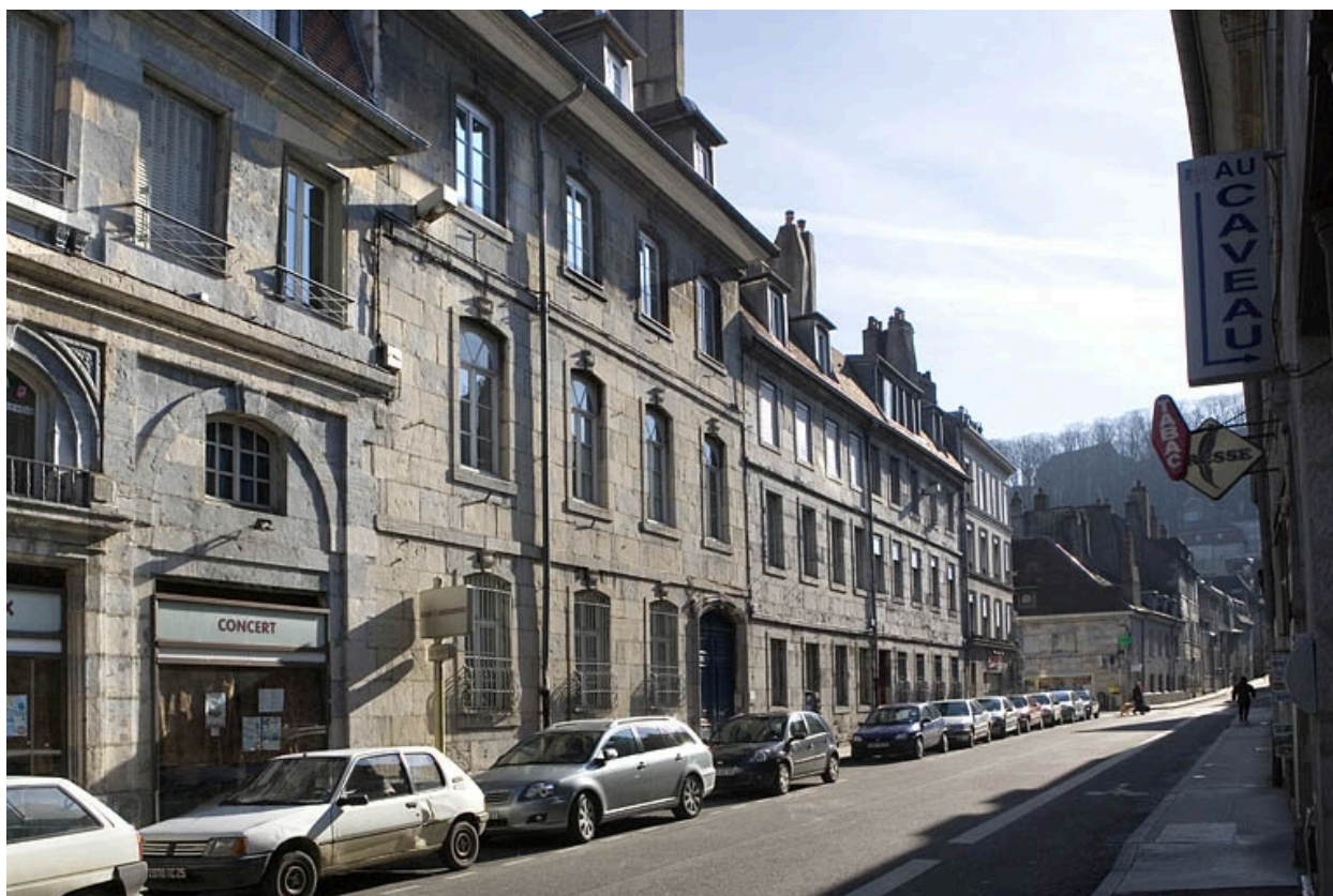
Vue d'ensemble de trois quarts gauche.