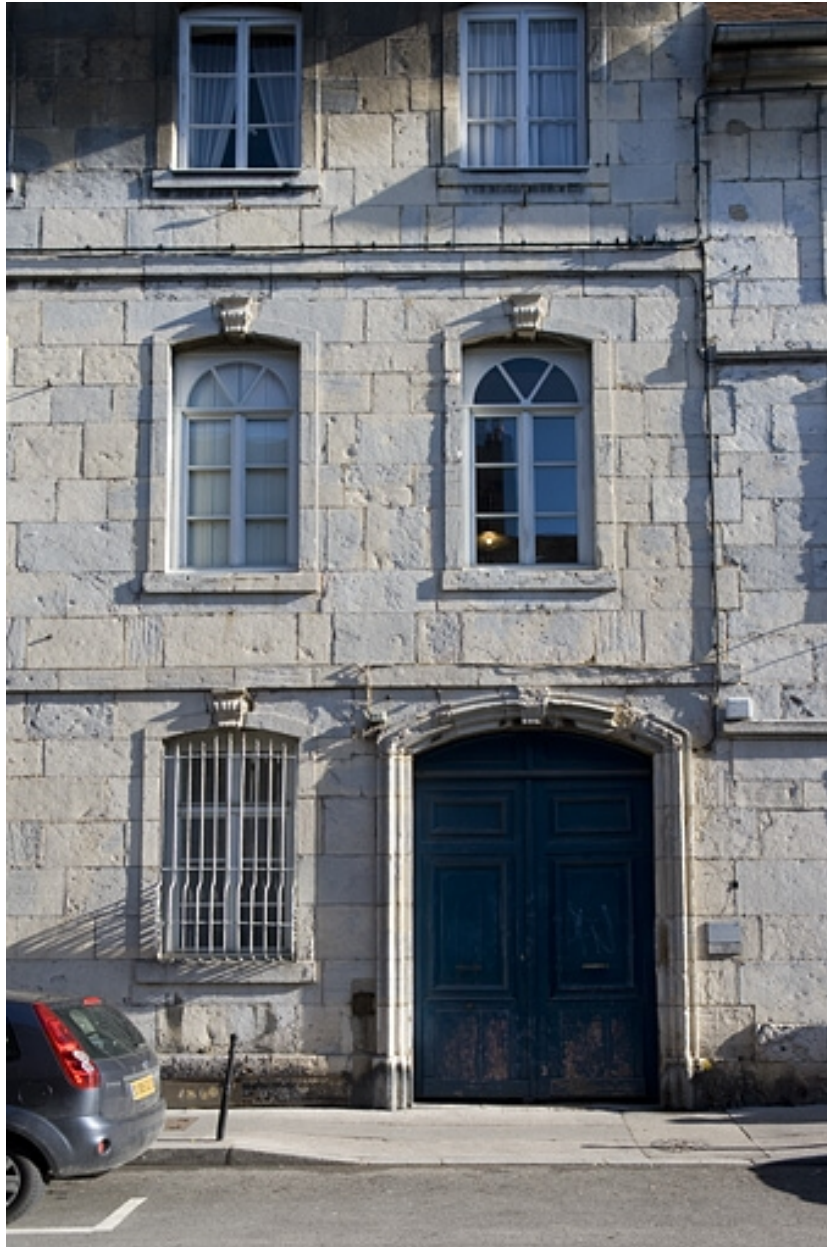
Détail du portail d'entrée.