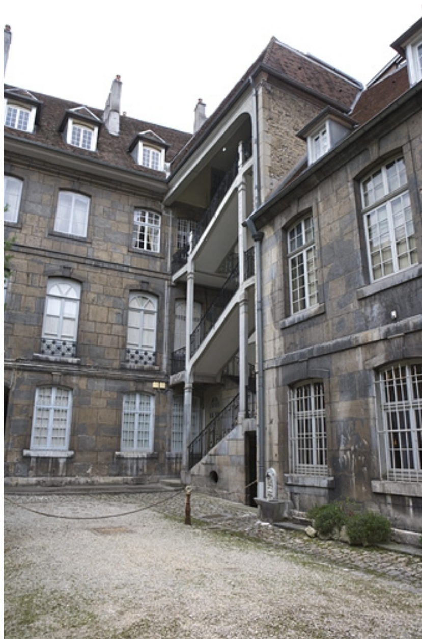
Vue d'ensemble de l'escalier à cage ouverte de trois quart droit.