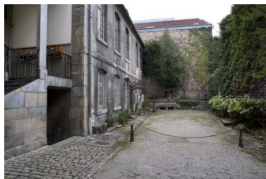
Vue d'ensemble rapprochée de l'aile gauche sur cour. IVR43_20092500254NUC2A