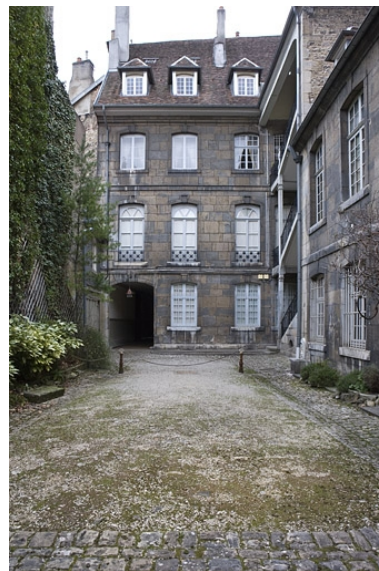
Vue d'ensemble de la façade postérieure du logis sur rue depuis le fond de la cour. IVR43_20092500255NUC2A