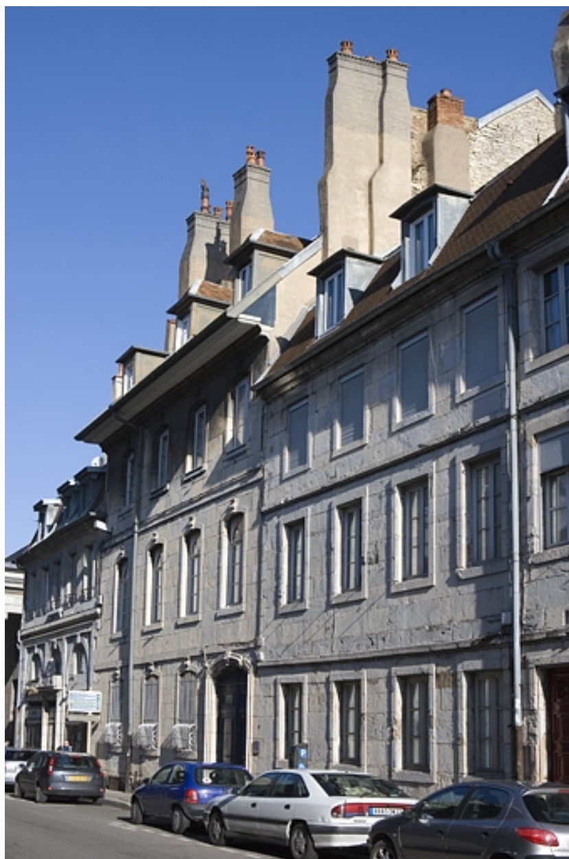
Vue d'ensemble de trois quarts droit.