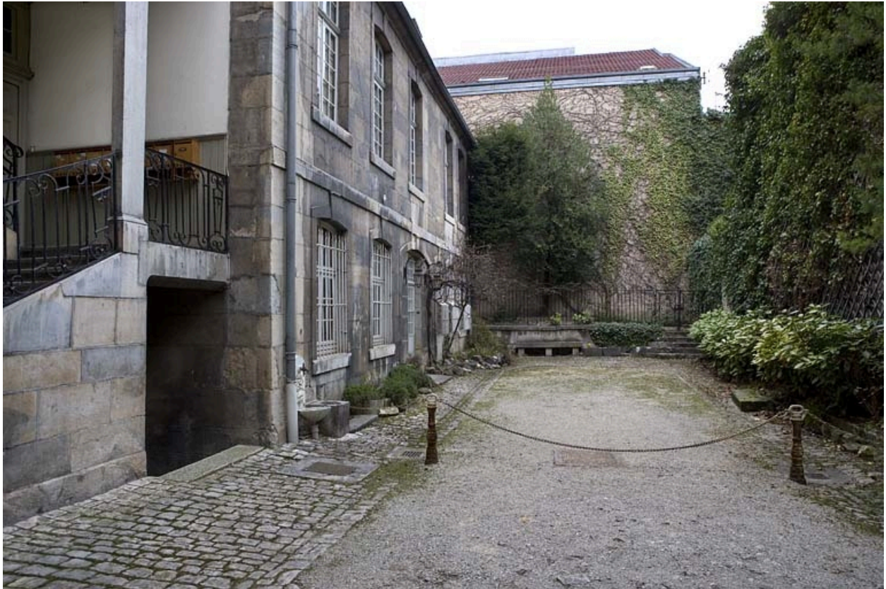
Vue d'ensemble rapprochée de l'aile gauche sur cour.