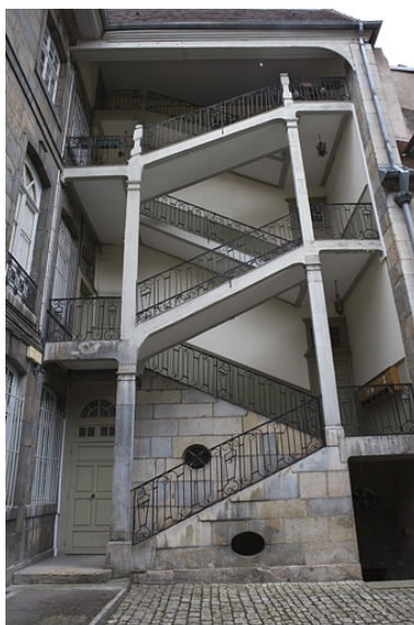
Vue d'ensemble de l'escalier à cage ouverte de face. IVR43_20092500257NUC2A