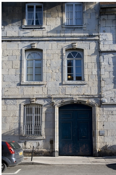
Détail du portail d'entrée. IVR43_20092500248NUC2A