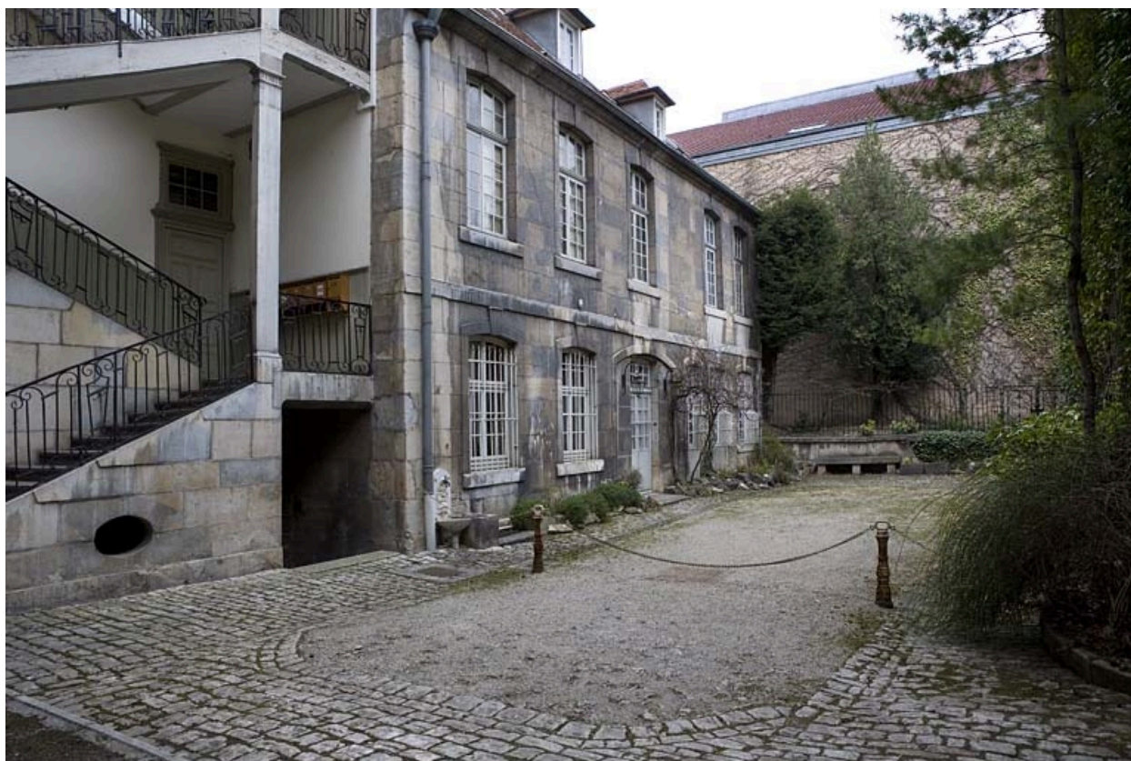
Vue d'ensemble de l'aile gauche sur cour.