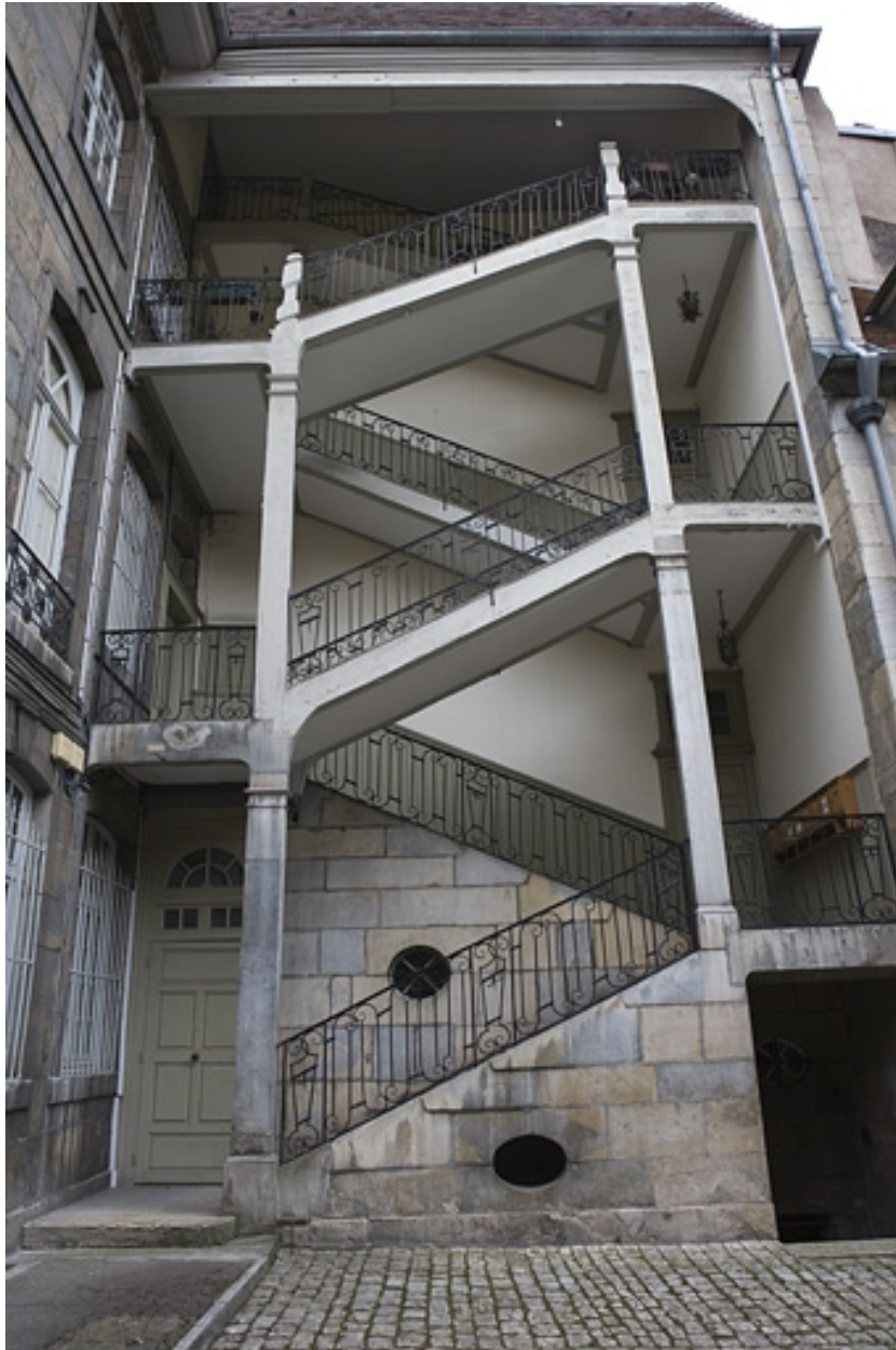
Vue d'ensemble de l'escalier à cage ouverte de face.