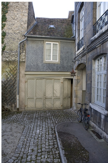
Détail d'une remise à droite de la cour. IVR43_20092500251NUC2A