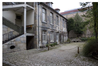
Vue d'ensemble de l'aile gauche sur cour. IVR43_20092500253NUC2A