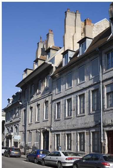
Vue d'ensemble de trois quarts droit. IVR43_20092500247NUC2A