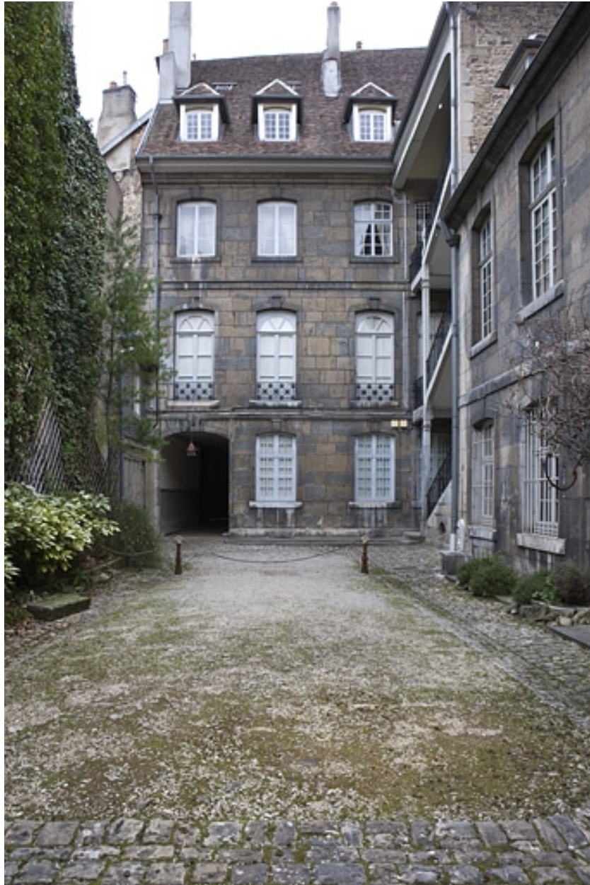
Vue d'ensemble de la façade postérieure du logis sur rue depuis le fond de la cour.