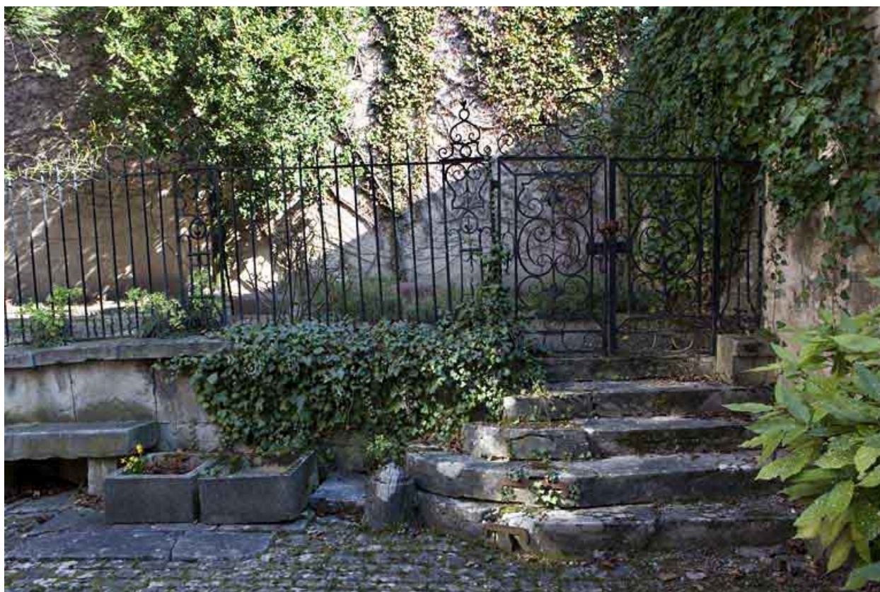
Détail de la grille du jardin en fer forgé.