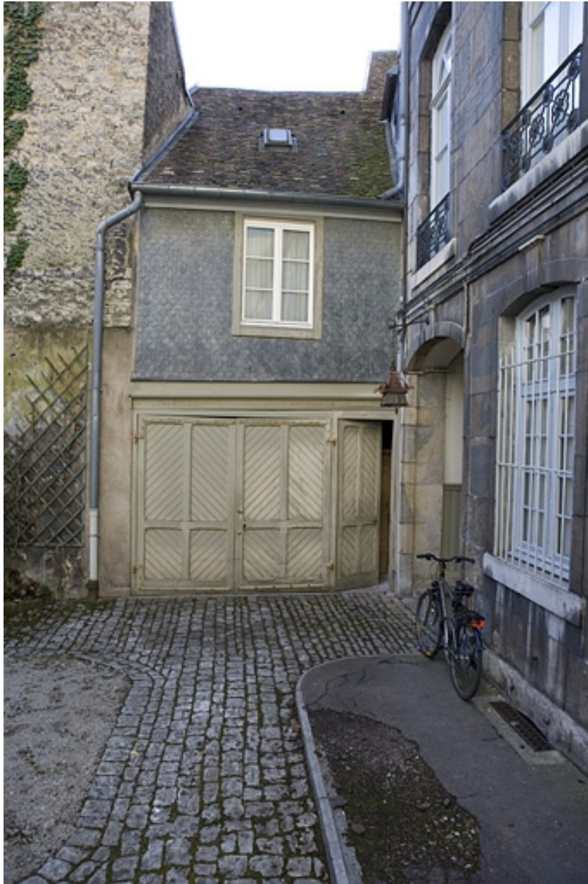
Détail d'une remise à droite de la cour.