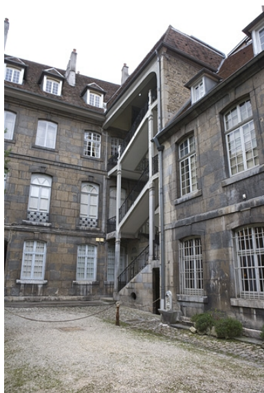
Vue d'ensemble de l'escalier à cage ouverte de trois quarts droit. IVR43_20092500256NUC2A