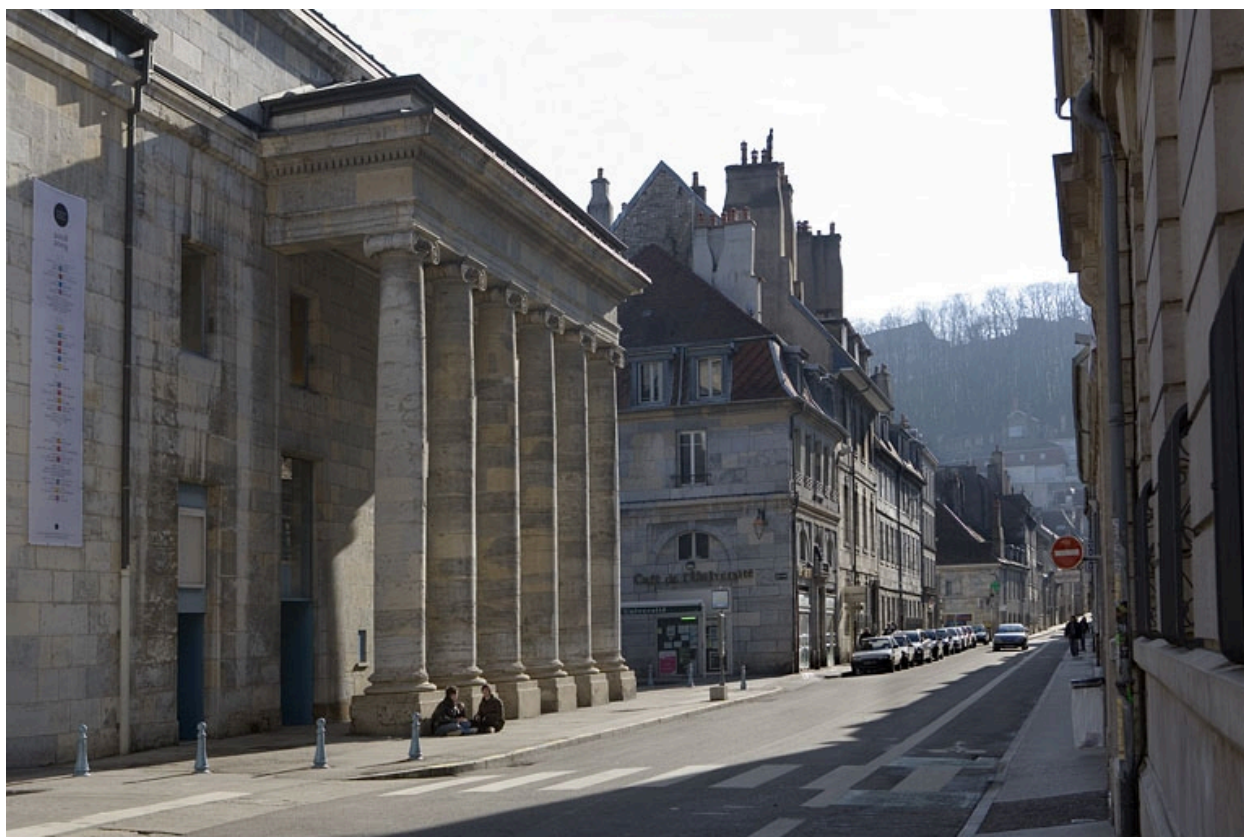
Vue éloignée avec la colonnade du théâtre.