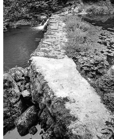
Vue d'ensemble. IVR43_19762500803X