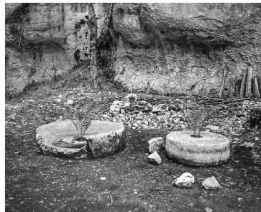
Les meules. IVR43_19762500805X