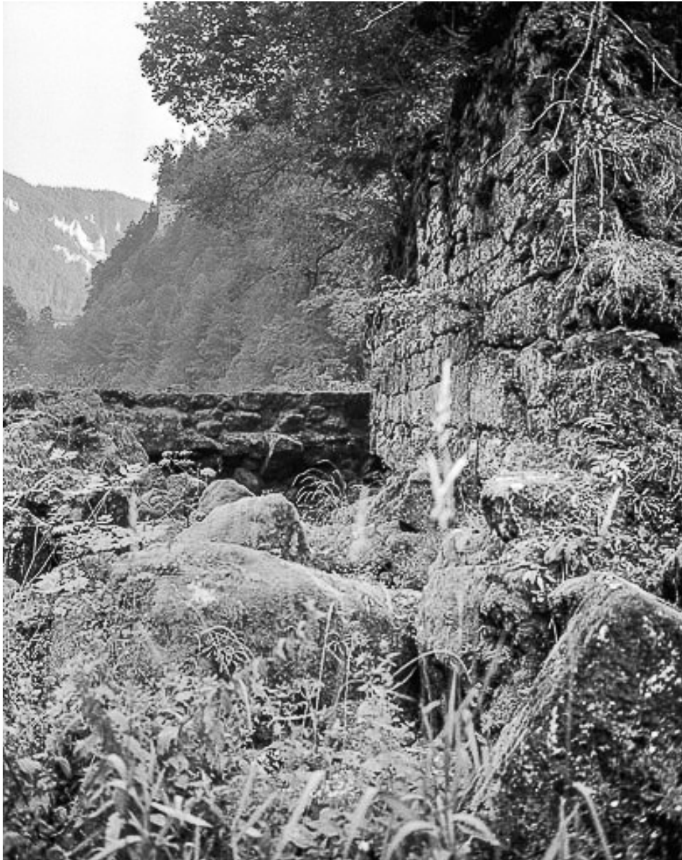
Entrée du canal.