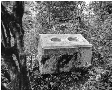
Pierre destinée à recevoir les axes.