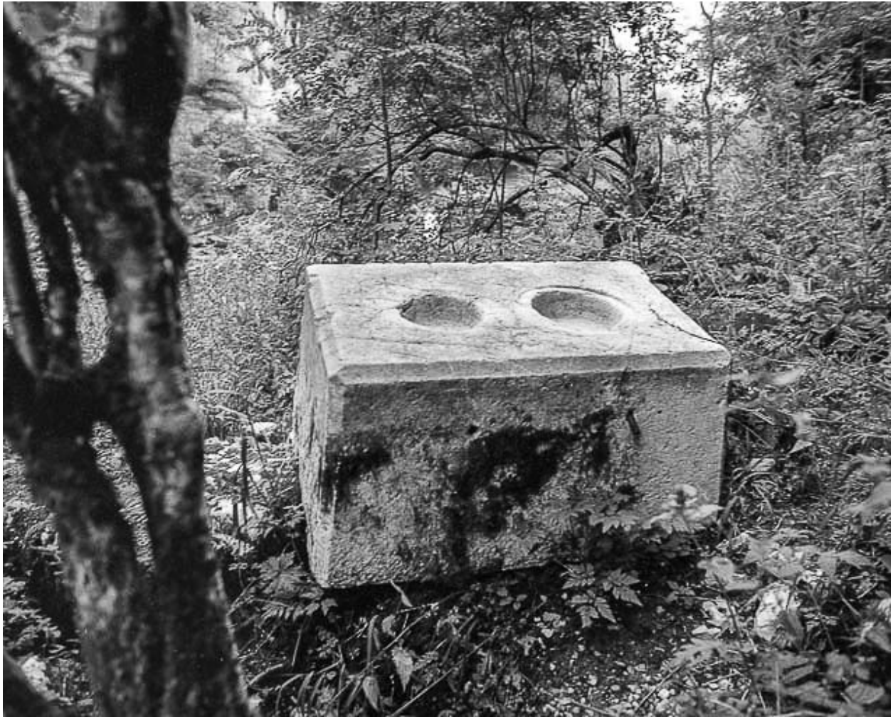
Pierre destinée à recevoir les axes.