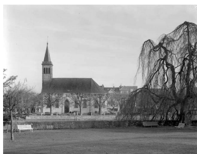
Vue de situation. IVR43_19912500049V