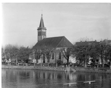
Vue de situation. IVR43_19912500048V