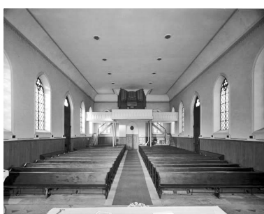
Nef vue depuis le chœur. IVR43_19912500052V