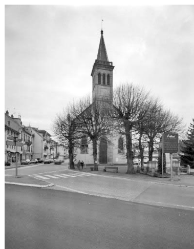
Vue d'ensemble. IVR43_19912500050V