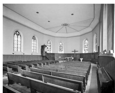
Nef vue depuis l'entrée.