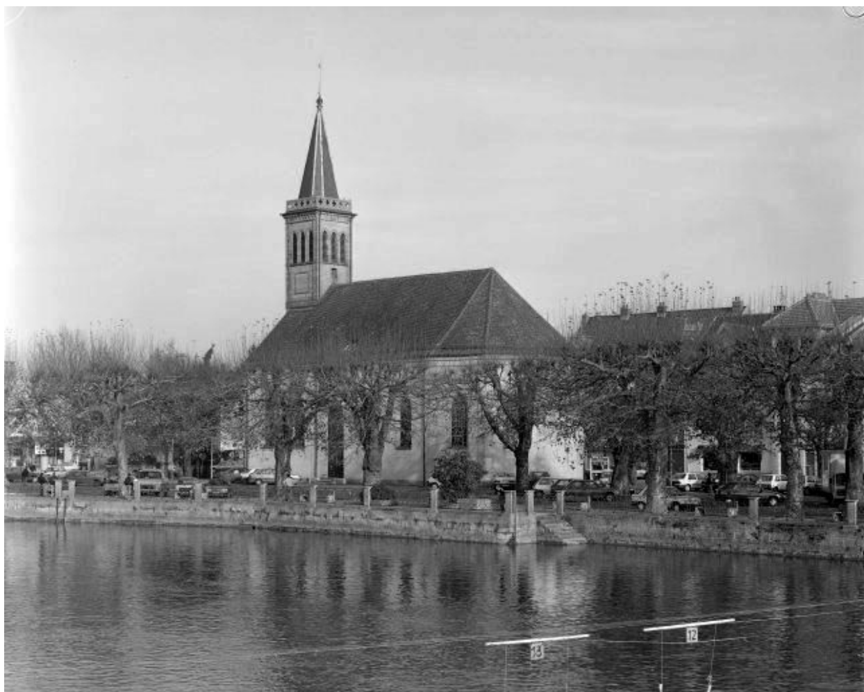
Vue de situation.