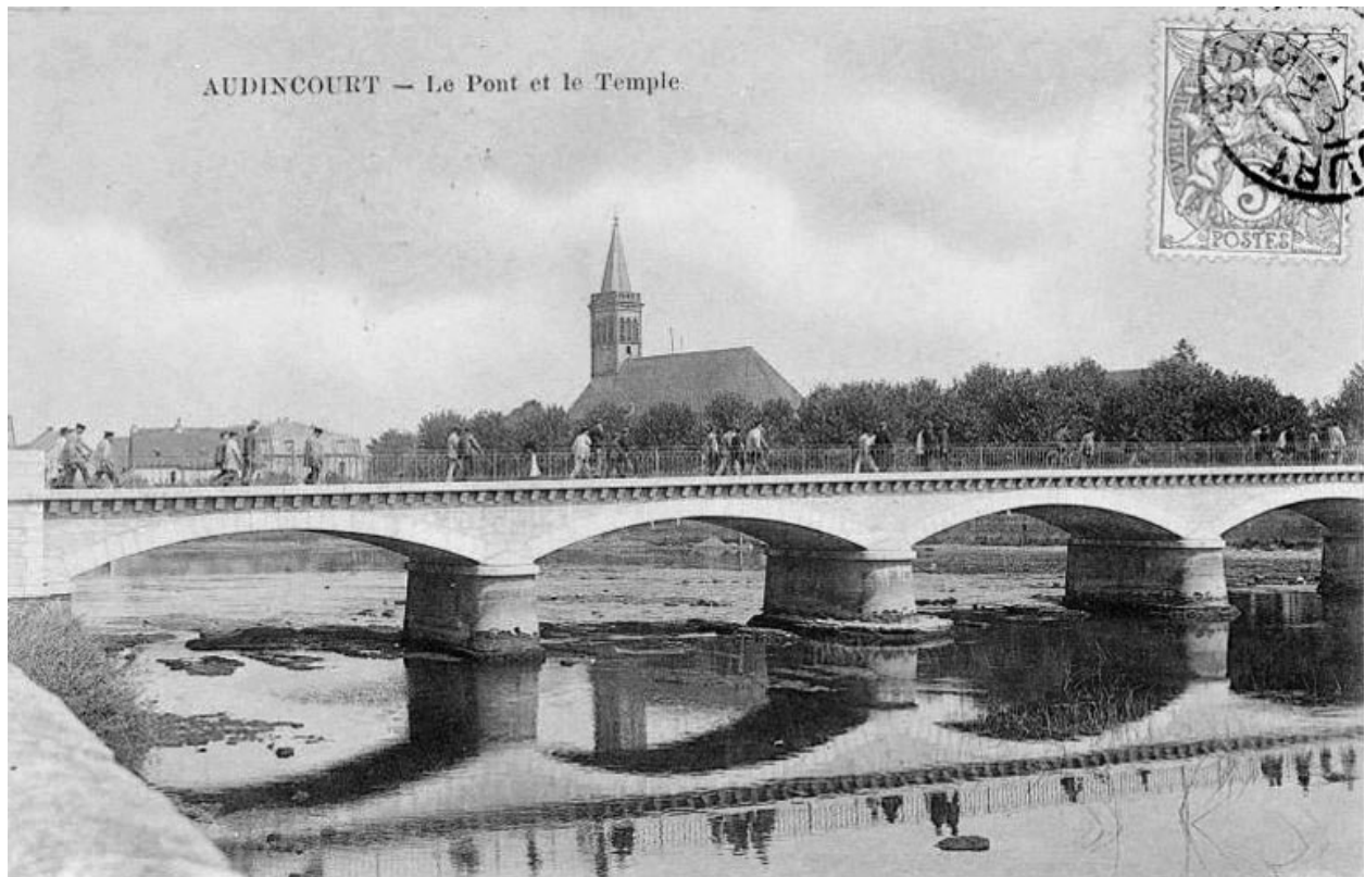
AUDINCOURT - Le Pont et le Temple.