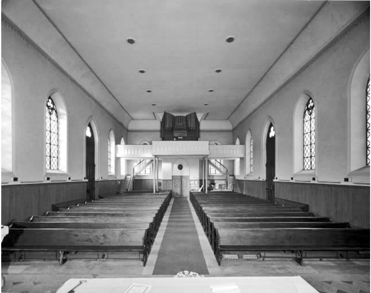
Nef vue depuis le chœur.