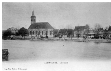
AUDINCOURT. - Le Temple.