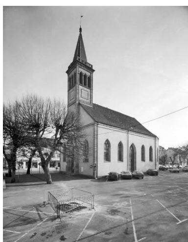
Vue d'ensemble de trois quarts droit. IVR43_19912500051V