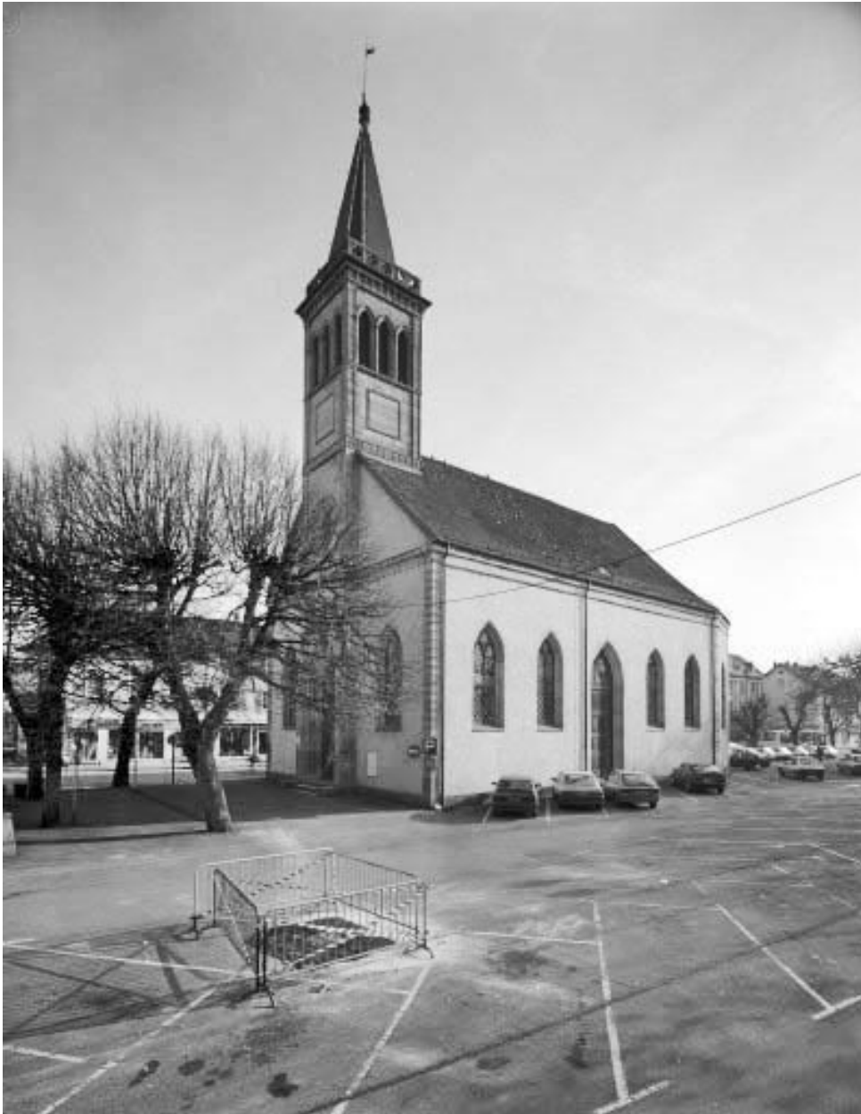
Vue d'ensemble de trois quarts droit.