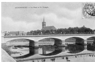
AUDINCOURT - Le Pont et le Temple.