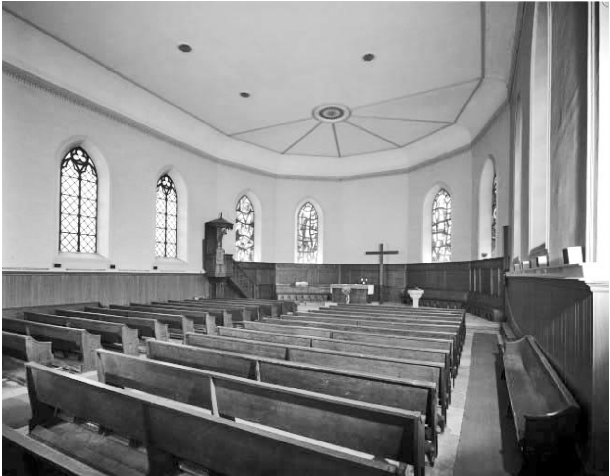
Nef vue depuis l'entrée.