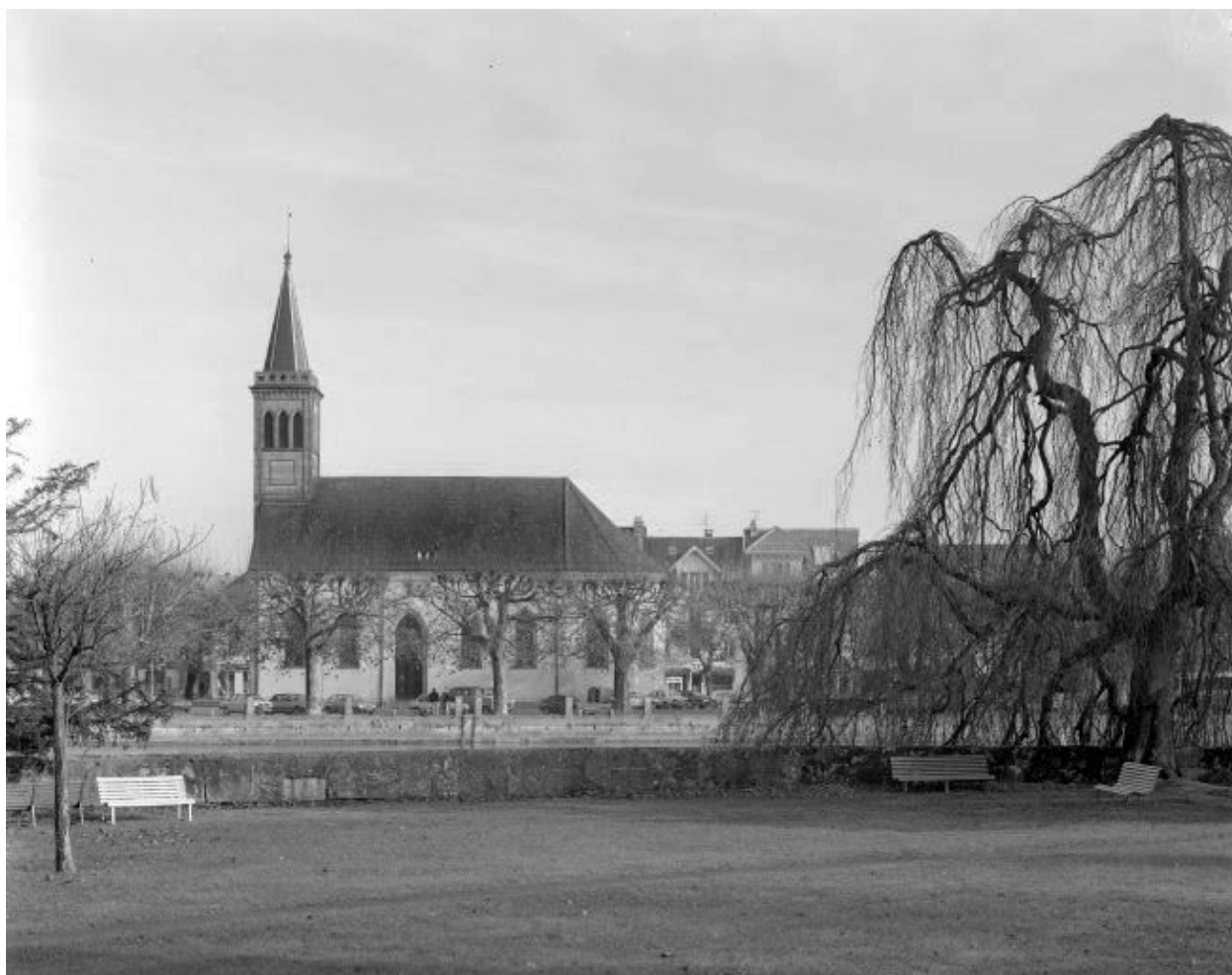
Vue de situation.