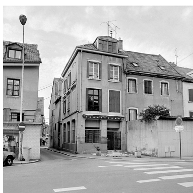
Façade sur la rue de la Schliffe.