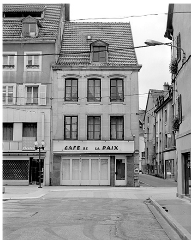
Façade sur la rue des Febvres. IVR43_19872500776X