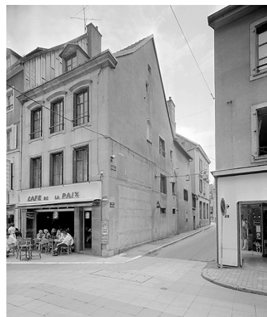
Vue d'ensemble sur l'angle des rues des Febvres et du Moulin.