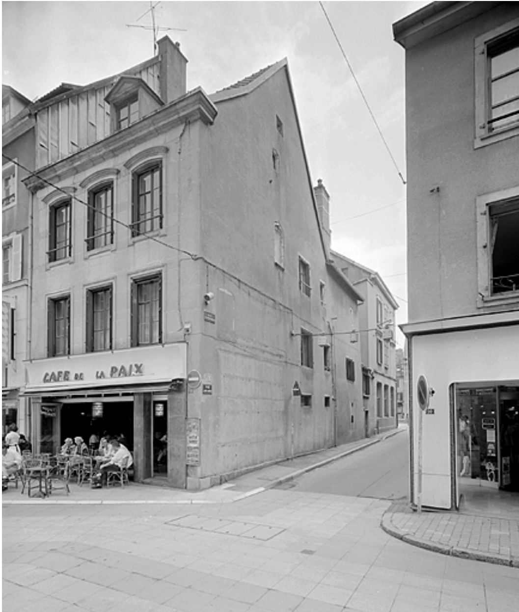
Vue d'ensemble sur l'angle des rues des Febvres et du Moulin.