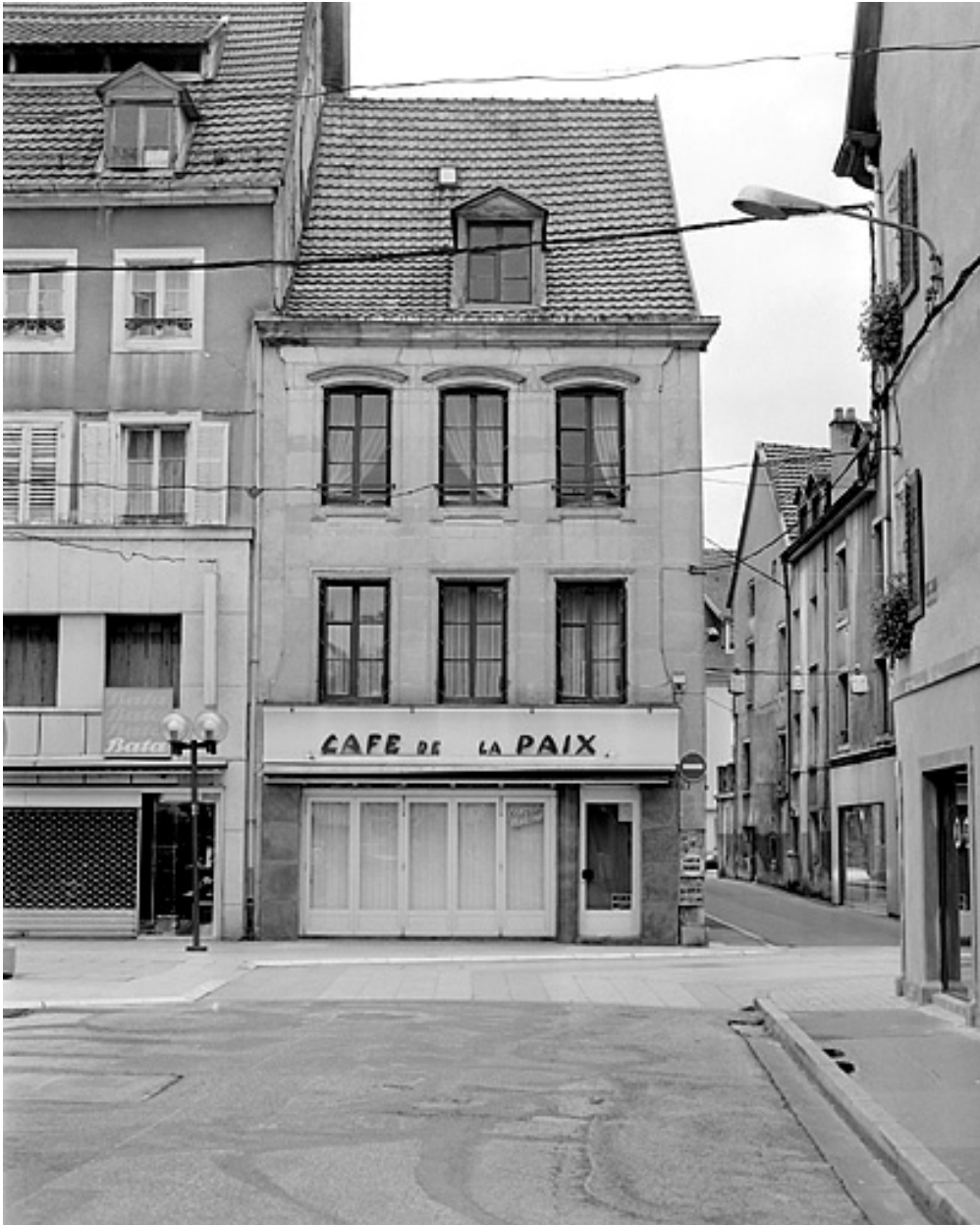
Façade sur la rue des Febvres.