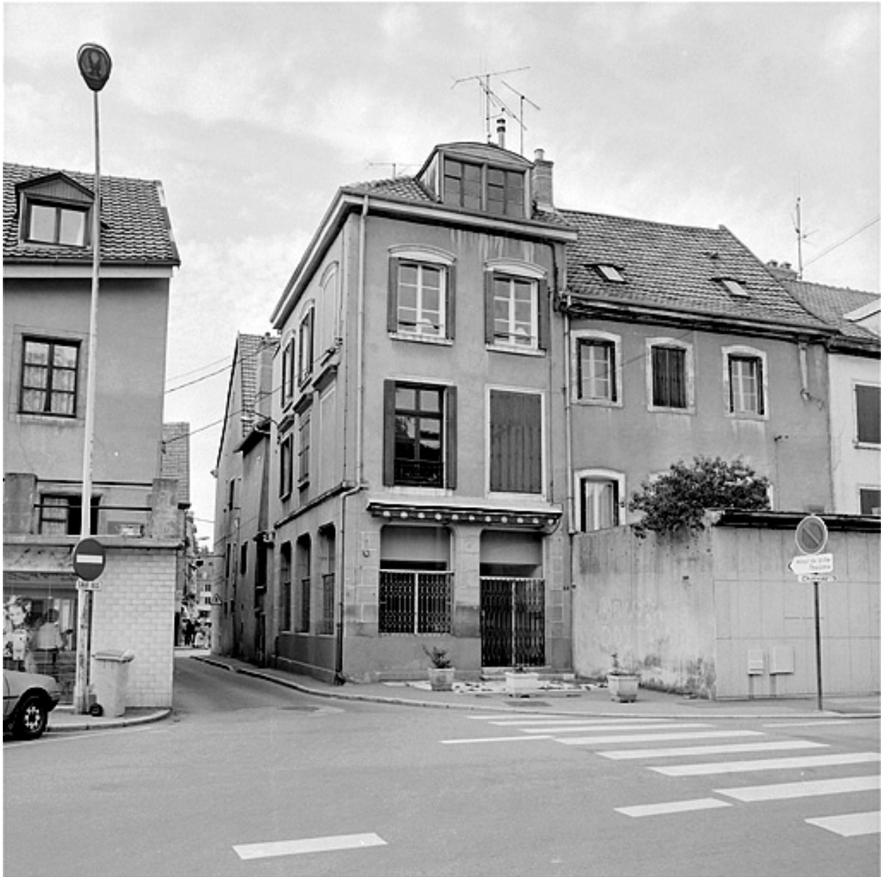
Façade sur la rue de la Schliffe.