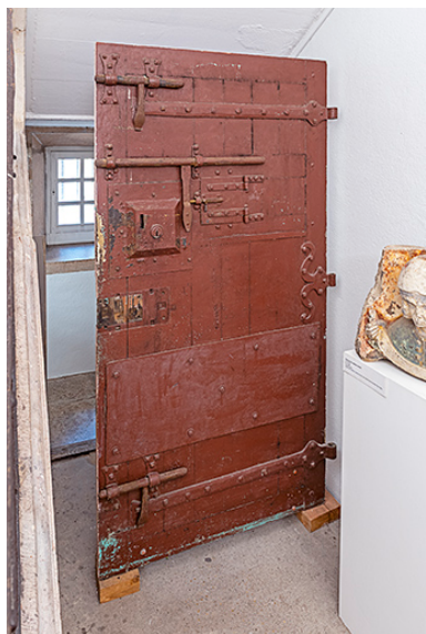
Face externe du vantail.