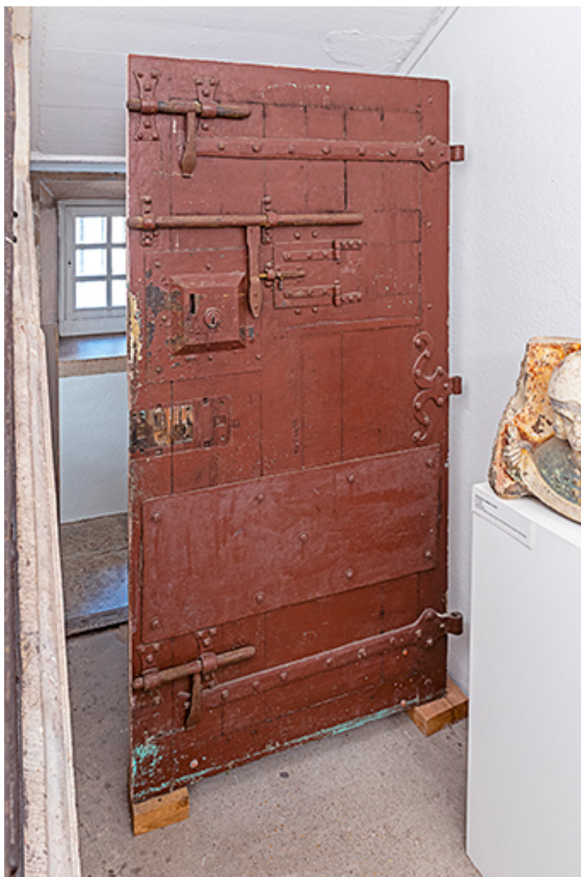
Face externe du vantail.