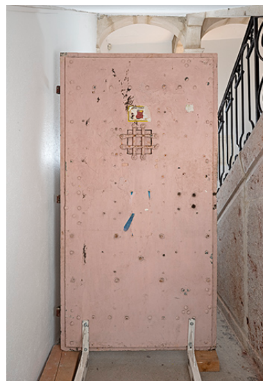
Face interne du vantail. IVR26_20257100405NUC4A