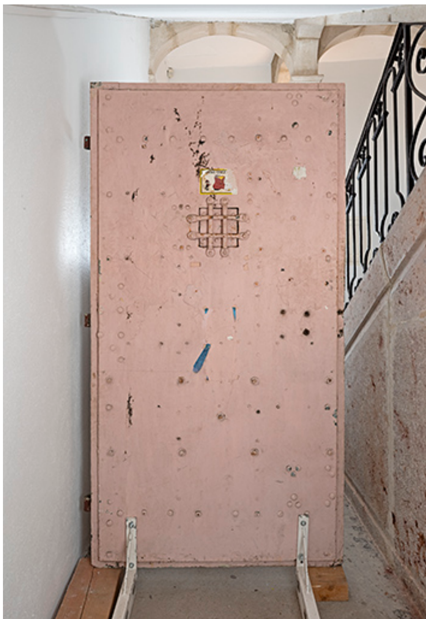
Face interne du vantail.