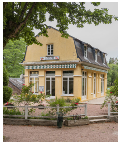
Pavillon des Fleurs après son agrandissement.