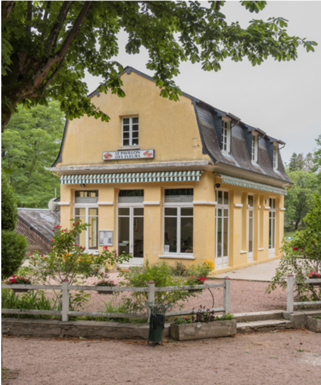
Pavillon des Fleurs après son agrandissement.