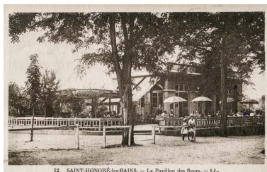
Pavillon des Fleurs avant son agrandissement. IVR26_20195800154NUC2A