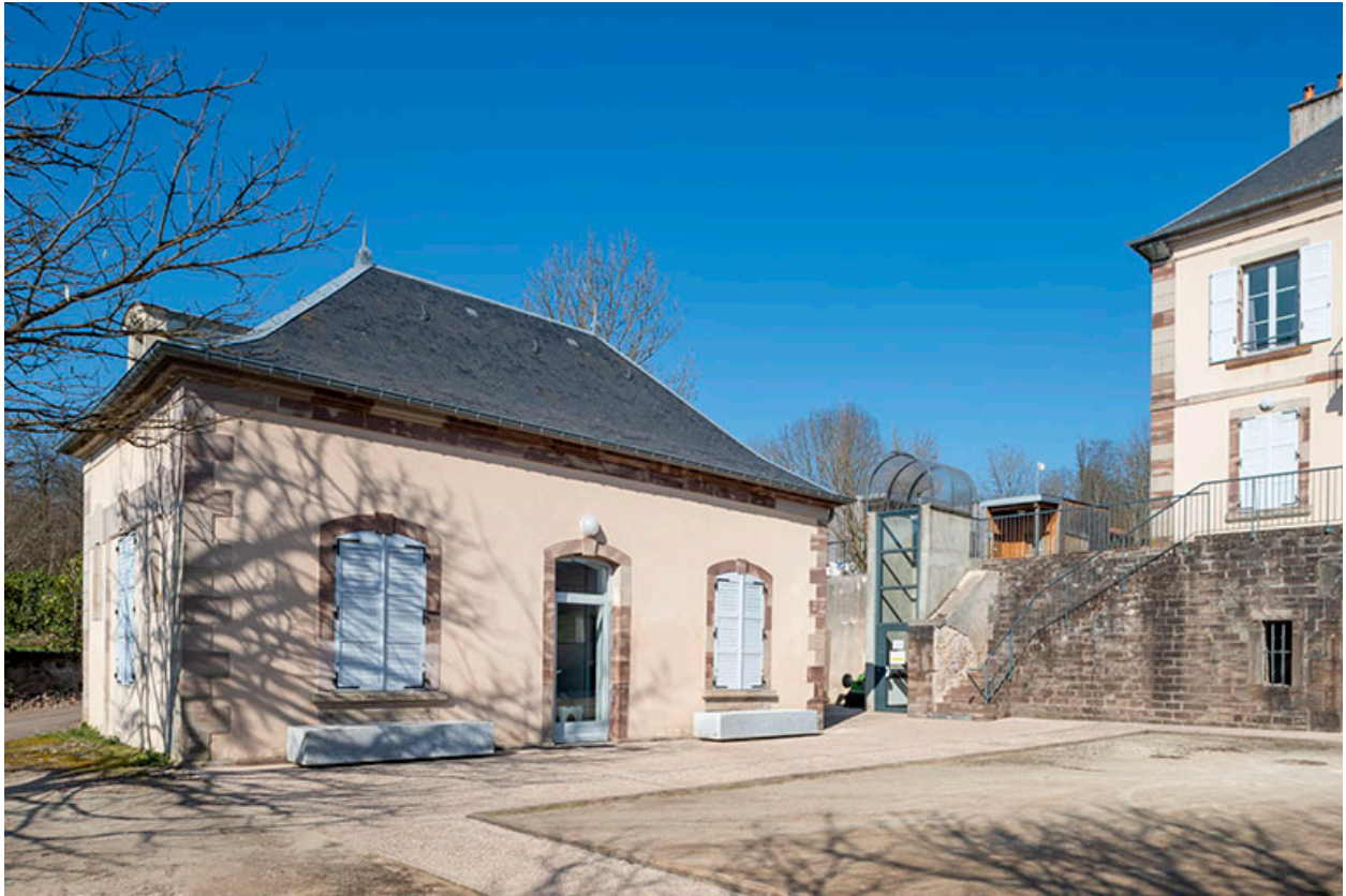
Aile de gauche.