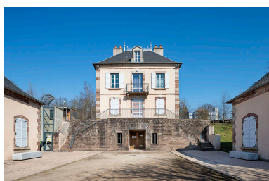
Corps central.