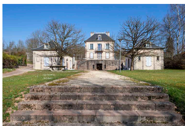
Vue d'ensemble. IVR43_20227000140NUC4A