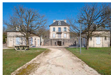
Vue d'ensemble (vue rapprochée). IVR43_20227000141NUC4A