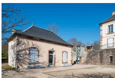
Aile de gauche.