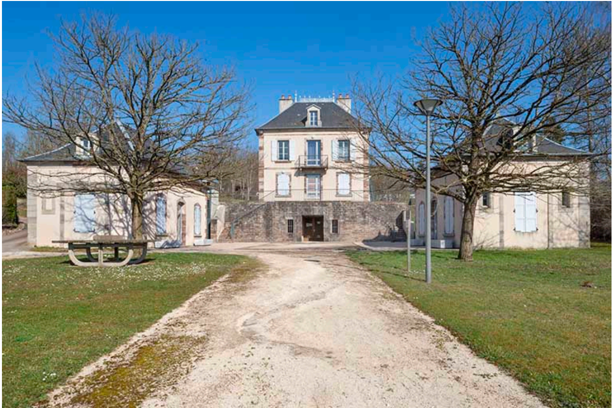
Vue d'ensemble (vue rapprochée).