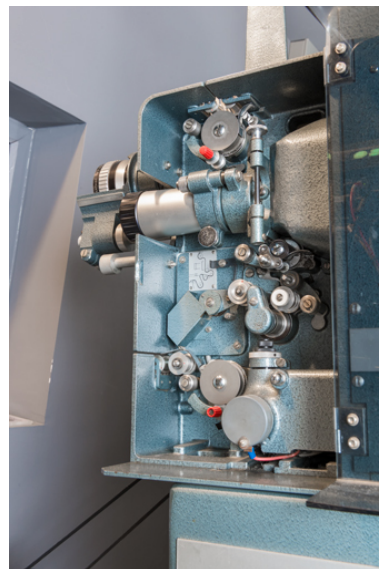
Chrono et objectif.