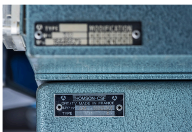
Plaque rivée à l'arrière du meuble (en haut à gauche). IVR26_20257100184NUC4A