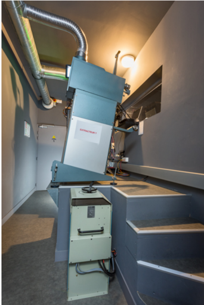
Vue d'ensemble, face droite.