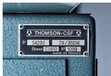
Plaque rivée à l'arrière du meuble (en haut à droite). IVR26_20257100182NUC4A