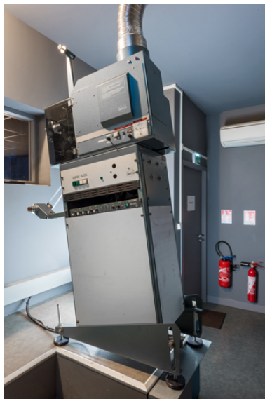
Face gauche. IVR26_20257100177NUC4A