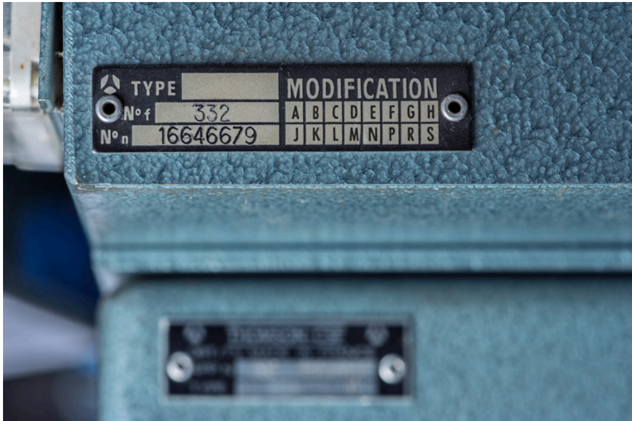
Plaque rivée à l'arrière de la lanterne.