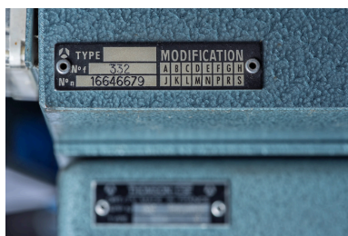
Plaque rivée à l'arrière de la lanterne. IVR26_20257100183NUC4A