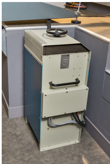
Redresseur IREM. IVR26_20257100179NUC4A