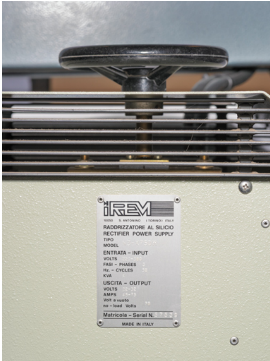
Plaque signalétique du redresseur IREM.