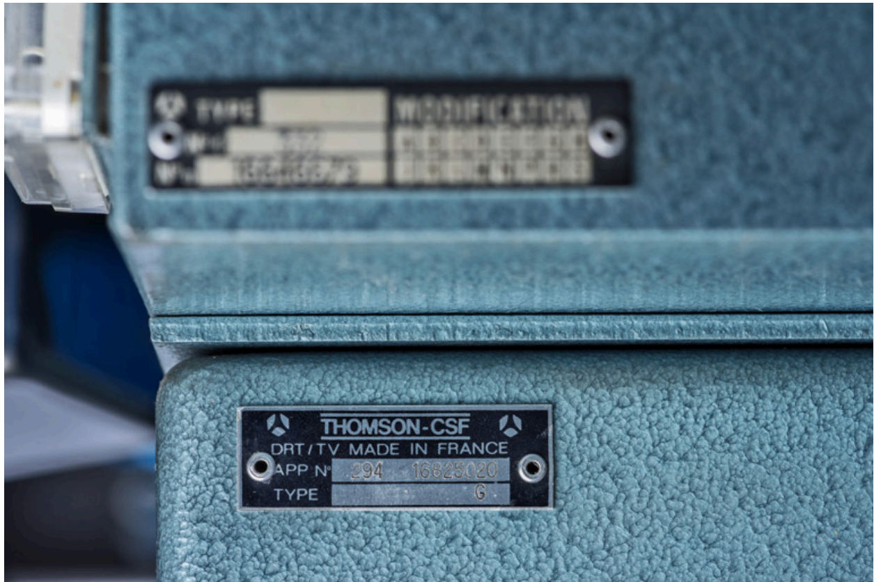
Plaque rivée à l'arrière du meuble (en haut à gauche).