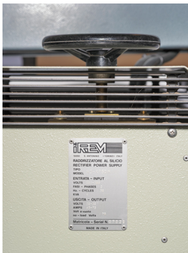
Plaque signalétique du redresseur IREM. IVR26_20257100180NUC4A