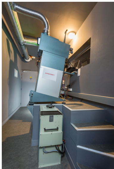
Vue d'ensemble, face droite.