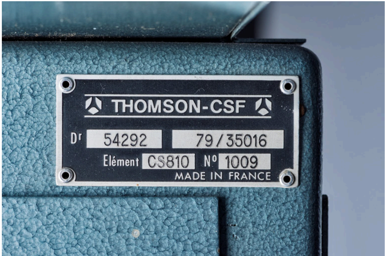
Plaque rivée à l'arrière du meuble (en haut à droite).