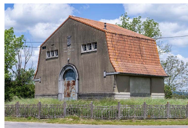
Face antérieure, de trois quarts avant droit. IVR43_20217000319NUC4A