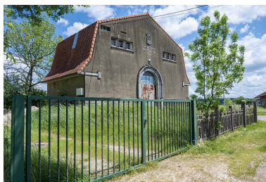
Face antérieure, de trois quarts gauche. IVR43_20217000321NUC4A