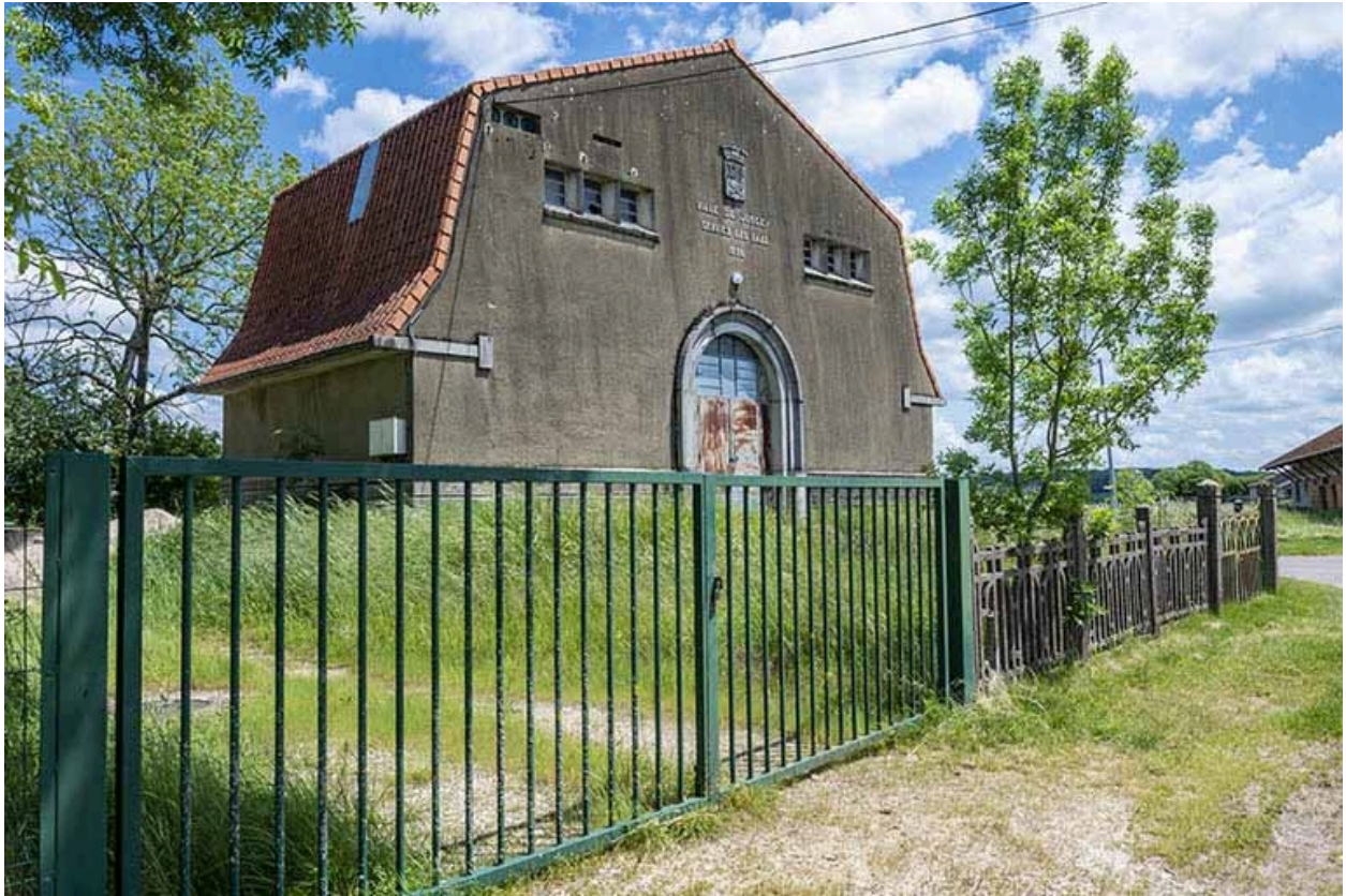
Face antérieure, de trois quarts gauche.