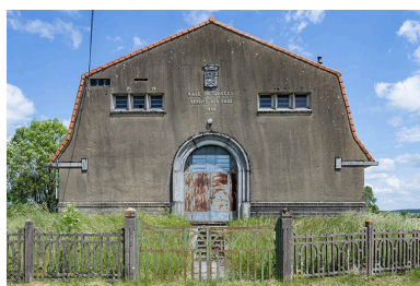
Face antérieure. IVR43_20217000320NUC4A