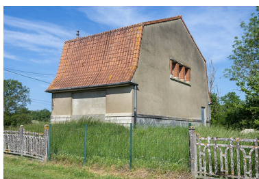
Trois quarts arrière droit.