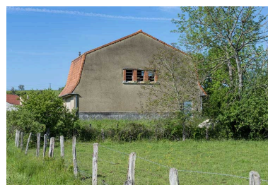
Arrière du bâtiment.