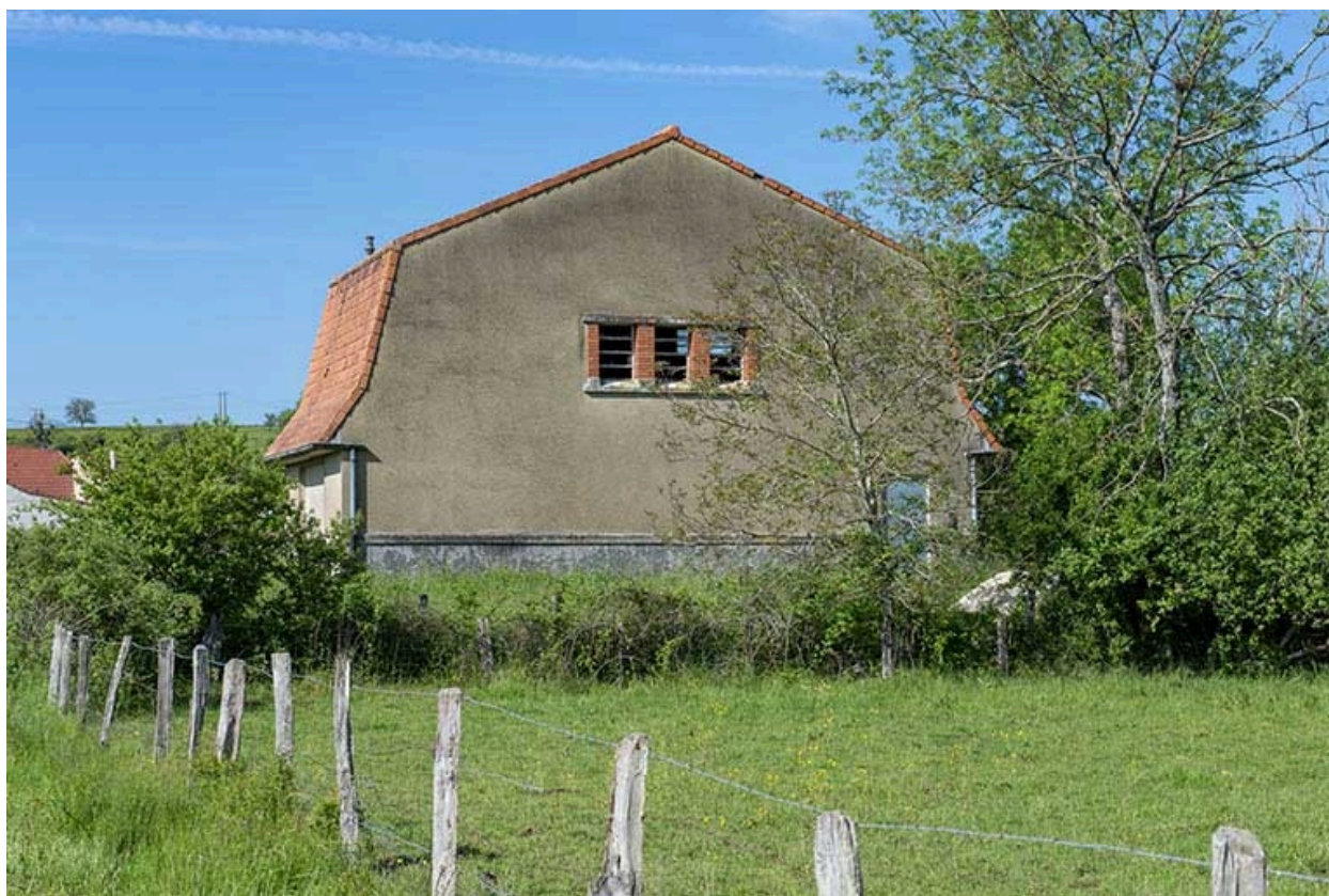
Arrière du bâtiment.