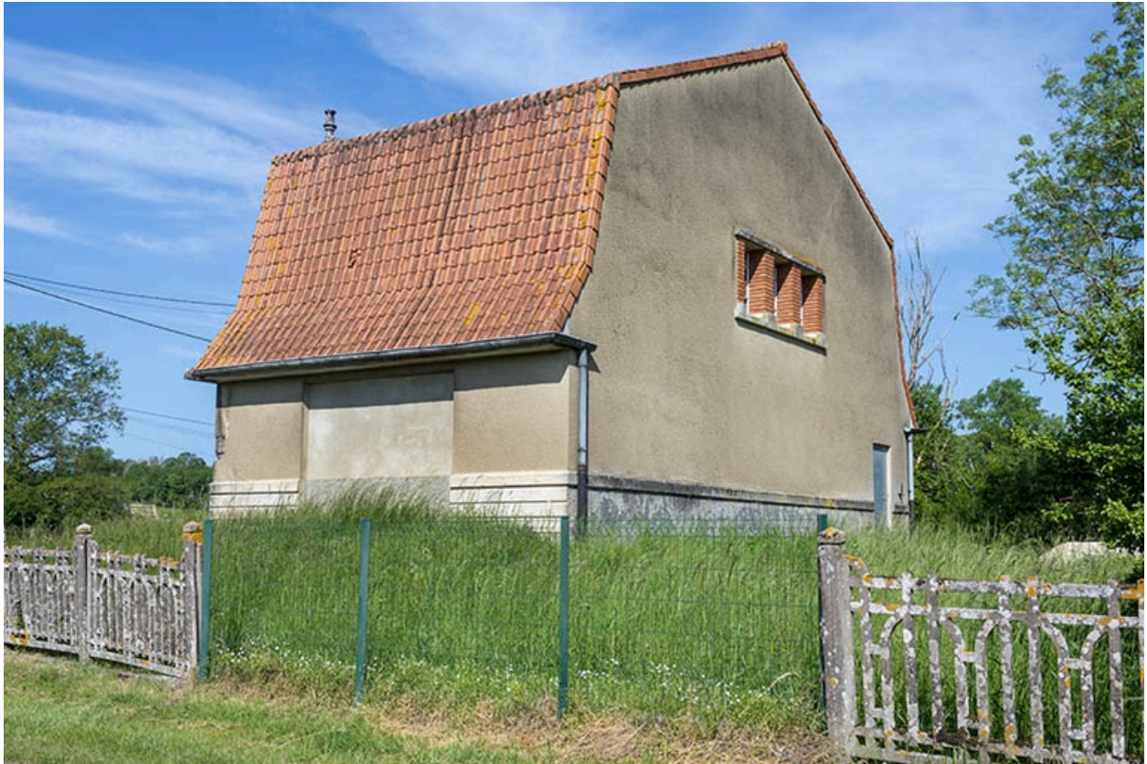
Trois quarts arrière droit.