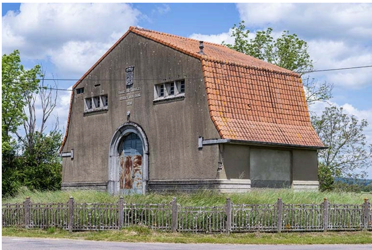
Face antérieure, de trois quarts avant droit.