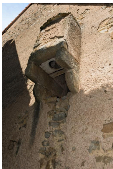
Latrine (mur pignon ouest de la maison Mommessin) IVR26_20187100169NUC4A