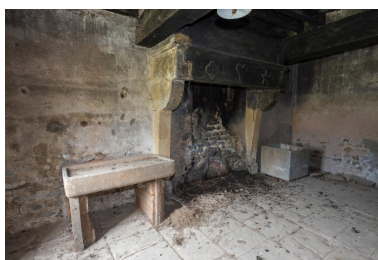
Vue intérieure de la cuisine (ancienne chambre) de la maison Mommessin