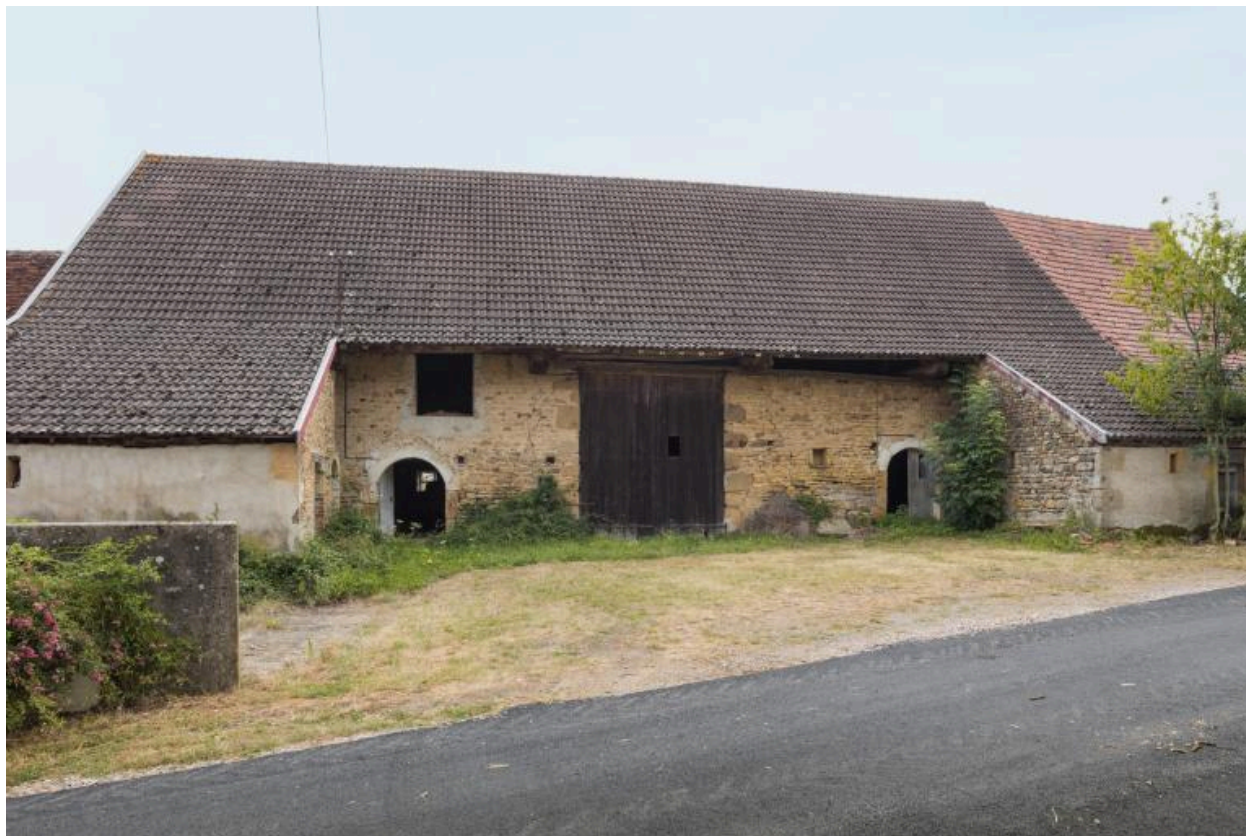
Vue de la façade antérieure de la grange