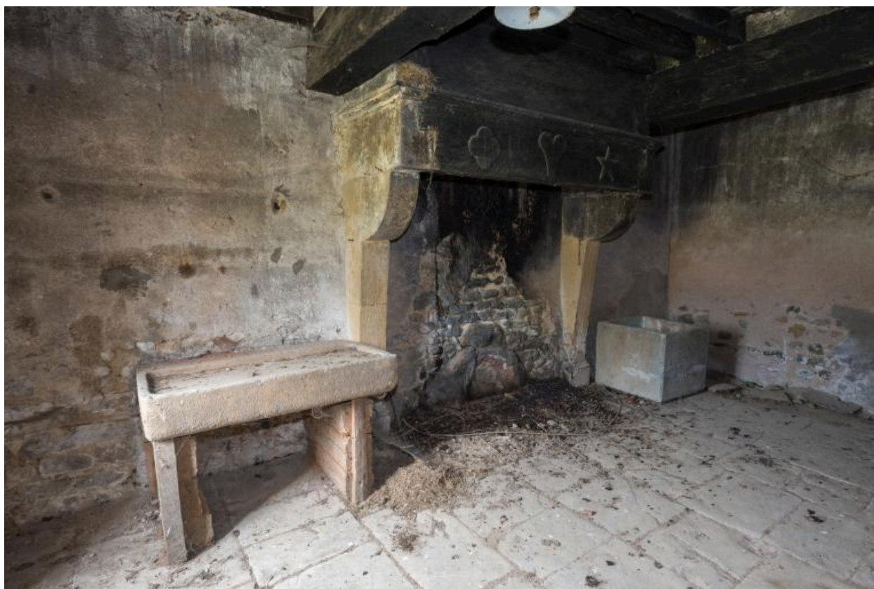
Vue intérieure de la cuisine (ancienne chambre) de la maison Mommessin