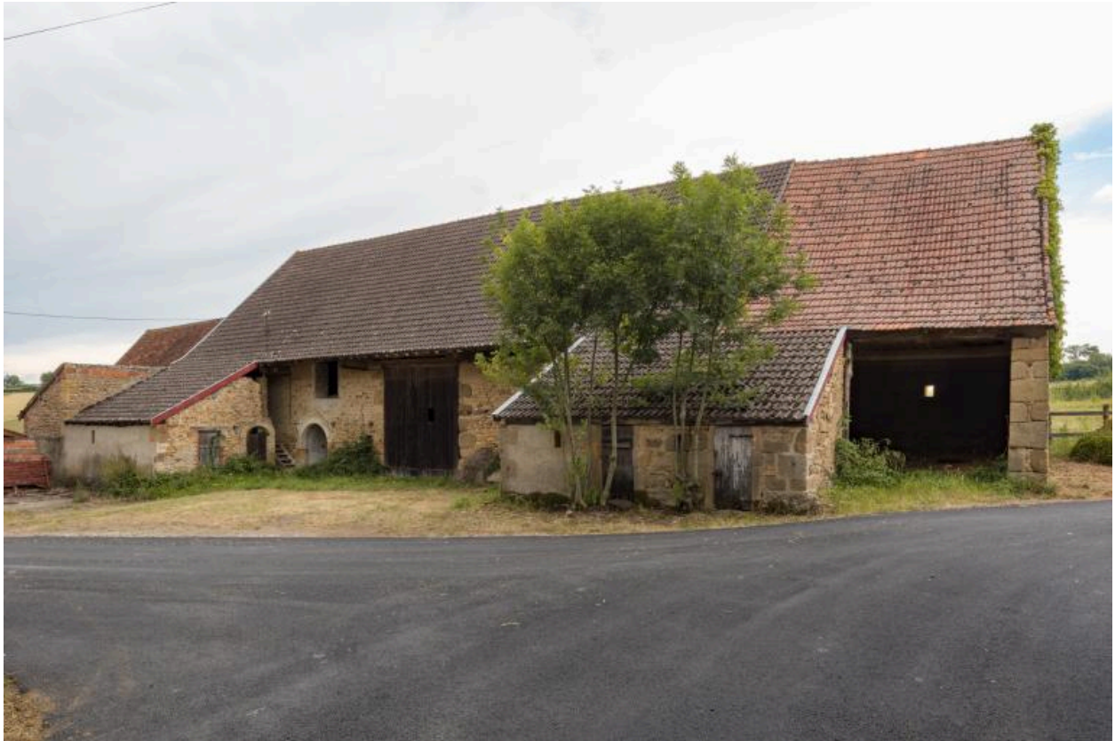
Vue de la façade antérieure de la grange