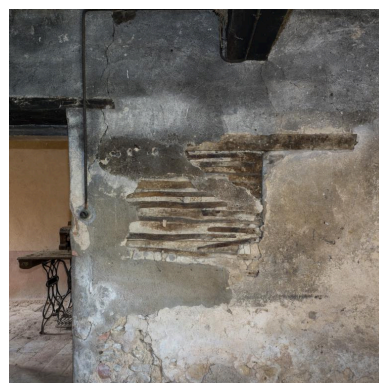
Détail de la cloison de la cuisine (ancienne chambre) de la maison Mommessin IVR26_20187100171NUC2A