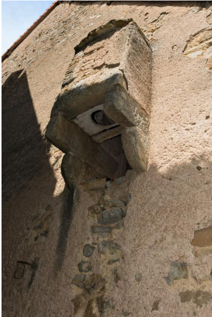
Latrine (mur pignon ouest de la maison Mommessin)