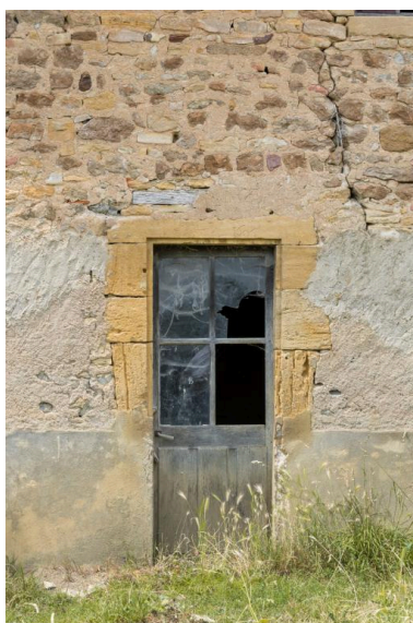
Porte (ancienne fenêtre) sur la façade postérieure de la maison, portant la date de 1691 IVR26_20187100167NUC4A