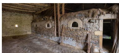
Vue intérieure de la grange (remise, mur de séparation avec l'étable, percé de feurons, et fenil)