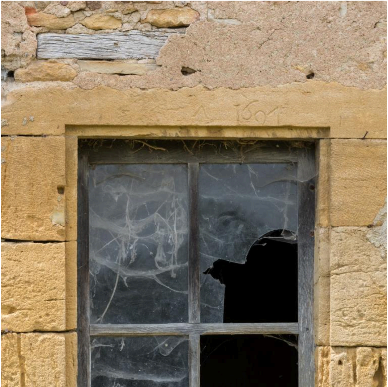
Détail de la date sur le linteau de la porte (façade postérieure de la maison Mommessin)