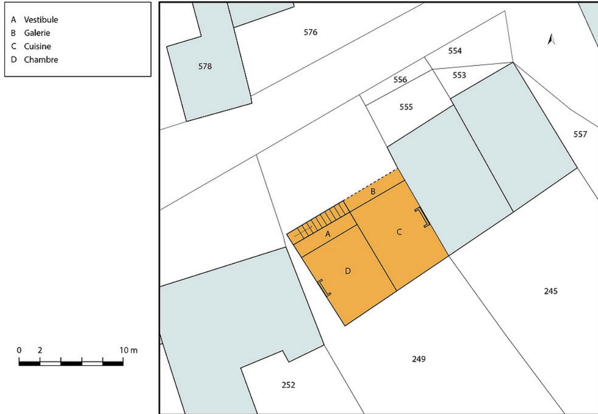
Plan de masse et de situation de la maison "Mommessin". Extrait du plan cadastral, 2020, section A, échelle 1/1000