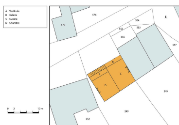
Plan de masse et de situation de la maison "Mommessin". Extrait du plan cadastral, 2020, section A, échelle 1/1000 IVR26_20207100121NUDA