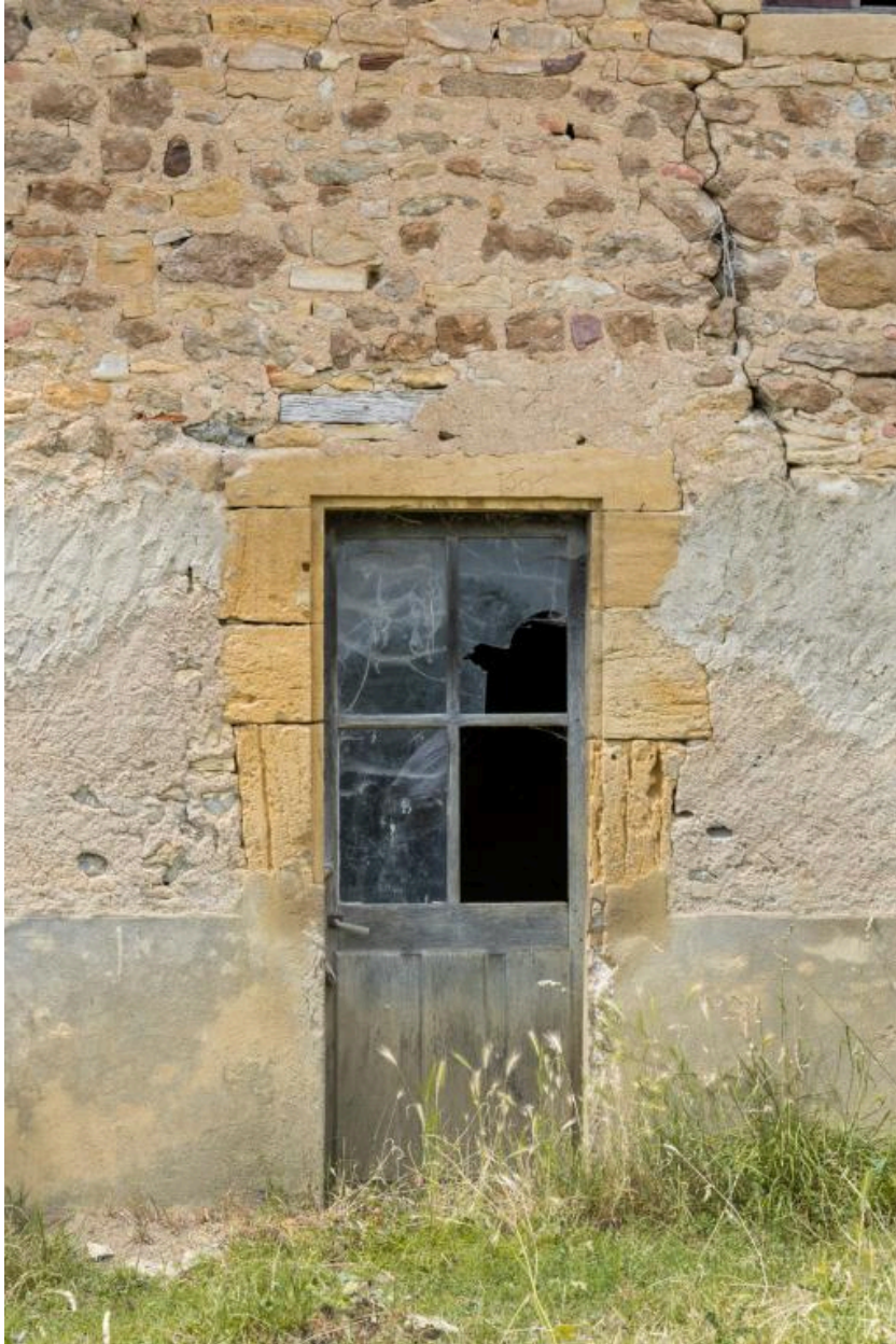
Porte (ancienne fenêtre) sur la façade postérieure de la maison, portant la date de 1691