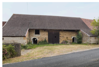
Vue de la façade antérieure de la grange IVR26_20187100151NUC4A