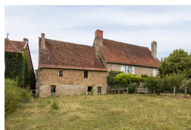
Vue de la façade postérieure de la maison Mommessin IVR26_20187100166NUC4A