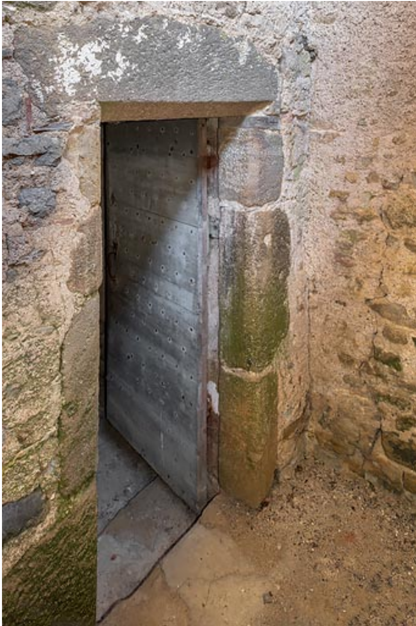
Porte chanfreinée donnant accès à la galerie et qui était vraisemblablement la porte d'entrée d'origine de la maison.