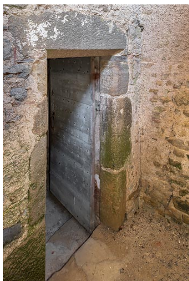
Porte chanfreinée donnant accès à la galerie et qui était vraisemblablement la porte d'entrée d'origine de la maison.