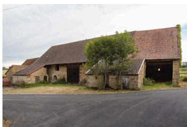
Vue de la façade antérieure de la grange IVR26_20187100150NUC4A