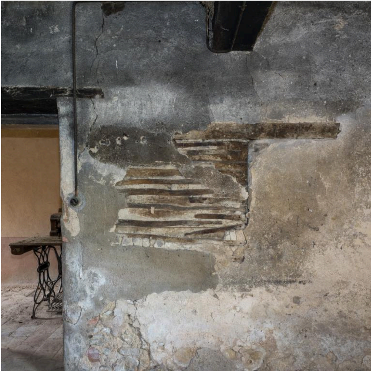
Détail de la cloison de la cuisine (ancienne chambre) de la maison Mommessin