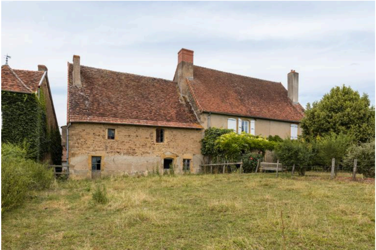
Vue de la façade postérieure de la maison Mommessin