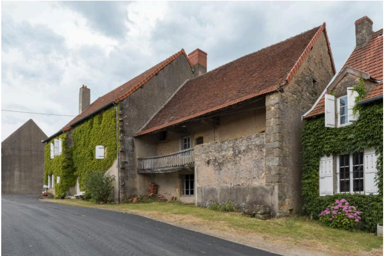
Façade antérieure de la maison Mommessin (à droite), mitoyenne avec la maison, dite "d'Antoine Despierres"