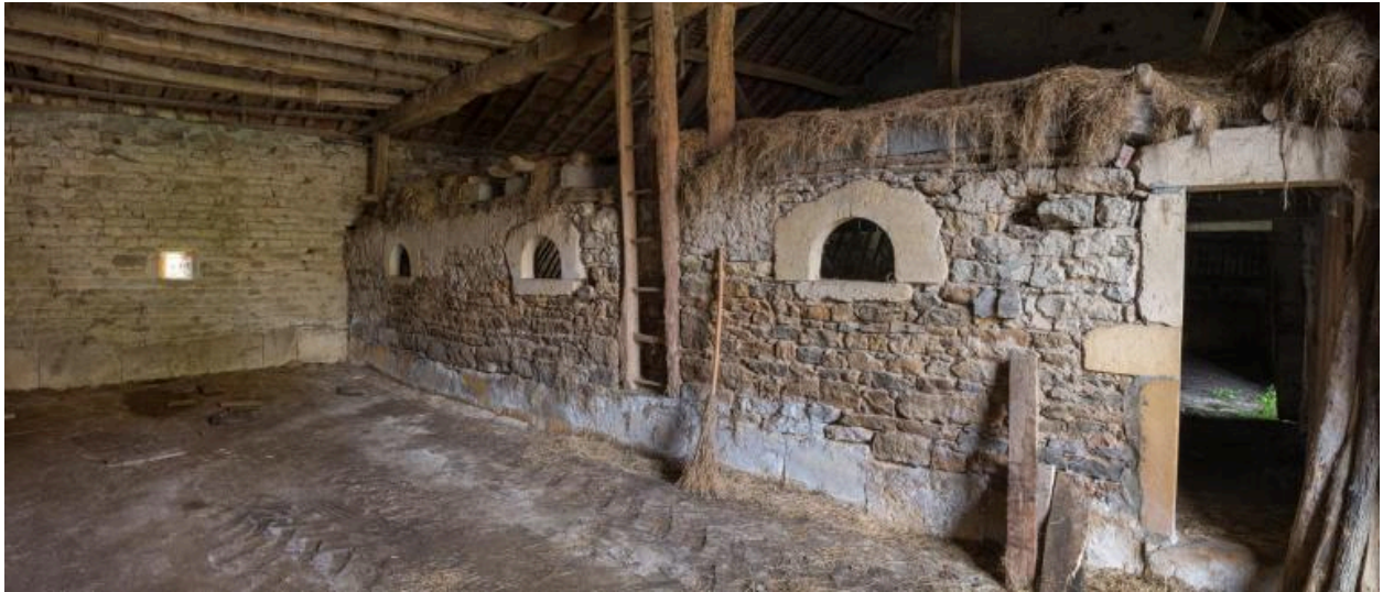
Vue intérieure de la grange (remise, mur de séparation avec l'étable, percé de feurons, et fenil)