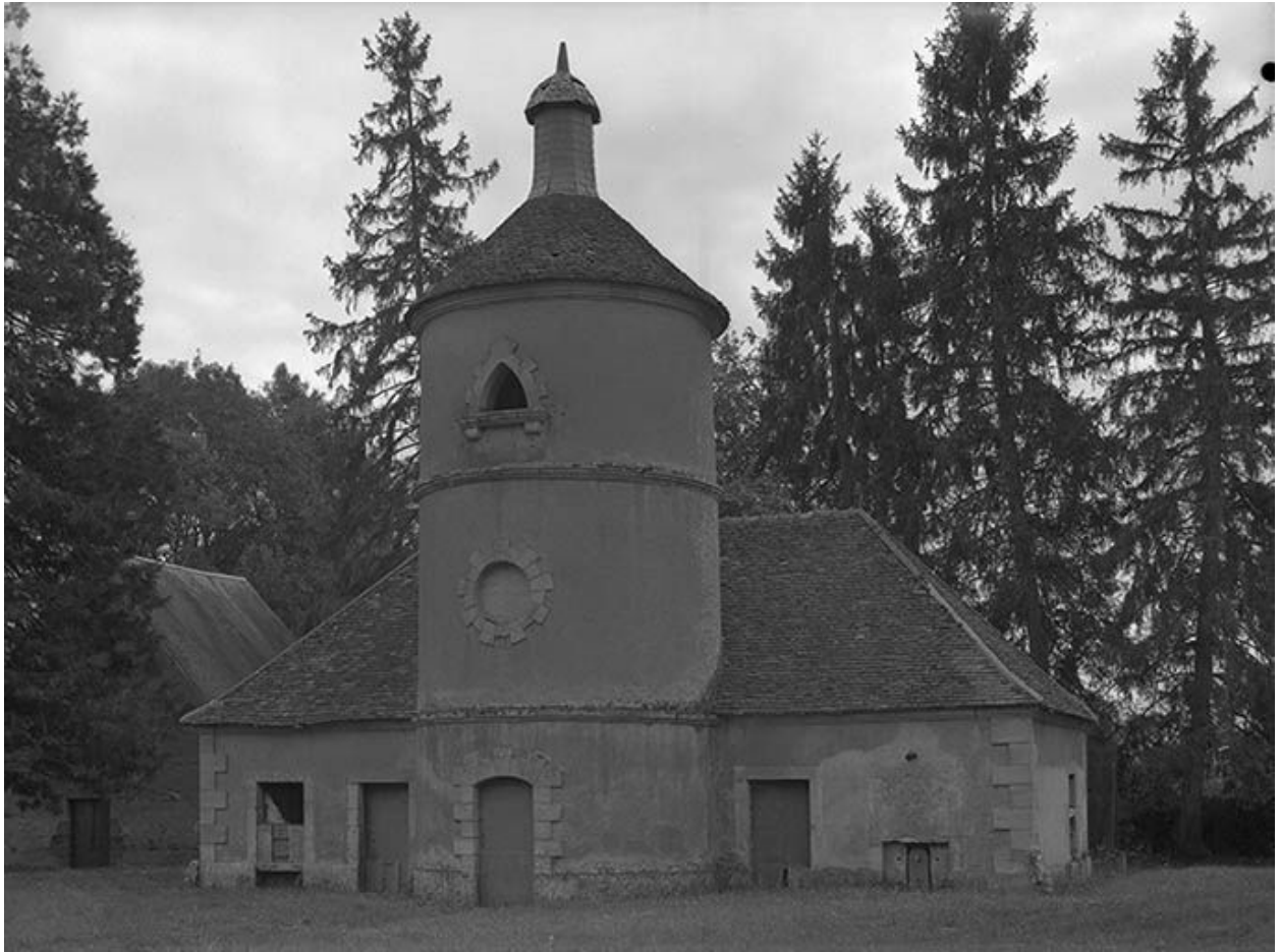
Chenil et colombier.