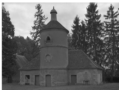
Chenil et colombier. IVR26_19755800537V