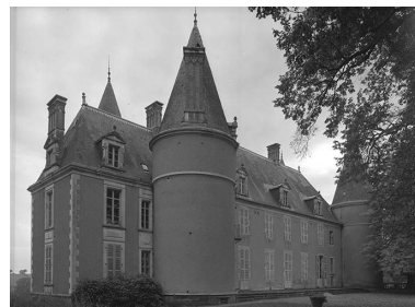
Façade antérieure du logis. IVR26_19755800532V