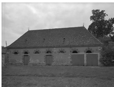
Ecuries. IVR26_19755800536V