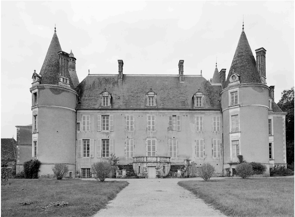
Façade postérieure du logis.