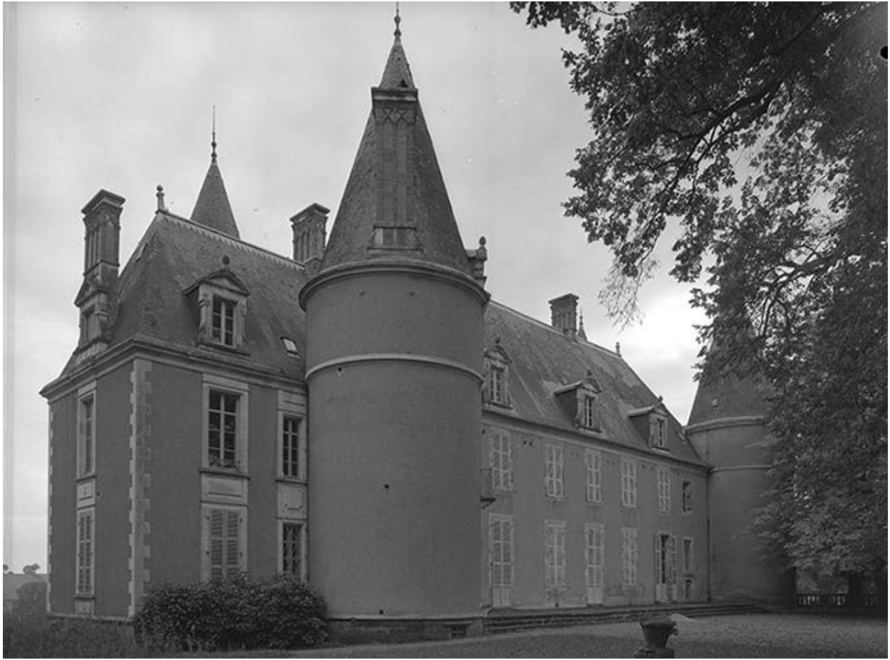
Façade antérieure du logis.