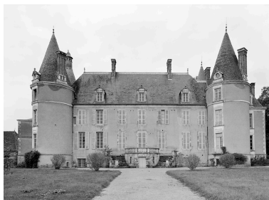
Façade postérieure du logis. IVR26_19755800535V