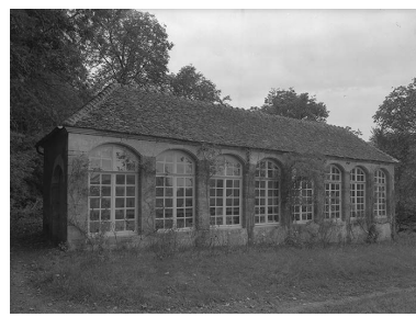
Serre. IVR26_19755800533V