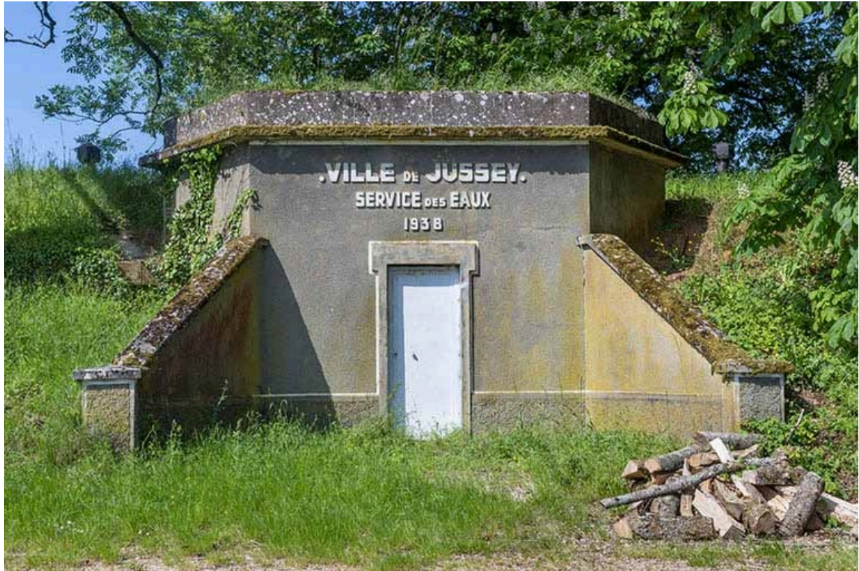
La face antérieure.