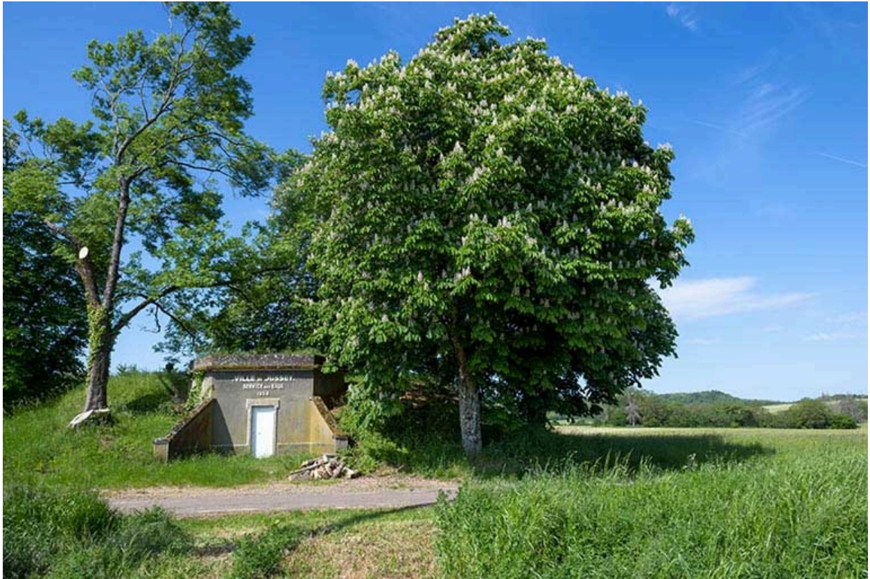
Le chateau d'eau dans son contexte.