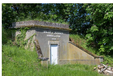
Façade antérieure, de trois quarts gauche. IVR43_20217000309NUC4A