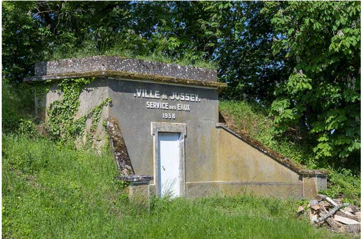
Face antérieure, de trois quarts gauche.