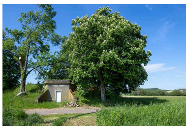
Le chateau d'eau dans son contexte. IVR43_20217000310NUC4A