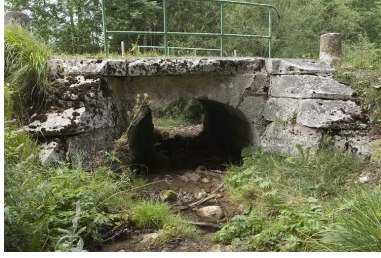
Pont du ruisseau de la Goulette (n° 18), vu depuis l'amont. IVR43_20092501619NUC2A