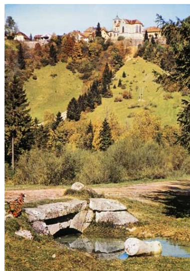
[Pont du ruisseau de la Goulette (n° 18), vu depuis l'amont], [3e quart 20e siècle].