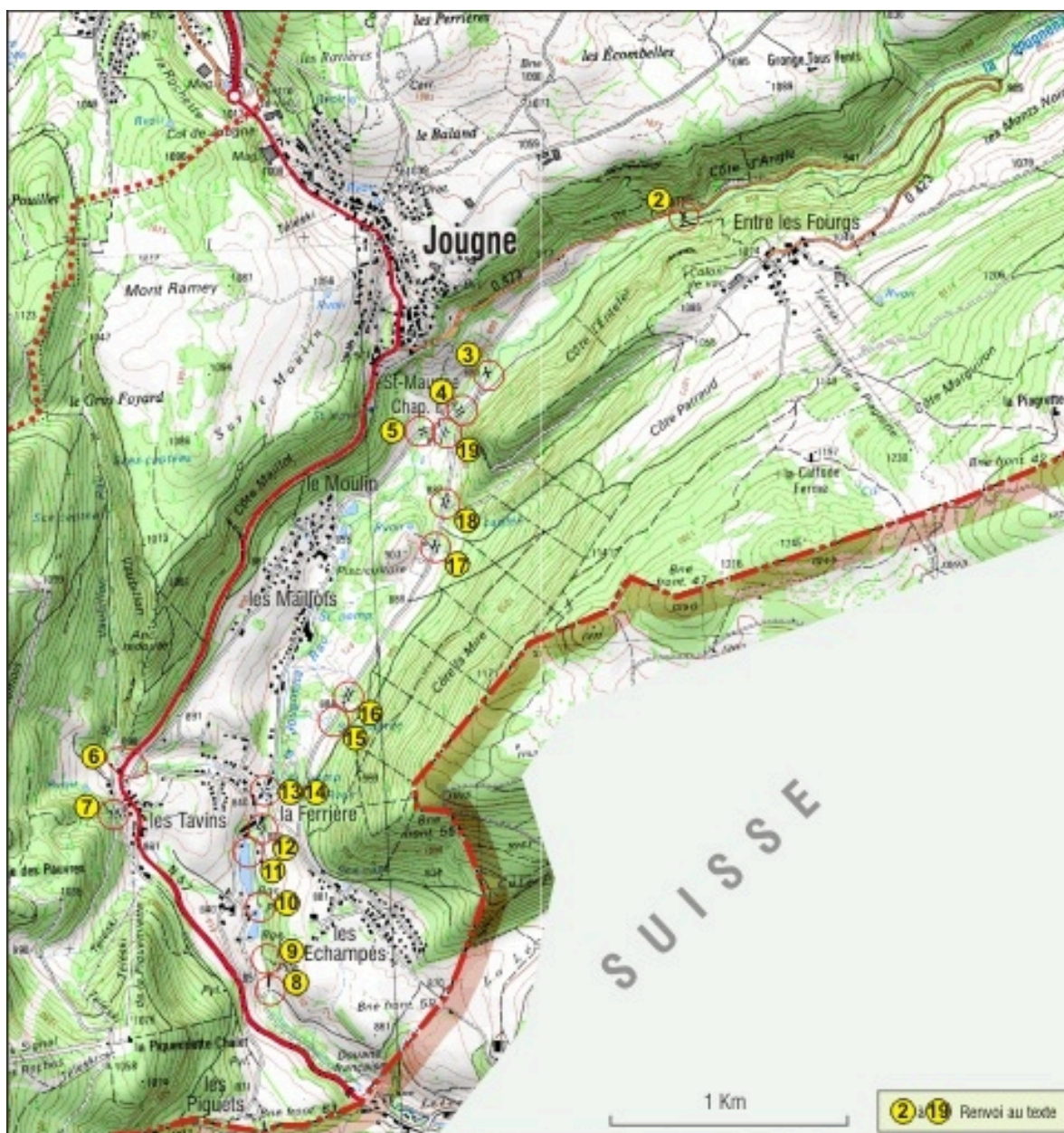
Carte de localisation des ponts, partie sud. Extrait de la carte IGN, échelle 1/25 000.