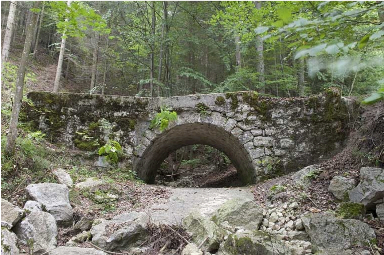
Pont sur le ruisseau de la Grange des Pauvres (n° 7), vu depuis l'aval.