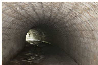
Intérieur du pont-aqueduc du Vaubillon (n° 6) en direction de la Ferrière.