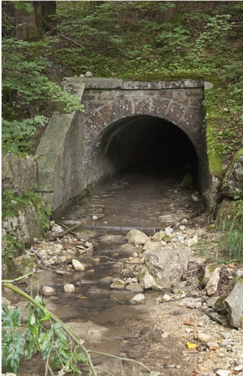
L'entrée du pont-aqueduc du Vaubillon (n° 6), aux Tavins.