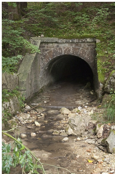
L'entrée du pont-aqueduc du Vaubillon (n° 6), aux Tavins.