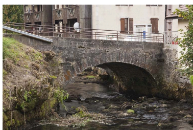
Pont sur la Jougne (n° 13), vu depuis l'amont.