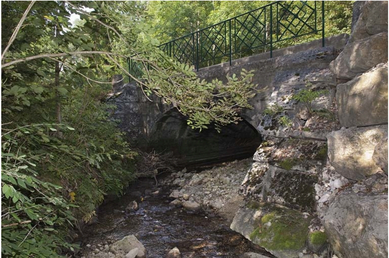
Pont sur la Jougne (n° 3), vu depuis l'aval.