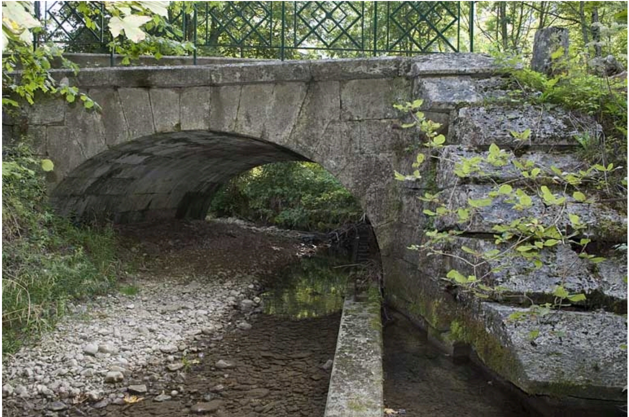
Pont sur la Jougne (n° 3), vu depuis l'amont.