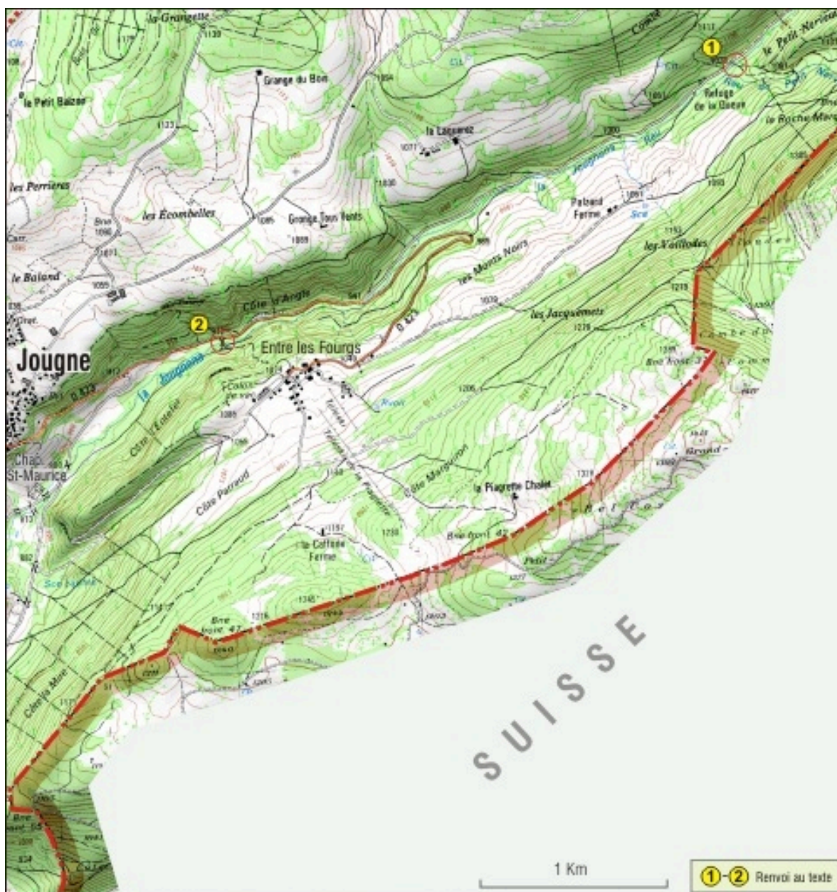
Carte de localisation de ponts, partie nord-est. Extrait de la carte IGN, échelle 1/25 000.