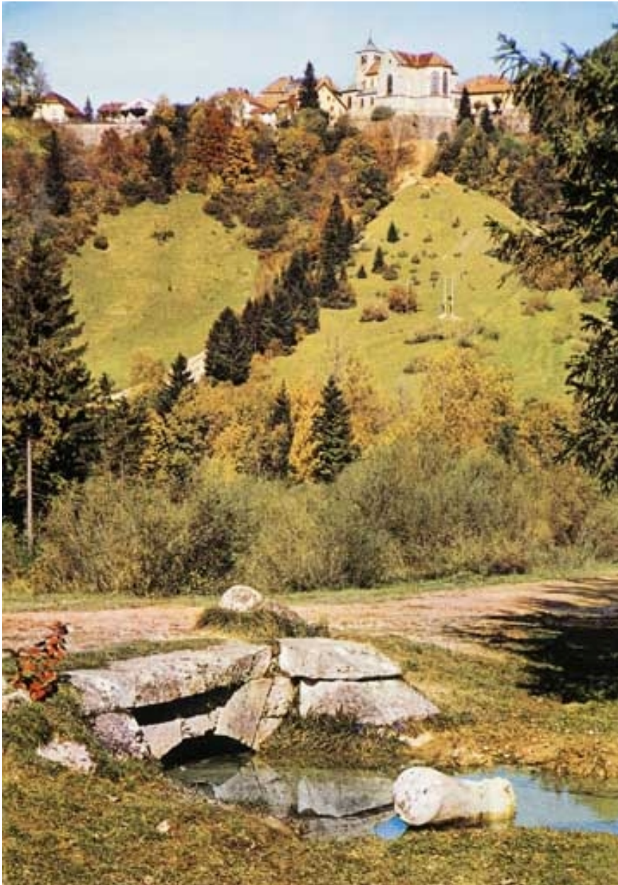
[Pont du ruisseau de la Goulette (n° 18), vu depuis l'amont], [3e quart 20e siècle].