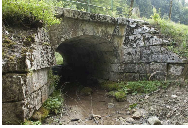
Pont du ruisseau de la Goulette (n° 18), vu depuis l'aval. IVR43_20092501620NUC2A