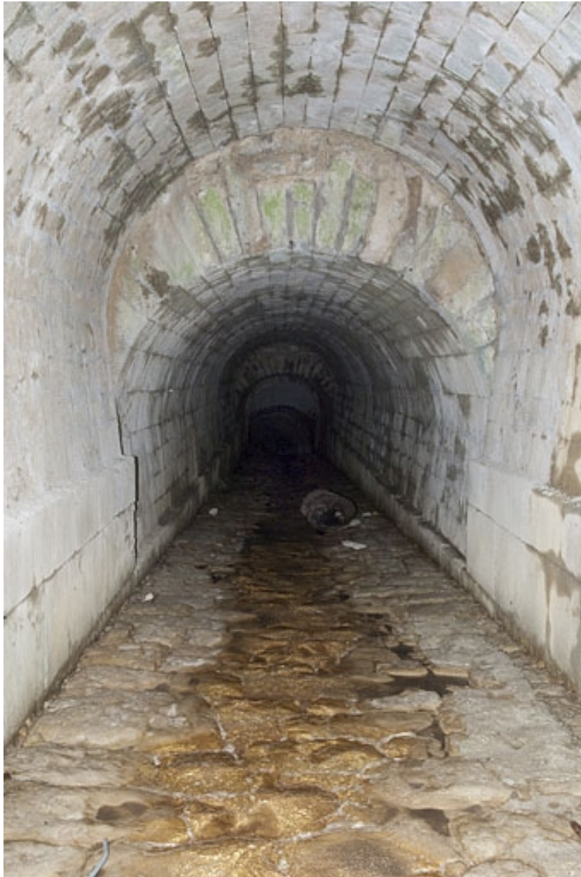
Détail de la voûte du pont-aqueduc du Vaubillon (n° 6).