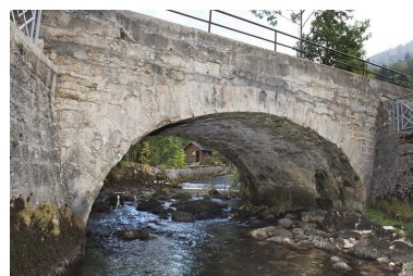
Pont sur la Jougne (n° 13), vu depuis l'aval. IVR43_20092501610NUC2A