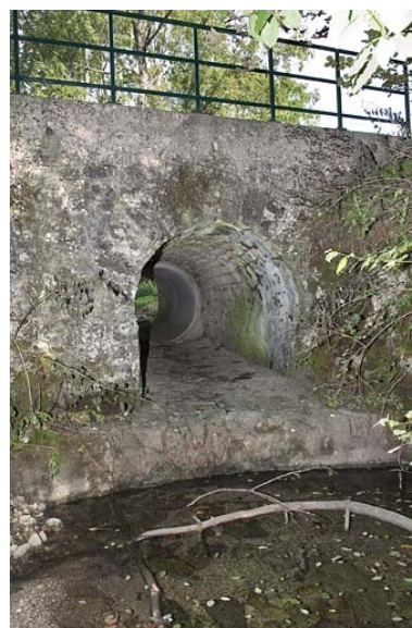
Pont sur la Servante (n ° 5), vu depuis l'aval.