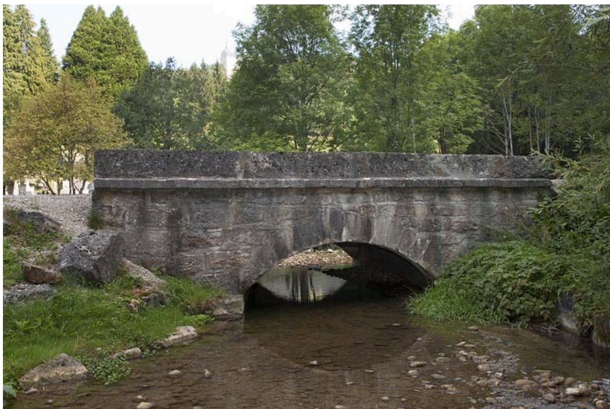
Pont sur la Jougne (n° 4), vu depuis l'aval.