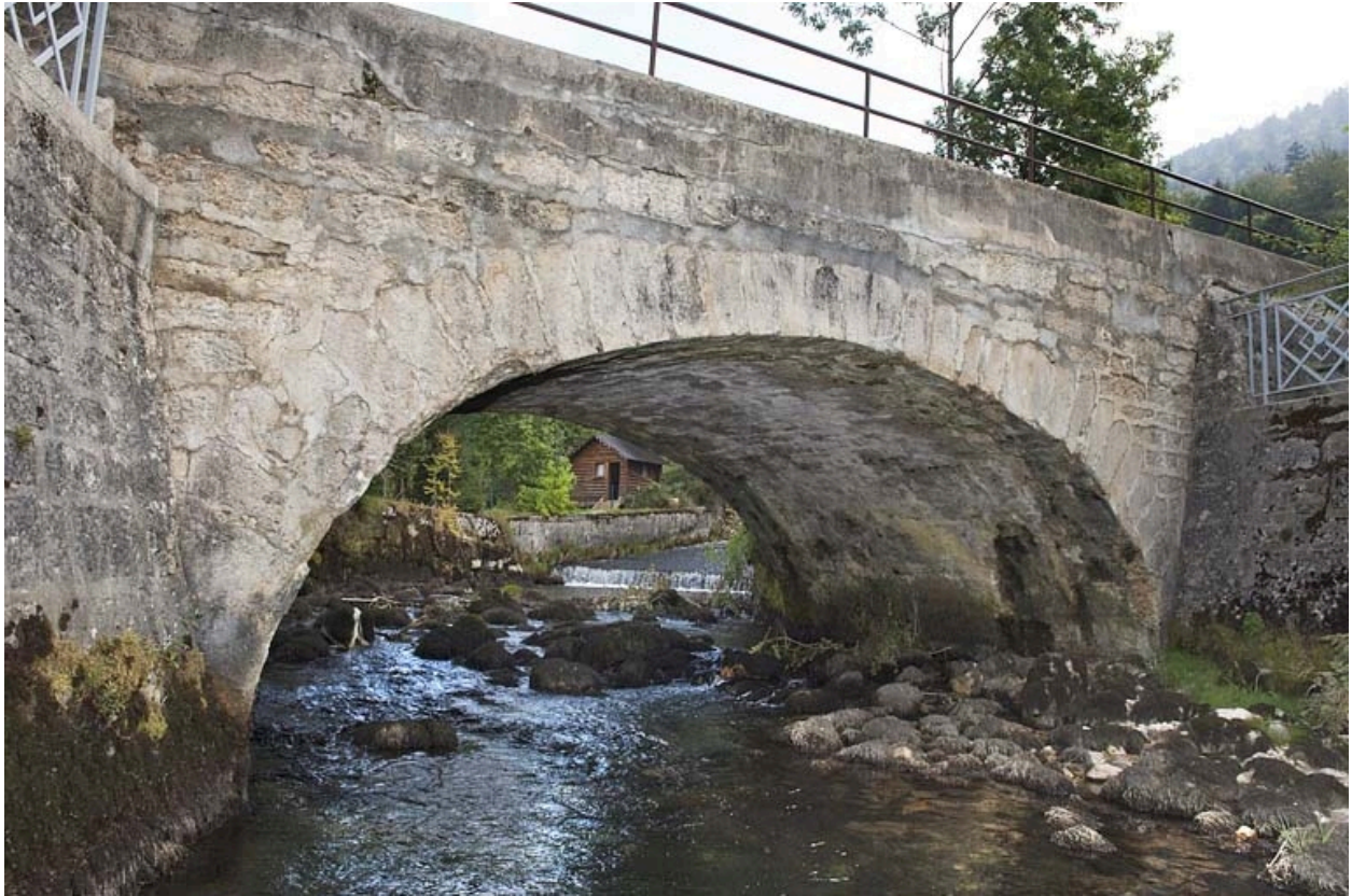
Pont sur la Jougne (n° 13), vu depuis l'aval.