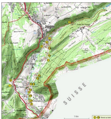
Carte de localisation des ponts, partie sud. Extrait de la carte IGN, échelle 1/25 000. IVR43_20112500070NUDA