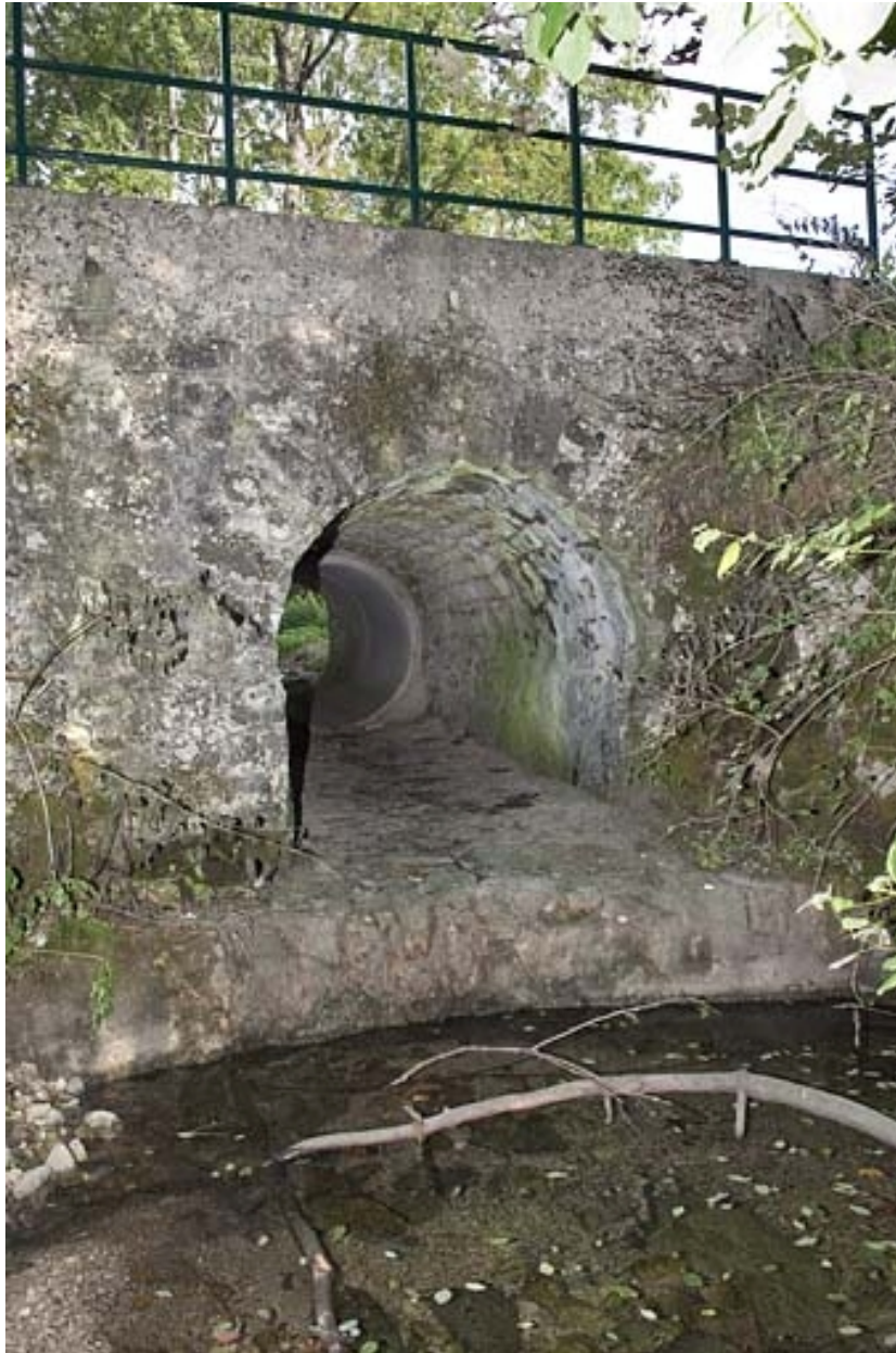
Pont sur la Servante (n° 5), vu depuis l'aval.