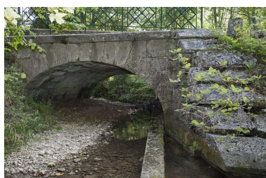
Pont sur la Jougne (n ° 3), vu depuis l'amont. IVR43_20092501605NUC2A