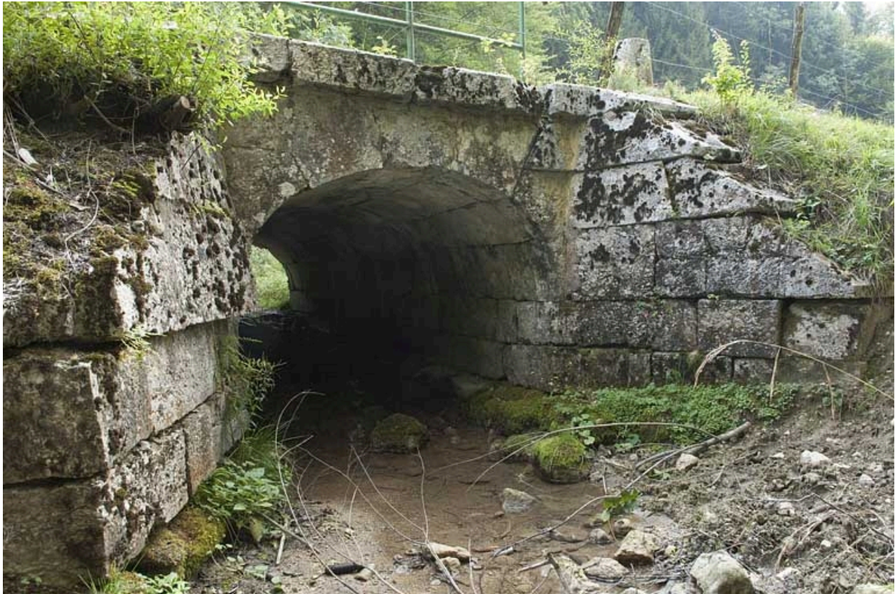
Pont du ruisseau de la Goulette (n° 18), vu depuis l'aval.