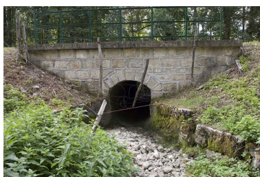
Pont sur la Servante (n ° 5), vu depuis l'amont. IVR43_20092501609NUC2A