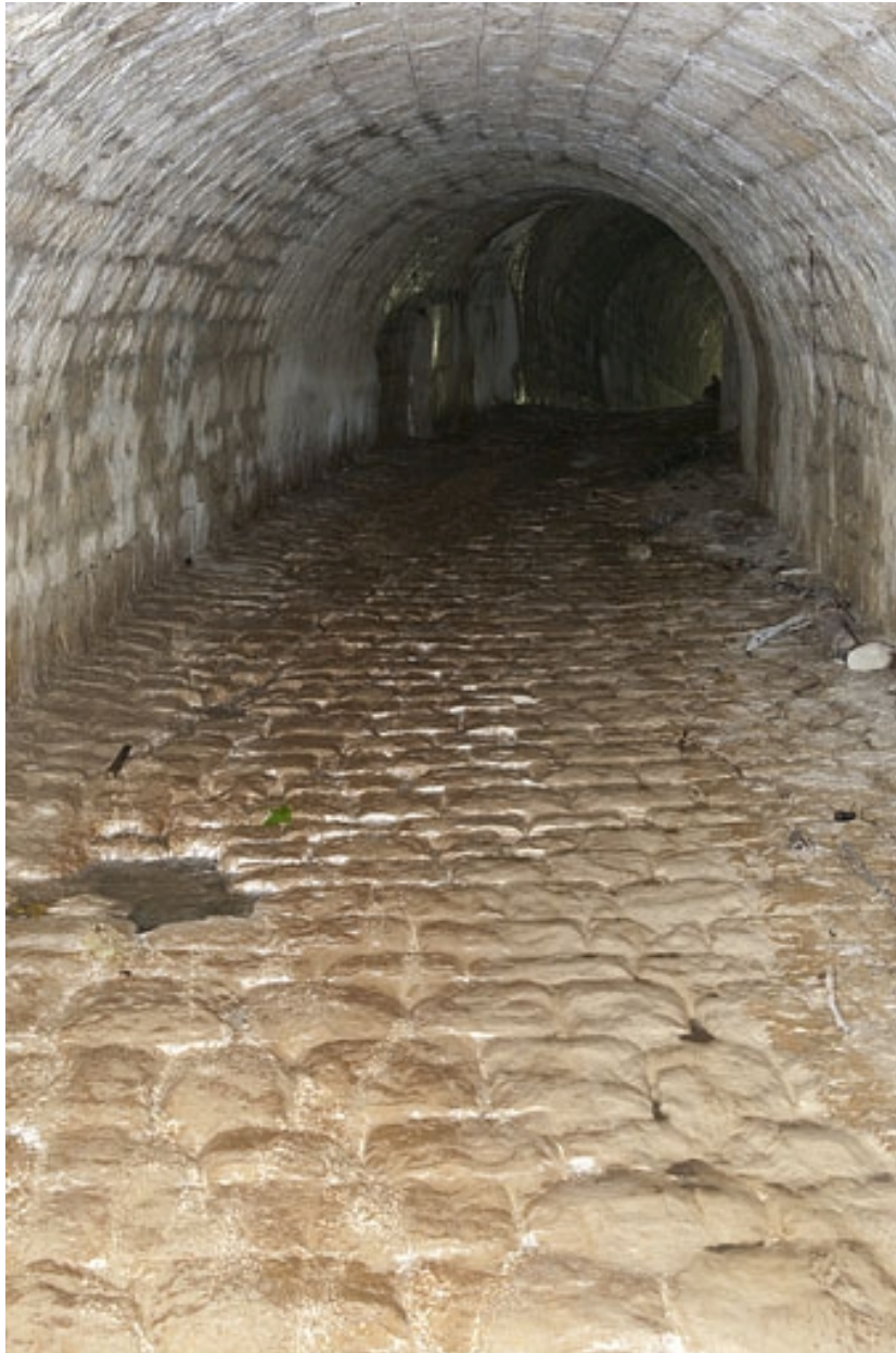
Intérieur du pont-aqueduc du Vaubillon (n° 6), détail du pavage.