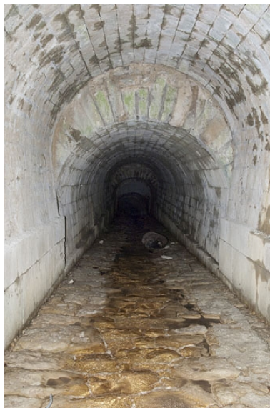
Détail de la voûte du pont-aqueduc du Vaubillon (n° 6). IVR43_20092501613NUC2A