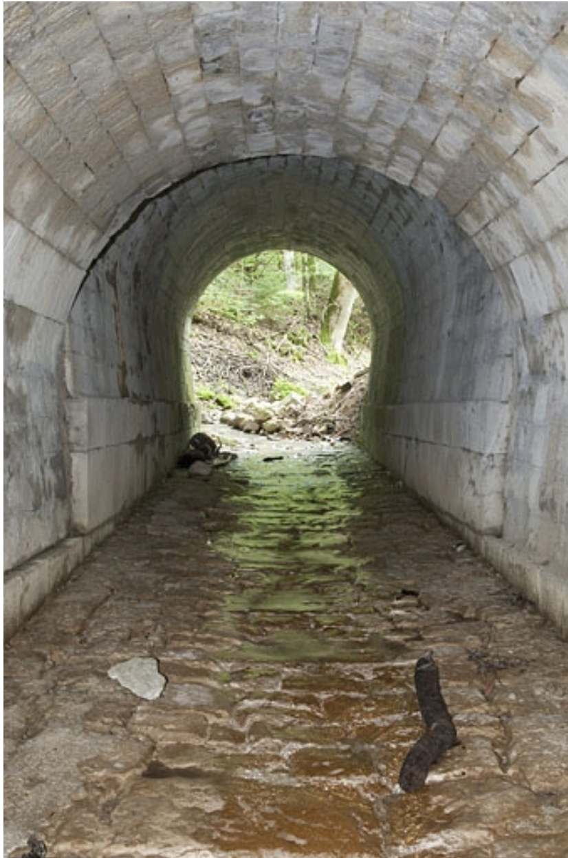
Intérieur du pont-aqueduc (n° 6) en direction des Tavins.