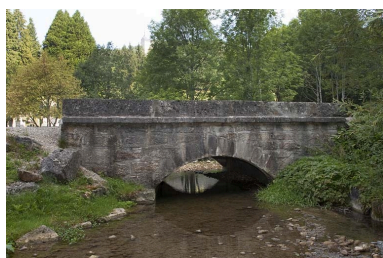
Pont sur la Jougne (n ° 4), vu depuis l'aval. IVR43_20092501607NUC2A