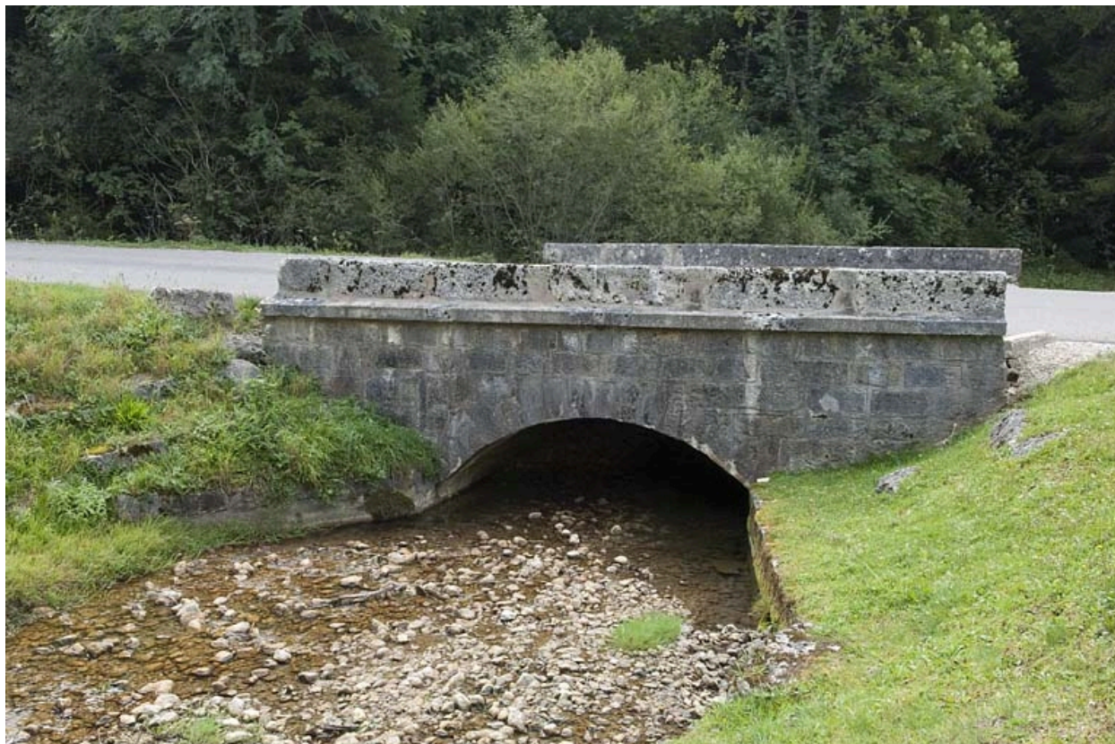
Pont sur la Jougne (n° 4), vu depuis l'amont.