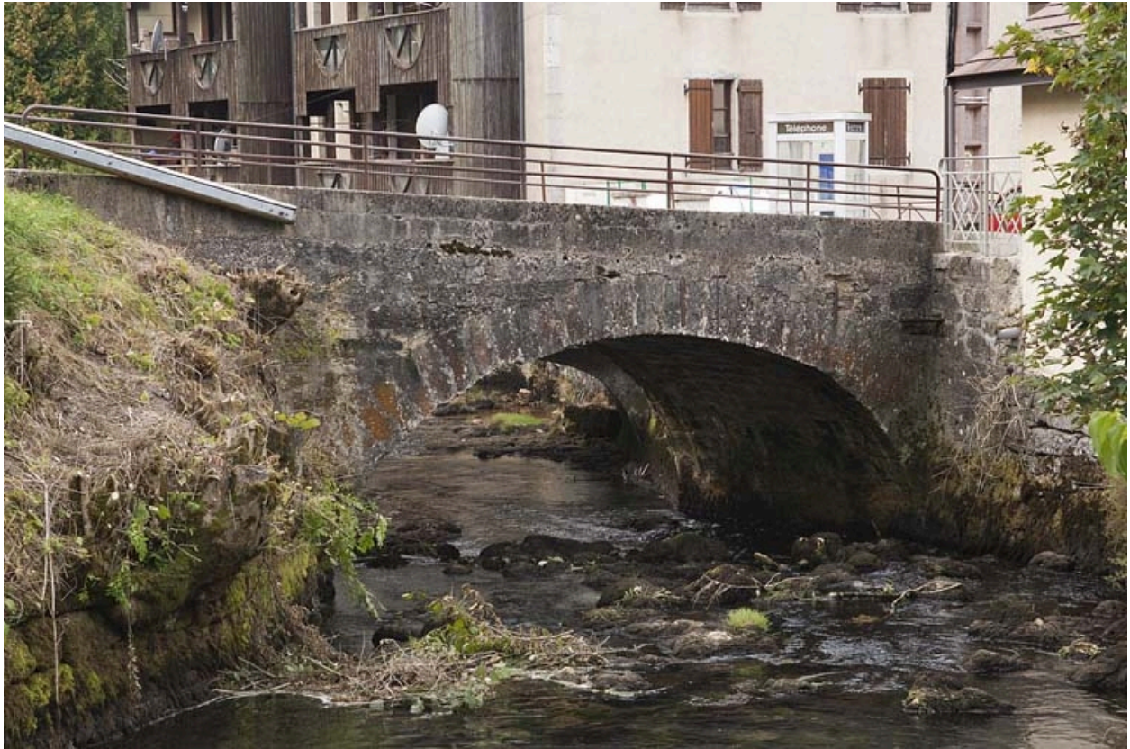
Pont sur la Jougne (n° 13), vu depuis l'amont.