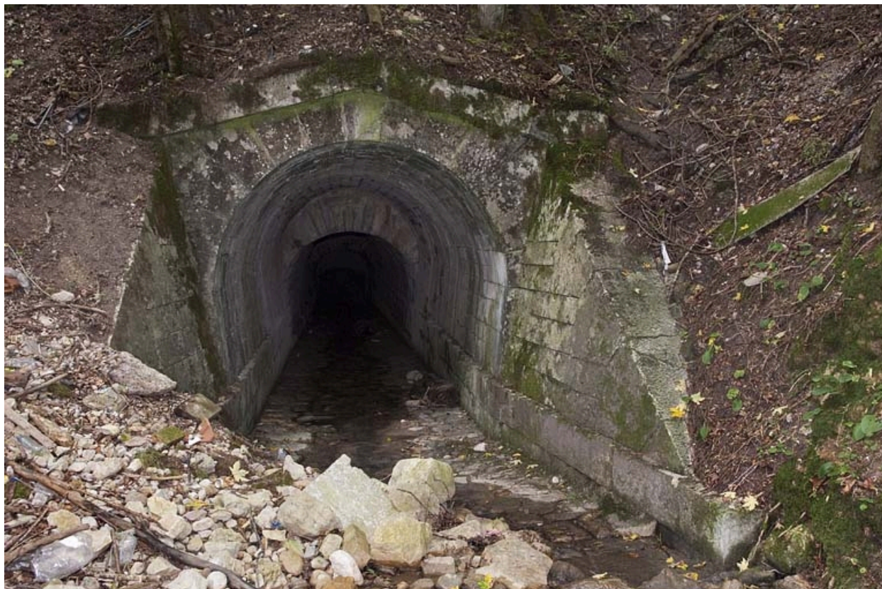
Sortie du pont-aqueduc du Vaubillon (n° 6) à la Ferrière.