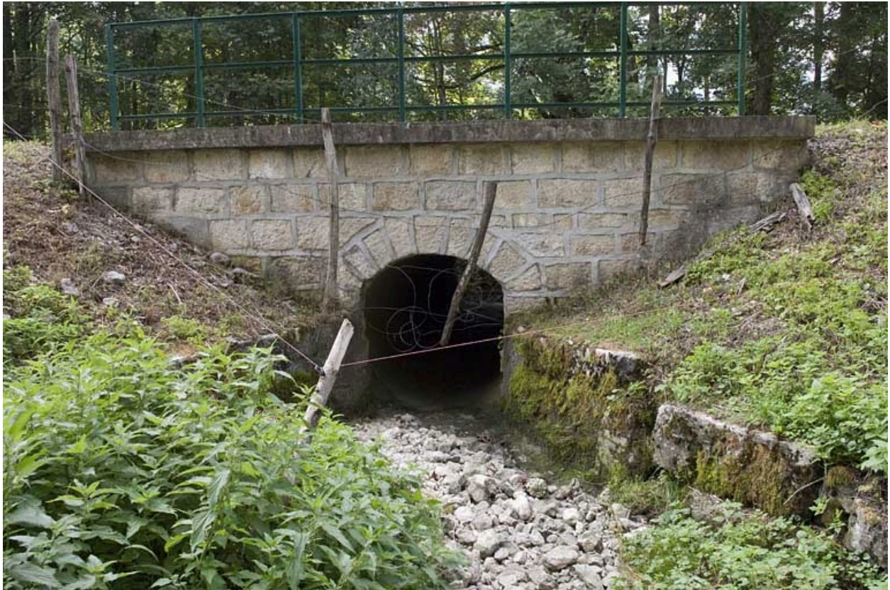
Pont sur la Servante (n° 5), vu depuis l'amont.