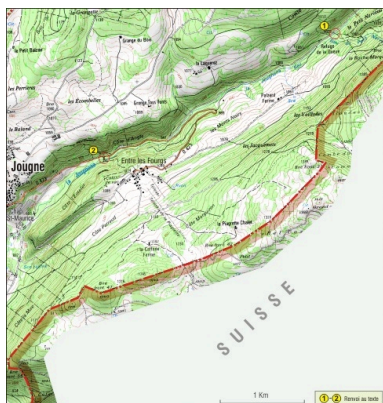
Carte de localisation de ponts, partie nord-est. Extrait de la carte IGN, échelle 1/25 000. IVR43_20112500069NUDA