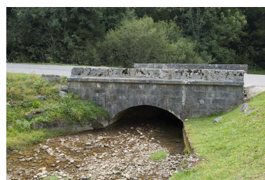
Pont sur la Jougne (n ° 4), vu depuis l'amont. IVR43_20092501606NUC2A