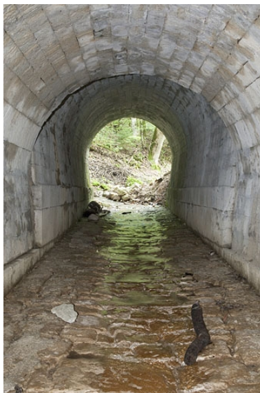
Intérieur du pont-aqueduc (n° 6) en direction des Tavins. IVR43_20092501614NUC2A