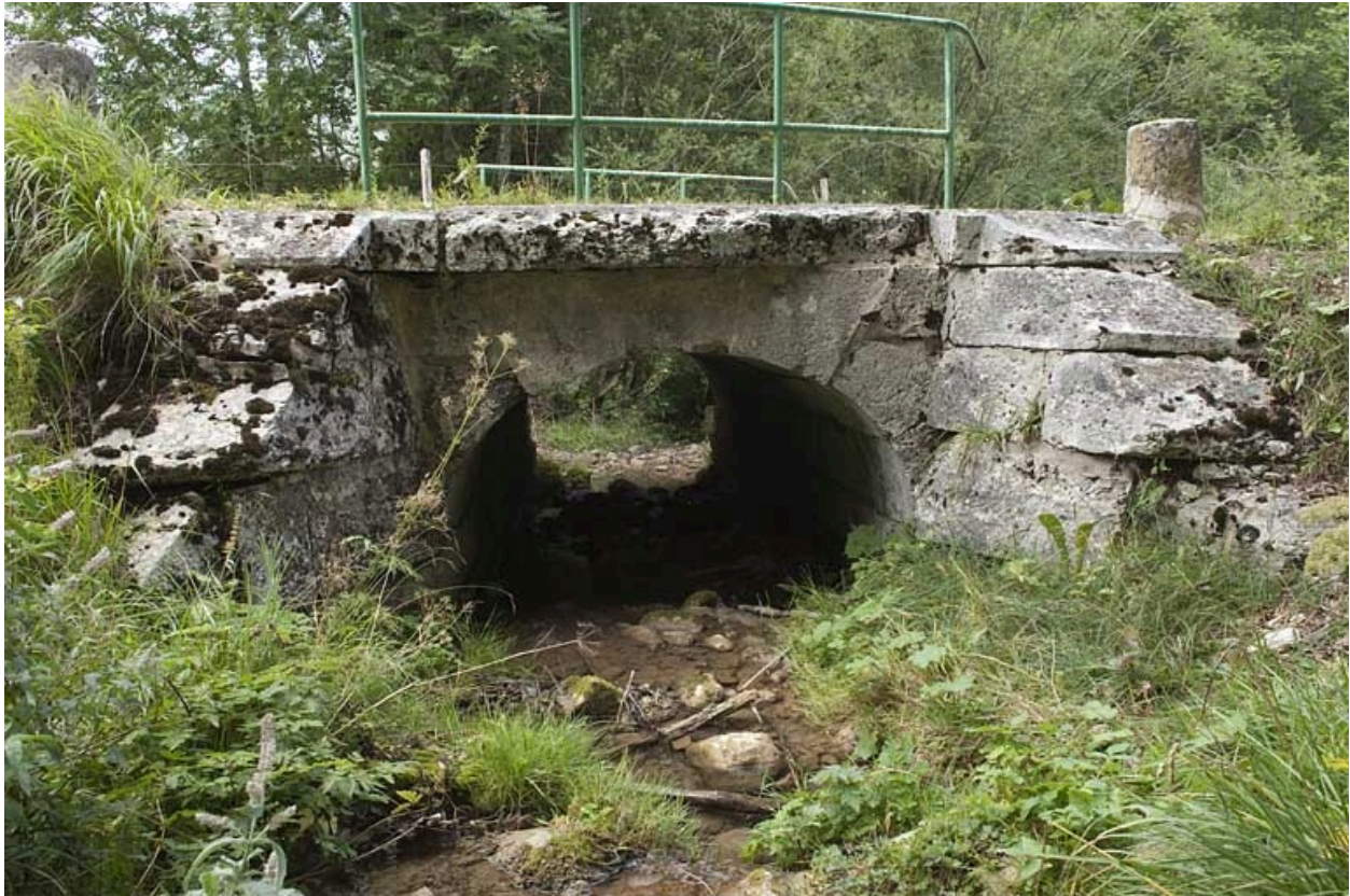
Pont du ruisseau de la Goulette (n° 18), vu depuis l'amont.