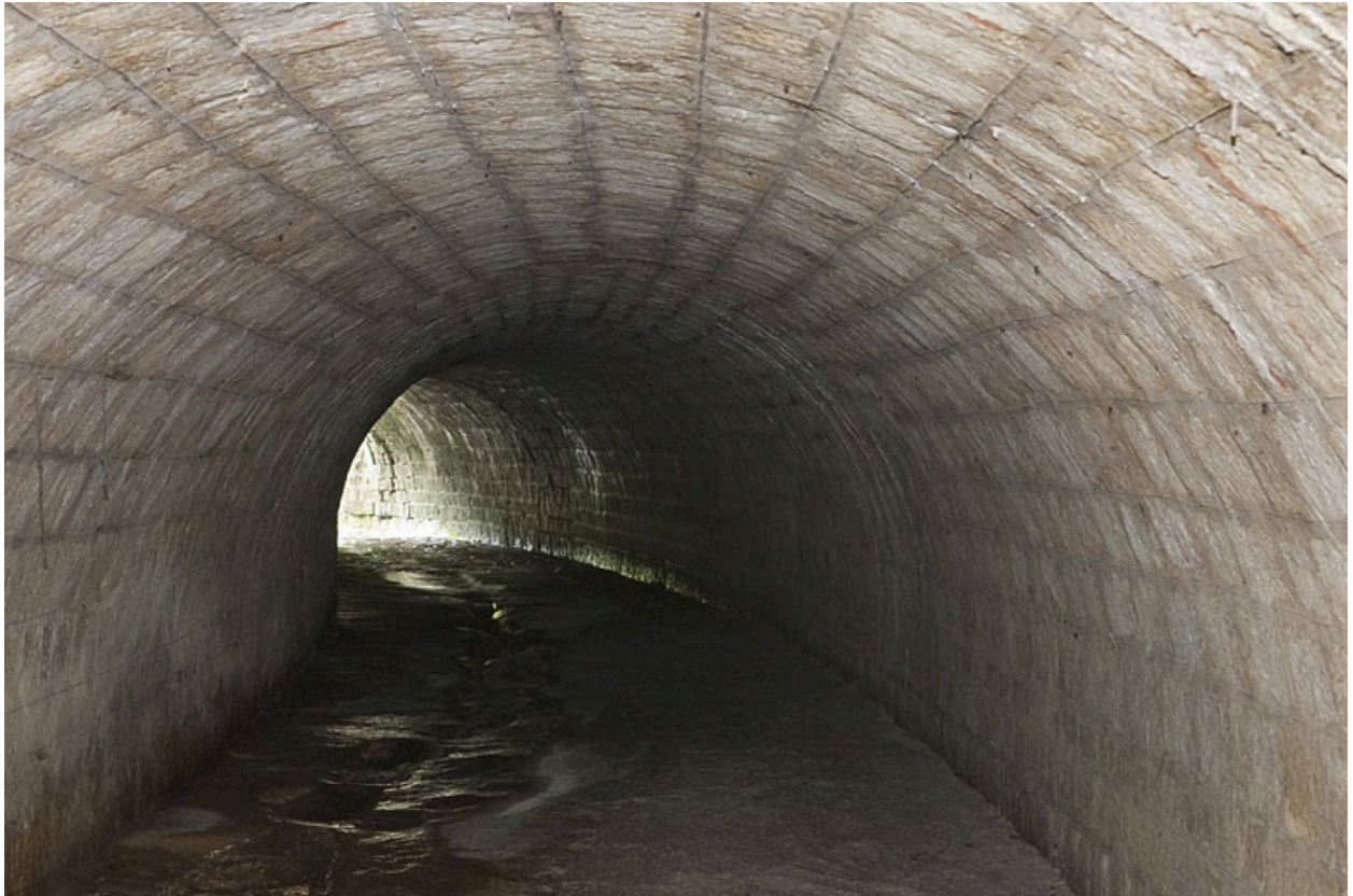
Intérieur du pont-aqueduc du Vaubillon (n° 6) en direction de la Ferrière.