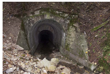
Sortie du pont-aqueduc du Vaubillon (n° 6) à la Ferrière. IVR43_20092501612NUC2A