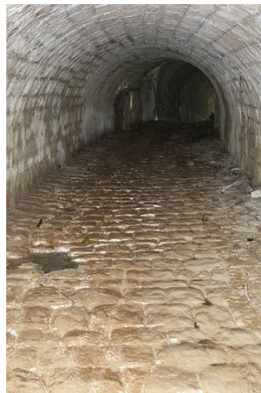
Intérieur du pont-aqueduc du Vaubillon (n° 6), détail du pavage. IVR43_20092501617NUC2A