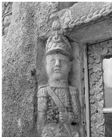
Détail de la porte d'entrée : soldat à mi-corps, vue de face. IVR43_19772500181X