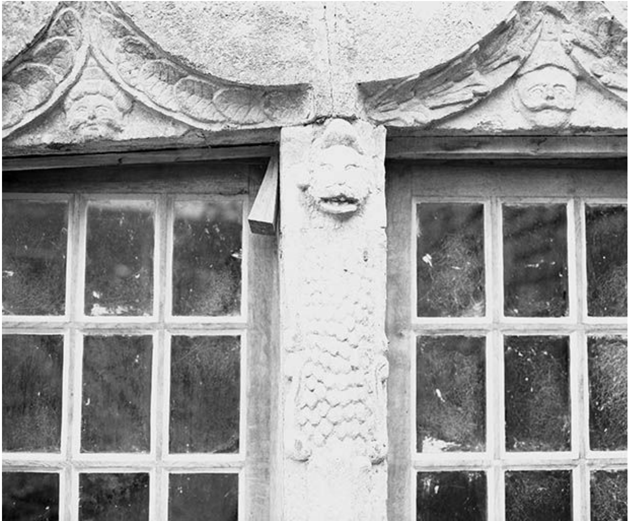
Détail du piédroit et des baies au rez-de-chaussée, côté cour.