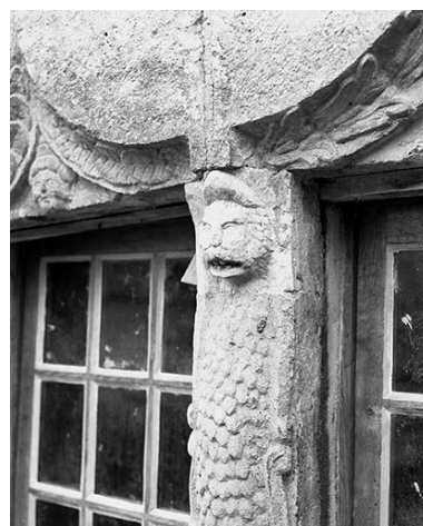
Détail du piédroit des baies au rez-de-chaussée, côté cour. IVR43_19772500180X