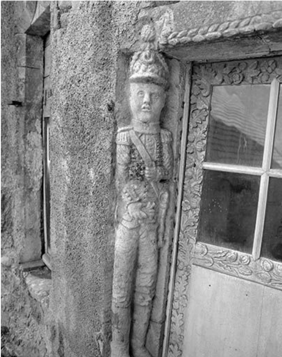
Détail de la porte d'entrée : soldat.