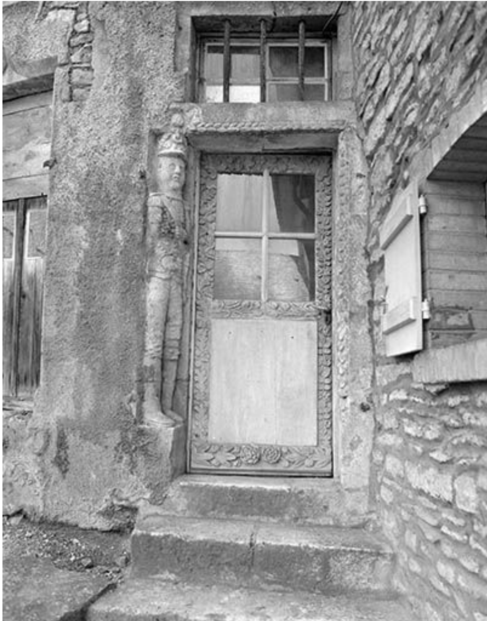
Porte d'entrée vue de face.