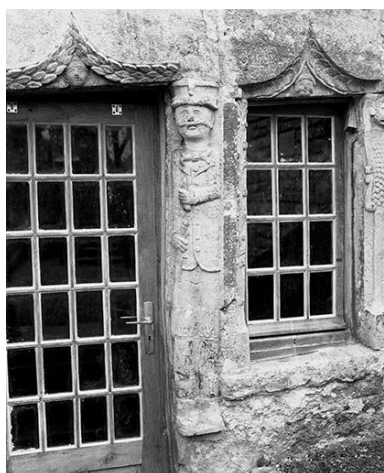
Détail de la porte du côté cour : le piédroit droit.