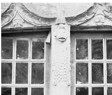
Détail du piédroit et des baies au rez-de-chaussée, côté cour. IVR43_19772500179X