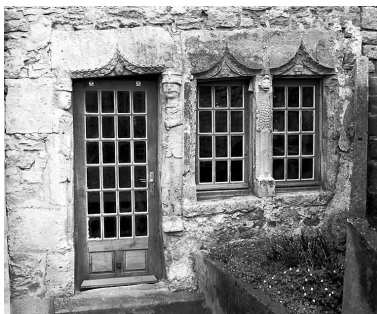
Vue d'ensemble des baies du côté cour.