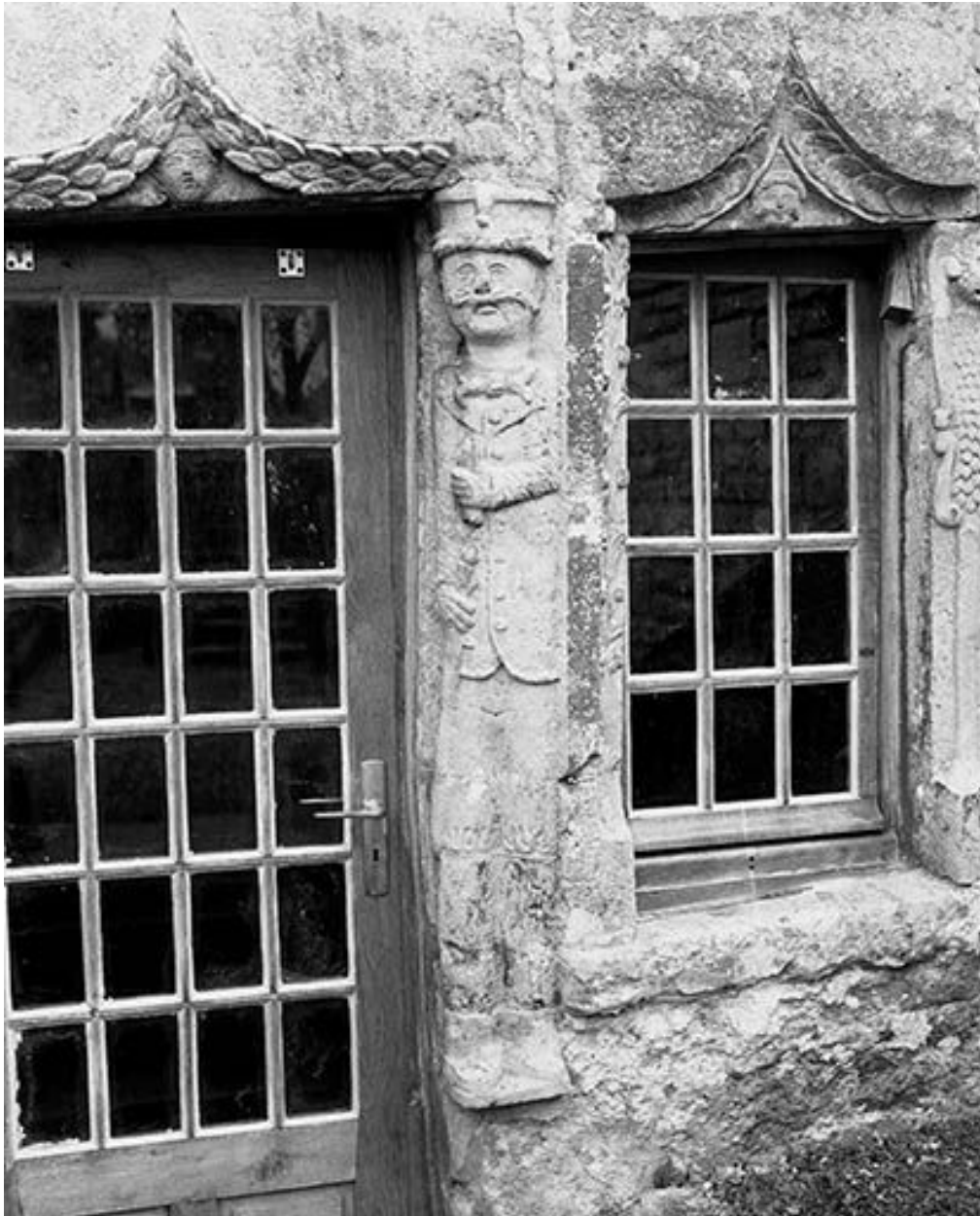
Détail de la porte du côté cour : le piédroit droit.