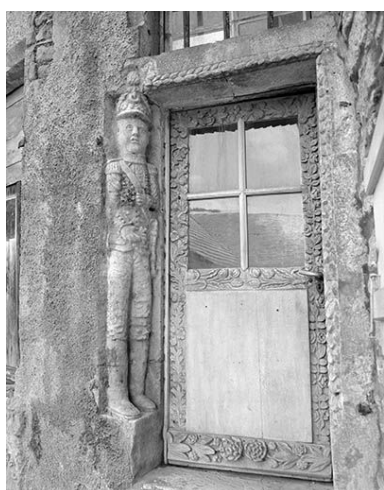
Porte d'entrée vue de trois quart droit.