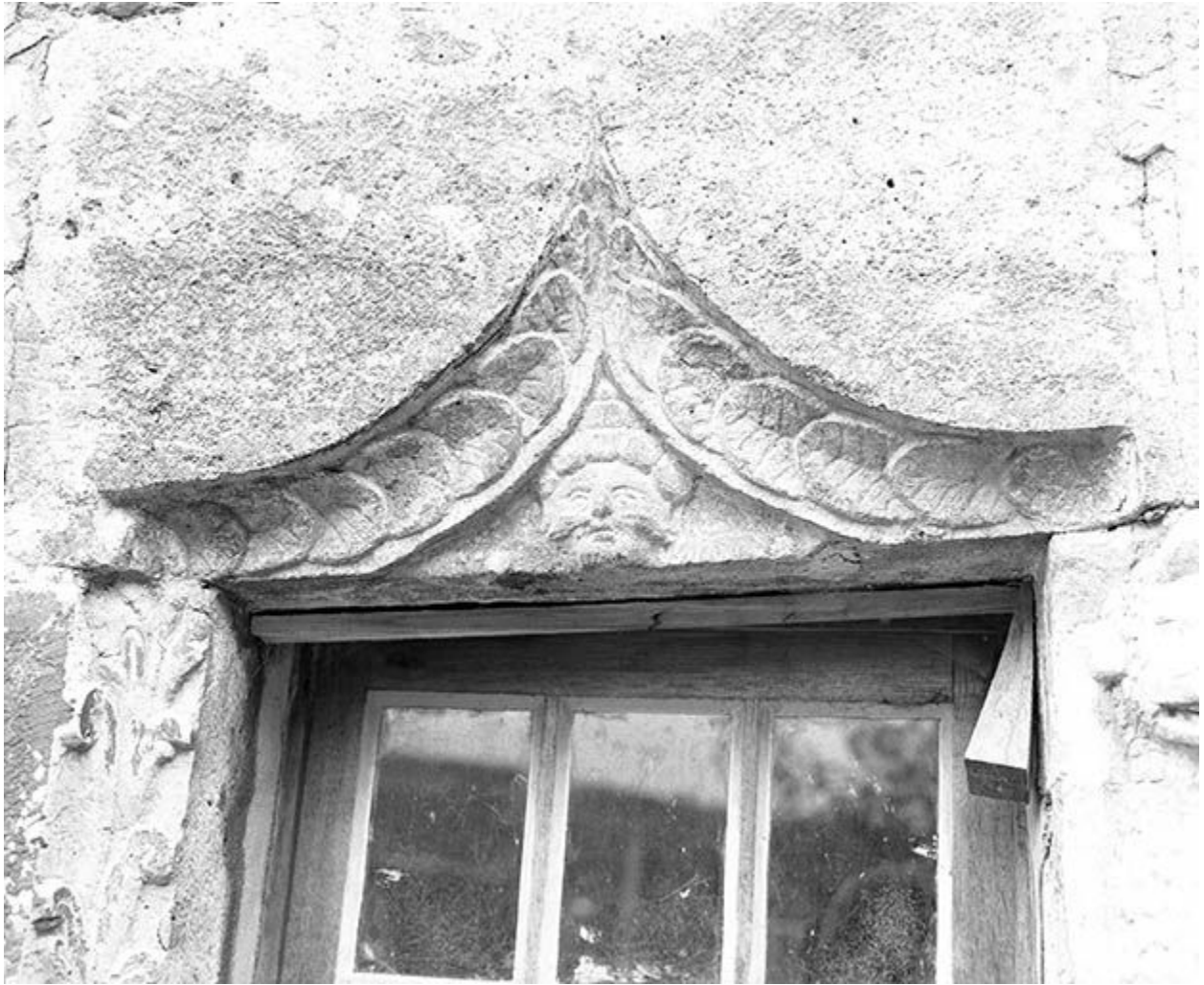
Détail du linteau de la baie gauche au rez-de-chaussée, côté cour.