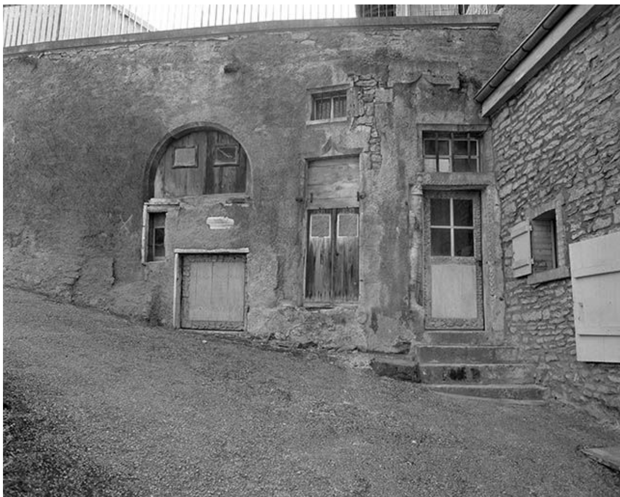
Vue de face des élévations rue du Charri.