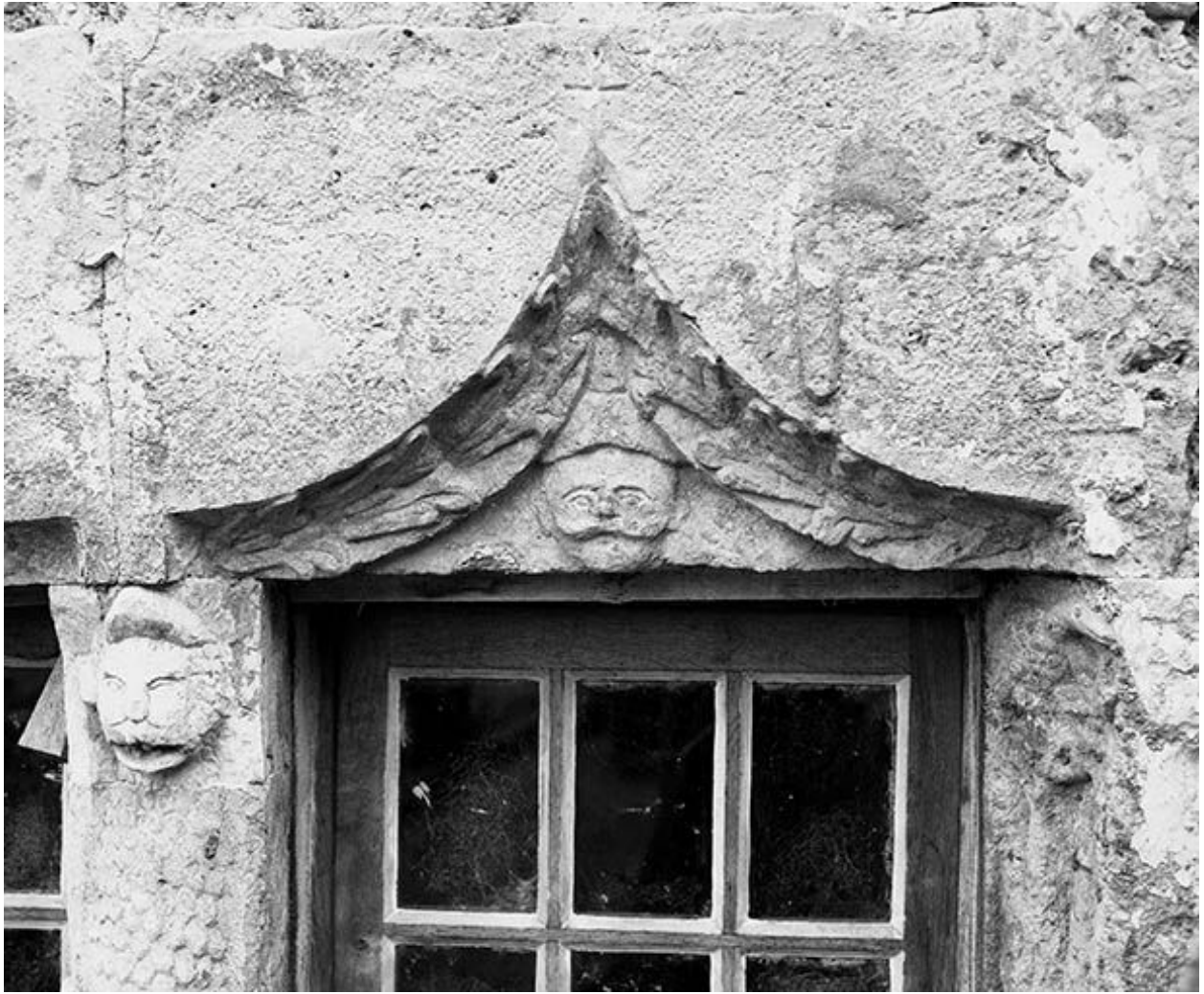
Détail du linteau de la baie gauche du rez-de-chaussée, côté cour.