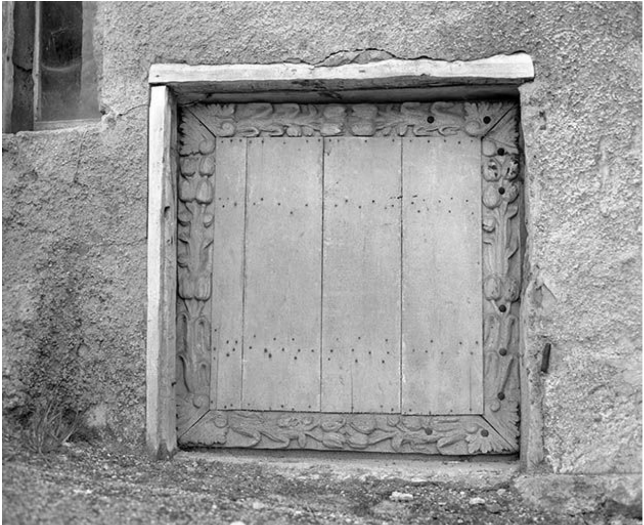
Détail : porte d'entrée de cave.