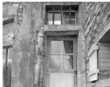
Porte d'entrée vue de face. IVR43_19772500175X