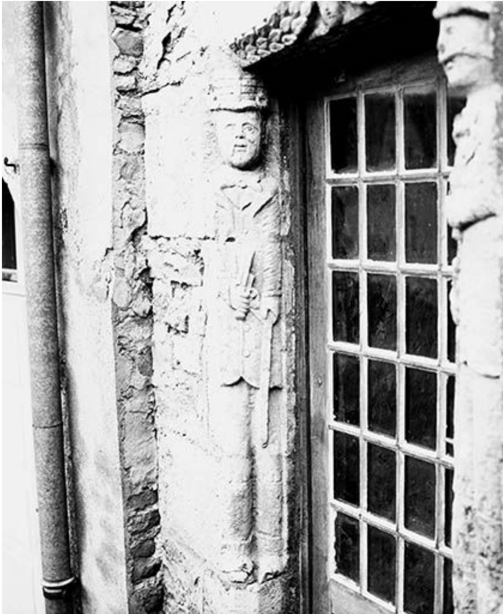
Détail de la porte du côté cour : le piédroit gauche.