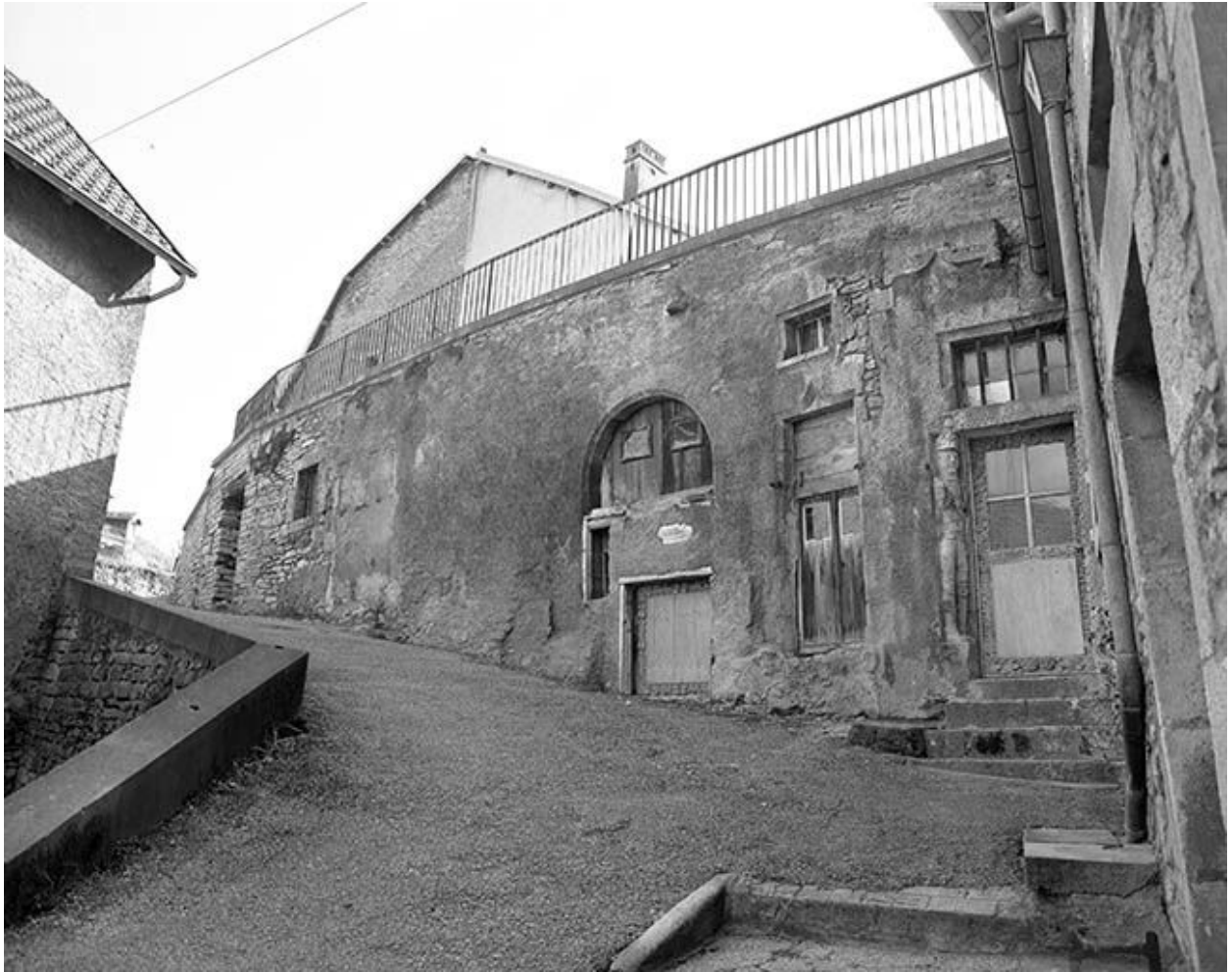
Vue rapprochée des élévations rue du Charri.