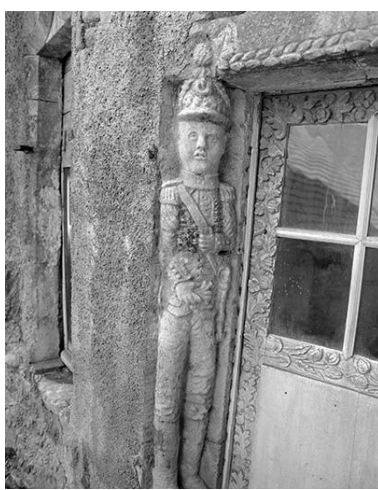
Détail de la porte d'entrée : soldat. IVR43_19772500177X