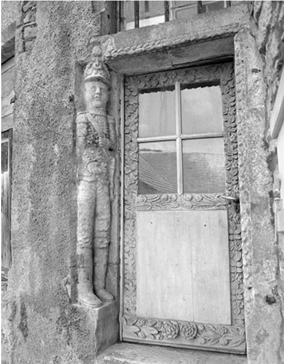
Porte d'entrée vue de trois quart droit.