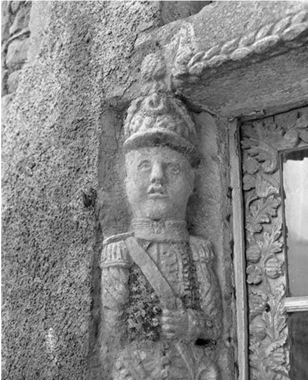
Détail de la porte d'entrée : soldat à mi-corps, vue de face.