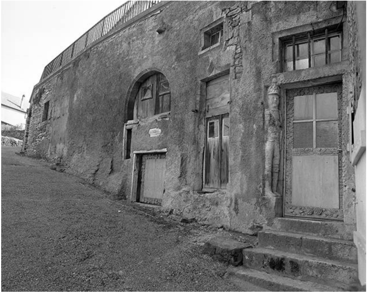
Vue de trois quart droit des élévations rue du Charri.