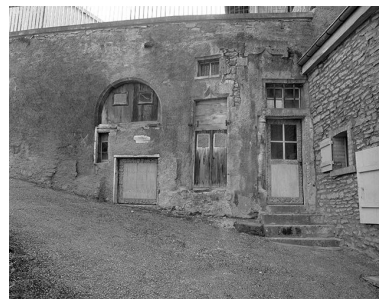
Vue de face des élévations rue du Charri. IVR43_19772500187X