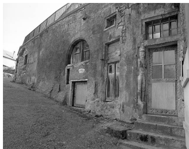
Vue de trois quart droit des élévations rue du Charri.