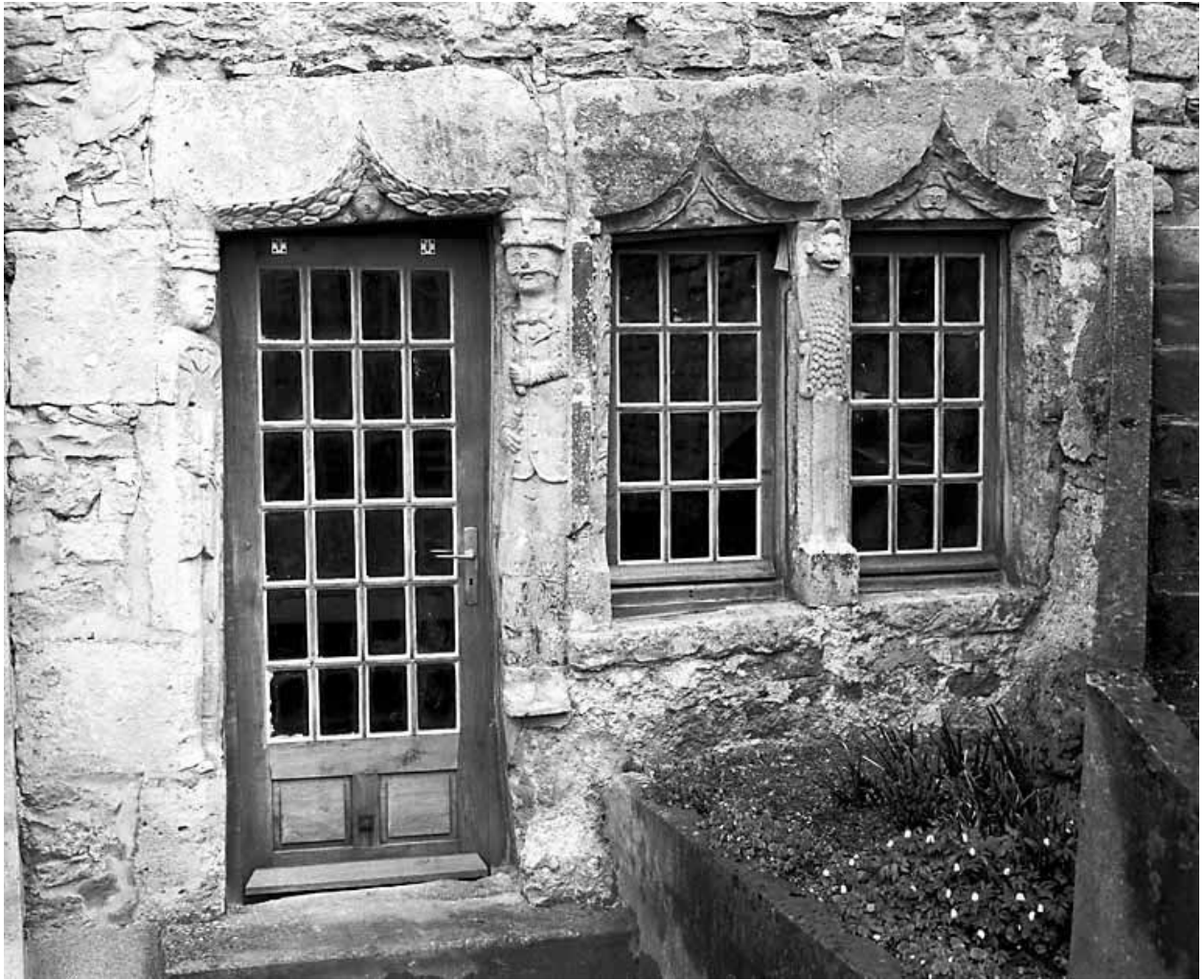
Vue d'ensemble des baies du côté cour.