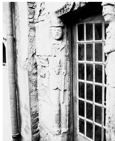
Détail de la porte du côté cour : le piédroit gauche. IVR43_19772500183X