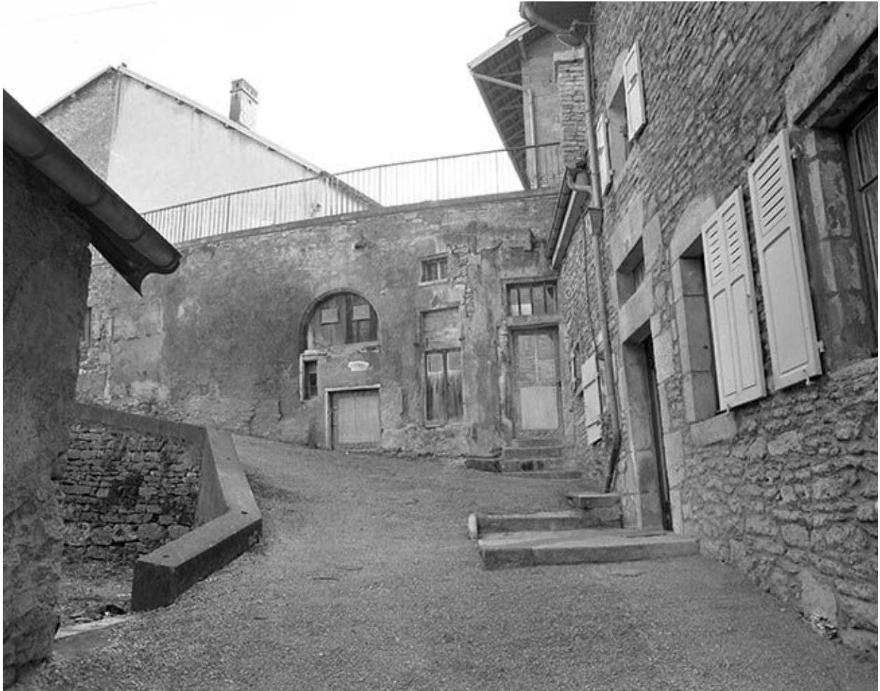
Vue d'ensemble des élévations rue du Charri.