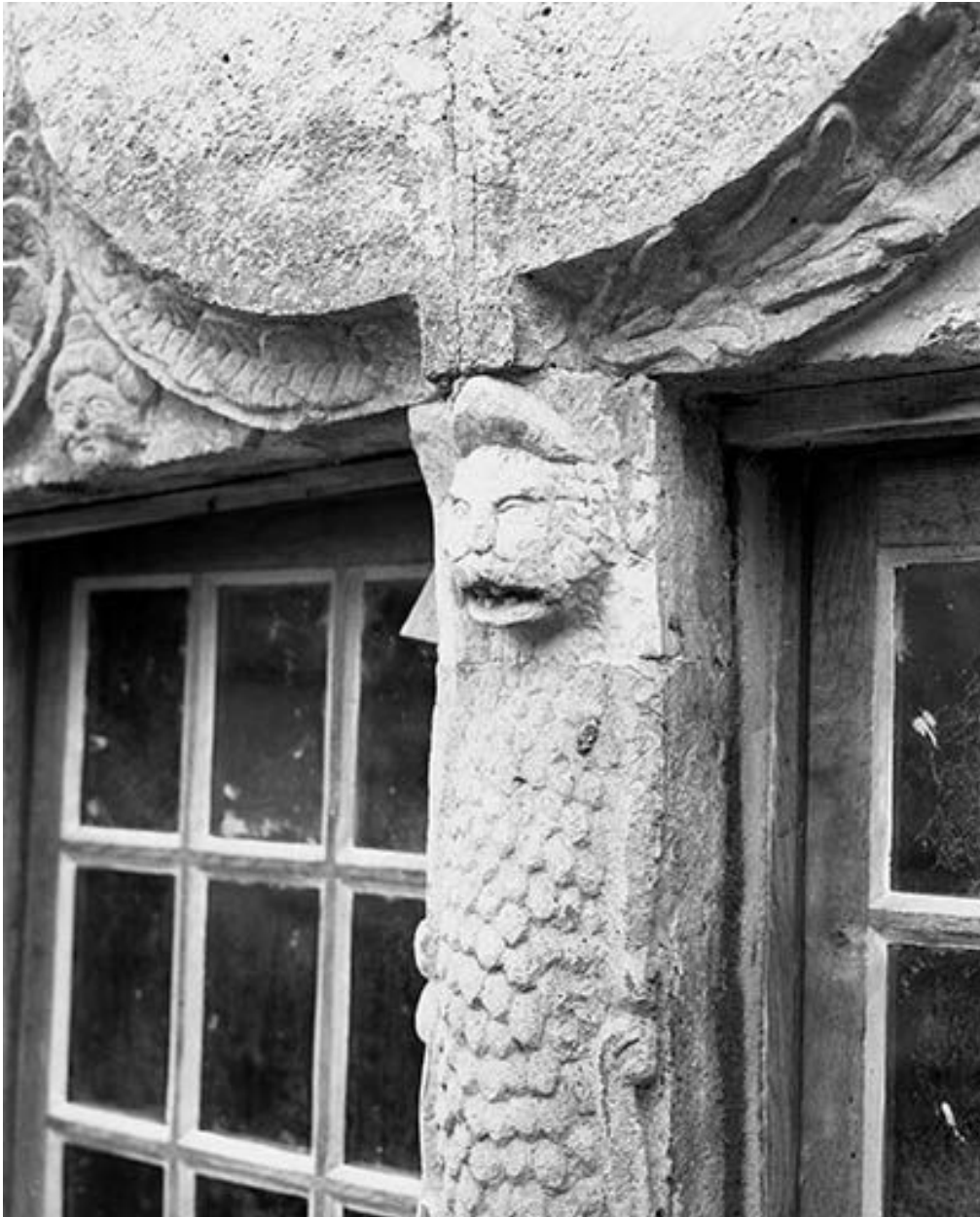
Détail du piédroit des baies au rez-de-chaussée, côté cour.