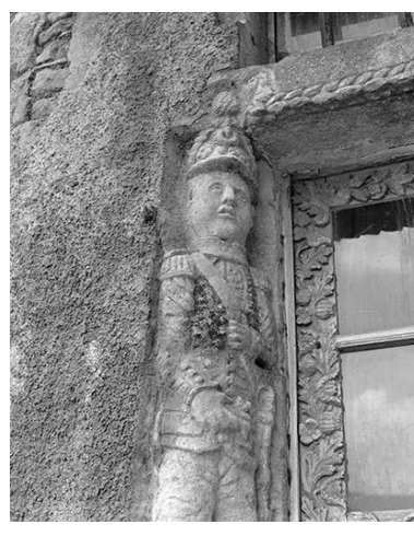
Détail de la porte d'entrée : soldat à mi-corps.