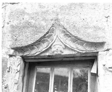
Détail du linteau de la baie gauche au rez-de-chaussée, côté cour. IVR43_19772500186X