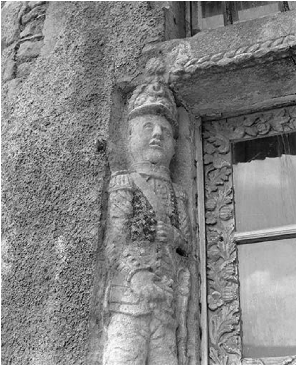
Détail de la porte d'entrée : soldat à mi-corps.