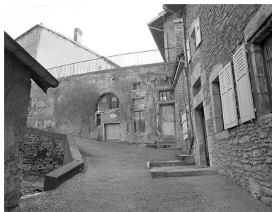
Vue d'ensemble des élévations rue du Charri. IVR43_19772500190X