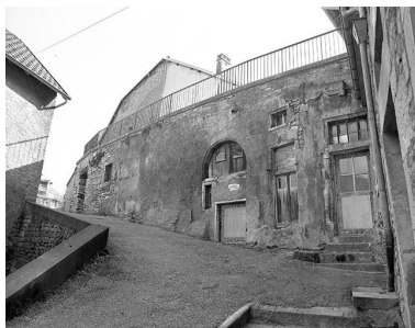
Vue rapprochée des élévations rue du Charri.