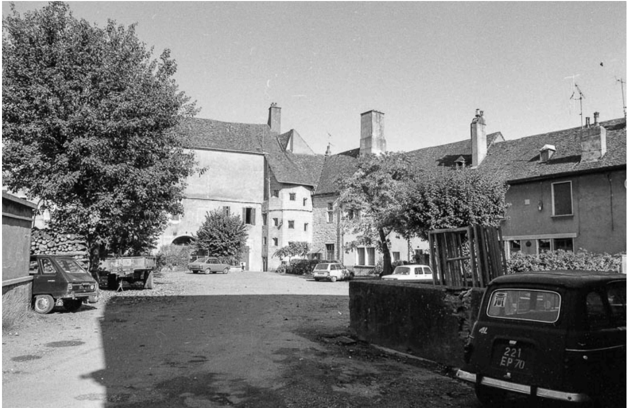
Vue d'ensemble de la cour.