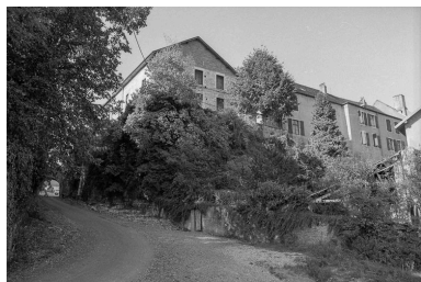
Façade est, partie gauche : vue depuis le chemin vicinal n°2 dit "des Grands Prés".