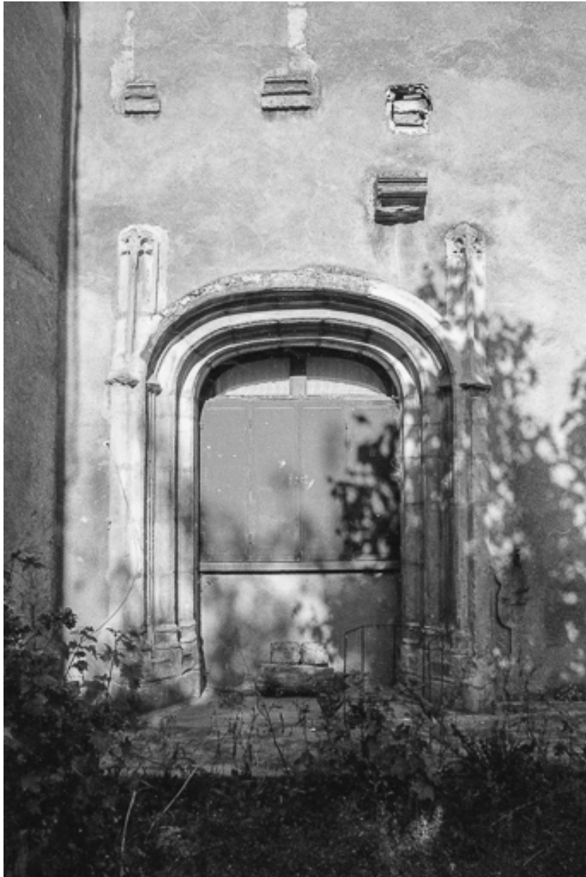
Détail d'une baie.