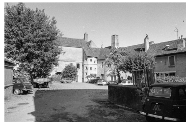
Vue d'ensemble de la cour.