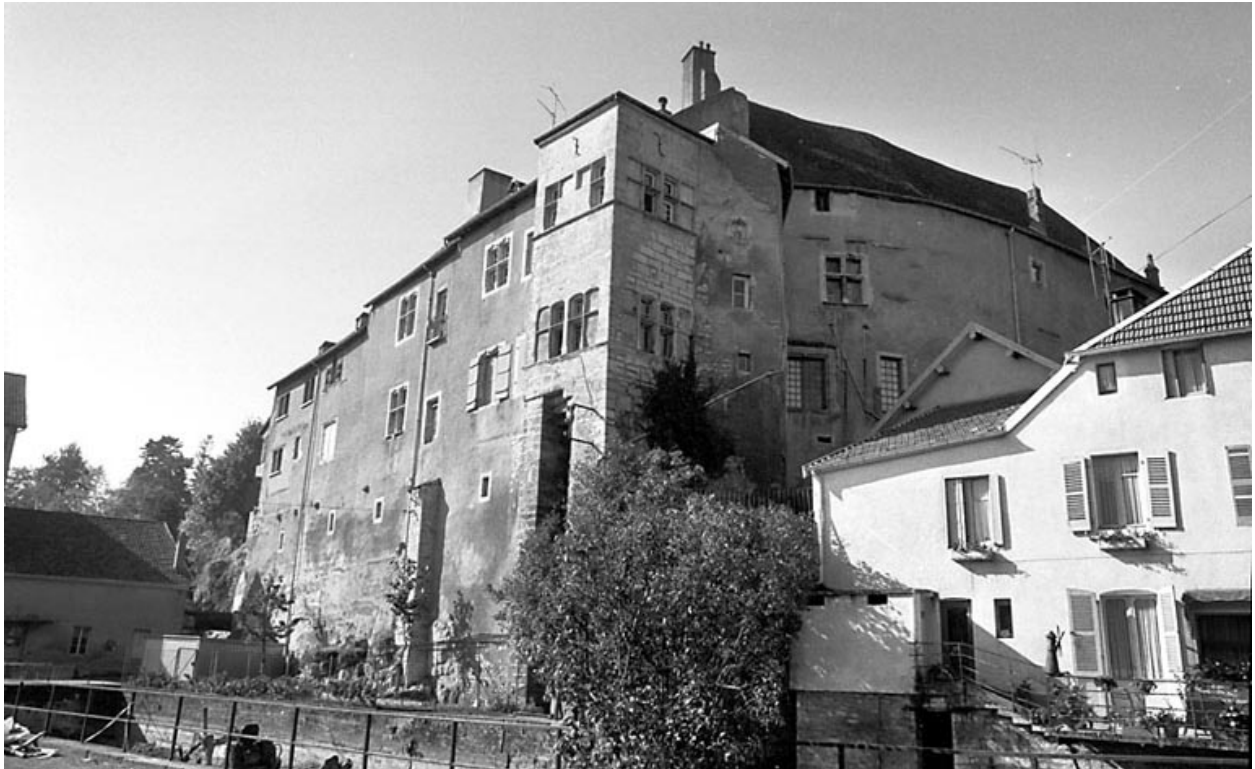
Façade est, partie droite.