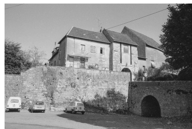
Ouvrage d'entrée et pont.