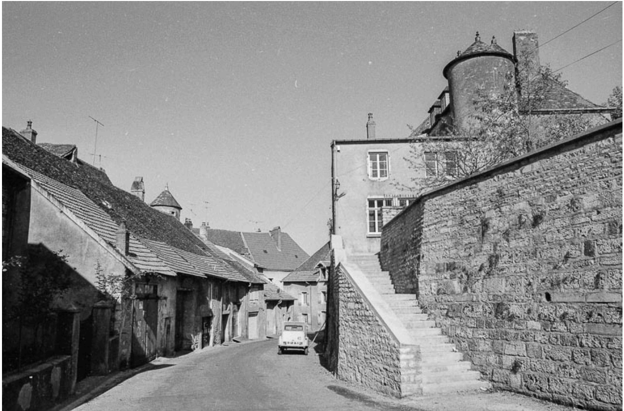
Enceinte, place de l'Eglise.