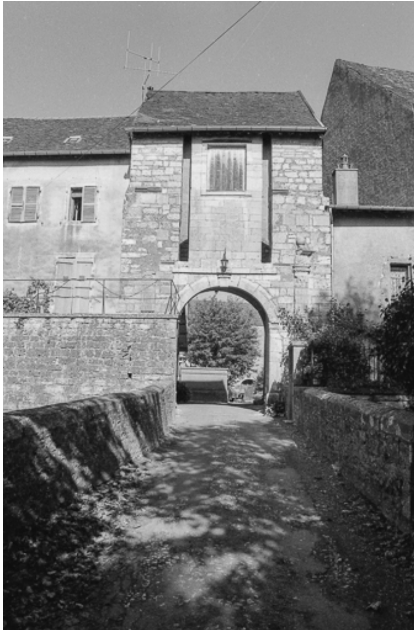
Ouvrage d'entrée : façade extérieure.