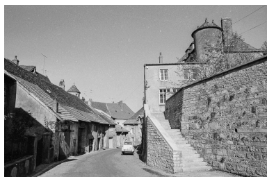
Enceinte, place de l'Eglise. IVR43_19797000368Z