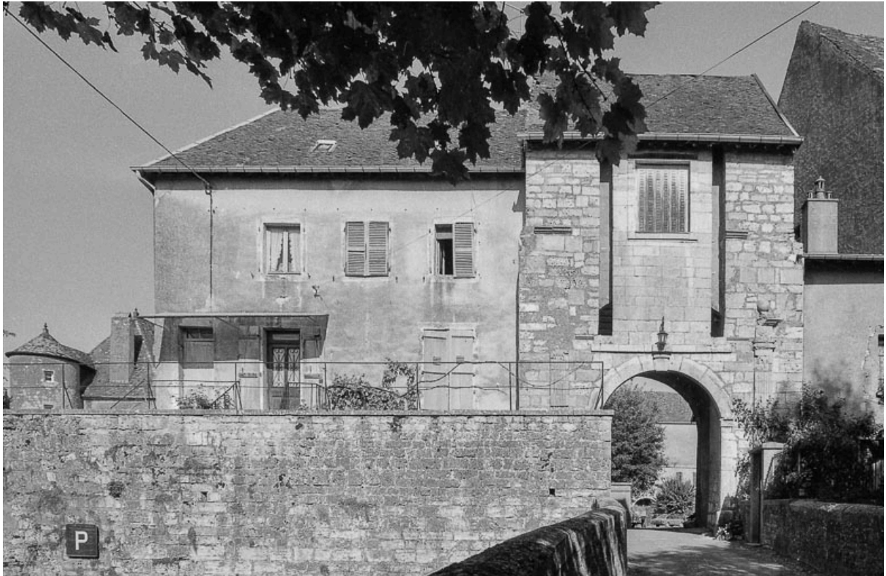
Ouvrage d'entrée et pont.