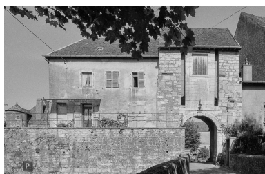
Ouvrage d'entrée et pont. IVR43_19797000372Z