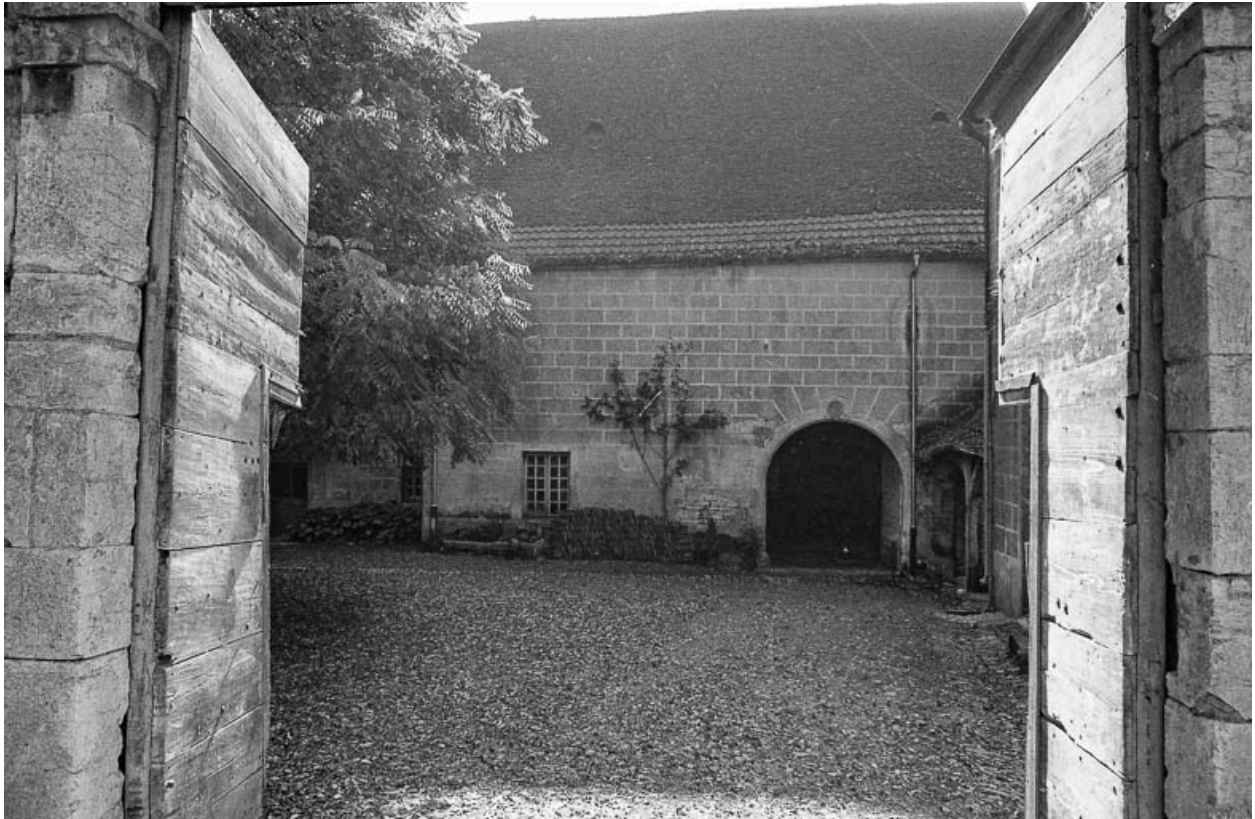
Vue sur la cour depuis le porche d'entrée.