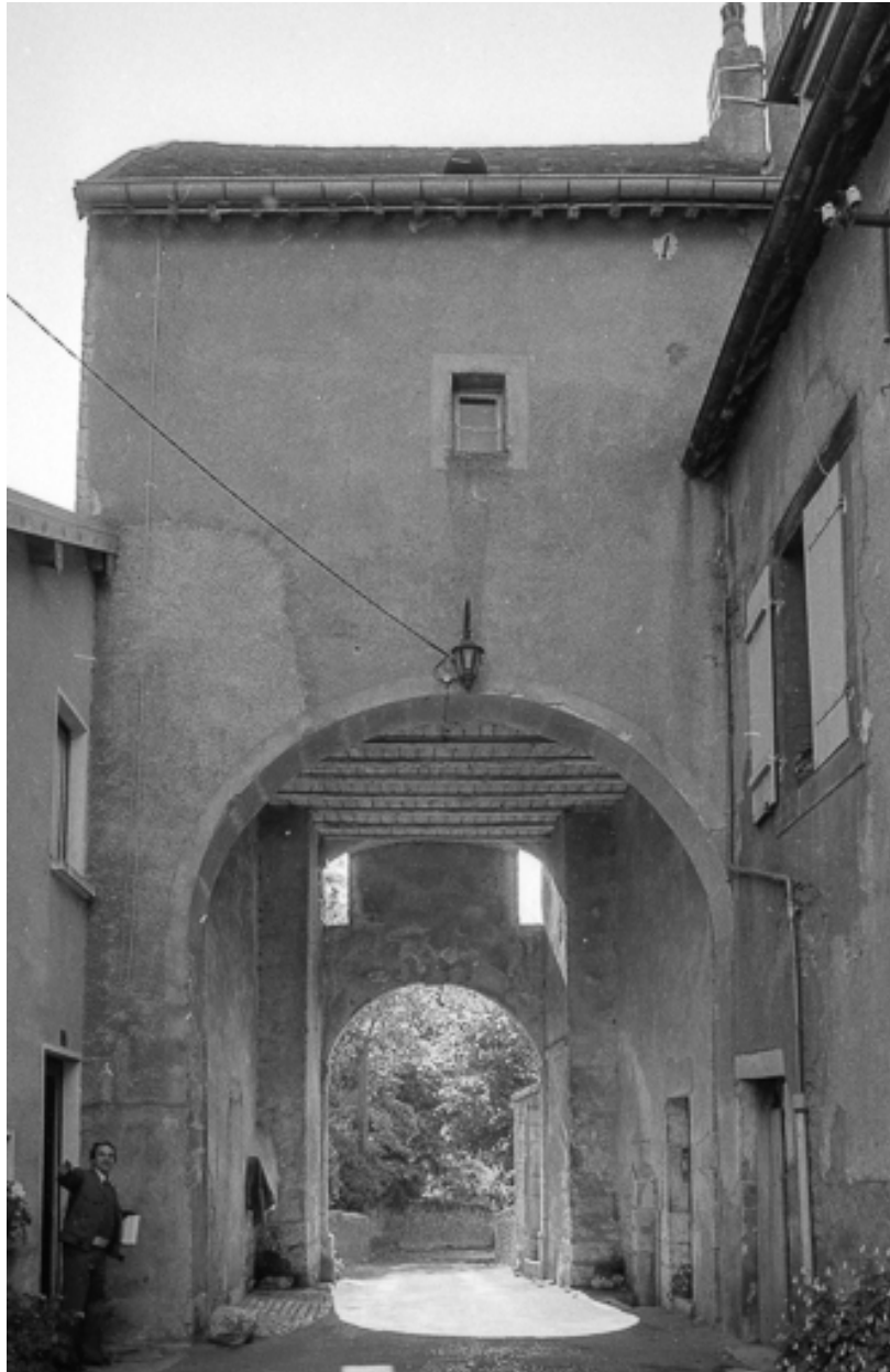
Ouvrage d'entrée : façade sur cour.