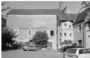
Façade sur cour. IVR43_19797000378Z