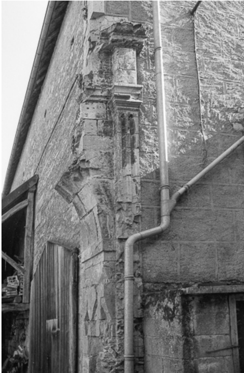
Cour : restes d'arcature.