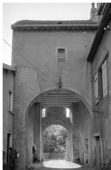
Ouvrage d'entrée : façade sur cour. IVR43_19797000374Z