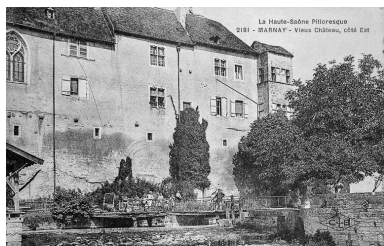
La Haute-Saône pittoresque - 2181 - MARNAY - Vieux Château, côté Est