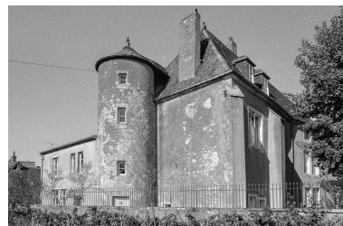
Façade latérale gauche. IVR43_19797000380Z