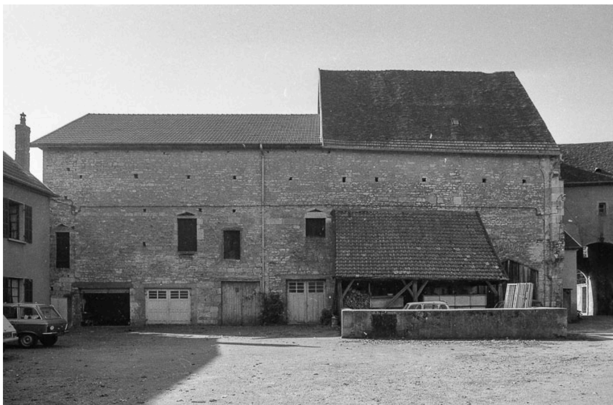
Cour : bâtiments agricoles.