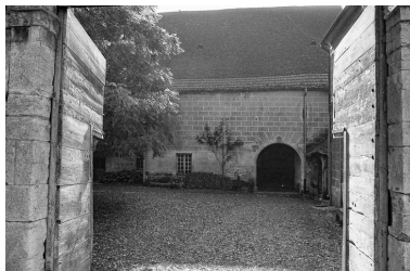
Vue sur la cour depuis le porche d'entrée. IVR43_19797000416Z