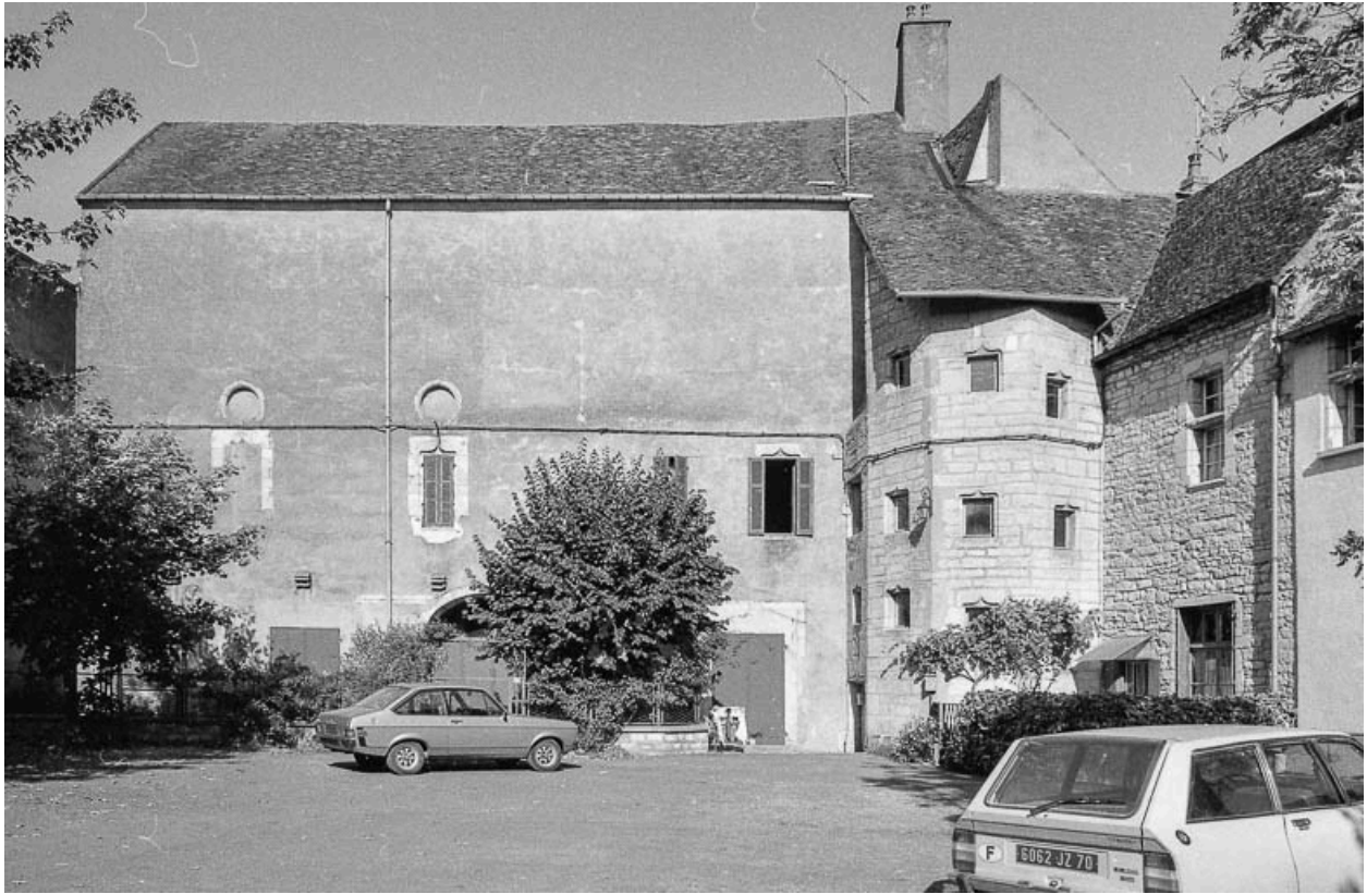
Façade sur cour.