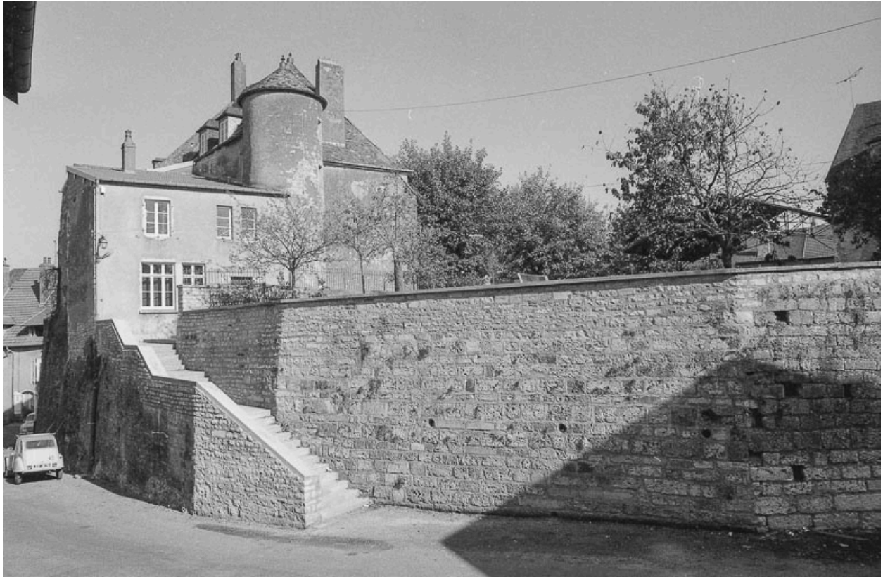
Enceinte, place de l'Eglise.