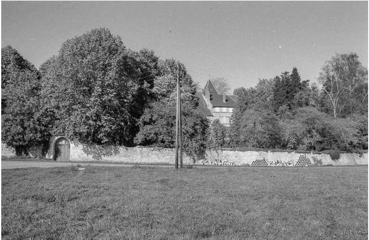
Vue depuis les rives de l'Ognon.