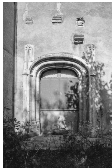
Détail d'une baie.