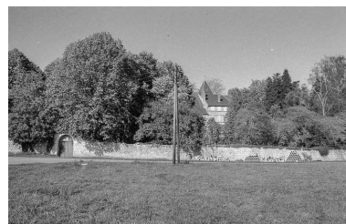
Vue depuis les rives de l'Ognon. IVR43_19797000417Z