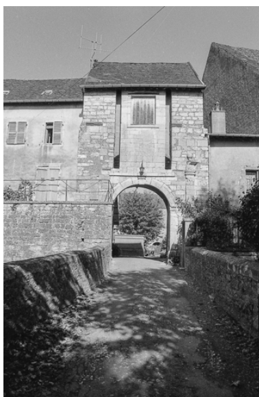
Ouvrage d'entrée : façade extérieure. IVR43_19797000373Z