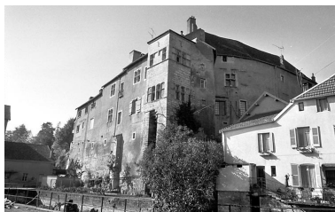
Façade est, partie droite. IVR43_19797000367Z