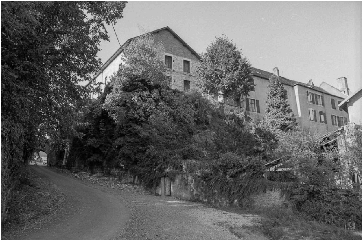
Façade est, partie gauche : vue depuis le chemin vicinal n°2 dit ""des Grands Prés"".