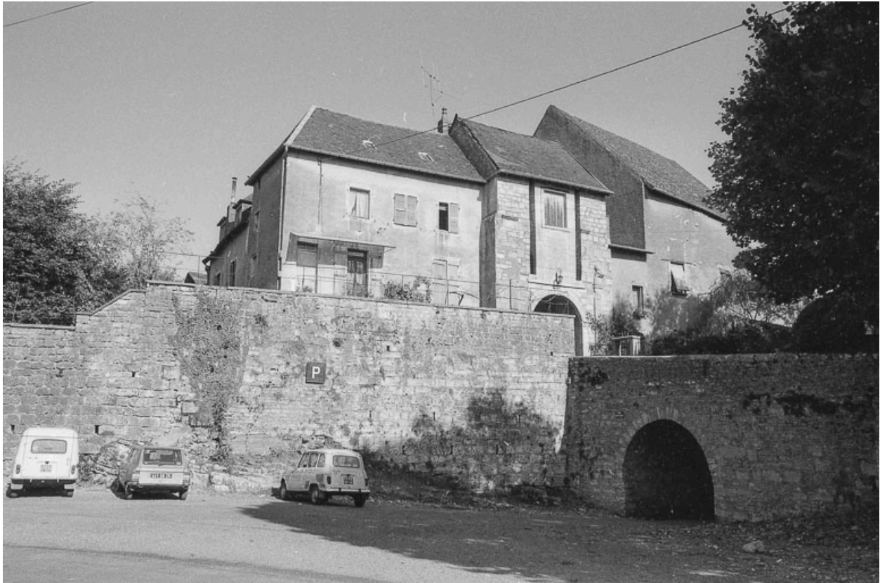
Ouvrage d'entrée et pont.