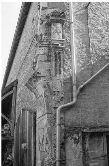
Cour : restes d'arcature. IVR43_19797000375Z