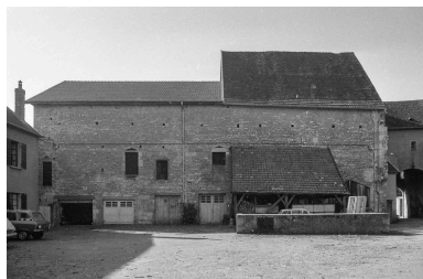
Cour : bâtiments agricoles. IVR43_19797000376Z