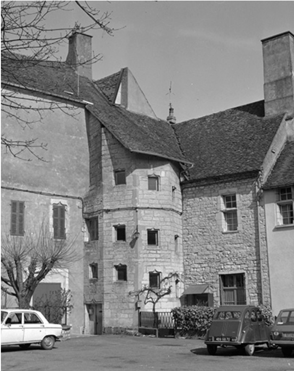
Détail : tour d'escalier.