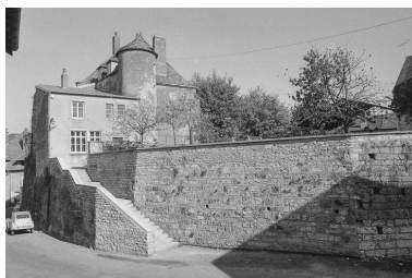
Enceinte, place de l'Eglise. IVR43_19797000369Z