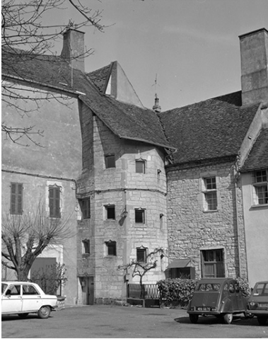
Détail : tour d'escalier.