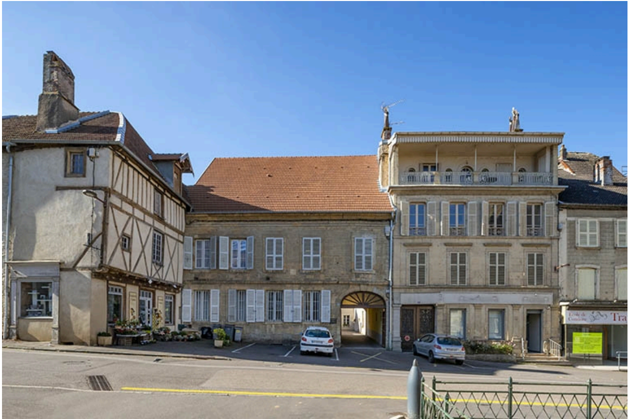
La rue Bontemps : n° 8 à 12.