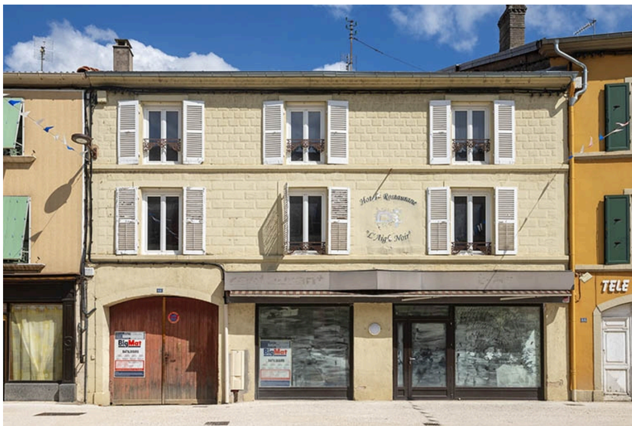
La rue Gambetta : n° 68.