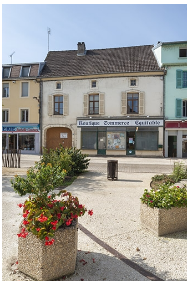
La rue Gambetta : n° 33.