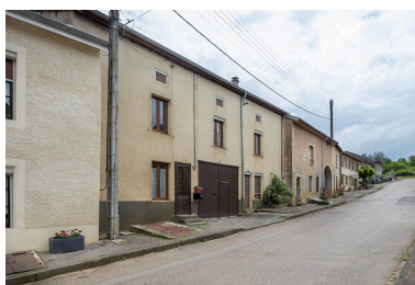
La rue Bontemps : n° 41 et suivants. IVR43_20217000657NUC4A