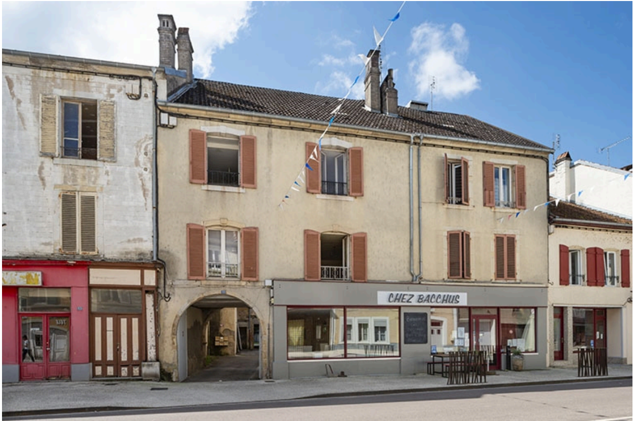
La rue Gambetta : n° 55.