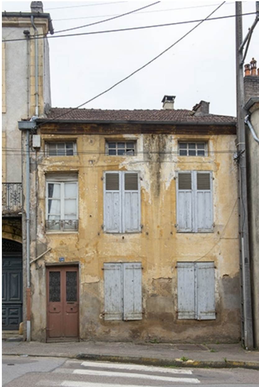
La rue Bontemps : n° 34.