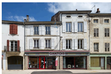
La rue Gambetta : n° 60. IVR43_20217000635NUC4A