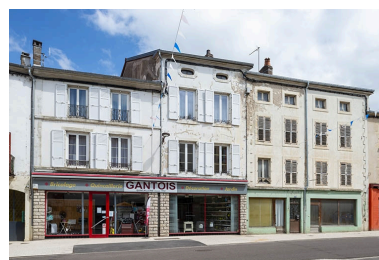
La rue Gambetta : n° 58 et 60. IVR43_20217000636NUC4A