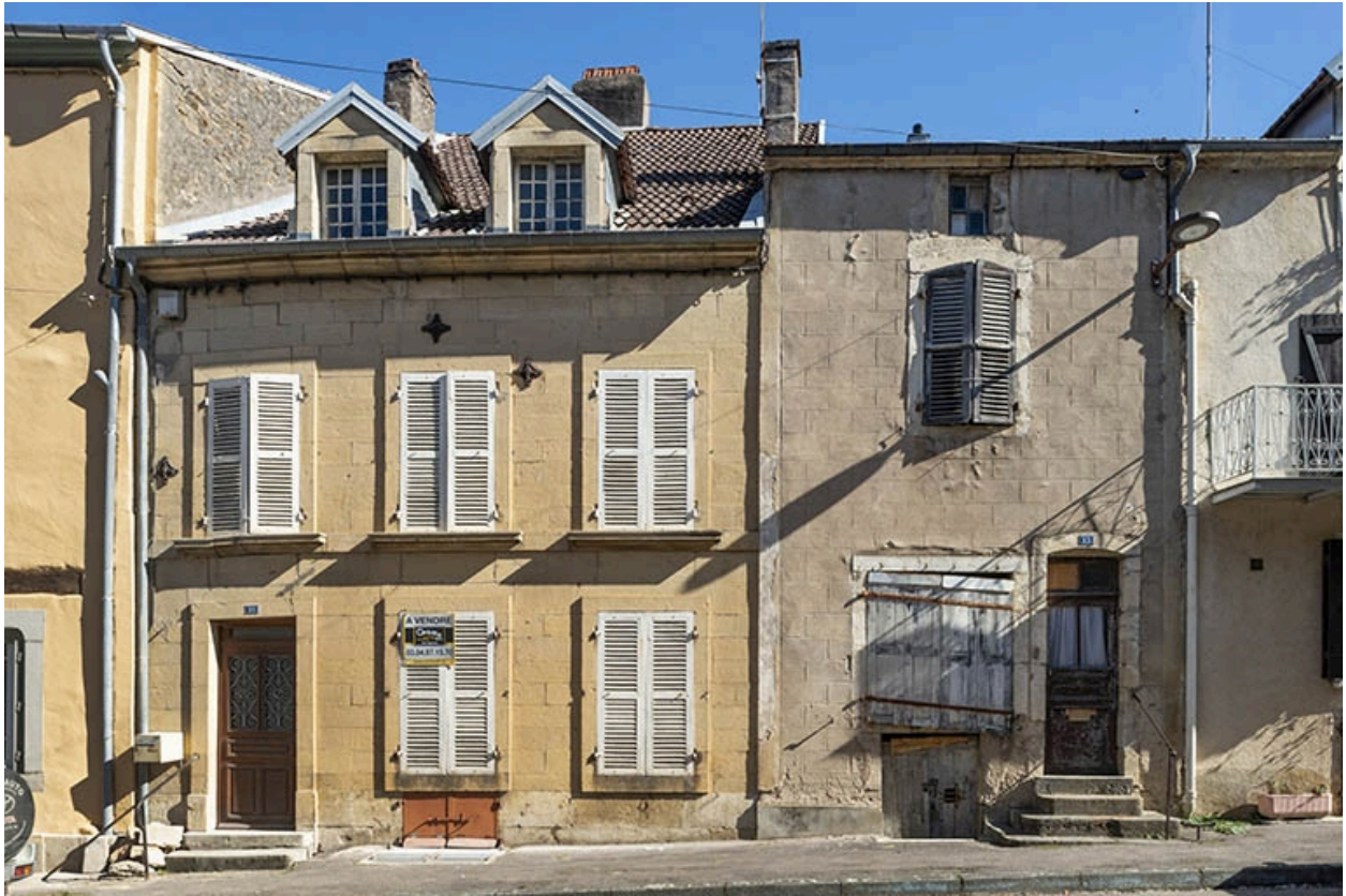
La rue Bontemps : n° 11 et 13.