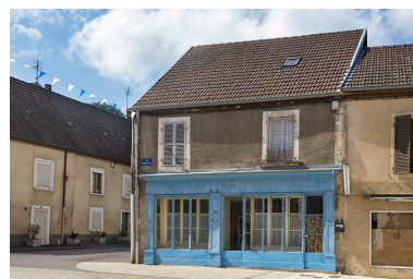
La rue Gambetta : n° 21. IVR43_20217000613NUC4A