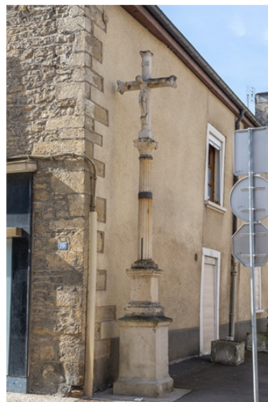
La rue Gambetta : calvaire à l'entrée de la rue Decaen. IVR43_20217000610NUC4A