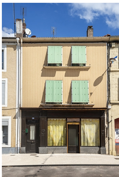
La rue Gambetta : n° 70. IVR43_20217000641NUC4A