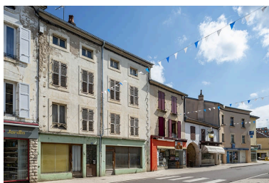
La rue Gambetta : n° 66 et précédents.