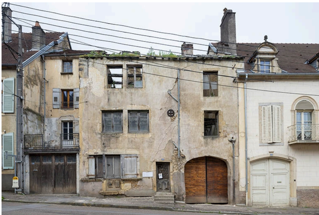
La rue Bontemps : n° 26 et 28.