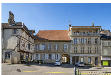
La rue Bontemps : n° 8 à 12. IVR43_20217000653NUC4A