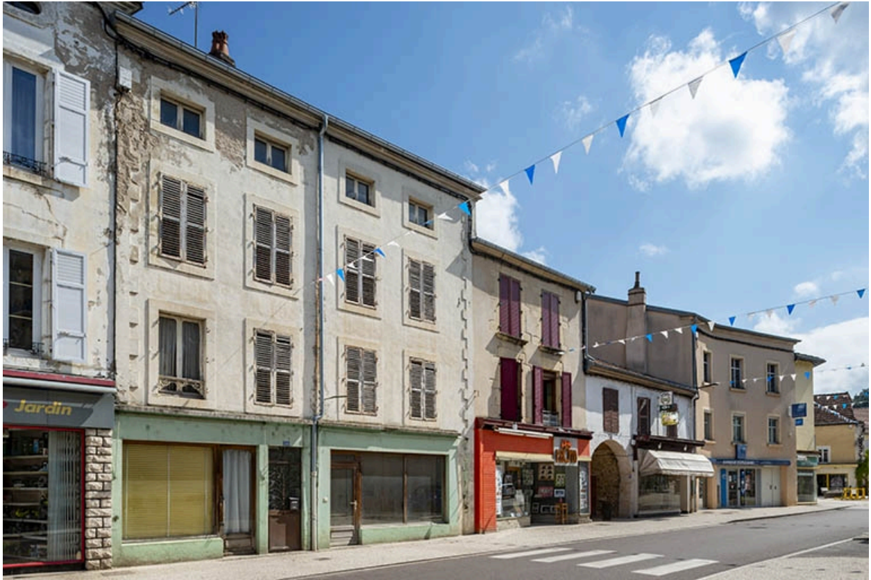
La rue Gambetta : n° 66 et précédents.