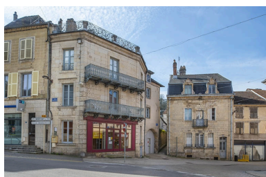
Intersection des rues Bontemps et Gambetta. IVR43_20227000043NUC4A