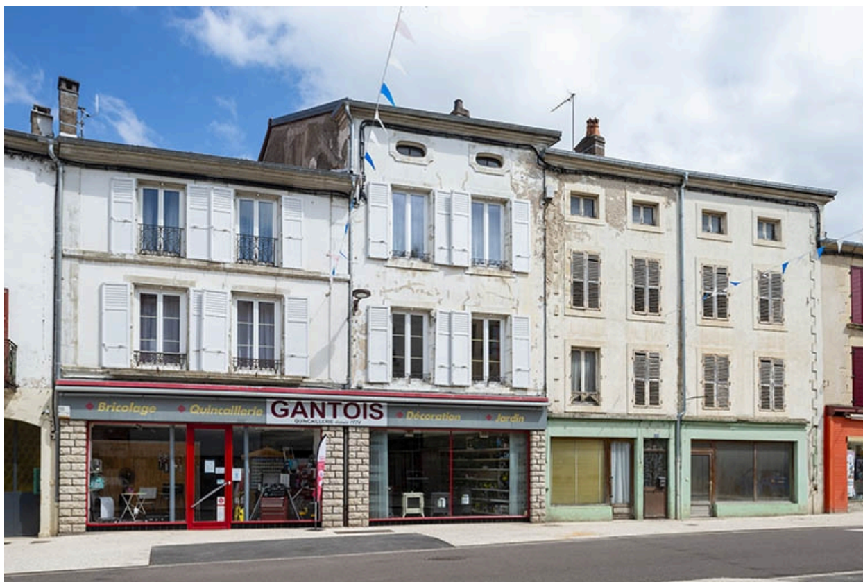
La rue Gambetta : n° 58 et 60.