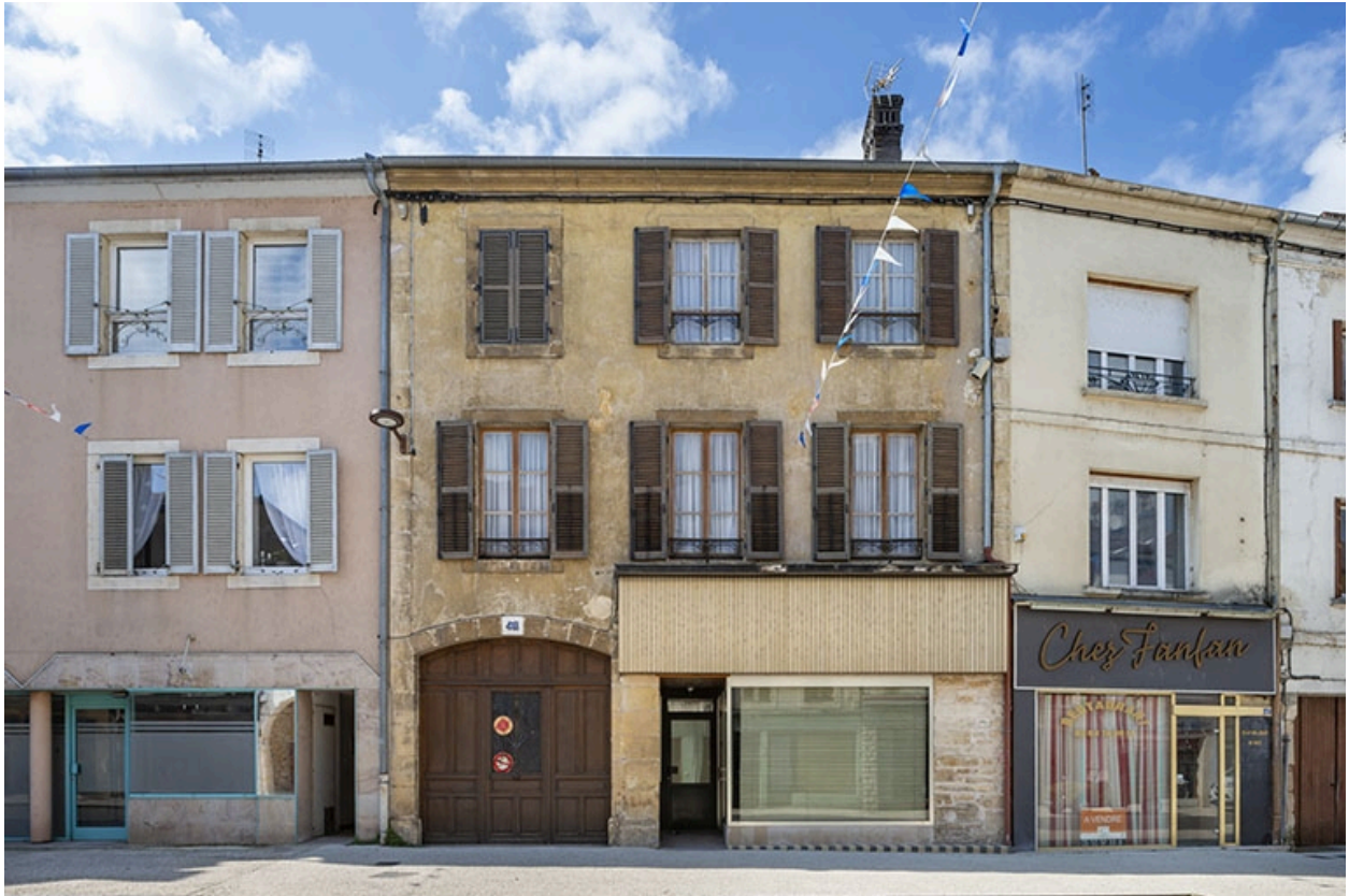
La rue Gambetta : n° 43 à 47.