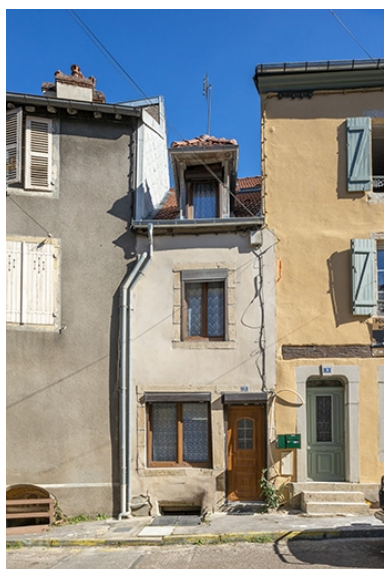
La rue Bontemps : n° 7.