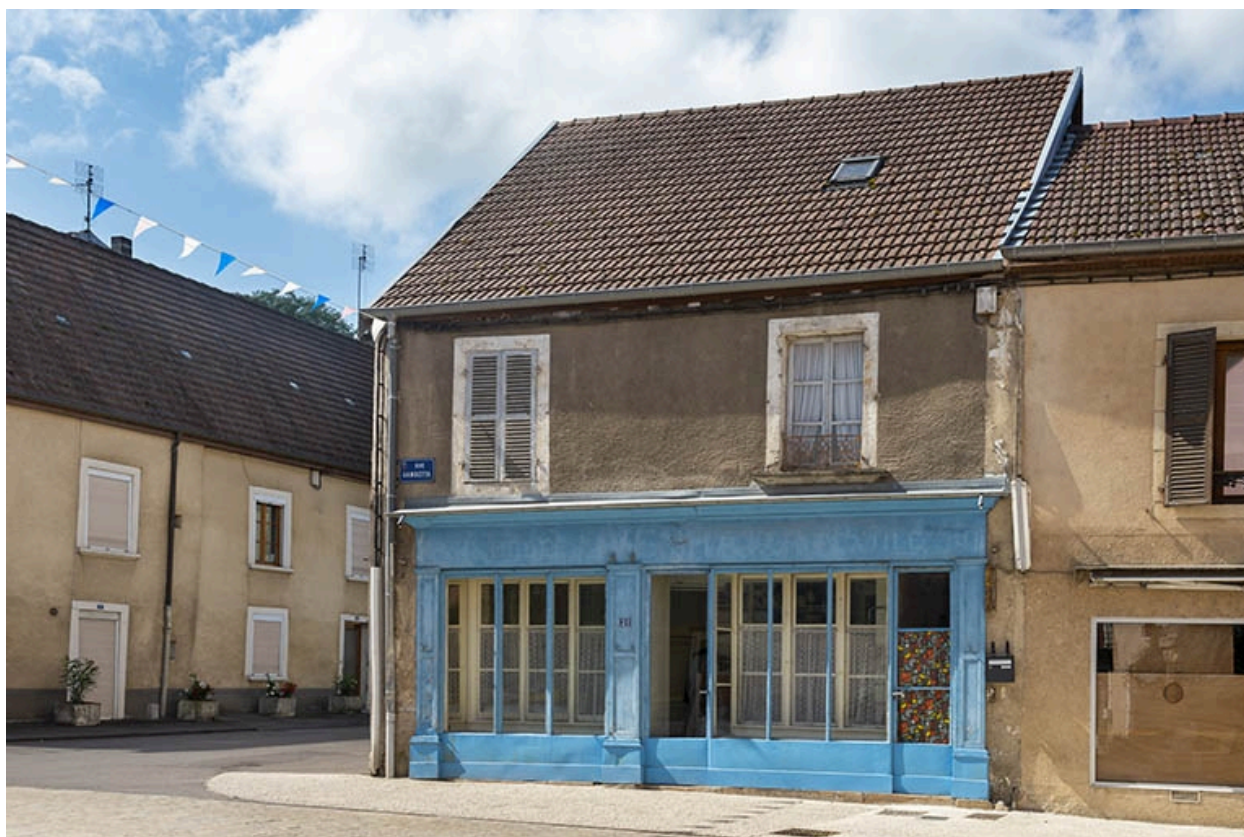
La rue Gambetta : n° 21.