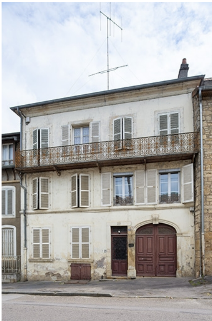
La rue Bontemps : n° 27.