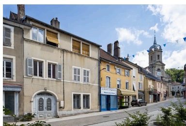
La rue Gambetta : n° 2 à 14. IVR43_20217000598NUC4A