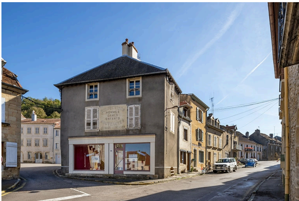
La rue Bontemps : n° 5, face nord et perspective de la rue vers le sud.