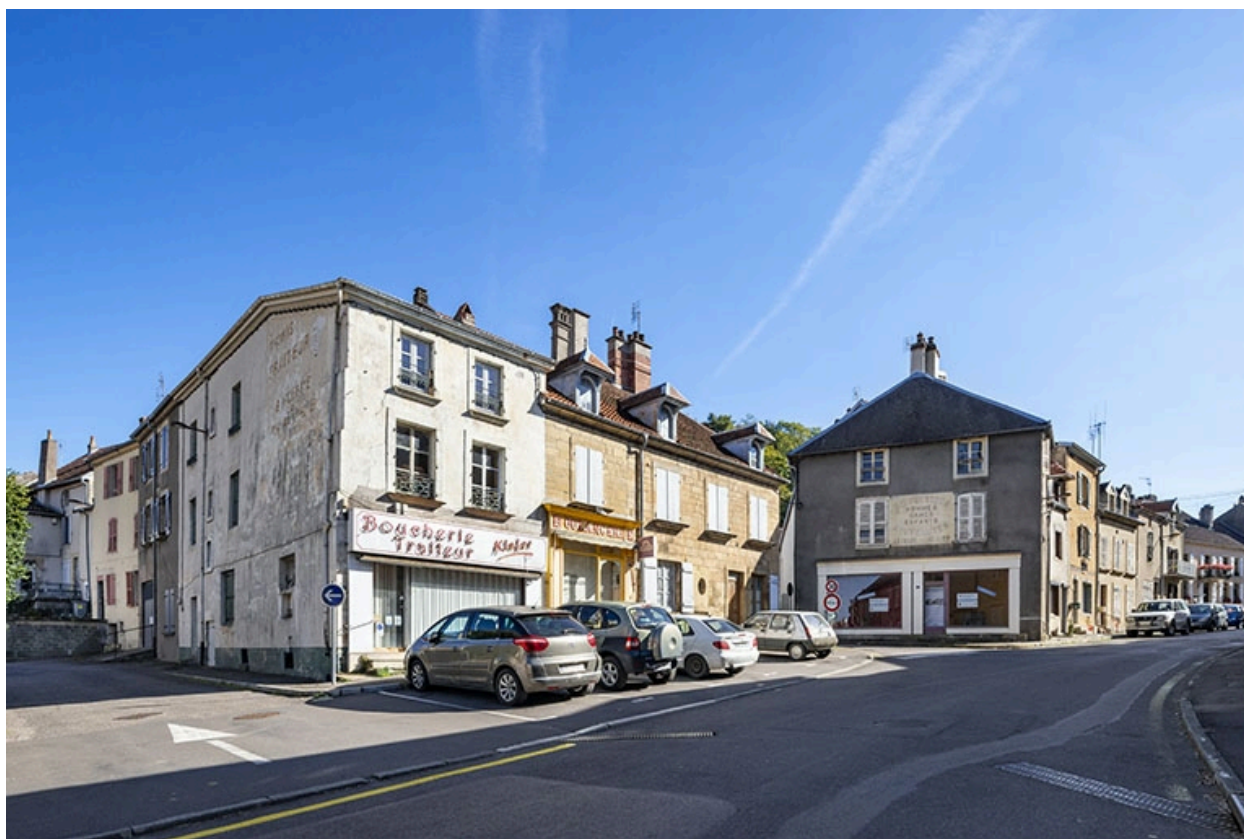
La rue Bontemps : n° 3 et 5 et perspective de la rue vers le sud.