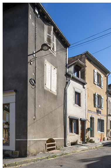
La rue Bontemps : n° 7 et 9. IVR43_20217000645NUC4A