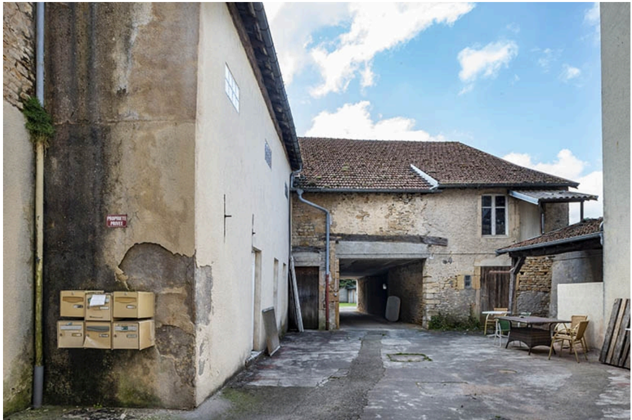
La rue Gambetta : n° 55, la cour vue en direction du sud.