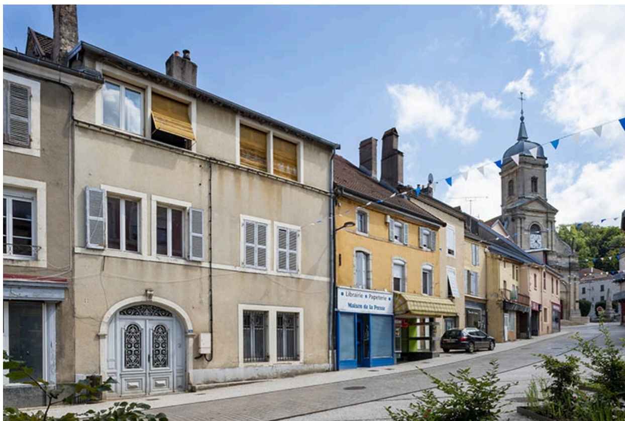
La rue Gambetta : n° 2 à 14.