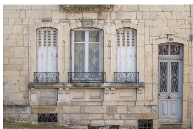
La rue Gambetta : n° 1, rez-de-chaussée. IVR43_20227000045NUC4A