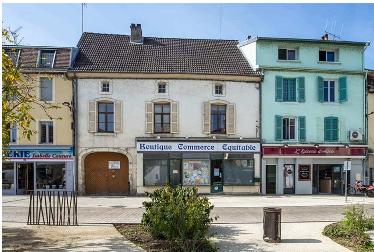
La rue Gambetta : n° 33 et 35.