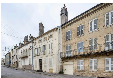
La rue Bontemps : n° 22 à 28.