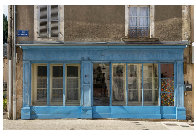
La rue Gambetta : n° 21 et sa devanture.