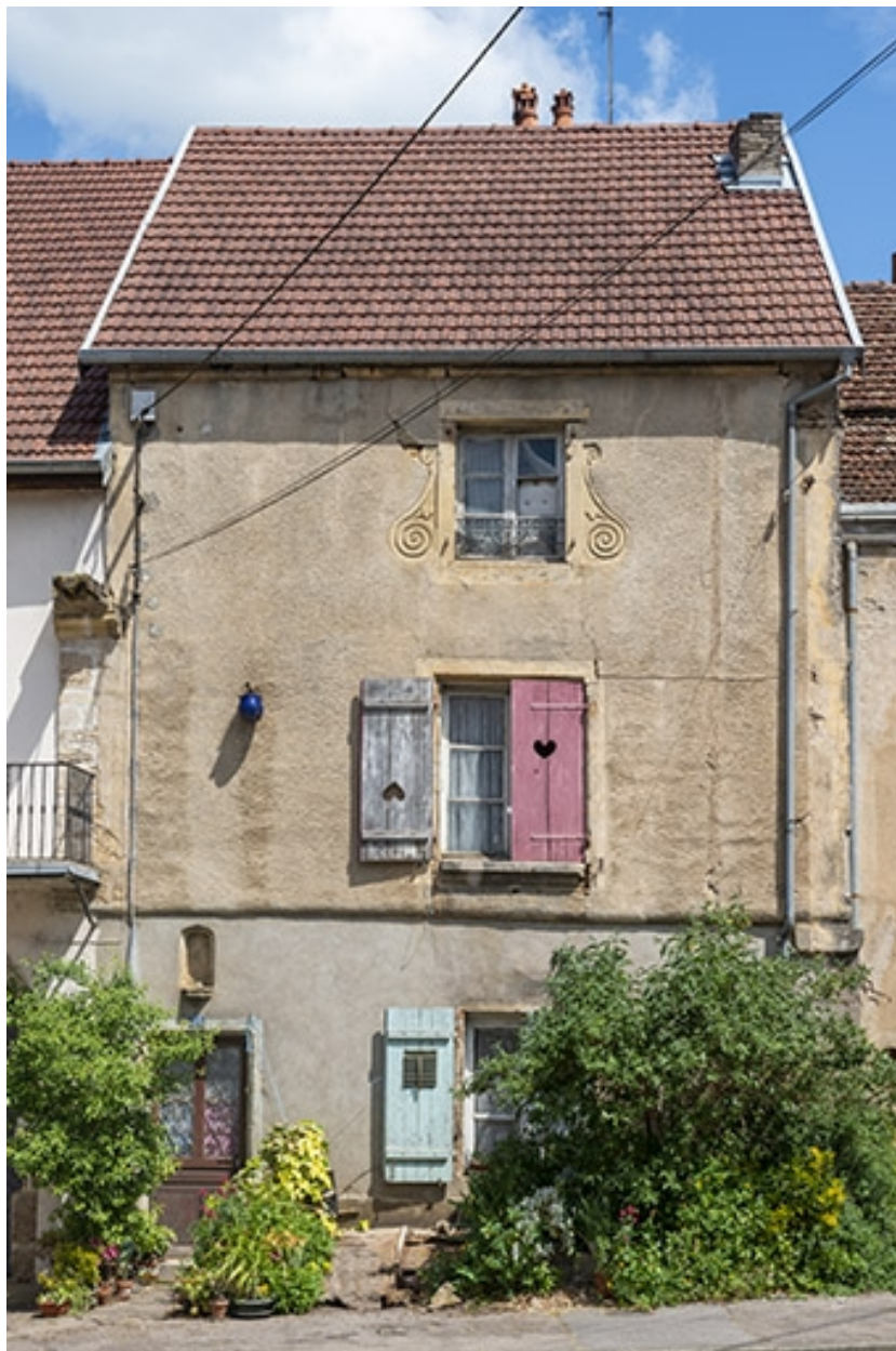
La rue Bontemps : n° 35.