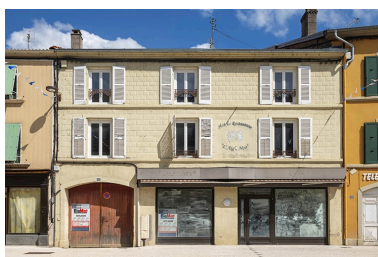
La rue Gambetta : n° 68.