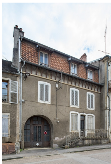
La rue Bontemps : n° 25. IVR43_20217000227NUC4A