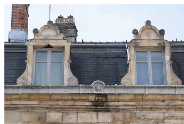
La rue Gambetta : n° 1, lucarnes. IVR43_20227000047NUC4A