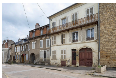
La rue Bontemps : n° 17 à 27. IVR43_20217000231NUC4A