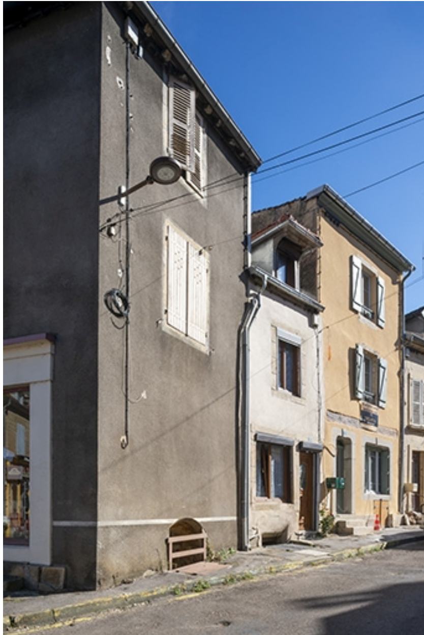
La rue Bontemps : n° 7 et 9.