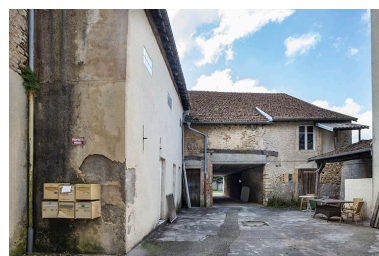
La rue Gambetta : n° 55, la cour vue en direction du sud.