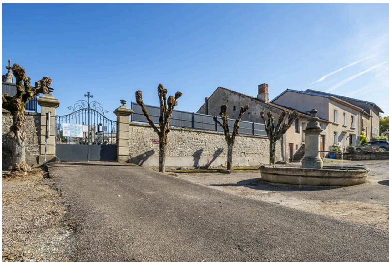
La rue Bontemps : entrée du cimetière.