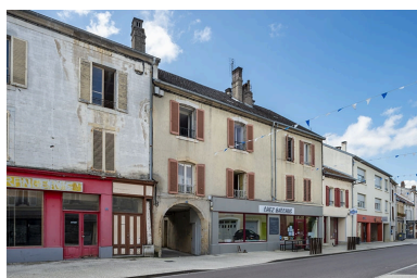
La rue Gambetta : n° 53 et suivants.