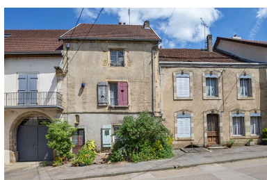
La rue Bontemps : n° 35 et 37.