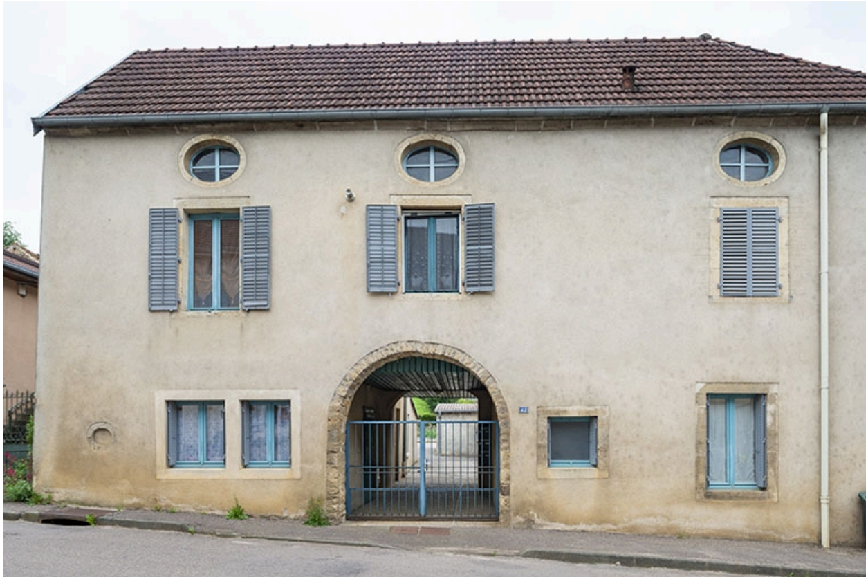
La rue Bontemps : n° 42.