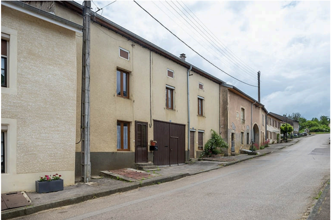
La rue Bontemps : n° 41 et suivants.