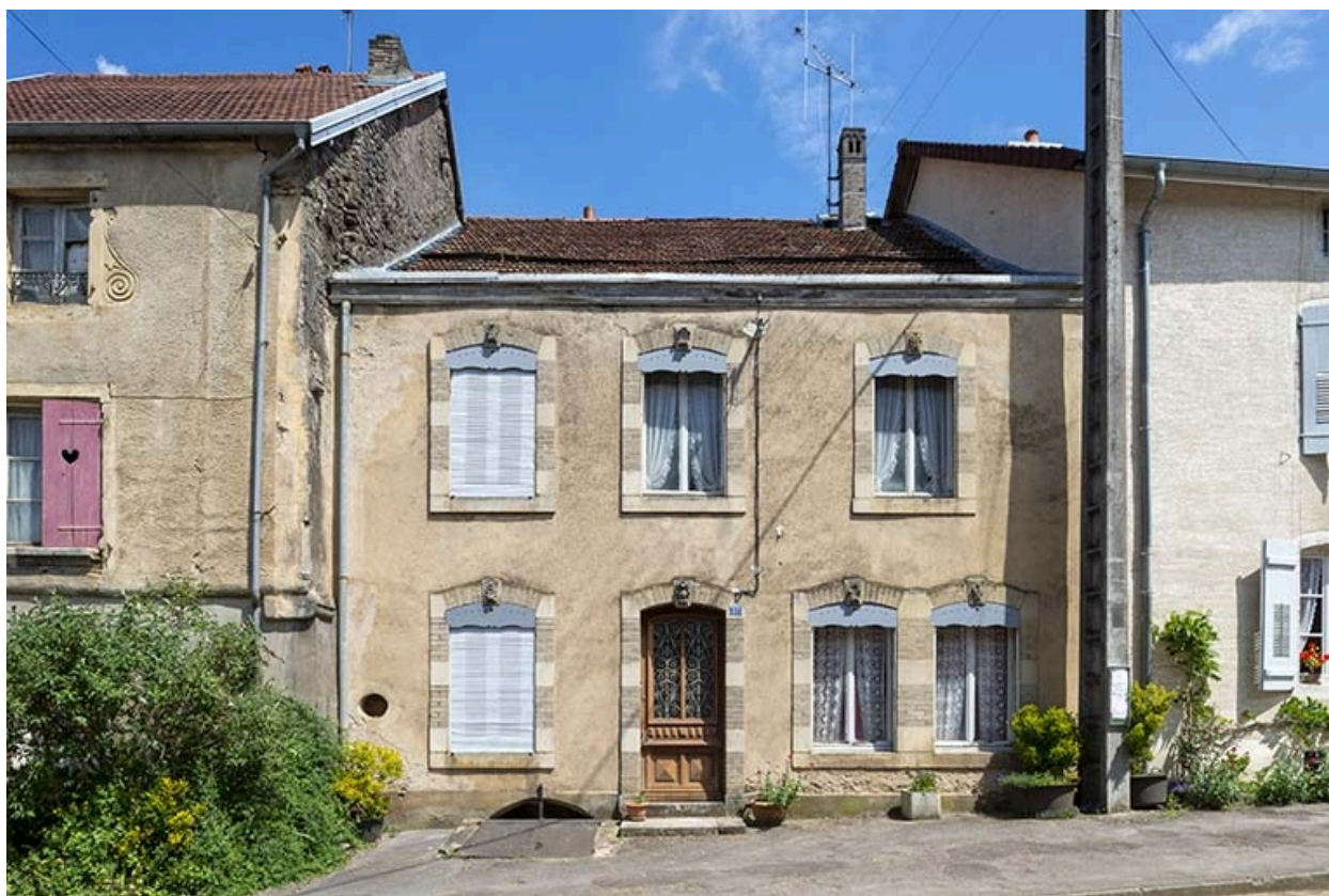
La rue Bontemps : n° 37.