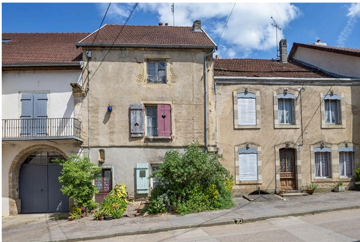
La rue Bontemps : n° 35 et 37.