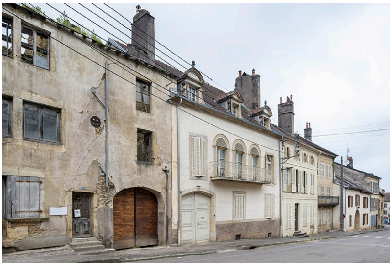
La rue Bontemps : n° 28 à 18.