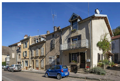
La rue Bontemps : n° 15 à 9. IVR43_20217000647NUC4A