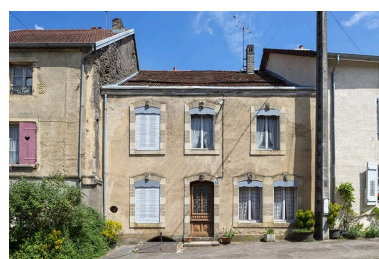
La rue Bontemps : n° 37.