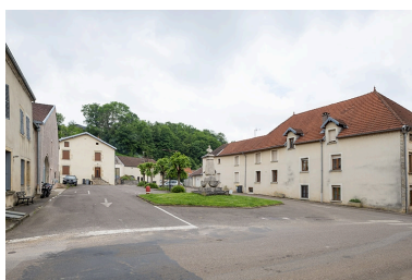
La rue Bontemps : croisement de la rue Charles-Rech.