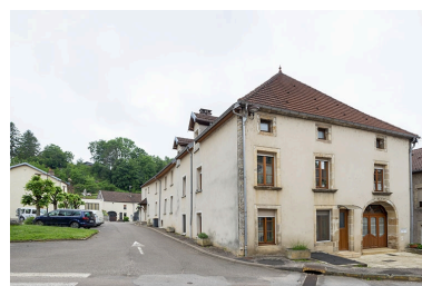
La rue Bontemps : n° 40 et immeubles bordant la rue Charles-Rech au nord. IVR43_20217000253NUC4A