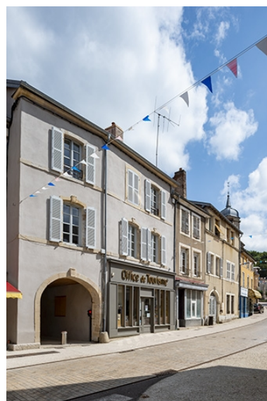
La rue Gambetta : n° 18 et précédents. IVR43_20217000600NUC4A