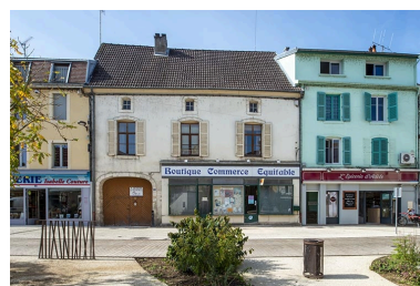
La rue Gambetta : n° 33 et 35. IVR43_20217000616NUC4A