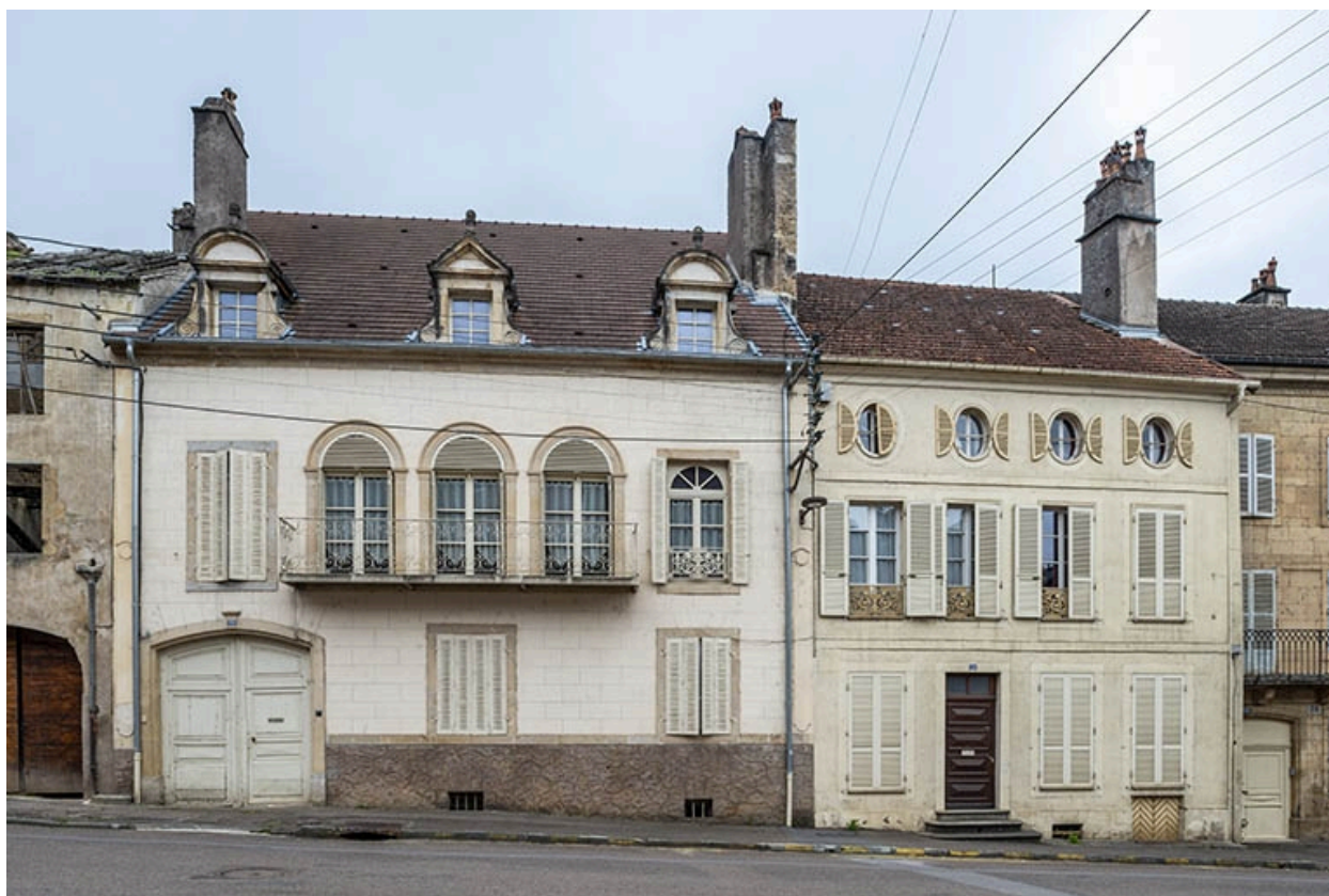
La rue Bontemps : n° 24 et 26.