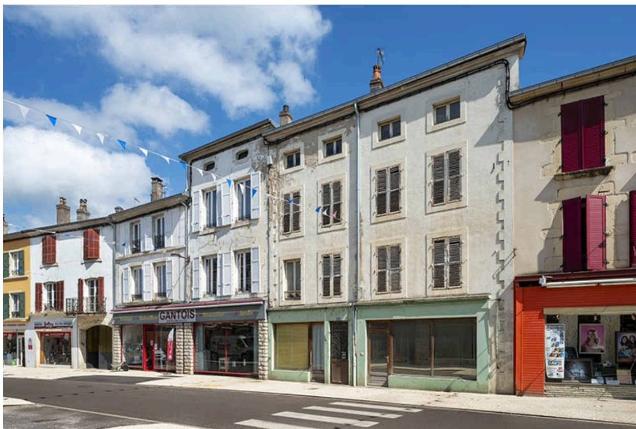
La rue Gambetta : n° 56 à 60.