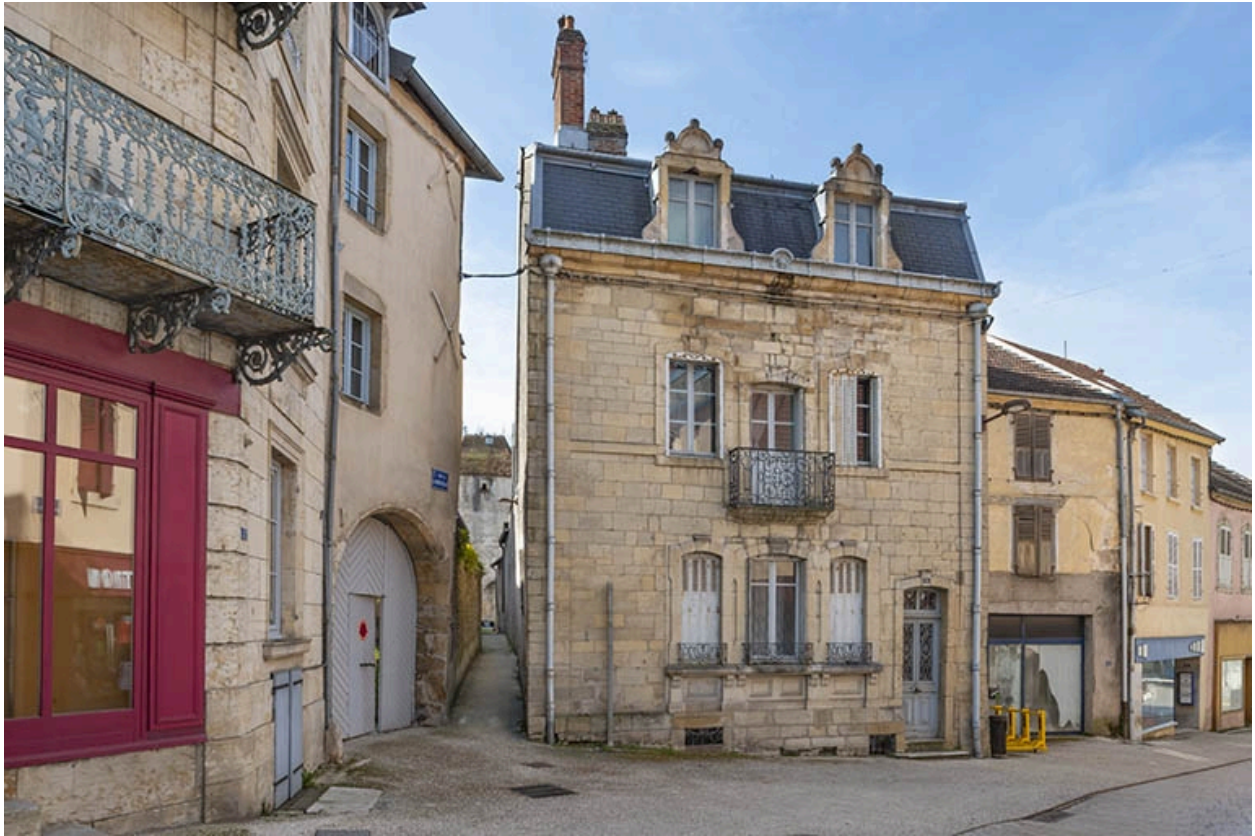
La rue Gambetta : n° 1.