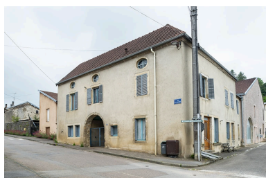
La rue Bontemps : n° 42, vue de trois quarts.