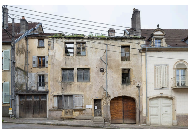
La rue Bontemps : n° 26 et 28. IVR43_20217000232NUC4A