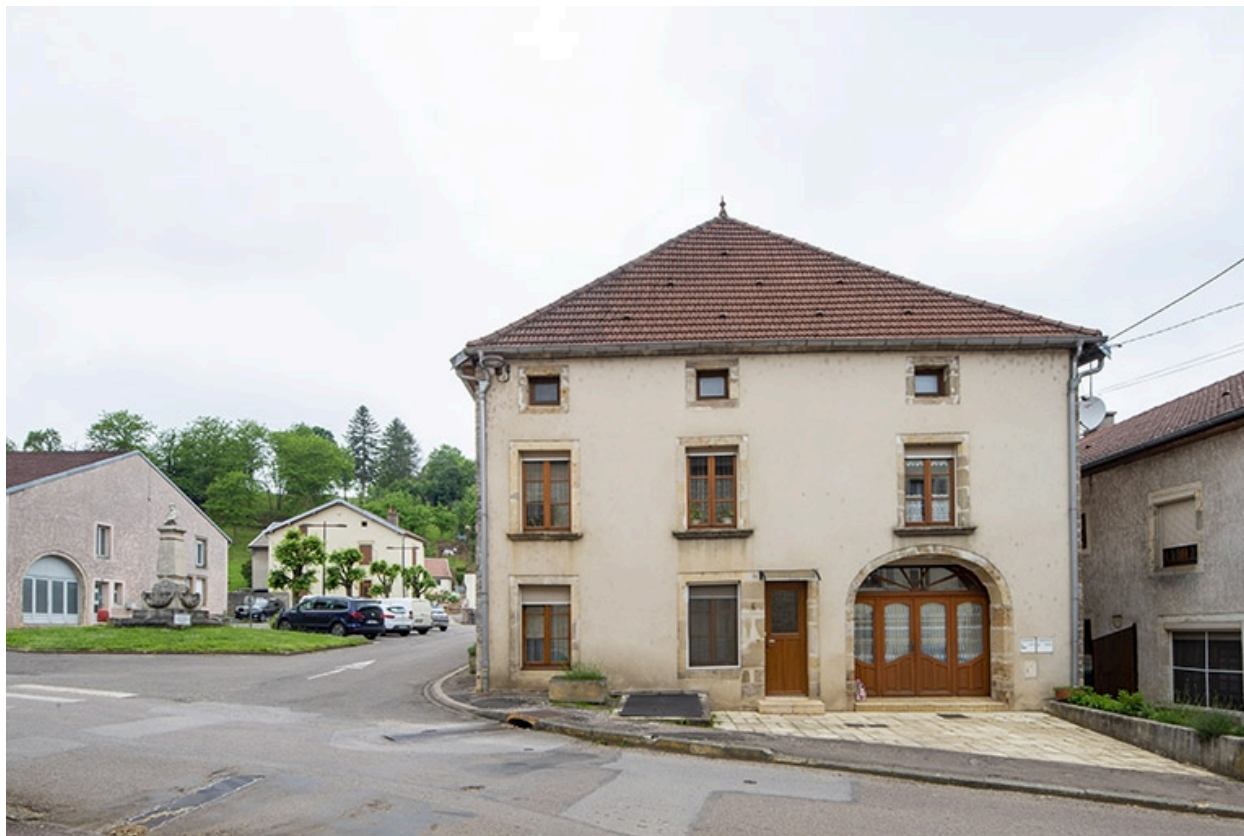
La rue Bontemps : n° 40.