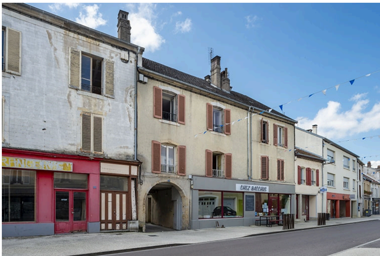
La rue Gambetta : n° 53 et suivants.