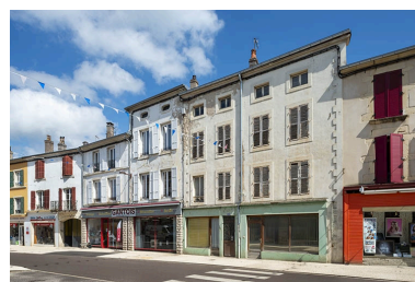
La rue Gambetta : n° 56 à 60. IVR43_20217000632NUC4A