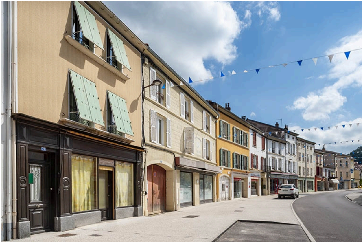
La rue Gambetta : n° 70 et suivants.