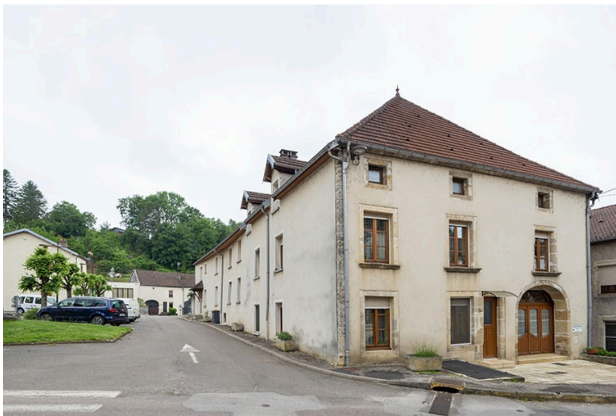
La rue Bontemps : n° 40 et immeubles bordant la rue Charles-Rech au nord.