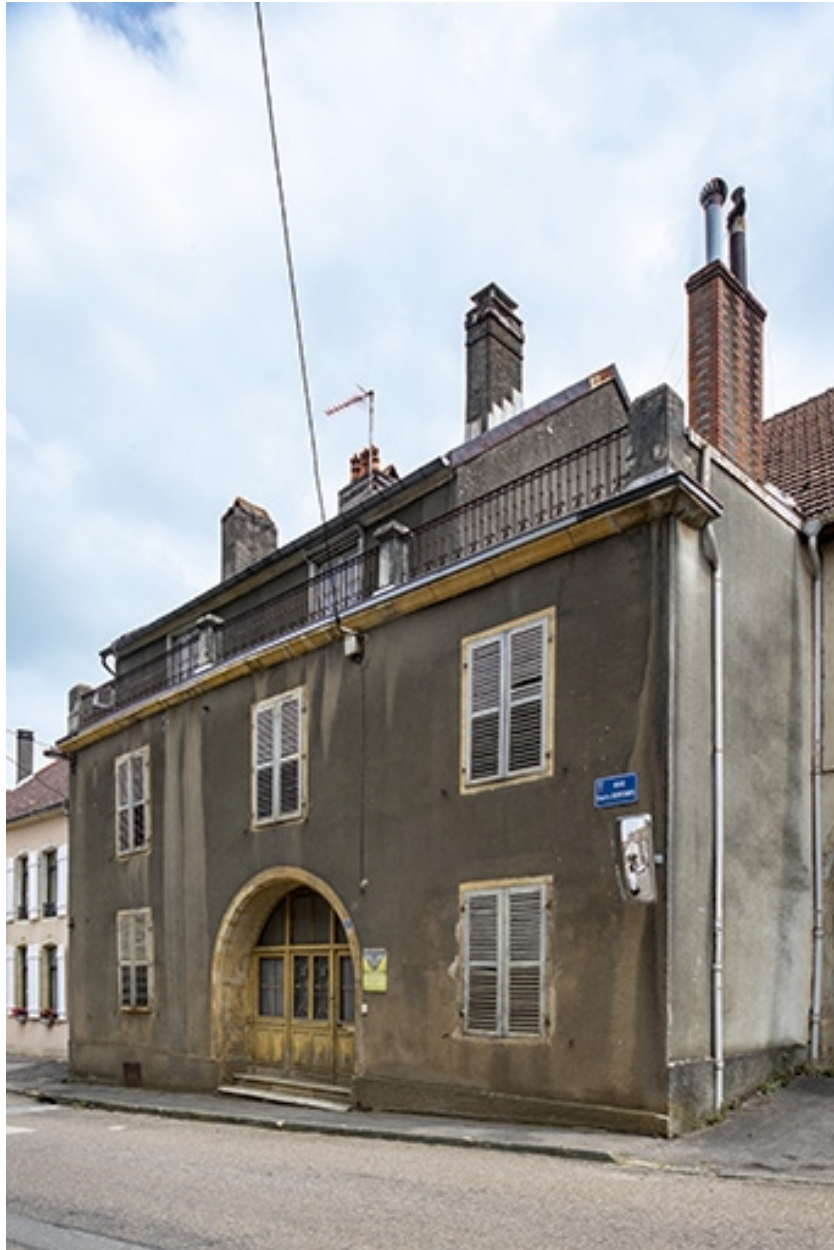
La rue Bontemps : n° 17 de trois quarts.