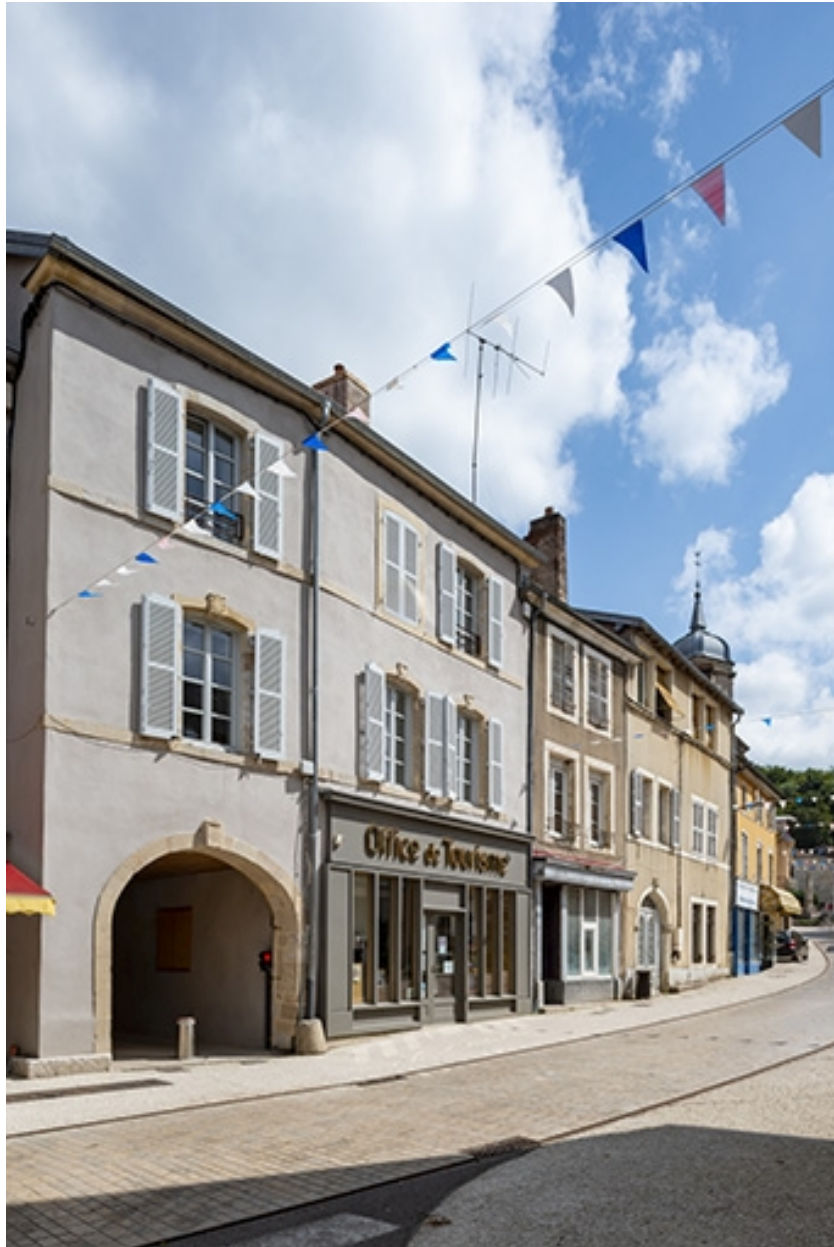
La rue Gambetta : n° 18 et précédents.