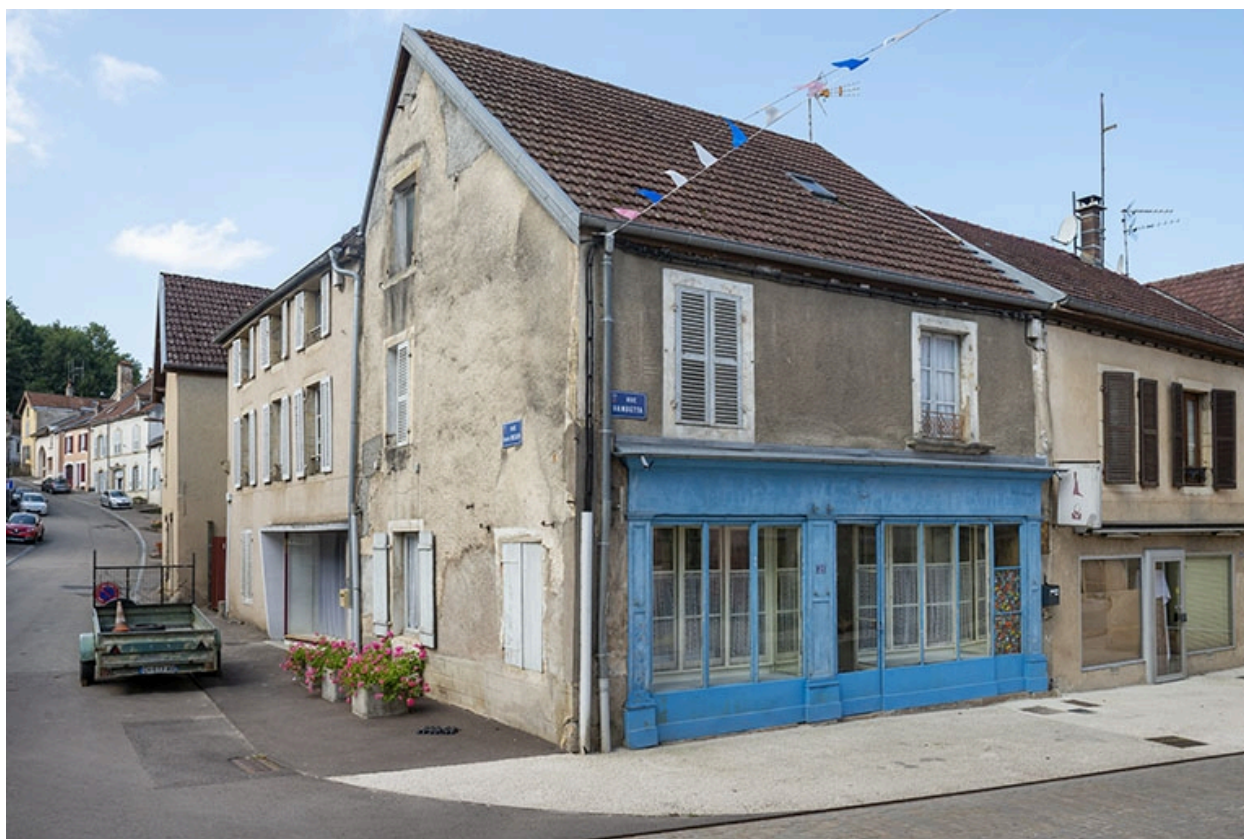
La rue Gambetta : n° 21 et entrée de la rue Decaen.