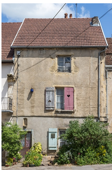
La rue Bontemps : n° 35. IVR43_20217000244NUC4A