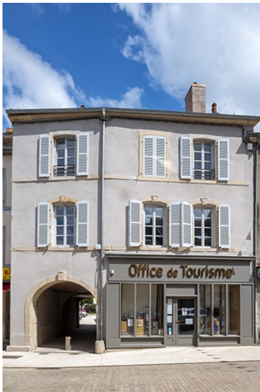
La rue Gambetta : n° 18.