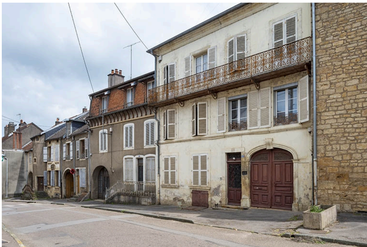
La rue Bontemps : n° 17 à 27.