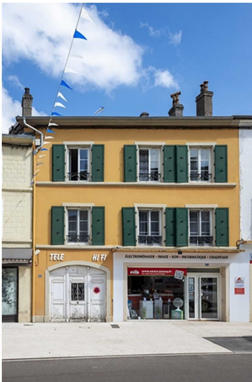
La rue Gambetta : n° 66.