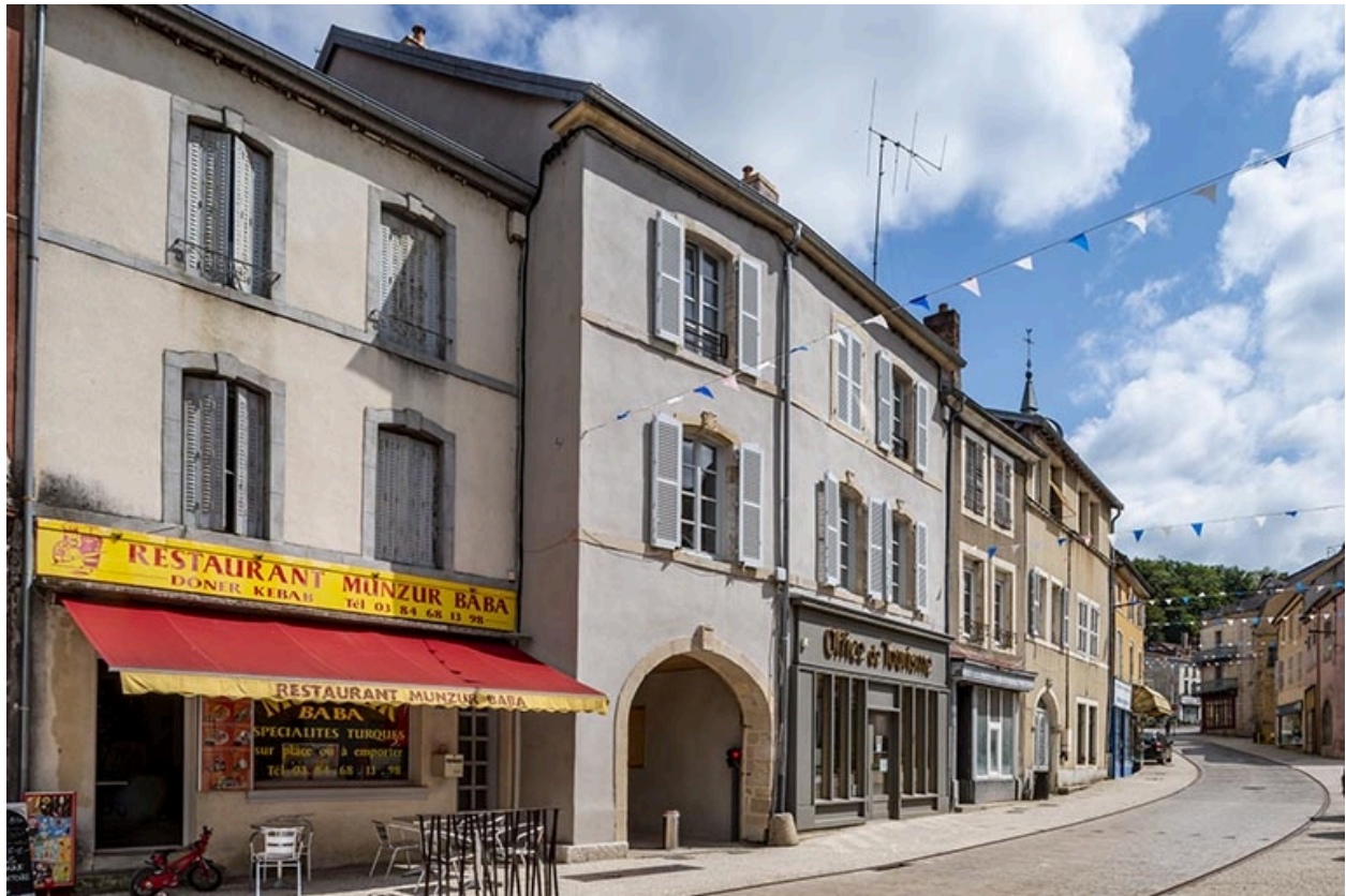
La rue Gambetta : n° 20 et précédents.