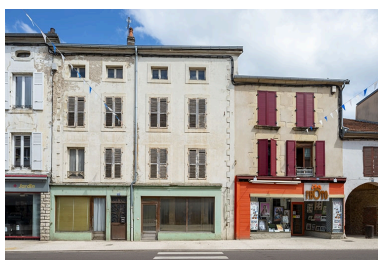
La rue Gambetta : n° 56 à 58. IVR43_20217000637NUC4A