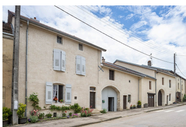
La rue Bontemps : n° 39 et 41 en direction du sud.