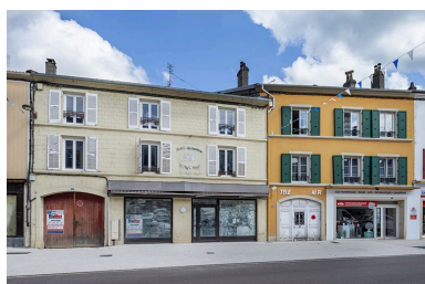
La rue Gambetta : n° 66 et 68. IVR43_20217000639NUC4A