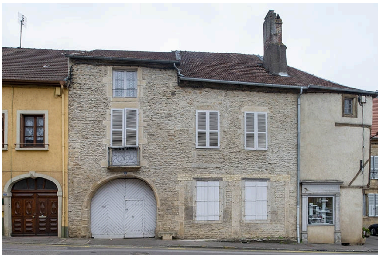
La rue Bontemps : n° 12 à 14.