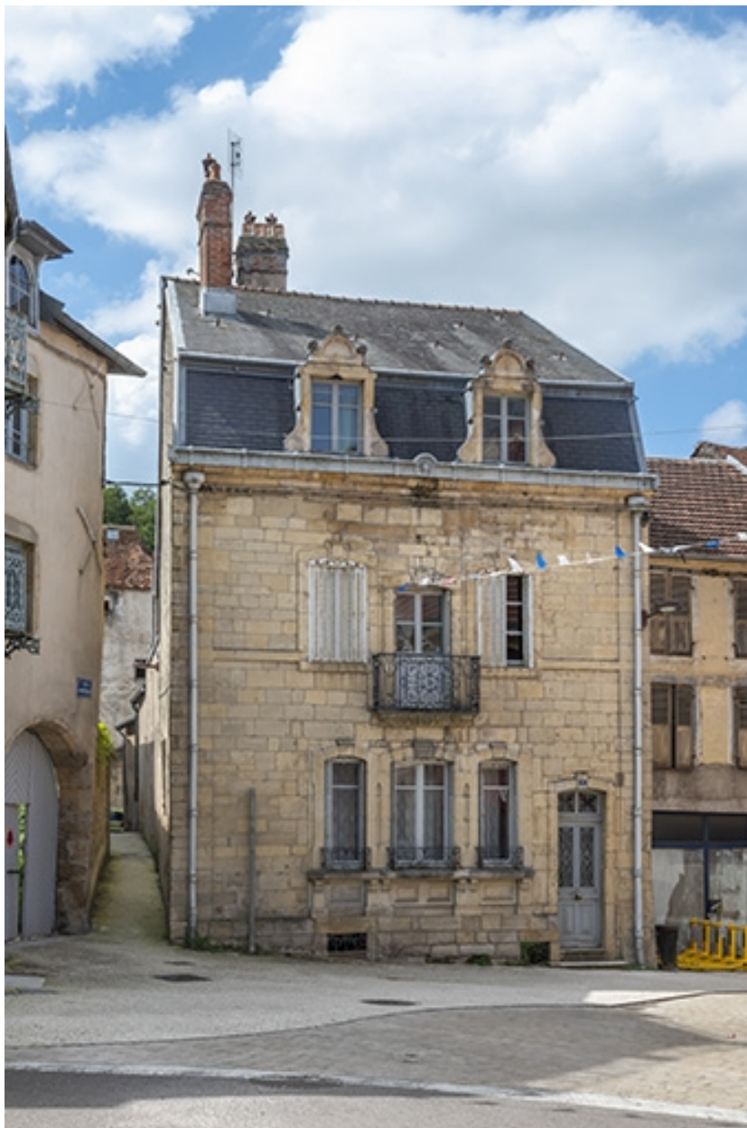
La rue Gambetta : n° 1.