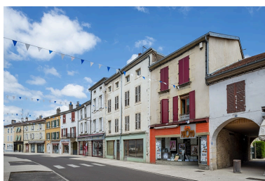
La rue Gambetta : n° 54 et suivants. IVR43_20217000638NUC4A