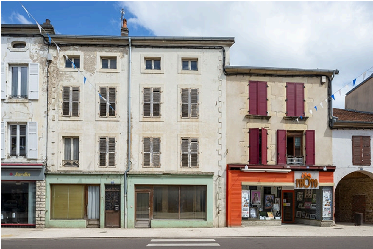
La rue Gambetta : n° 56 à 58.