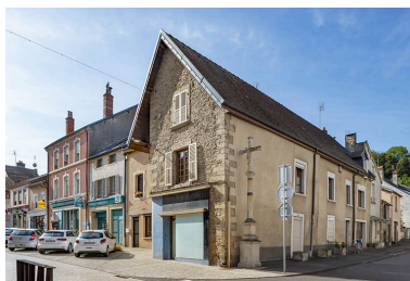
La rue Gambetta : n° 19. IVR43_20217000605NUC4A