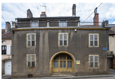
La rue Bontemps : n° 17 de face. IVR43_20217000218NUC4A