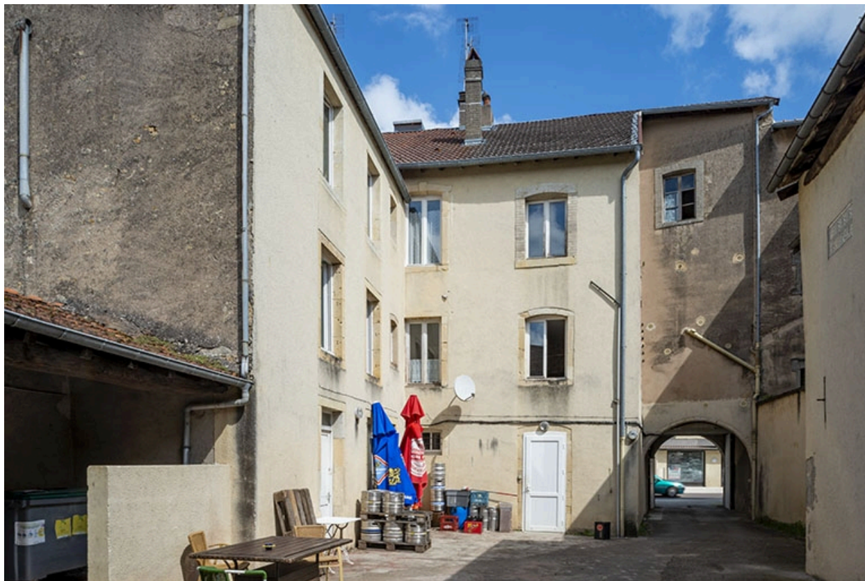
La rue Gambetta : n° 55, la cour et la façade postérieure.