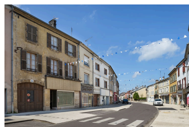
La rue Gambetta : n° 45 et vue d'ensemble de la rue. IVR43_20217000618NUC4A