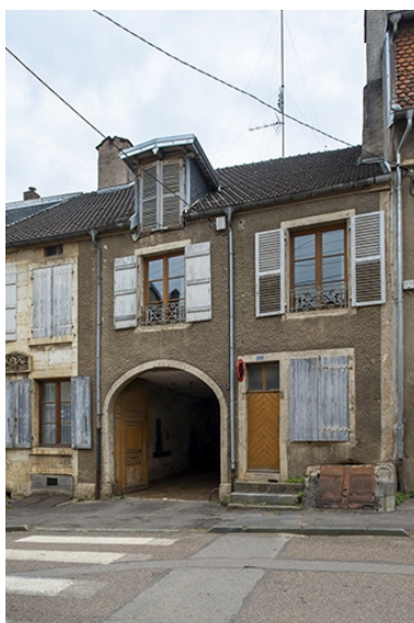
La rue Bontemps : n° 23, avec entrée de cave et porte cochère.