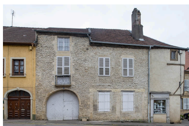
La rue Bontemps : n° 12 à 14. IVR43_20217000215NUC4A