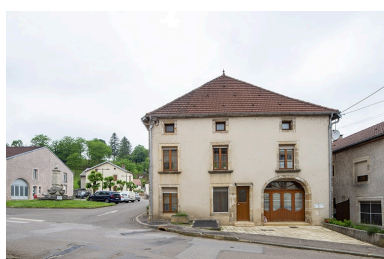
La rue Bontemps : n° 40. IVR43_20217000252NUC4A