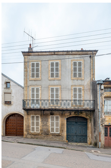
La rue Bontemps : n° 36. IVR43_20217000249NUC4A