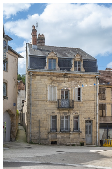
La rue Gambetta : n° 1. IVR43_20227000042NUC4A