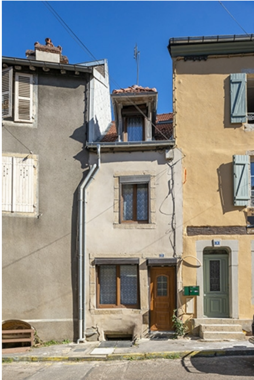
La rue Bontemps : n° 7.