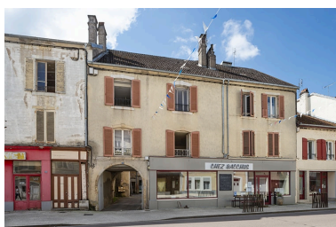
La rue Gambetta : n° 55. IVR43_20217000629NUC4A