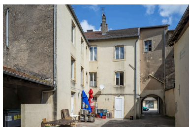
La rue Gambetta : n° 55, la cour et la façade postérieure. IVR43_20217000631NUC4A