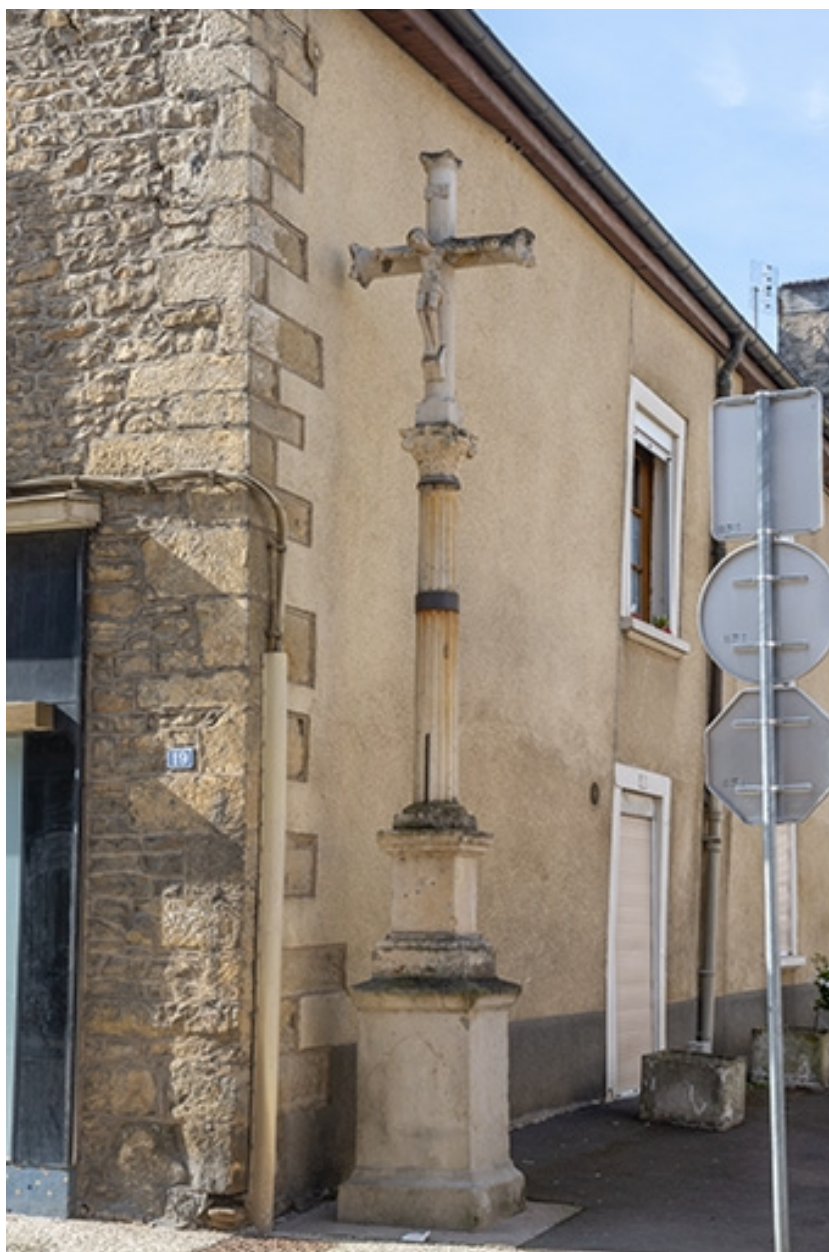
La rue Gambetta : calvaire à l'entrée de la rue Decaen.