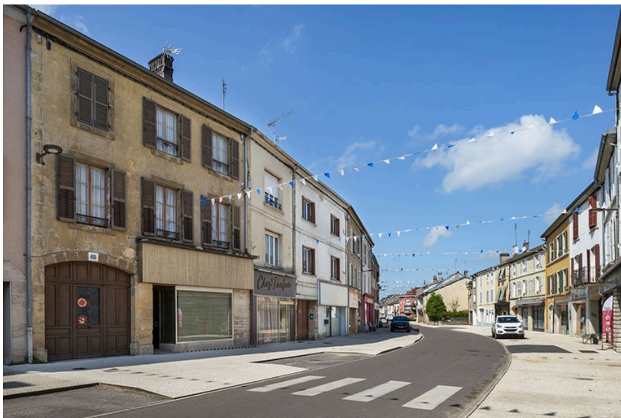
La rue Gambetta : n° 45 et vue d'ensemble de la rue.