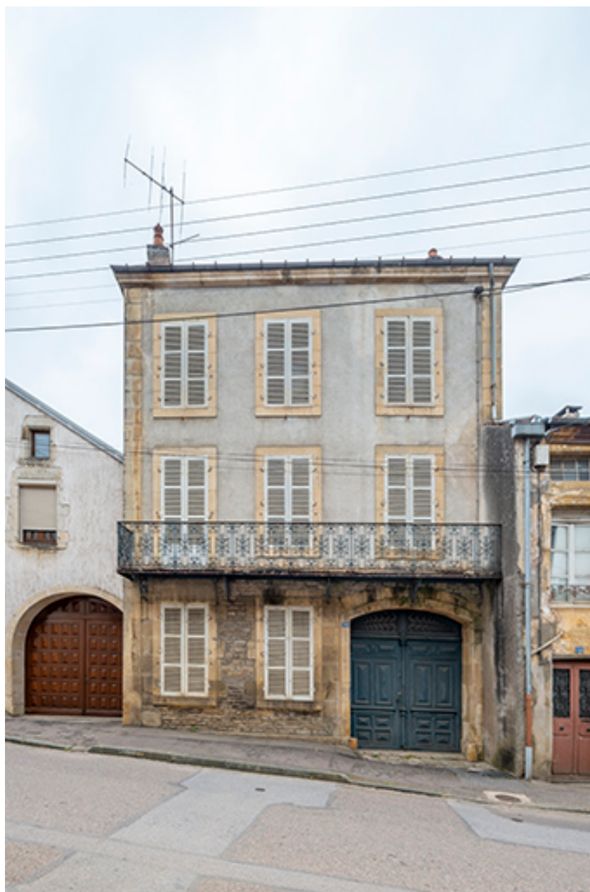
La rue Bontemps : n° 36.