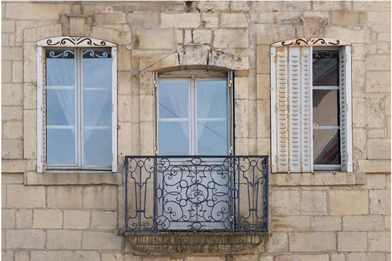
La rue Gambetta : n° 1, étage.