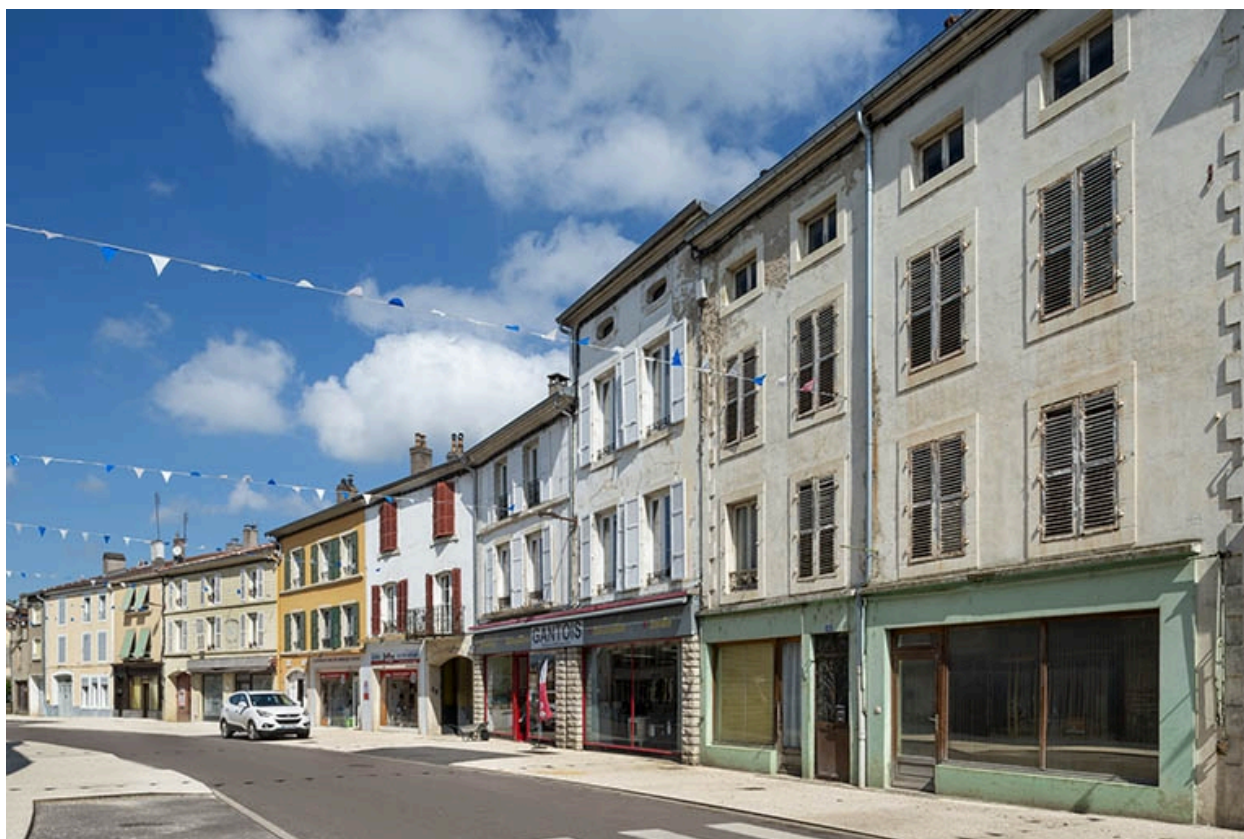
La rue Gambetta : n° 56 à 60.