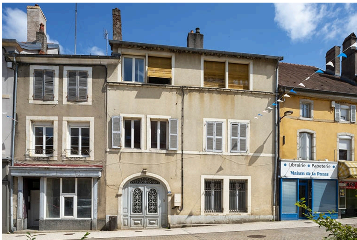
La rue Gambetta : n° 14.