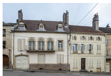
La rue Bontemps : n° 24 et 26.