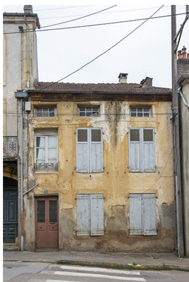
La rue Bontemps : n° 34. IVR43_20217000243NUC4A