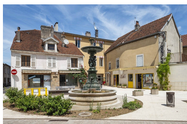
La rue Gambetta : fontaine des anges, en face du n° 33.