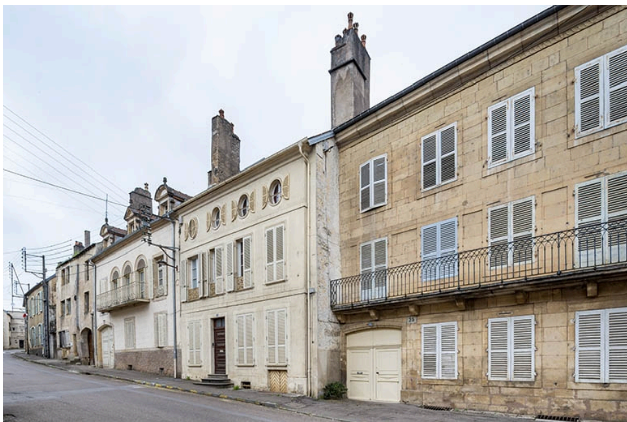
La rue Bontemps : n° 22 à 28.