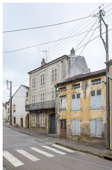
La rue Bontemps : n° 34 et 36. IVR43_20217000242NUC4A