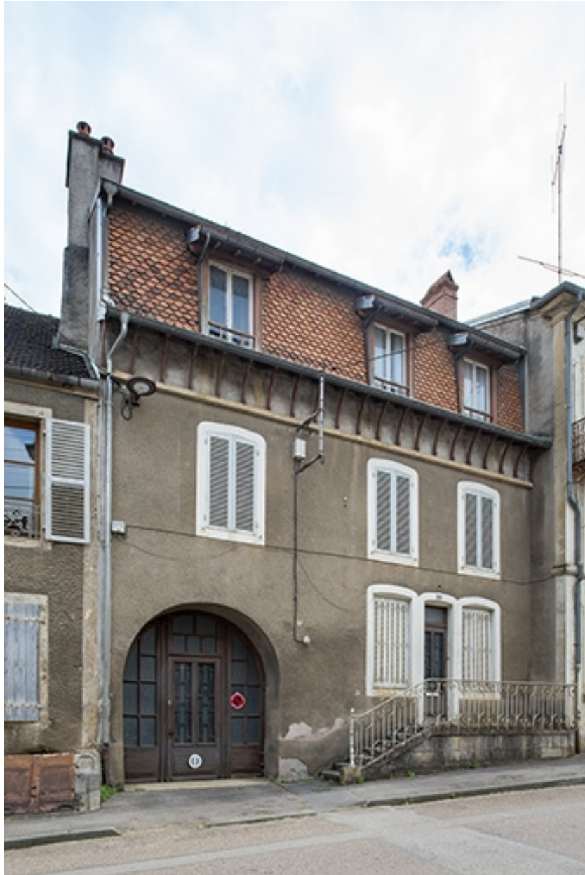
La rue Bontemps : n° 25.