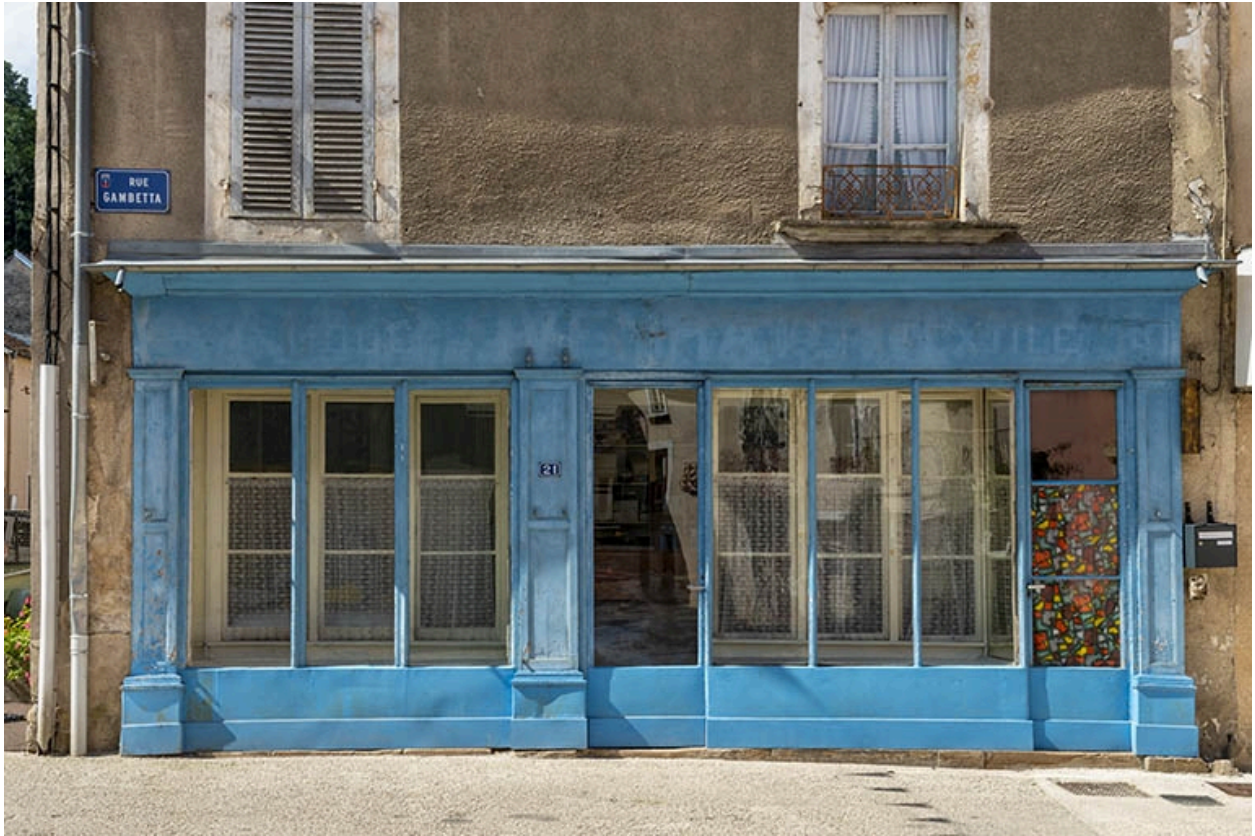
La rue Gambetta : n° 21 et sa devanture.