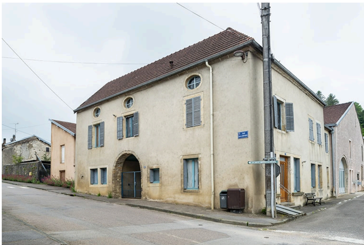
La rue Bontemps : n° 42, vue de trois quarts.