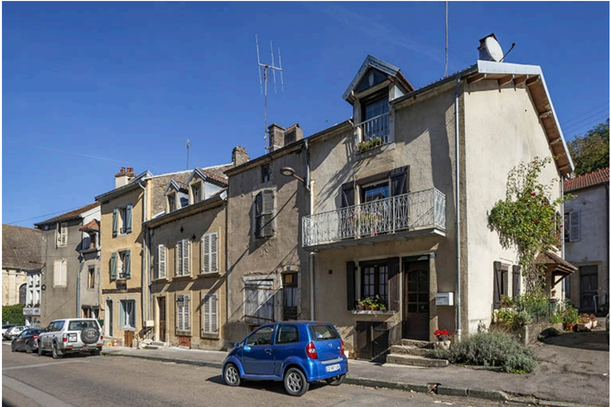
La rue Bontemps : n° 15 à 9.