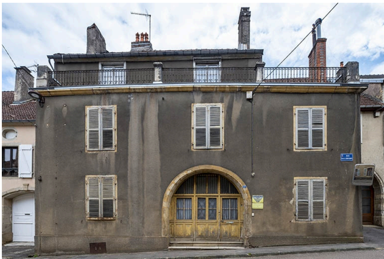
La rue Bontemps : n° 17 de face.