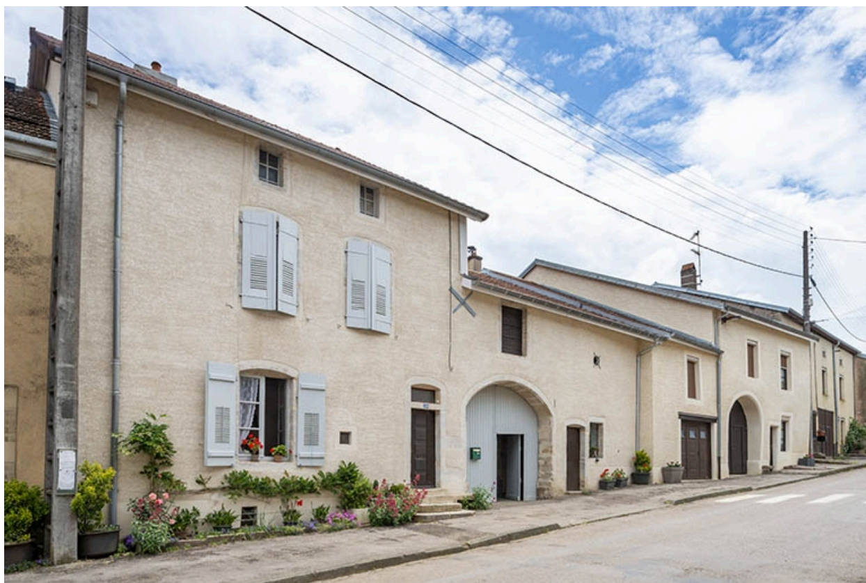
La rue Bontemps : n° 39 et 41 en direction du sud.