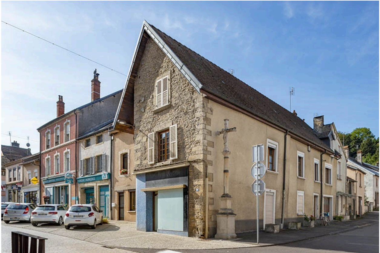
La rue Gambetta : n° 19.