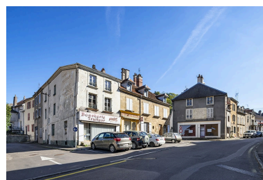
La rue Bontemps : n° 3 et 5 et perspective de la rue vers le sud. IVR43_20217000650NUC4A