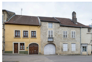
La rue Bontemps : n° 12 à 16. IVR43_20217000216NUC4A