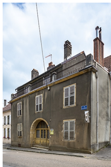
La rue Bontemps : n° 17 de trois quarts. IVR43_20217000217NUC4A