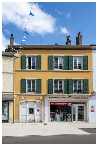
La rue Gambetta : n° 66. IVR43_20217000643NUC4A