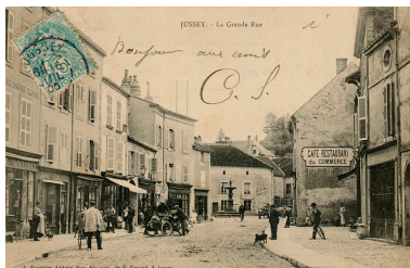
La rue Gambetta au début du 20e siècle.