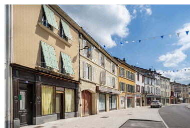
La rue Gambetta : n° 70 et suivants. IVR43_20217000640NUC4A