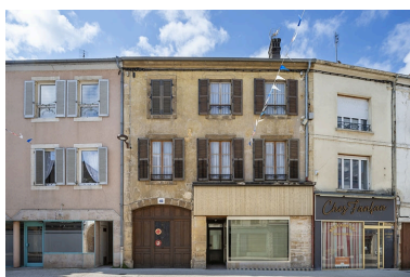
La rue Gambetta : n° 43 à 47. IVR43_20217000617NUC4A