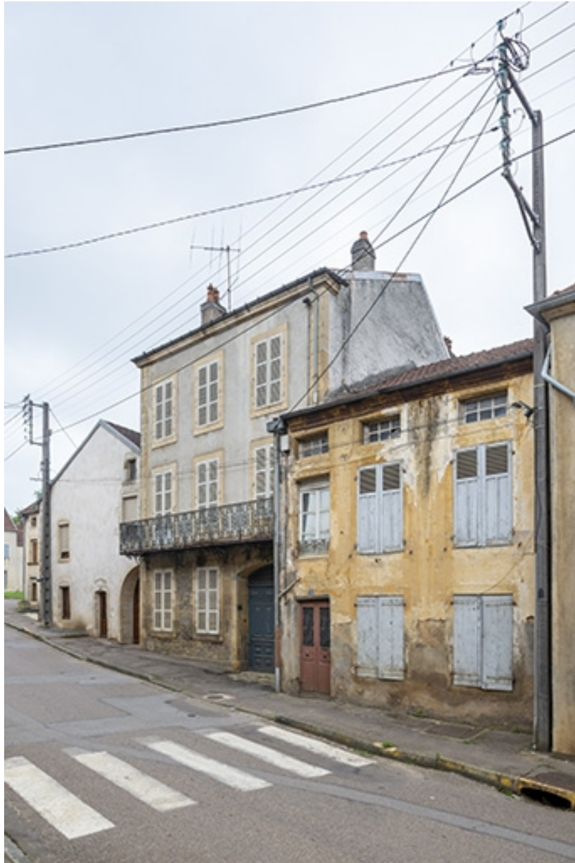
La rue Bontemps : n° 34 et 36.