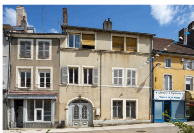
La rue Gambetta : n° 14. IVR43_20217000597NUC4A