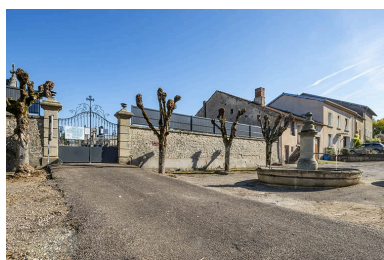
La rue Bontemps : entrée du cimetière. IVR43_20217000662NUC4A