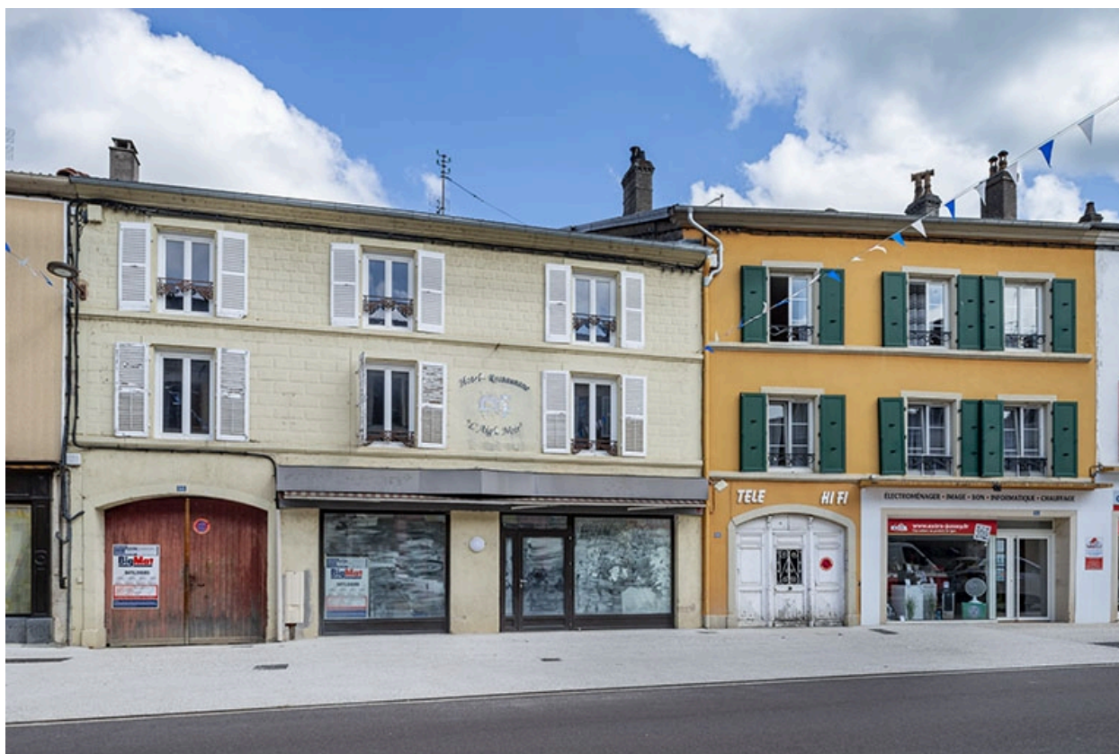
La rue Gambetta : n° 66 et 68.