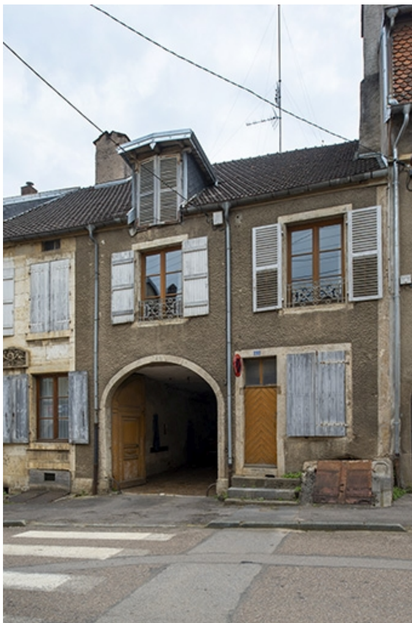
La rue Bontemps : n° 23, avec entrée de cave et porte cochère.