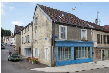
La rue Gambetta : n° 21 et entrée de la rue Decaen. IVR43_20217000612NUC4A