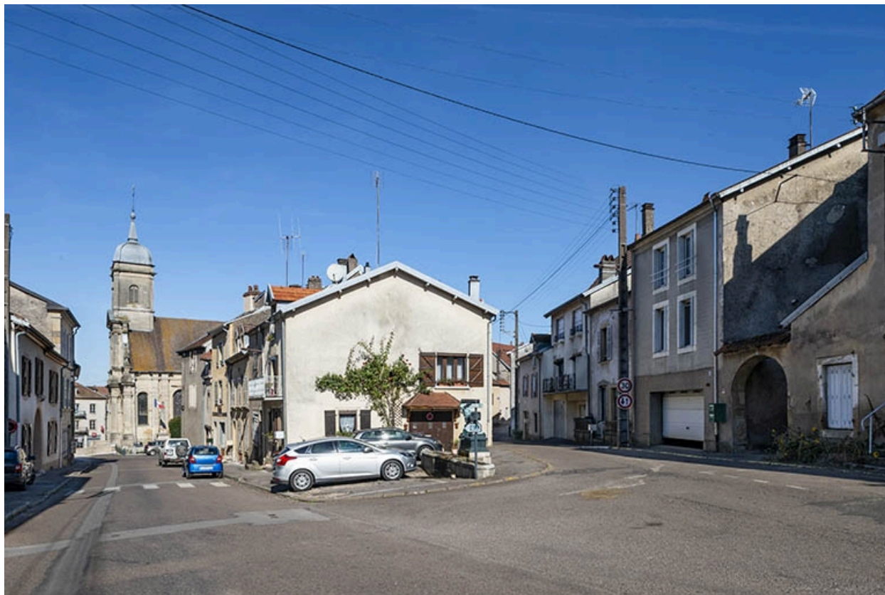
La rue Bontemps : croisement de la rue Thiers.