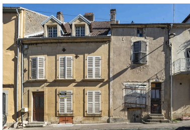
La rue Bontemps : n° 11 et 13. IVR43_20217000648NUC4A