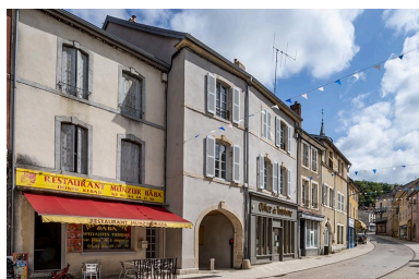
La rue Gambetta : n° 20 et précédents. IVR43_20217000601NUC4A