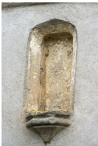
La rue Bontemps : n° 35, détail de la niche ménagée dans la façade.