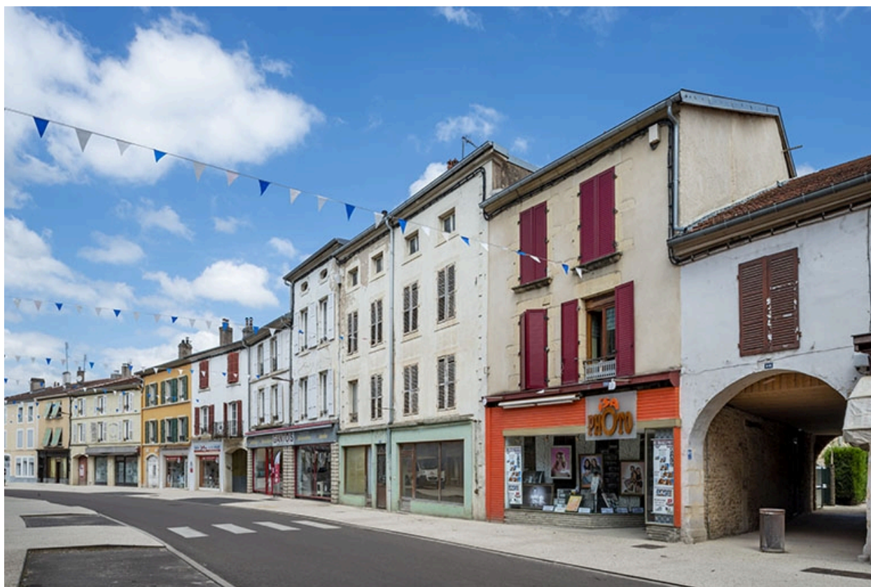
La rue Gambetta : n° 54 et suivants.