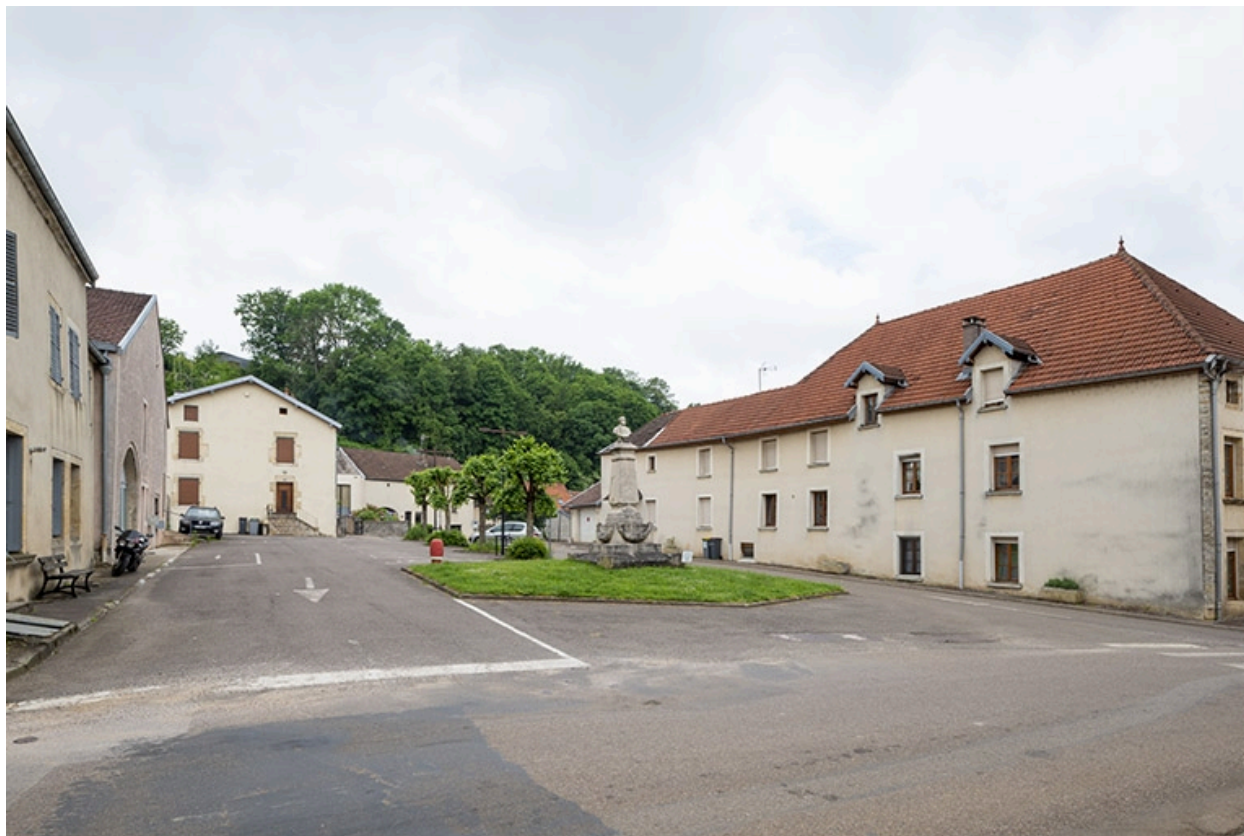
La rue Bontemps : croisement de la rue Charles-Rech.