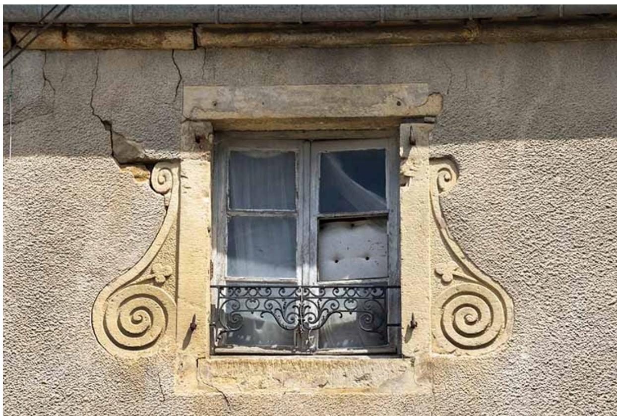
La rue Bontemps : n° 35, détail des ailerons encadrant la fenêtre du 2e étage.