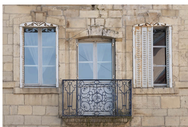
La rue Gambetta : n° 1, étage. IVR43_20227000046NUC4A