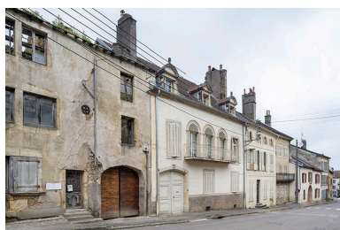
La rue Bontemps : n° 28 à 18.