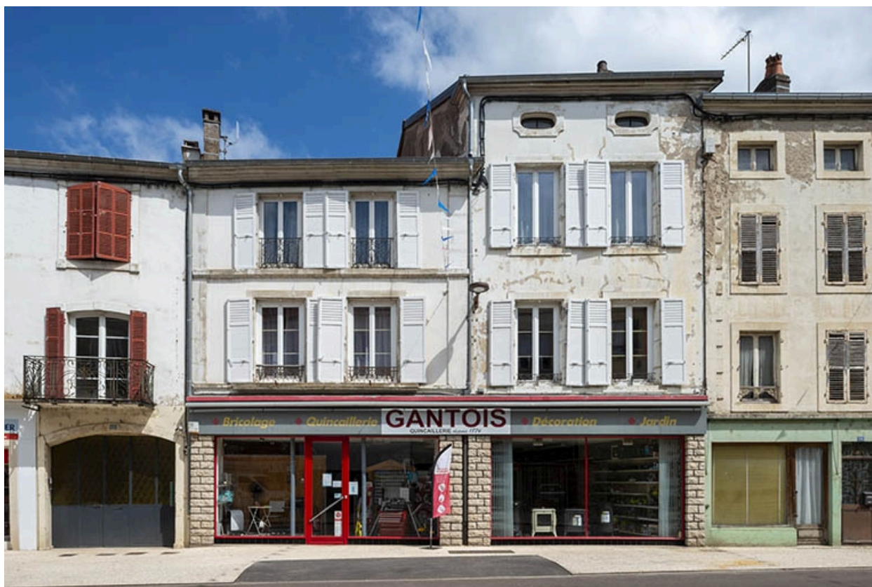
La rue Gambetta : n° 60.