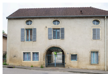
La rue Bontemps : n° 42. IVR43_20217000256NUC4A