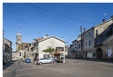
La rue Bontemps : croisement de la rue Thiers.