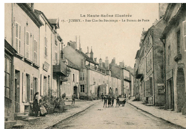
L'entrée de la rue Charles-Bontemps au début du 20e siècle.