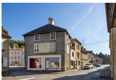
La rue Bontemps : n° 5, face nord et perspective de la rue vers le sud.