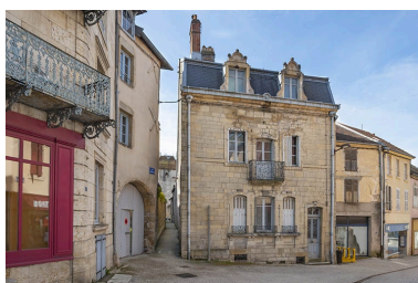
La rue Gambetta : n° 1. IVR43_20227000044NUC4A