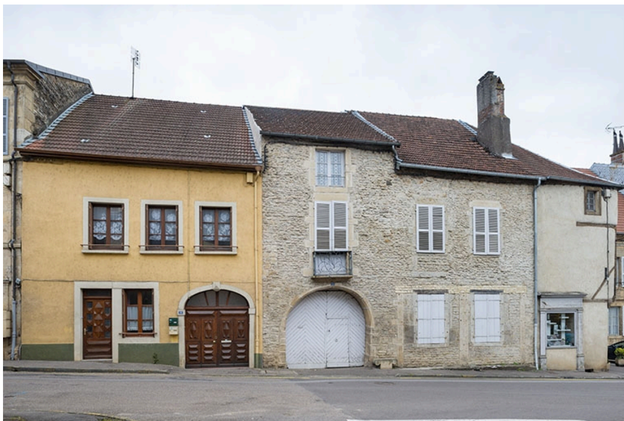
La rue Bontemps : n° 12 à 16.