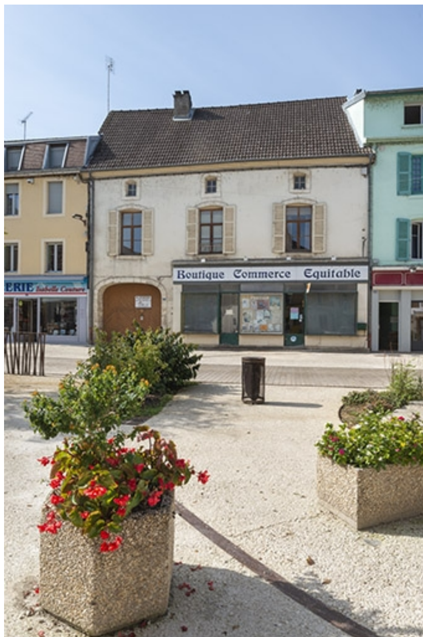
La rue Gambetta : n° 33.