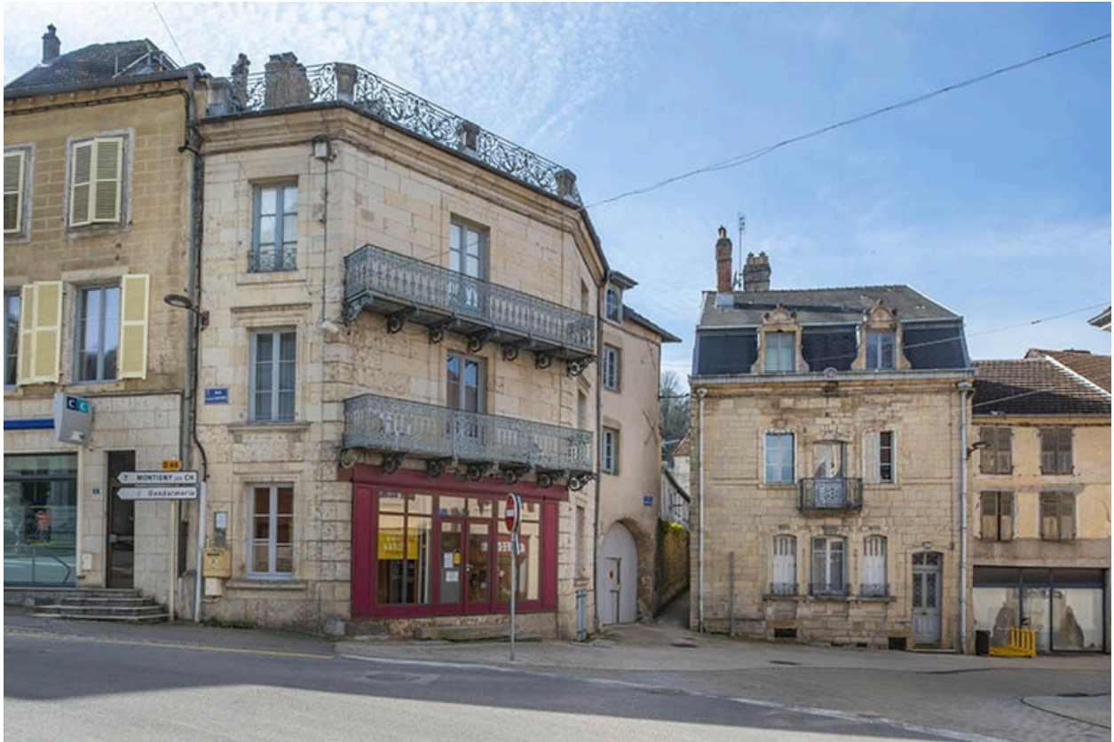
Intersection des rues Bontemps et Gambetta.