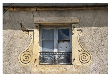
La rue Bontemps : n° 35, détail des ailerons encadrant la fenêtre du 2e étage. IVR43_20217000245NUC4A