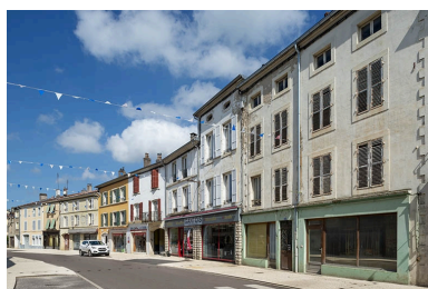
La rue Gambetta : n° 56 à 60. IVR43_20217000633NUC4A