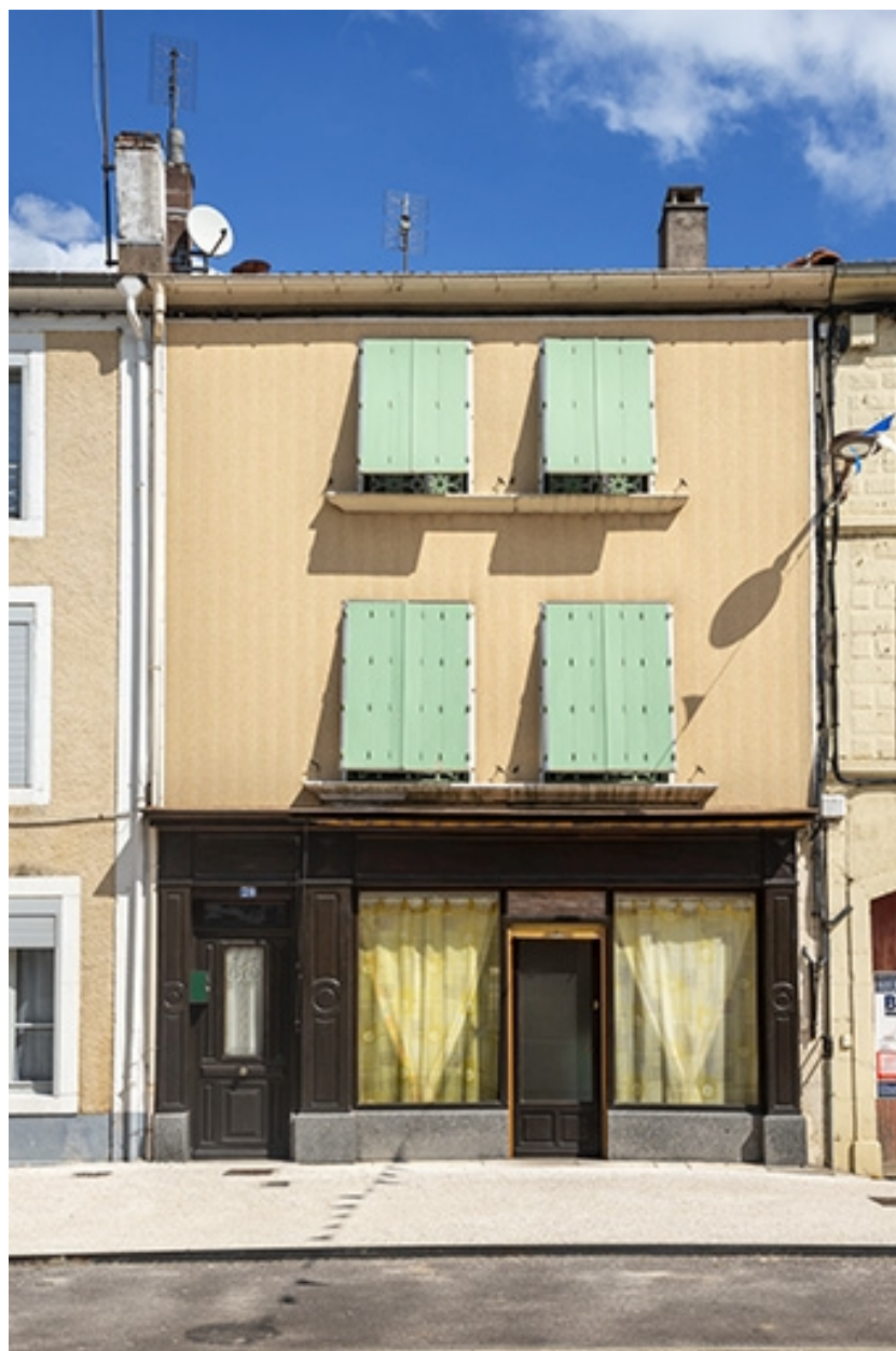
La rue Gambetta : n° 70.