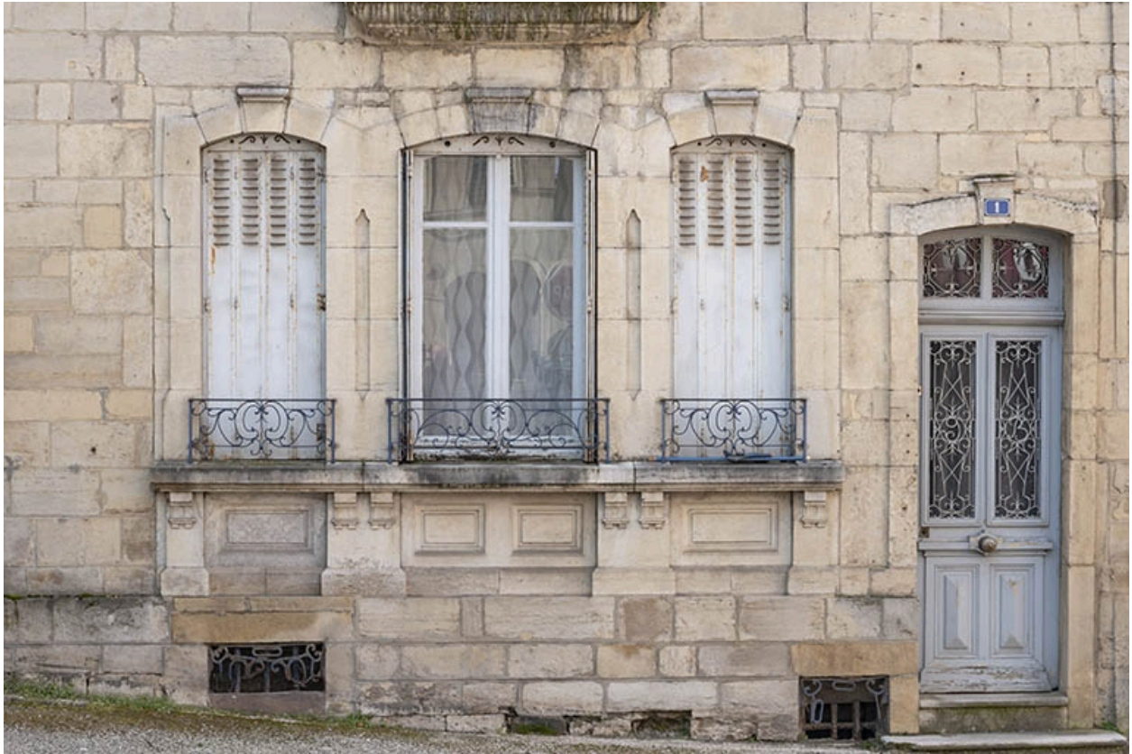
La rue Gambetta : n° 1, rez-de-chaussée.