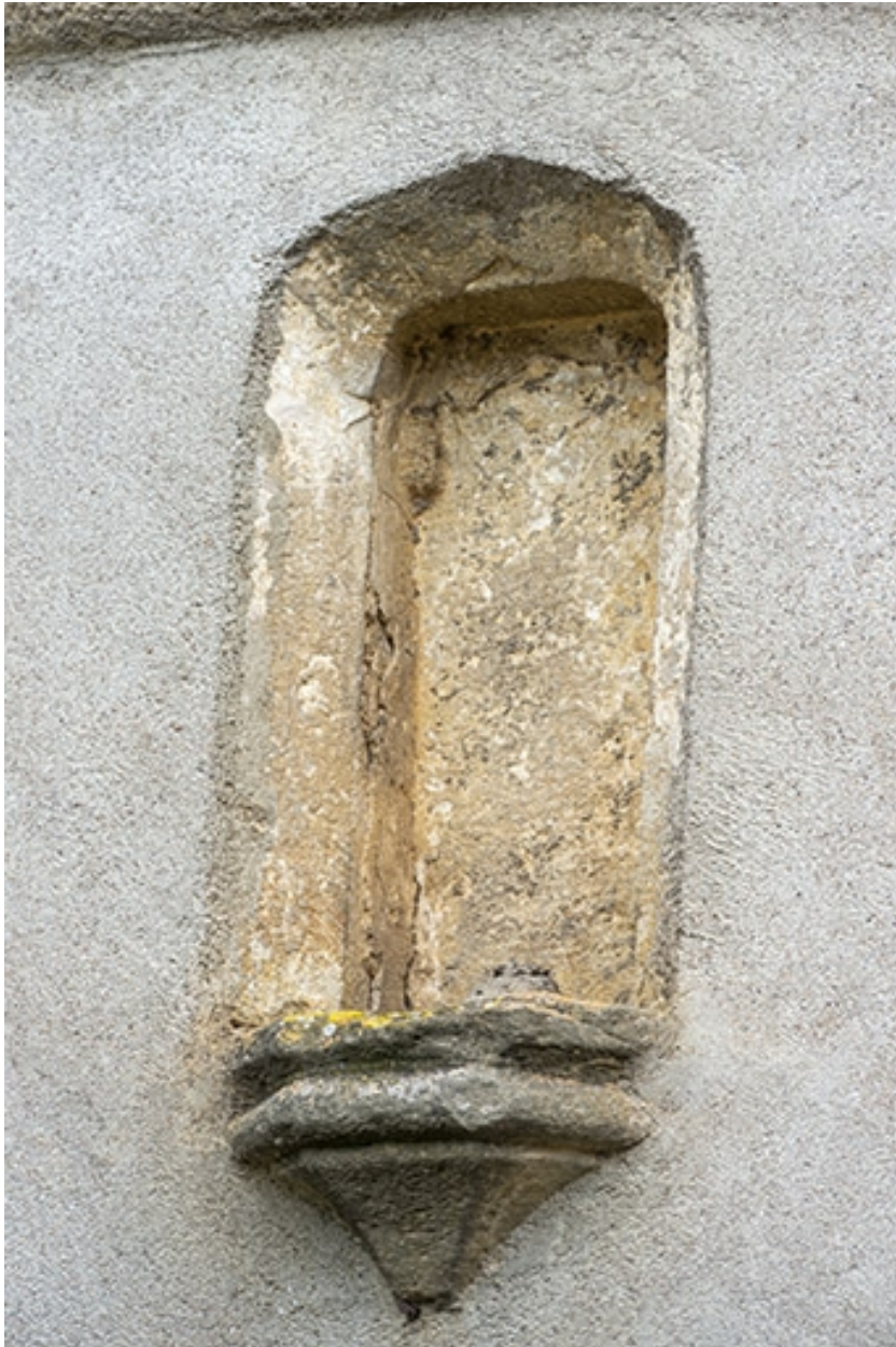
La rue Bontemps : n° 35, détail de la niche ménagée dans la façade.