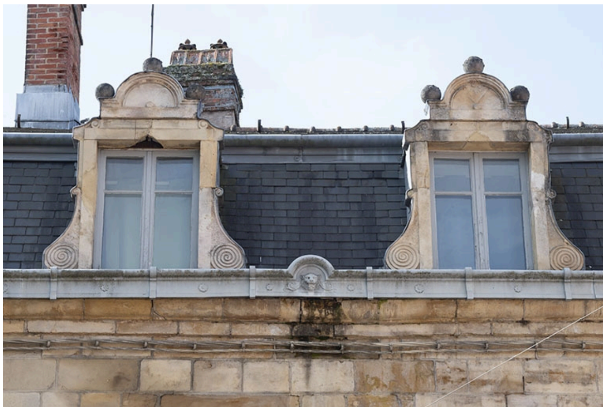
La rue Gambetta : n° 1, lucarnes.