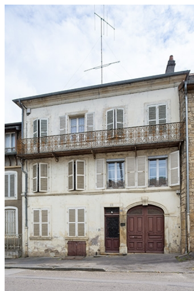
La rue Bontemps : n° 27. IVR43_20217000230NUC4A