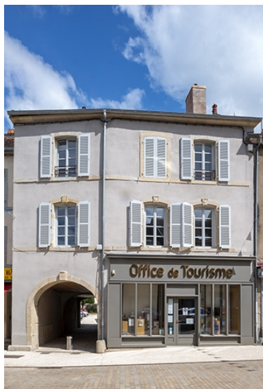
La rue Gambetta : n° 18.