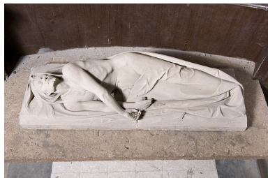
Vue générale. IVR43_20102500160NUC4A