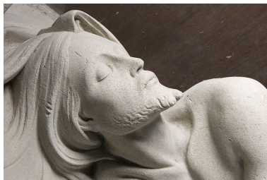
Détail : le visage, vue de profil.