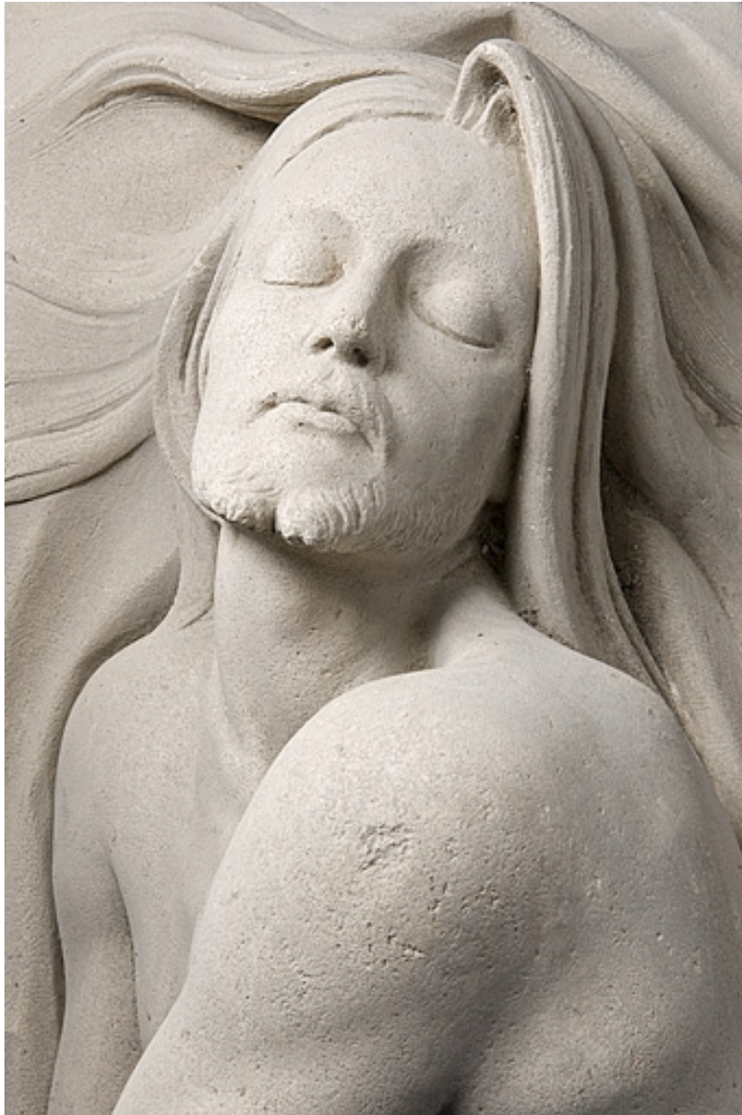
Détail : le visage, vue de face.