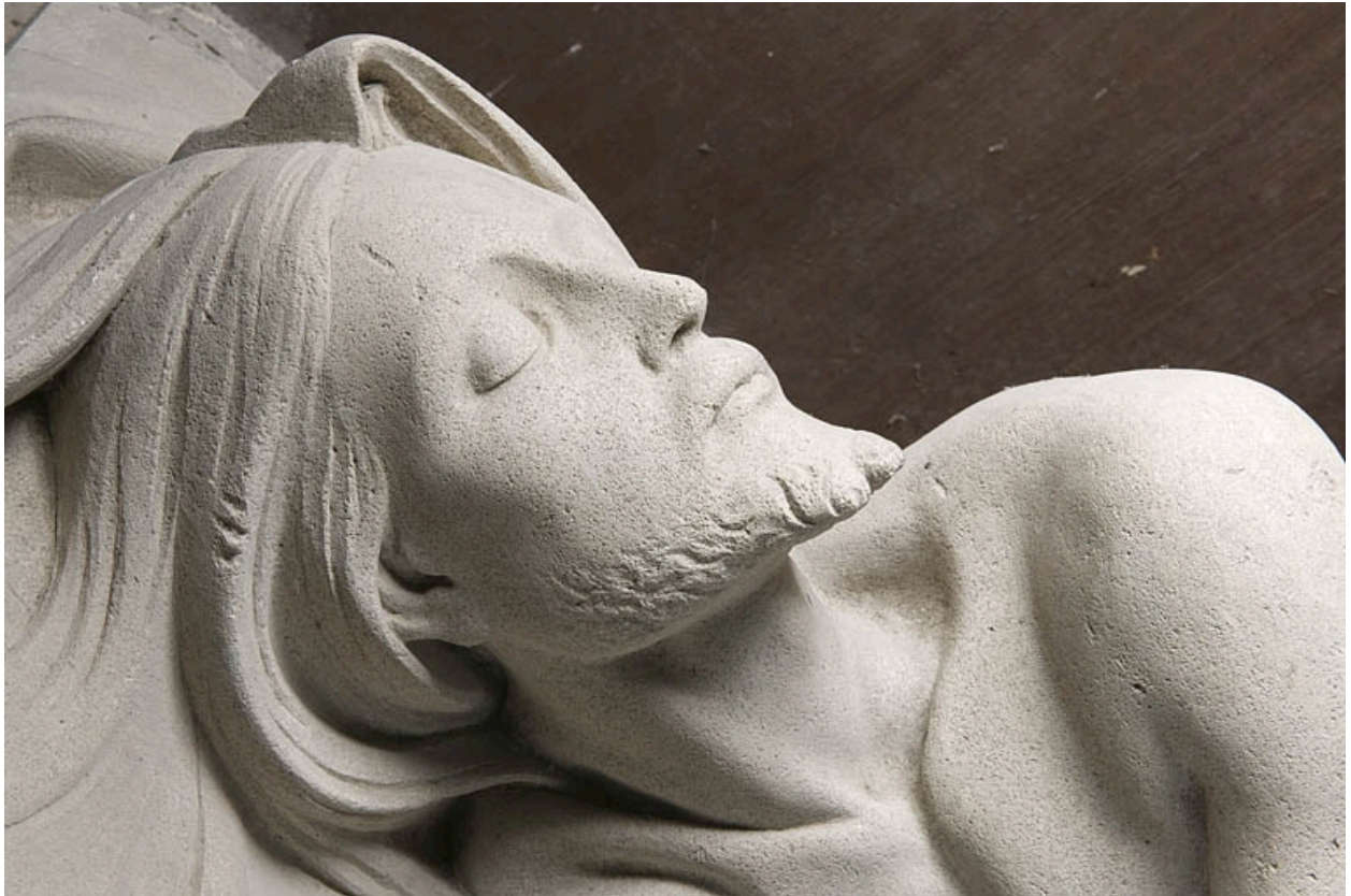
Détail : le visage, vue de profil.