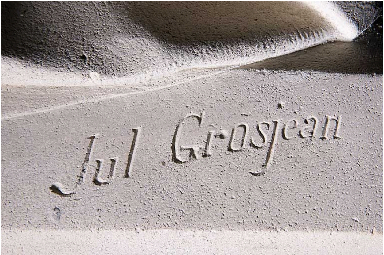
Détail : signature de Jules-Aimé Grosjean.