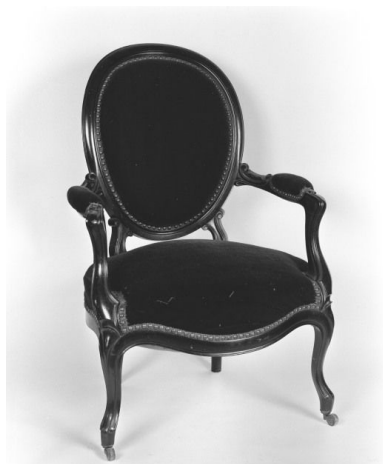
Vue d'un fauteuil