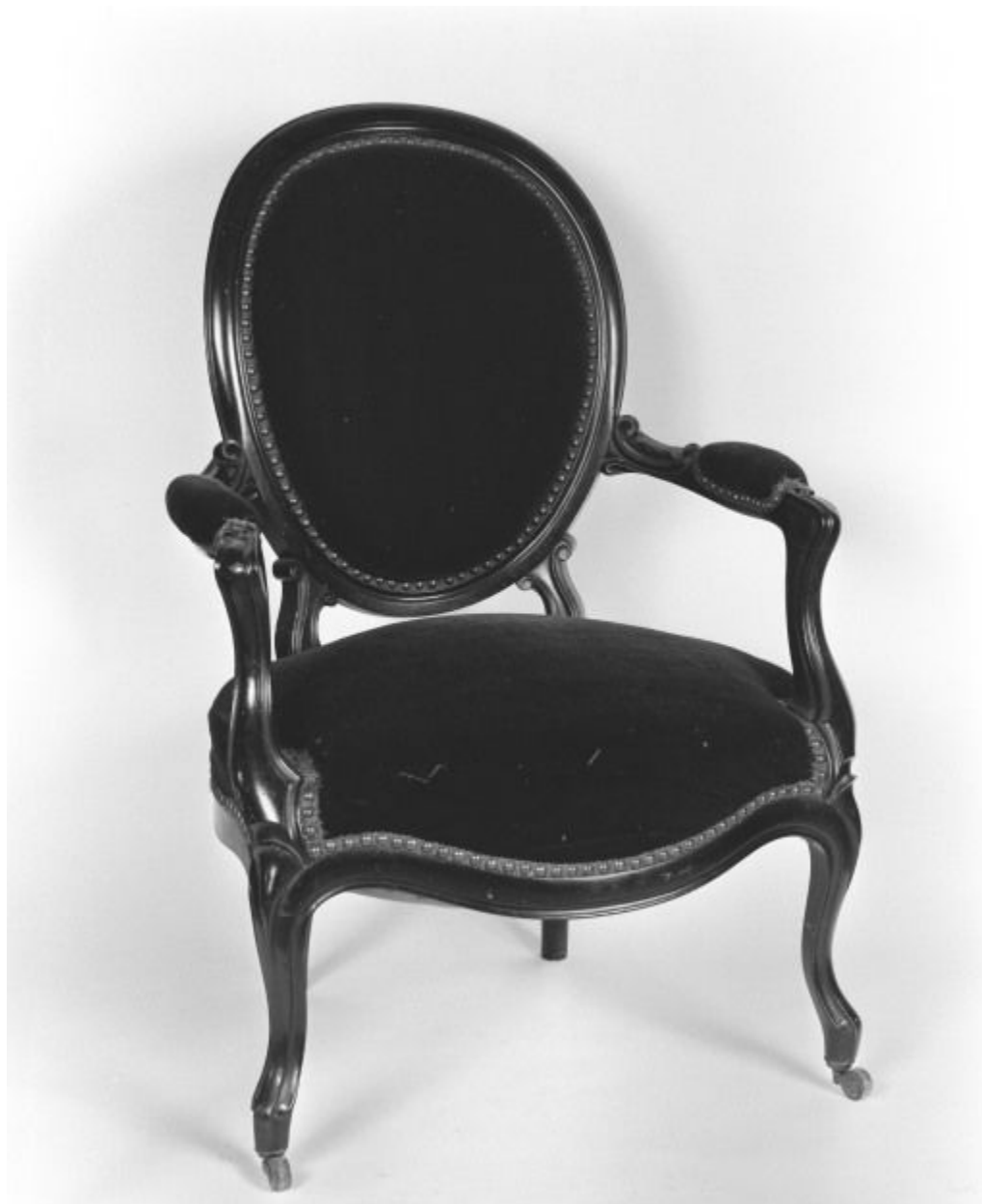
Vue d'un fauteuil