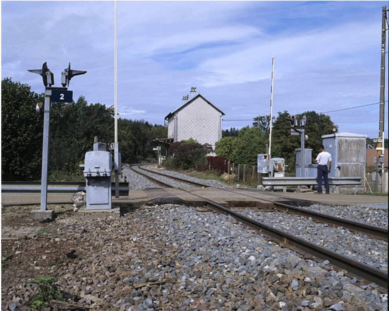
Vue d'ensemble depuis le passage à niveau n° 2, au sud.