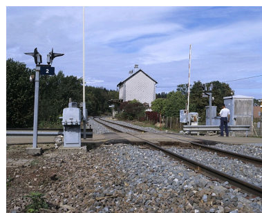
Vue d'ensemble depuis le passage à niveau n° 2, au sud.