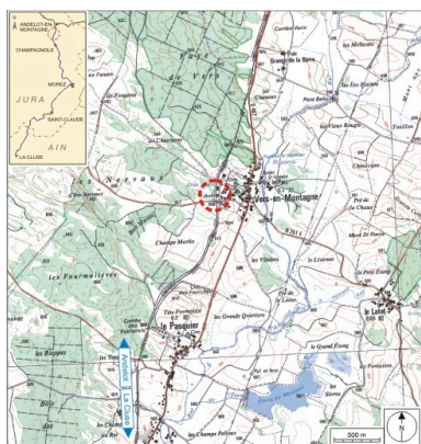
Carte et schéma de localisation. Carte topographique, IGN, 2000, dalle F087_047, échelle 1:25 000. Scan 25, licence n° 2008/CISE/2968. IVR43_20073900412NUDA