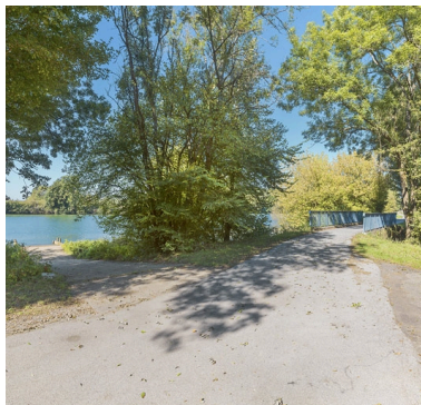
Rampe d'accès pour les personnes handicapées et ponceau en arrière-plan. IVR26_20162101391NUC4A