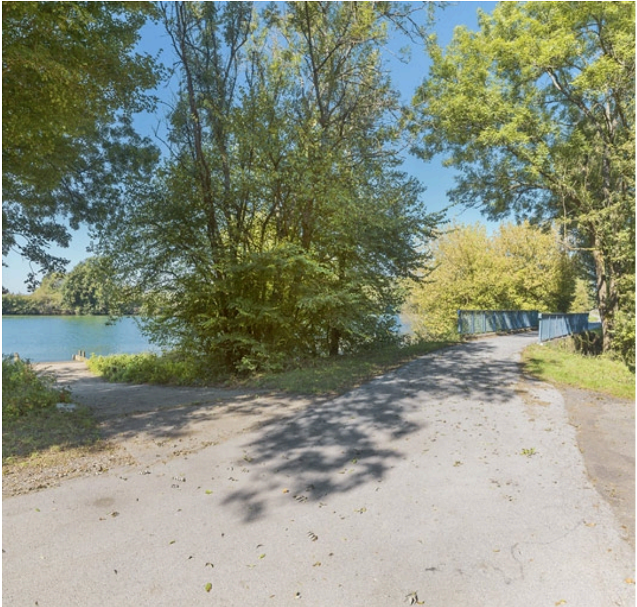
Rampe d'accès pour les personnes handicapées et ponceau en arrière-plan.