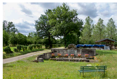
Fontaine des Carelles chemin de la patouillette. Vue d'ensemble de face.