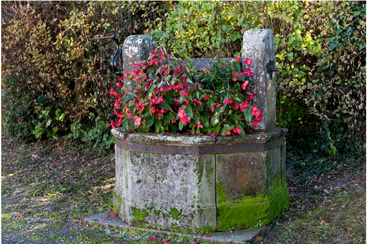
Ancien puits devant la mairie : vue rapprochée.