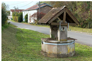
Puits, situé au carrefour avec la route de Seilles.