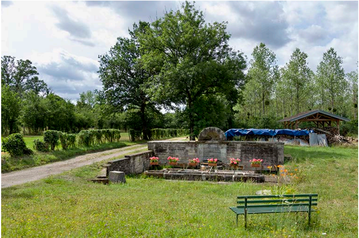
Fontaine des Carelles chemin de la patouillette. Vue d'ensemble de face.