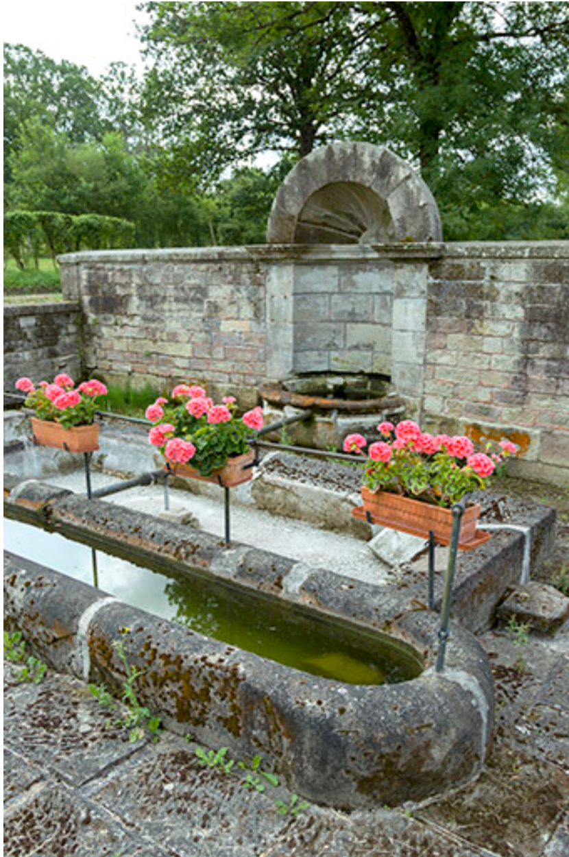
Fontaine des Carelles, chemin de la patouillette. Vue de trois-quart.