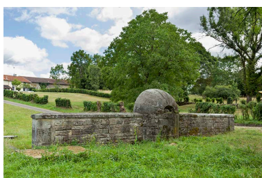
Fontaine des Carelles, chemin de la patouillette. Vue d'ensemble de la face postérieure.