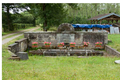
Fontaine des Carelles, chemin de la patouillette. Vue rapprochée de face.