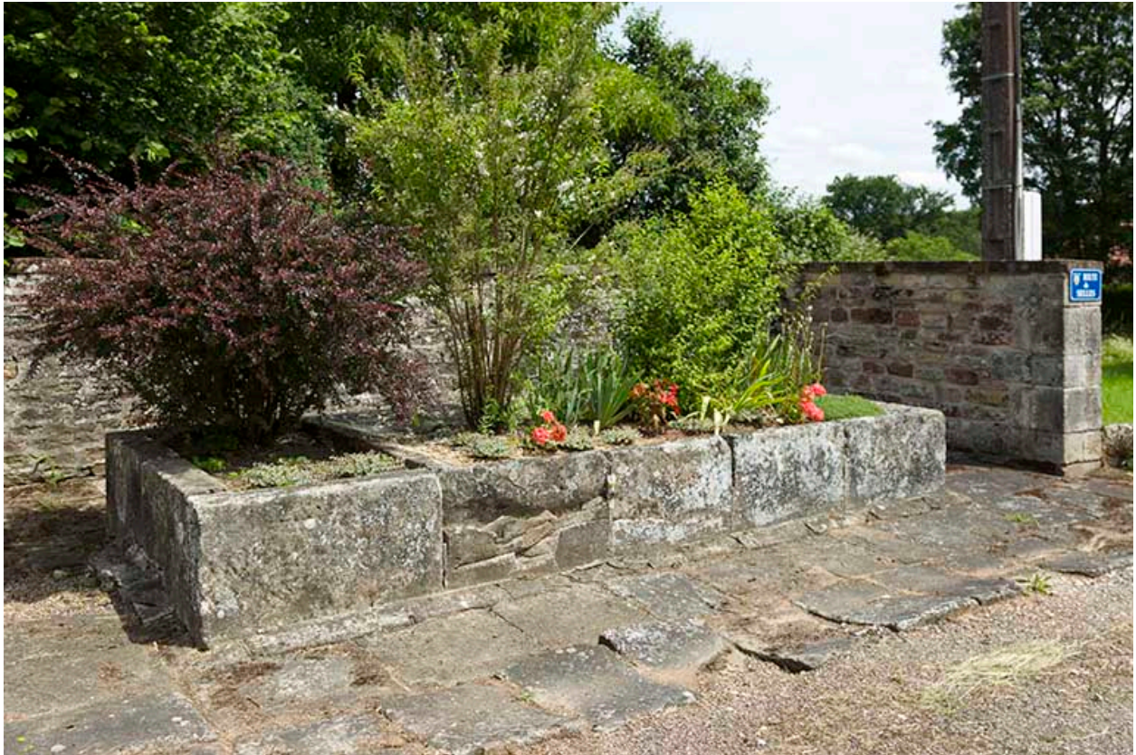
Ancien lavoir au carrefour de la route principale et de la route de Seilles. Vue de trois quart ouest.