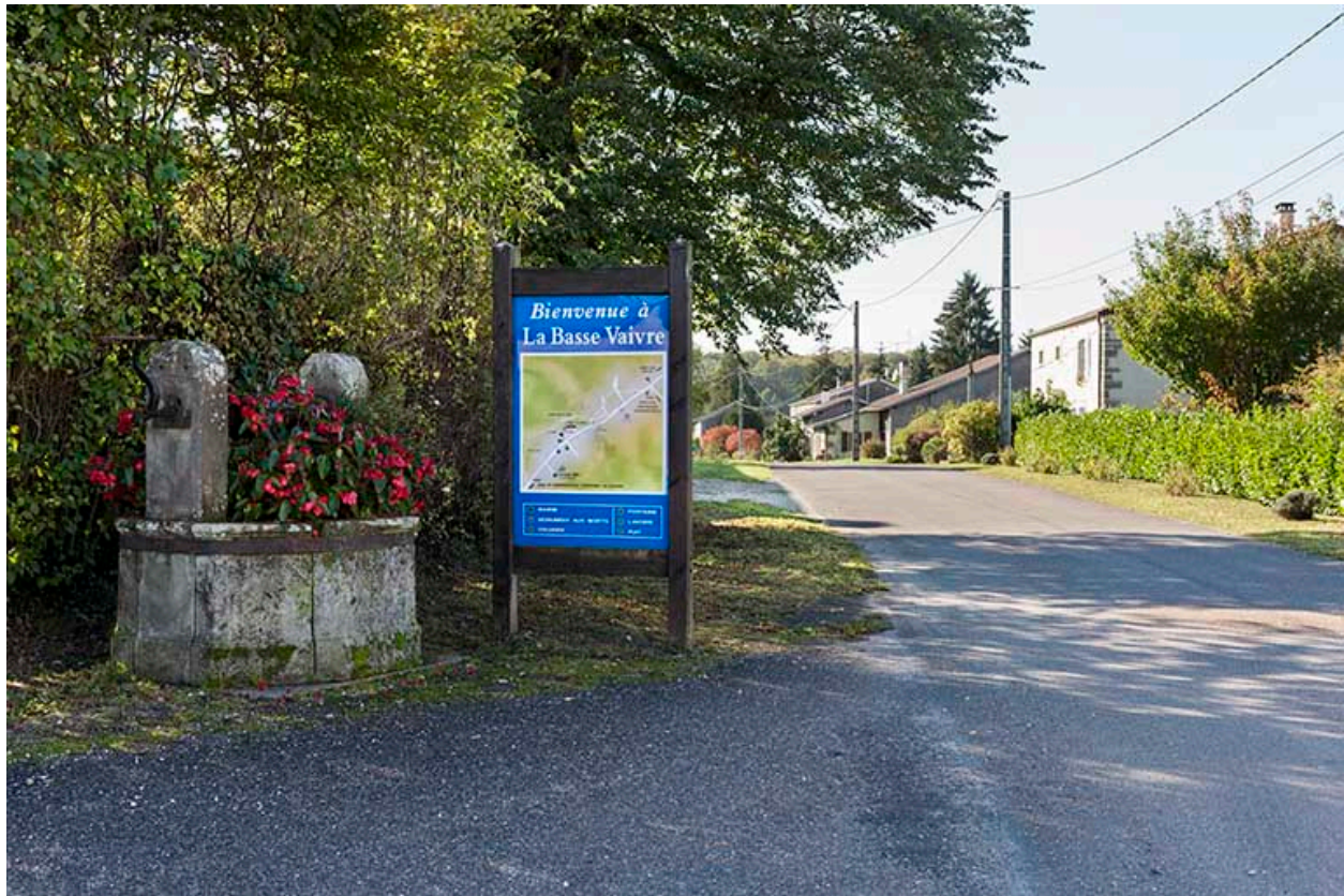
Rue principale et ancien puits devant la mairie.