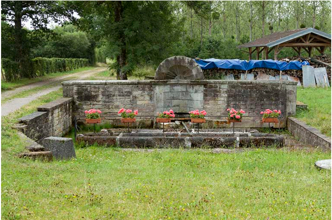
Fontaine des Carelles, chemin de la patouillette. Vue rapprochée de face.