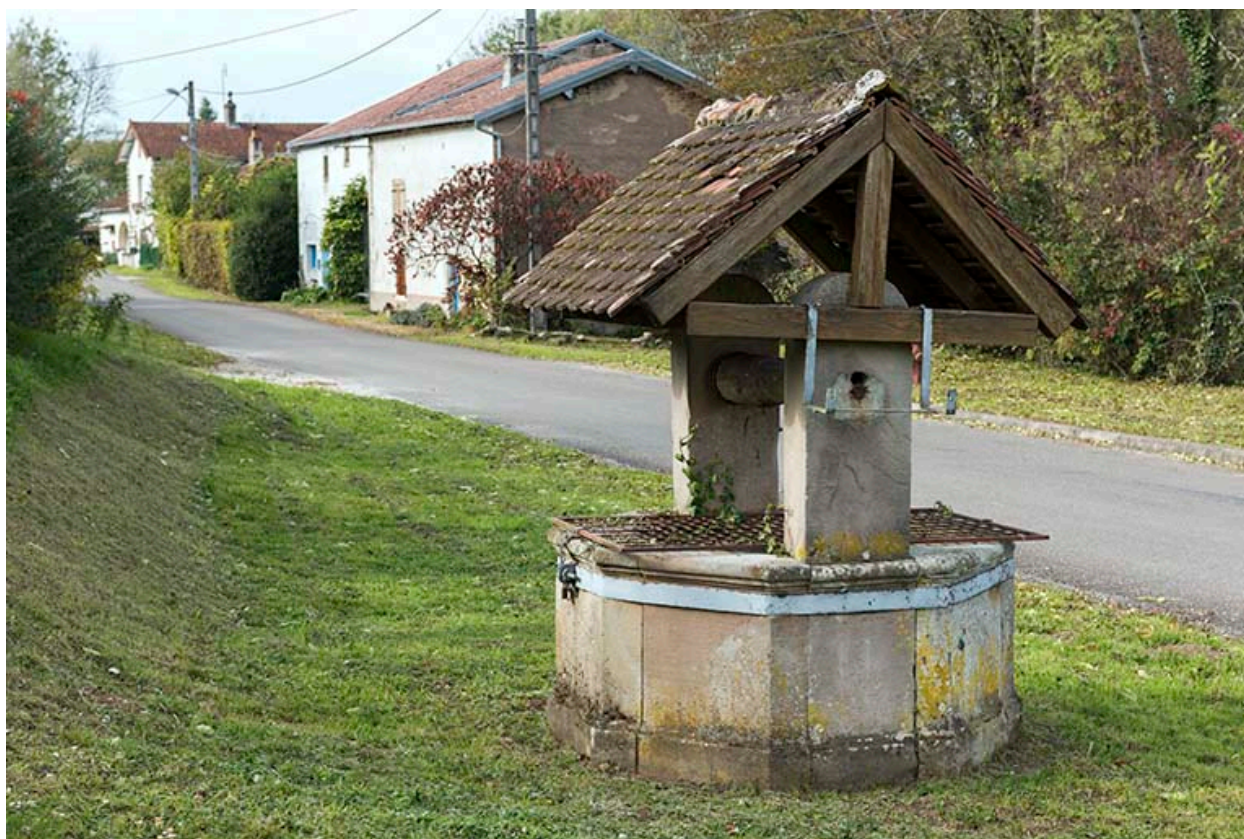
Puits, situé au carrefour avec la route de Seilles.