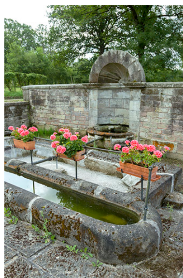
Fontaine des Carelles, chemin de la patouillette. Vue de trois-quart.