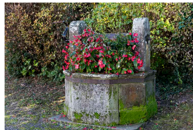
Ancien puits devant la mairie : vue rapprochée.