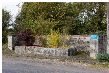
Ancien lavoir au carrefour de la route principale et de la route de Seilles. Vue de trois quart est.