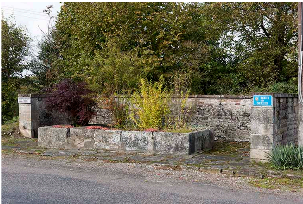
Ancien lavoir au carrefour de la route principale et de la route de Seilles. Vue de trois quart est.