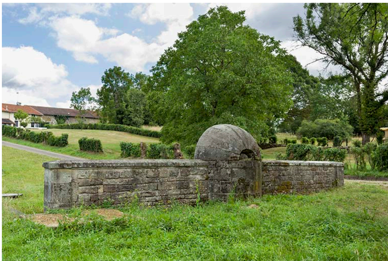
Fontaine des Carelles, chemin de la patouillette. Vue d'ensemble de la face postérieure.