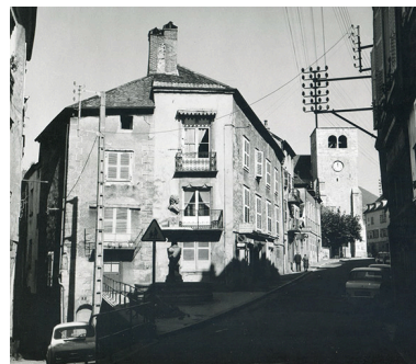
Vue du quartier vers 1960.

IVR43_20243900273NUC4A