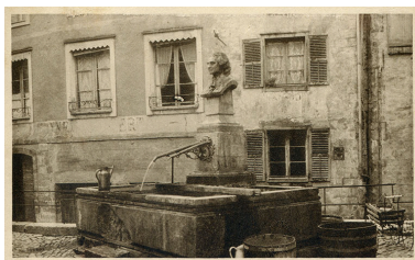
Salins-les-Bains - Fontaine d'Olivet, s.d. [début 20e siècle].

IVR43_20243900274NUC4A