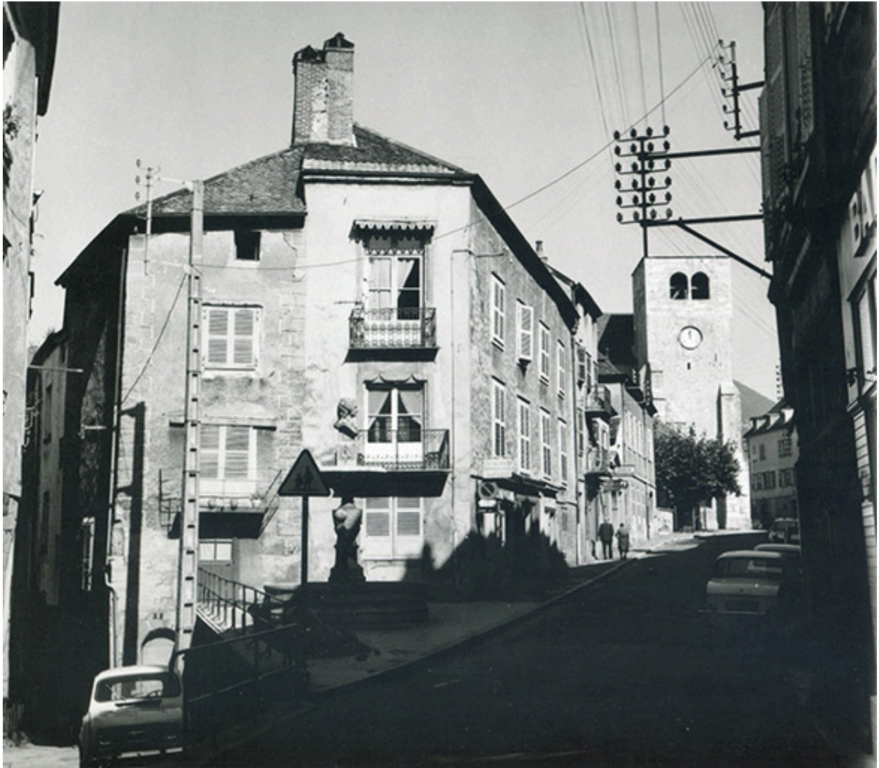
Vue du quartier vers 1960.