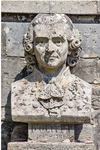
Buste de l'abbé d'Olivet. Vue de face. IVR43_20233900188NUC4A