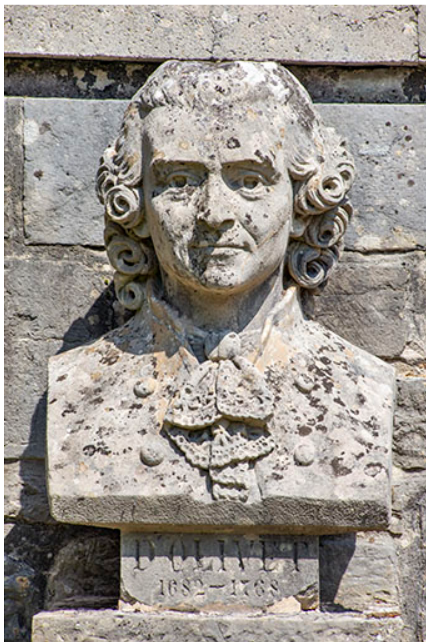
Buste de l'abbé d'Olivet. Vue de face.