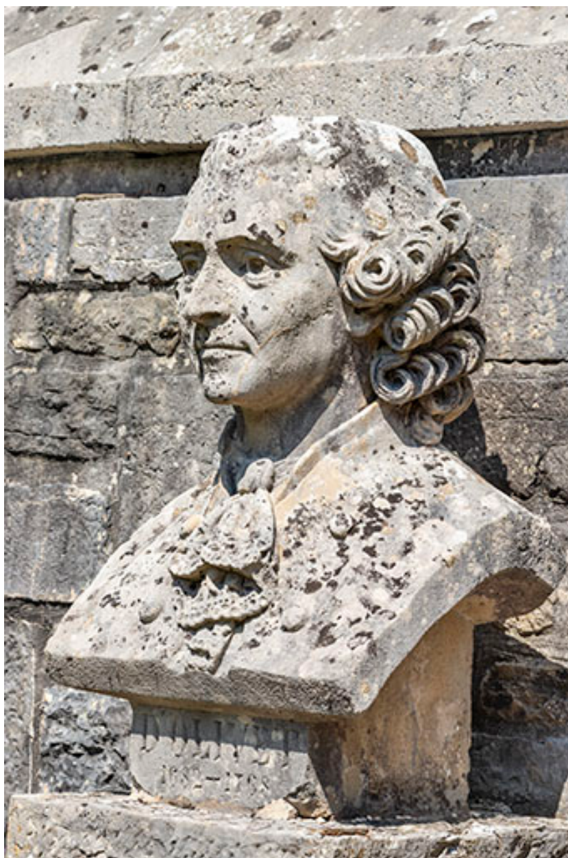
Buste de l'abbé d'Olivet. Vue de trois quarts.