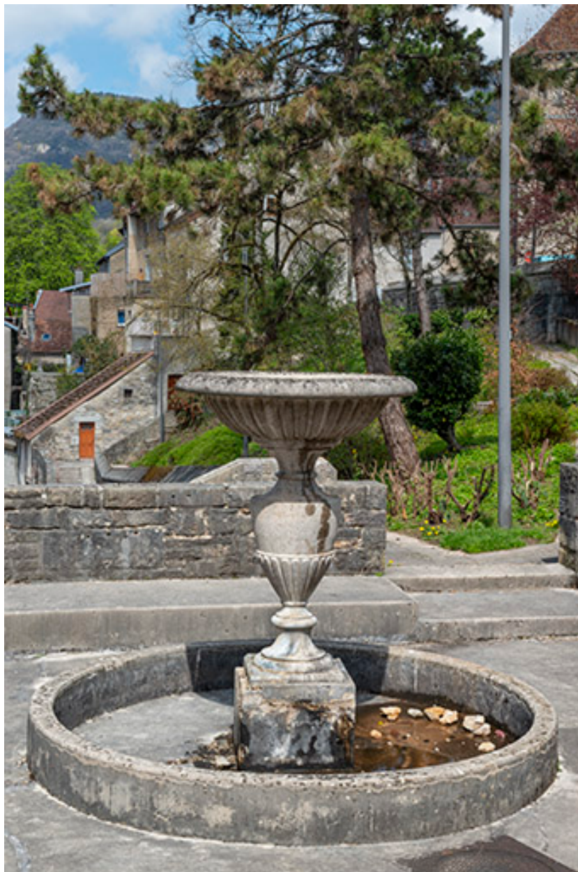
Vue depuis le sud.