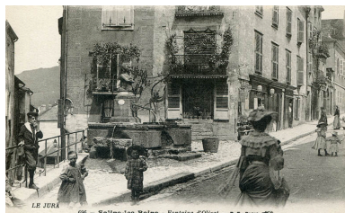
Salins-les-Bains - Fontaine d'Olivet, s.d. [fin 19e ou début 20e siècle].

IVR43_20243900274NUC4A