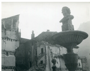
La fontaine au moment de la démolition du quartier d'Olivet, s.d. [vers 1975].

IVR43_20243900455NUC4A