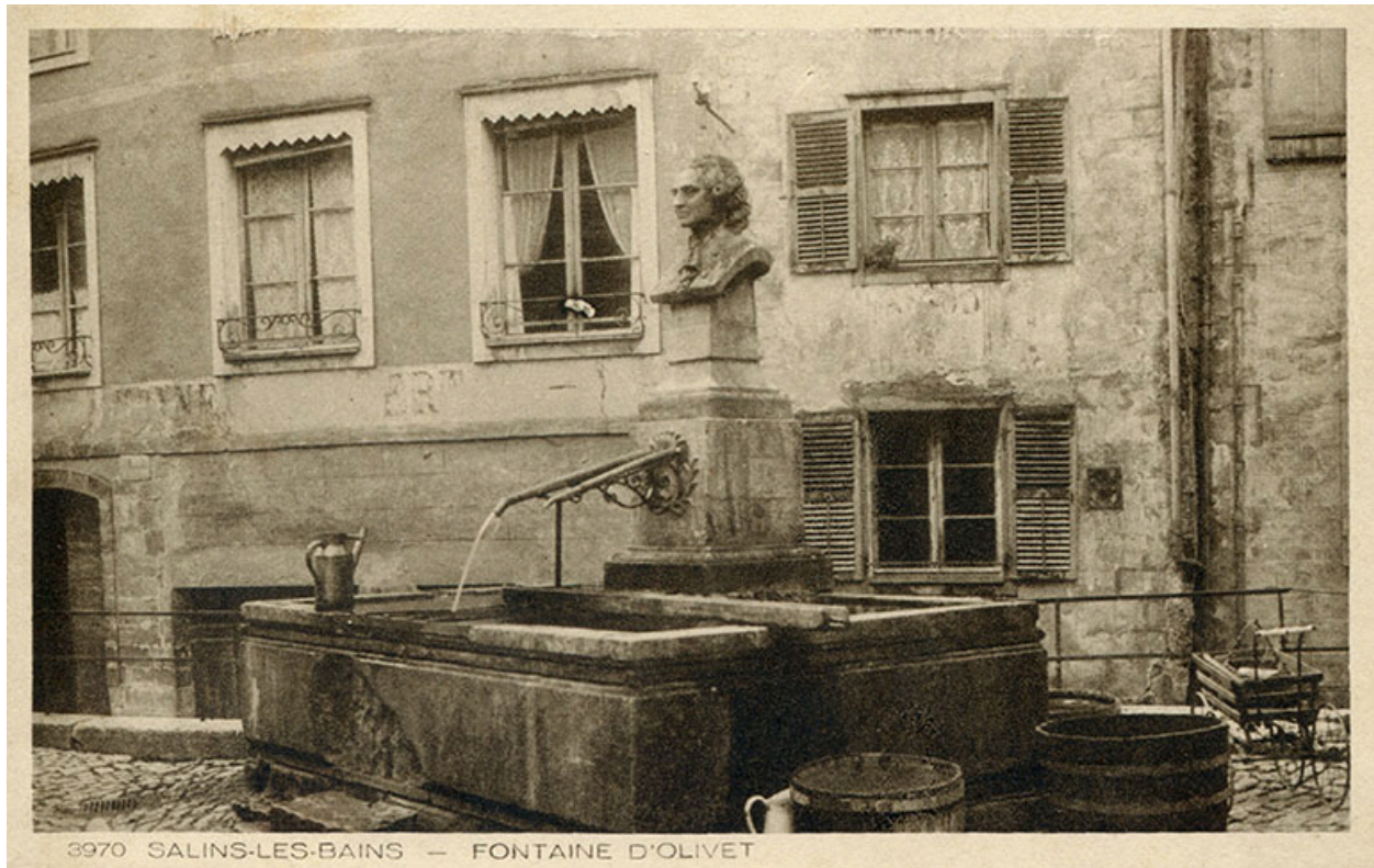
Salins-les-Bains - Fontaine d'Olivet, s.d. [début 20e siècle].