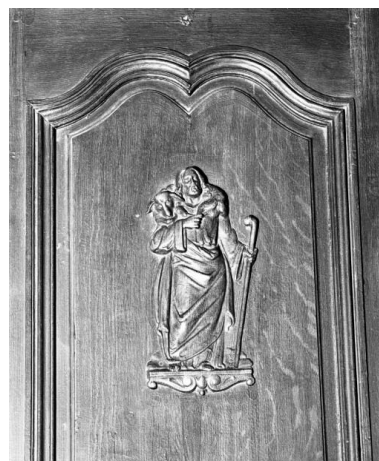
Détail du dorsal