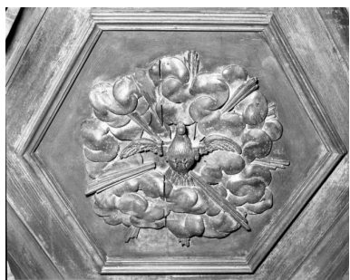
Détail de l'abat-voix