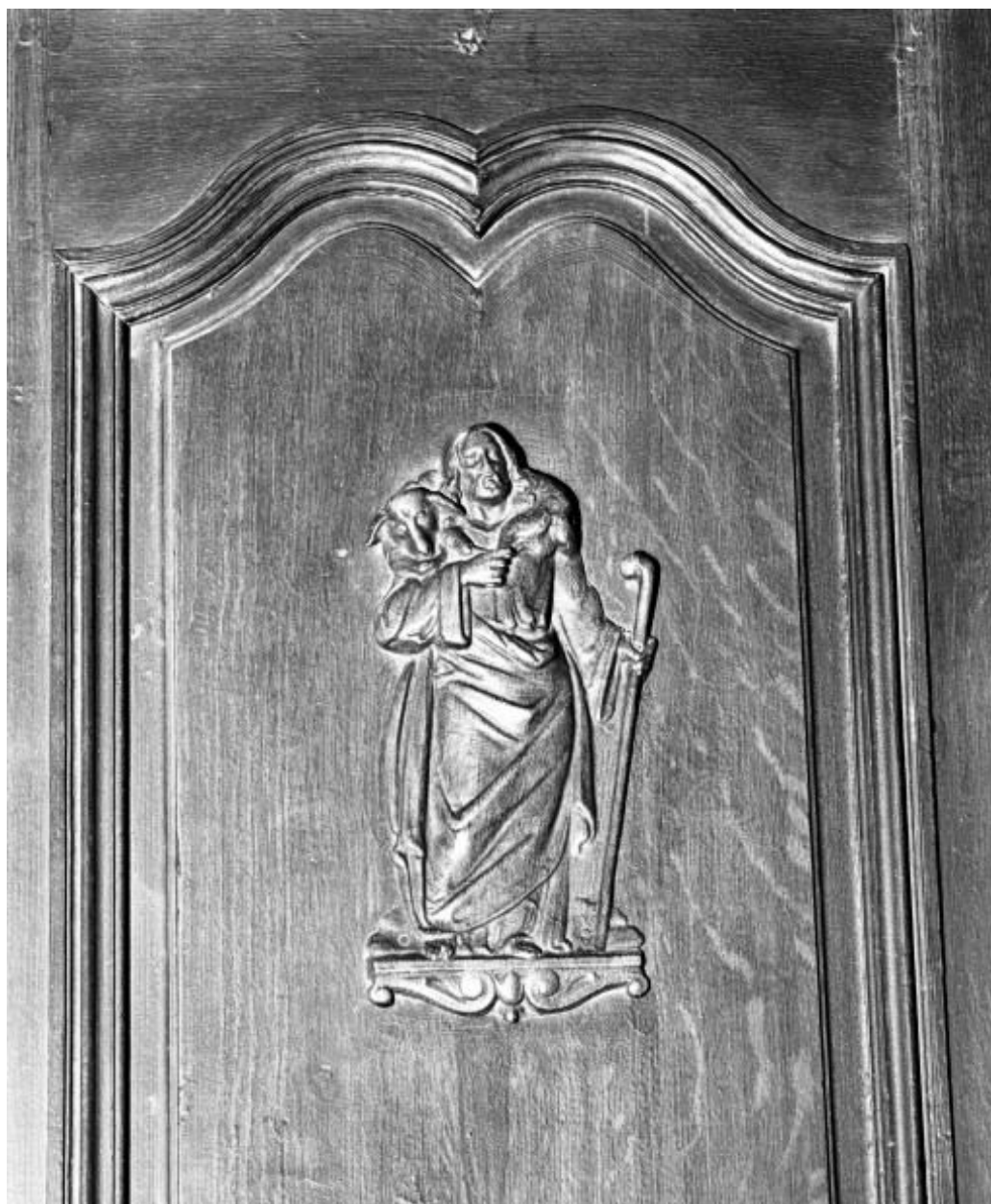
Détail du dorsal