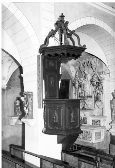
Vue générale IVR26_19852101792V