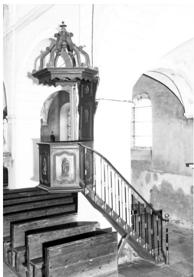
Vue générale. IVR26_19852101791V