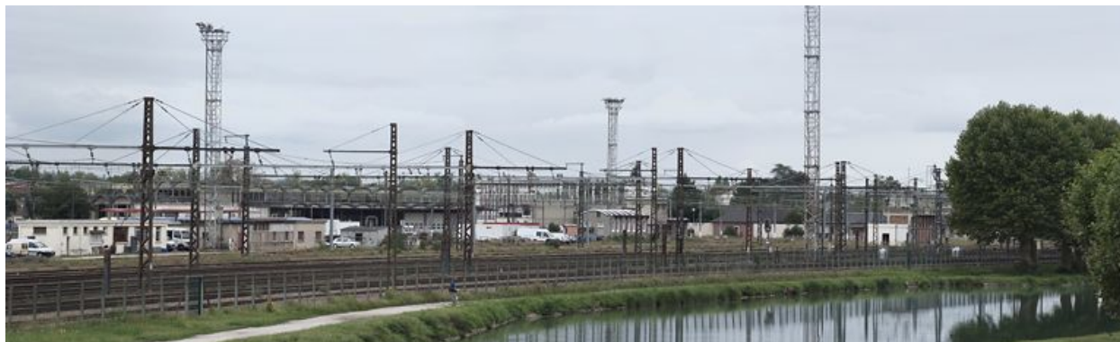
Site SNCF de Migennes, rive gauche du canal, en amont du site d'écluse 114-115 du versant Yonne.