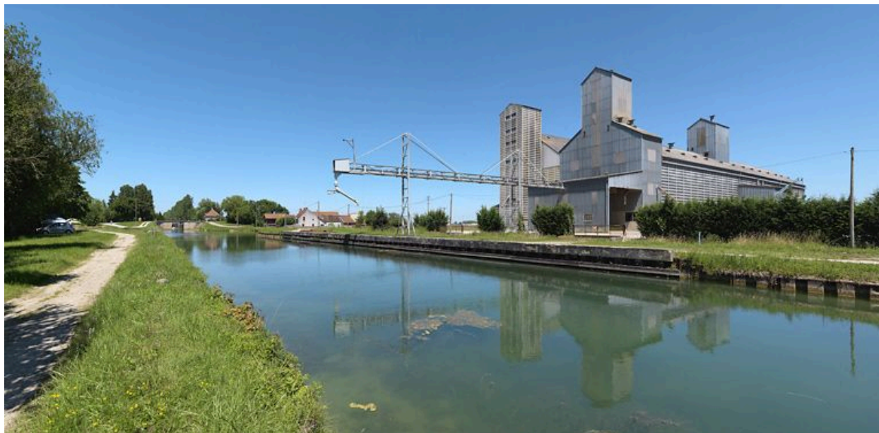
Silos à Longecourt-en-Plaine.