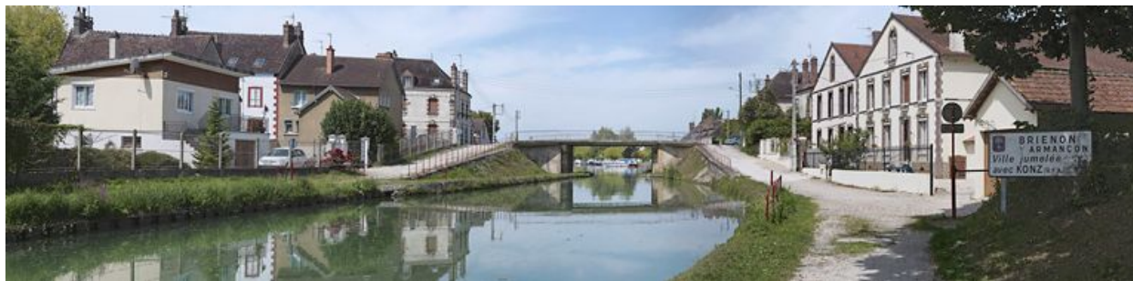
Anciennes entreprises sur le rive droite du canal, à l'entrée de Briennon.