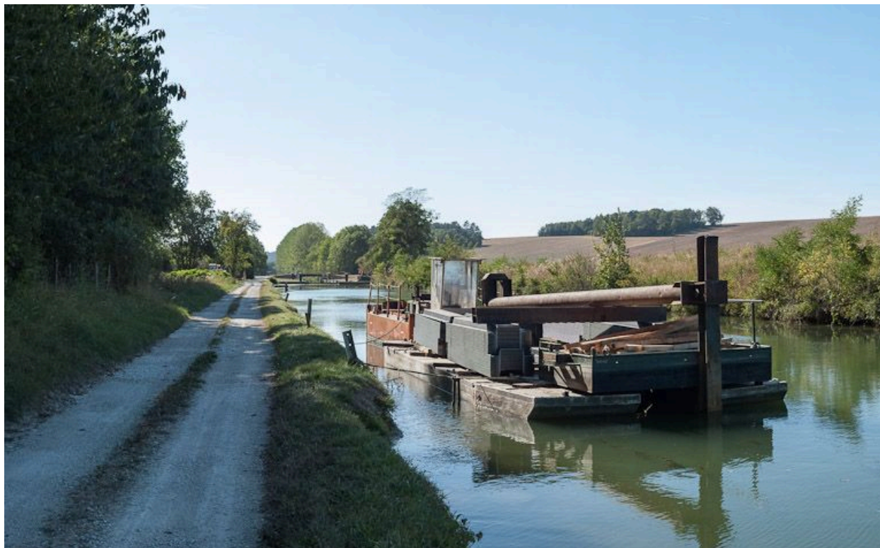
Barge de travaux sur palplanches à Ancy-le-Franc.