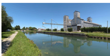
Silos à Longecourt-en-Plaine. IVR26_20112103183NUC4A