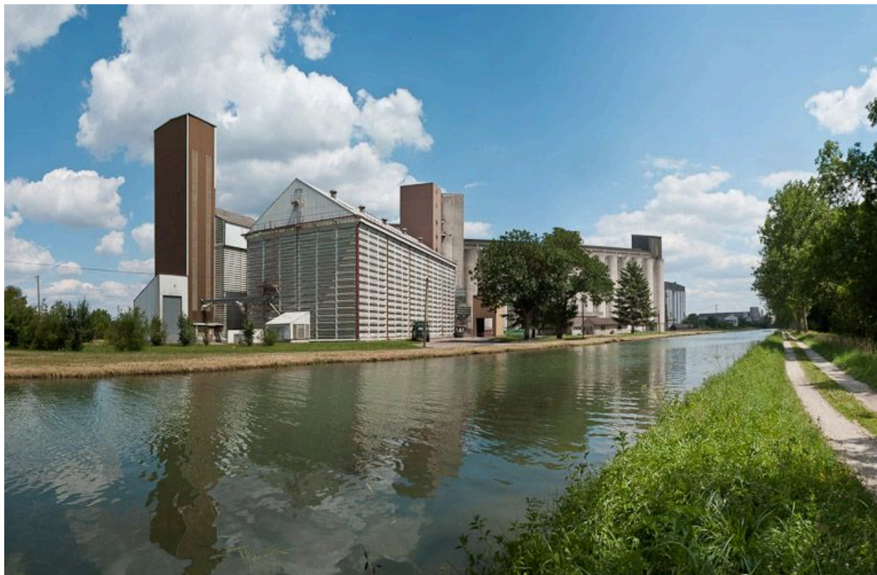
Vue des silos à Pacy-sur-Armançon.