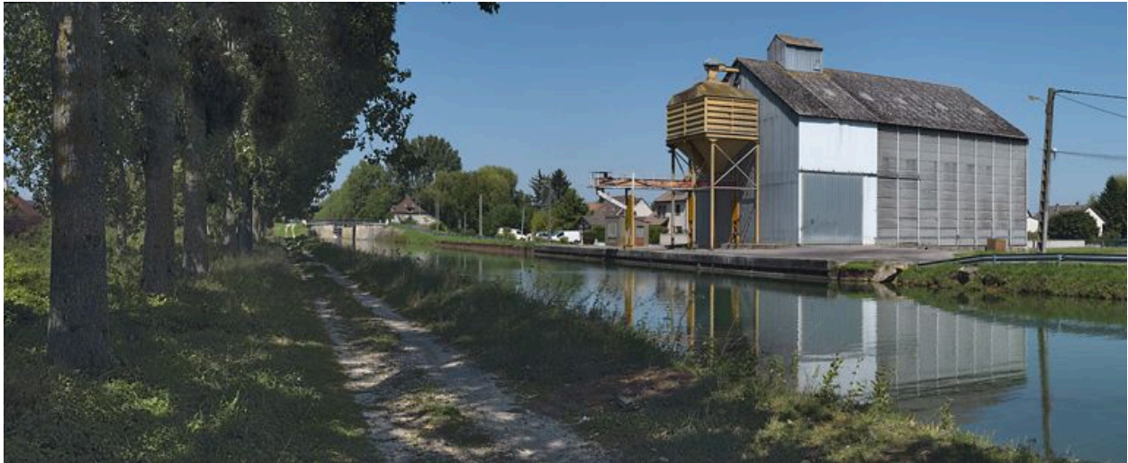
Silo avec système de déchargement lié au canal à Longecourt-en-Plaine.