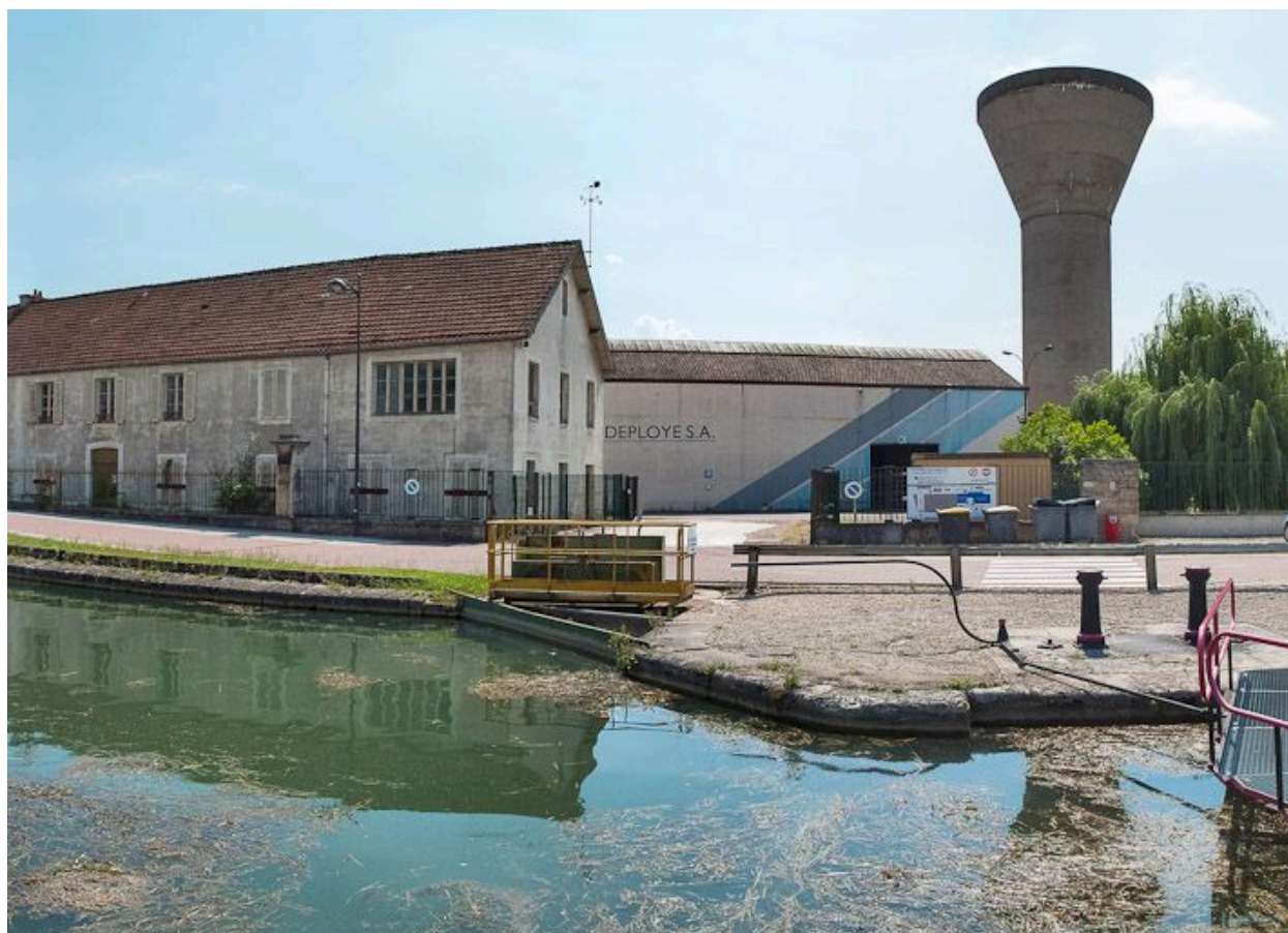
Prise d'eau dans le canal pour l'usine en arrière-plan à Montbard. Le tout est en amont du site d'écluse.