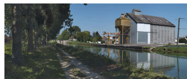
Silo avec système de déchargement lié au canal à Longcourt-en-Plaine.