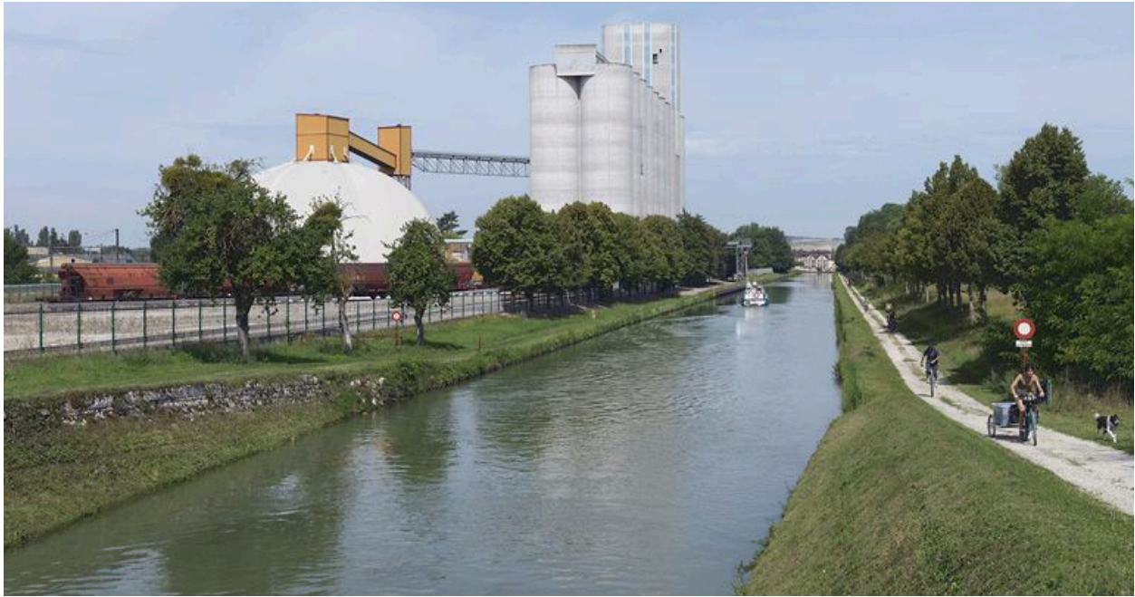
A Briennon-sur-Armançon, vue d'ensemble des silos avec accès par pont roulant au canal. A l'extrême-gauche, les voies SNCF.