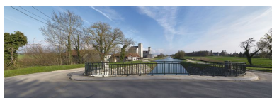
Silos et château de Longecourt vus du pont sur écluse. IVR26_20112103187NUC4AQ