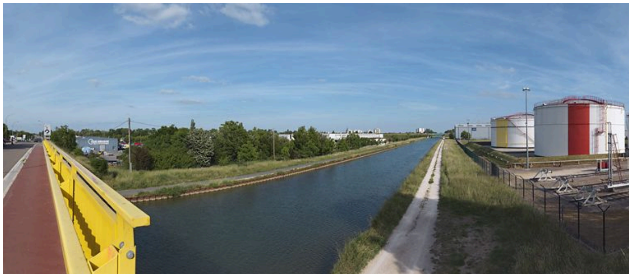
Sites industriels en bord de canal à Longvic.