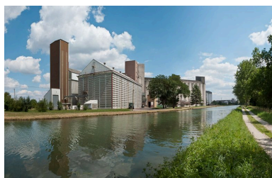
360° sur le passage du canal à Migennes, ville construite autour du canal, puis autour d'un noeud ferroviaire. Port, site SNCF, cale sèche, site d'écluse avec ses deux maisons.