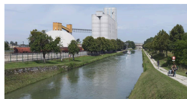
A Briennon-sur-Armançon, vue d'ensemble des silos avec accès par pont roulant au canal. A l'extrême-gauche, les voies SNCF. IVR26_20118900217NUC4A