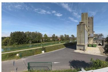
Les silos en bordure du canal après Esnon. IVR26_20118900251NUC4A