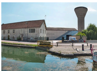
Prise d'eau dans le canal pour l'usine en arrière-plan à Montbard. Le tout est en amont du site d'écluse. IVR26_20122101926NUC2AQ