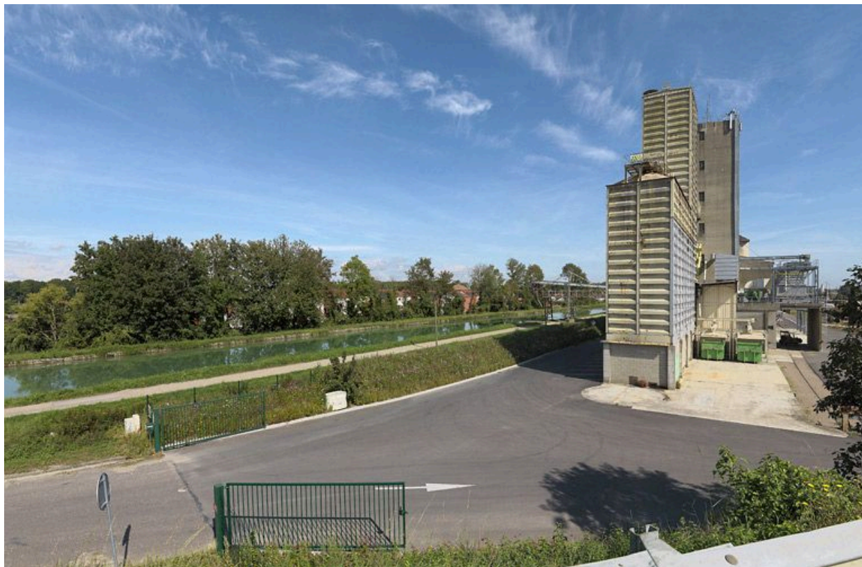
Les silos en bordure du canal après Esonn.