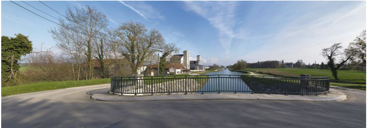
Silos et château de Longecourt vus du pont sur écluse.