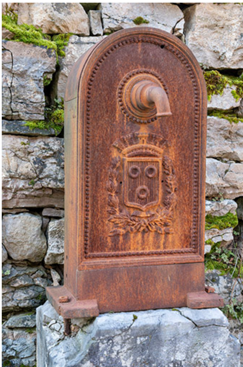
Borne-fontaine. Détail de la borne.