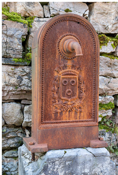
Borne-fontaine. Détail de la borne.