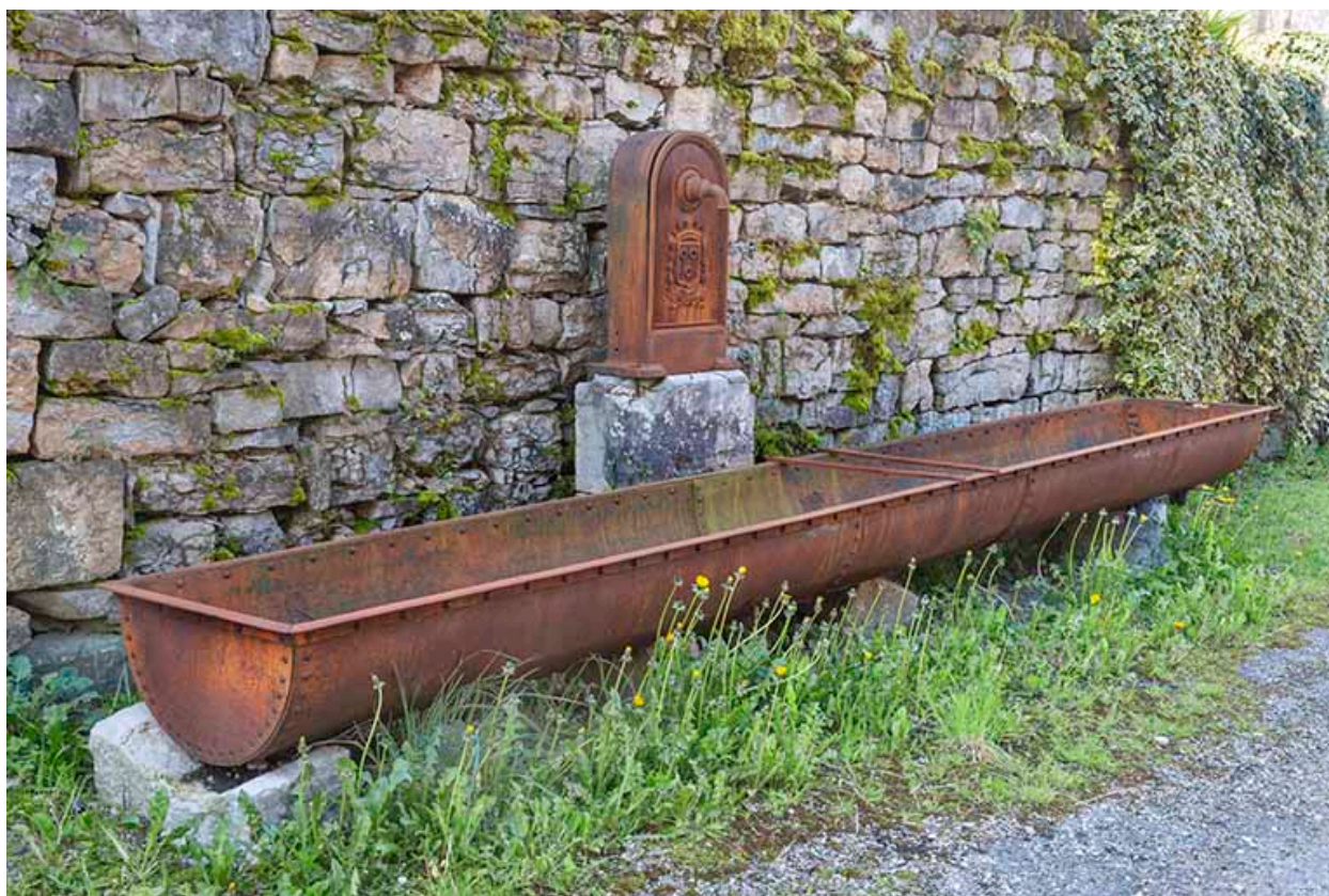
Borne-fontaine-abreuvoir, installée 80 mètres à l'est.