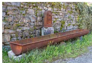
Borne-fontaine-abreuvoir, installée 80 mètres à l'est. IVR43_20233900248NUC4A