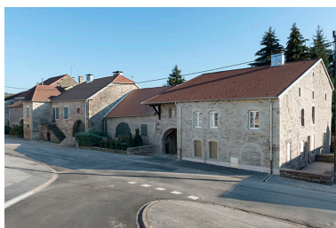
Vue d'ensemble. IVR43_20157001206NUC4A