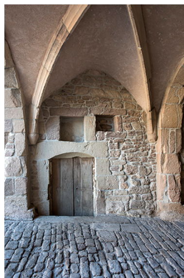
Détail des voûtes. IVR43_20157001212NUC4A