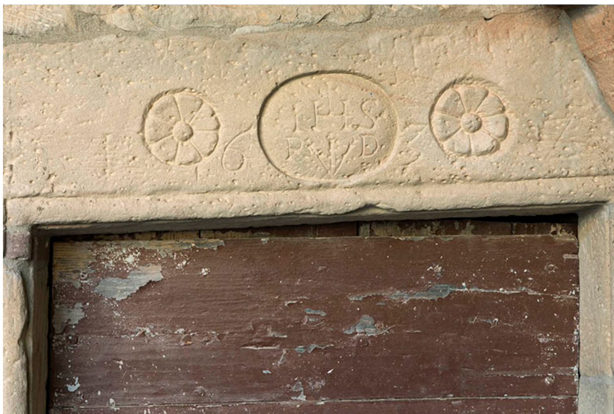
La date portée sur le linteau.