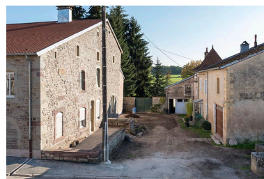
Vue du mur pignon ouest. IVR43_20157001207NUC4A