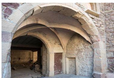
Les voûtes d'ogives du porche.