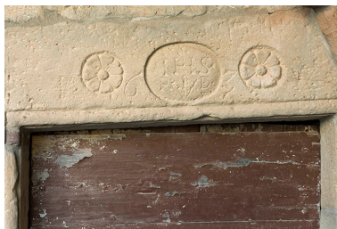
La date portée sur le linteau.