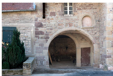
Le porche et l'accès à la grange. IVR43_20157001209NUC4A