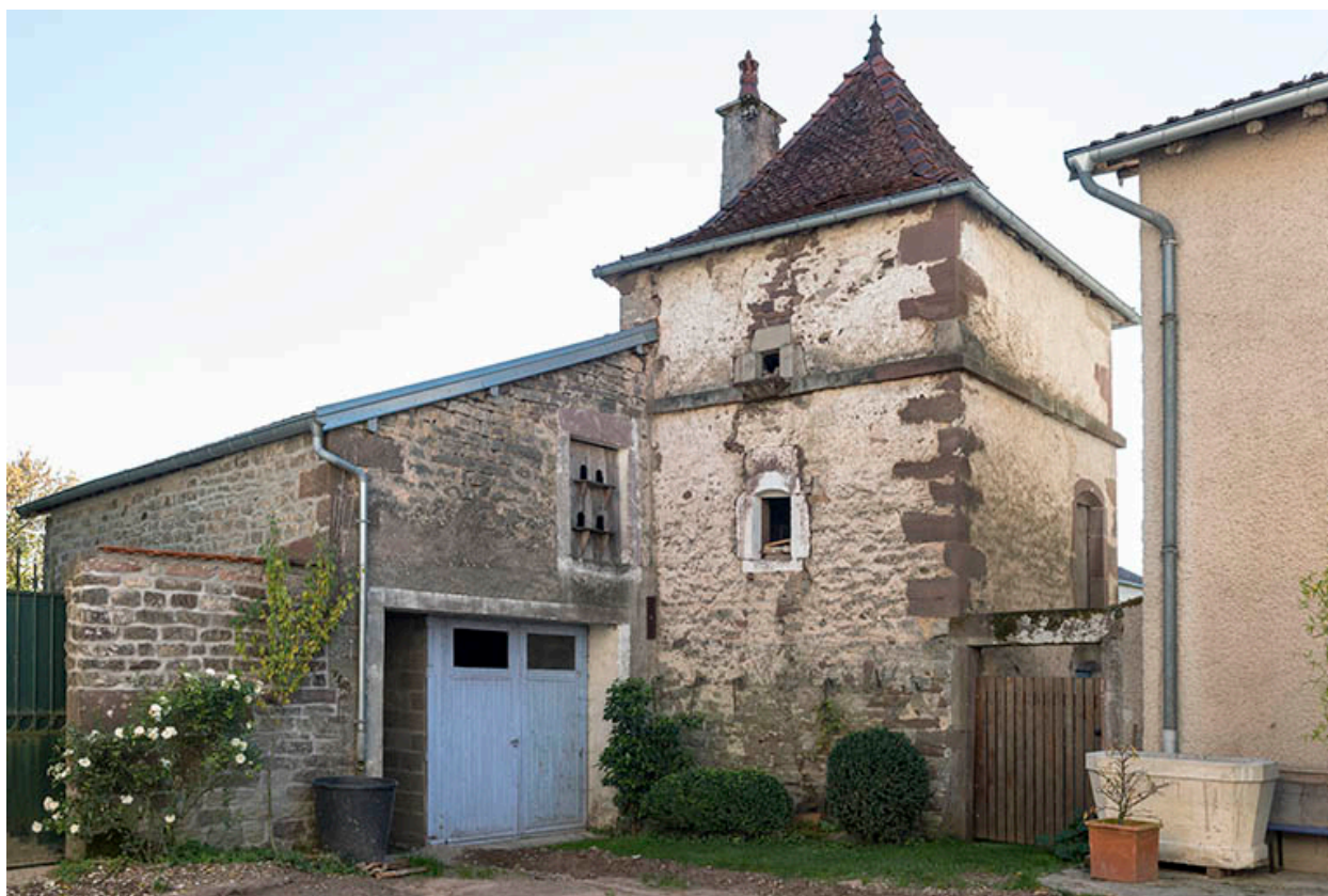
Pigeonnier proche de la ferme.