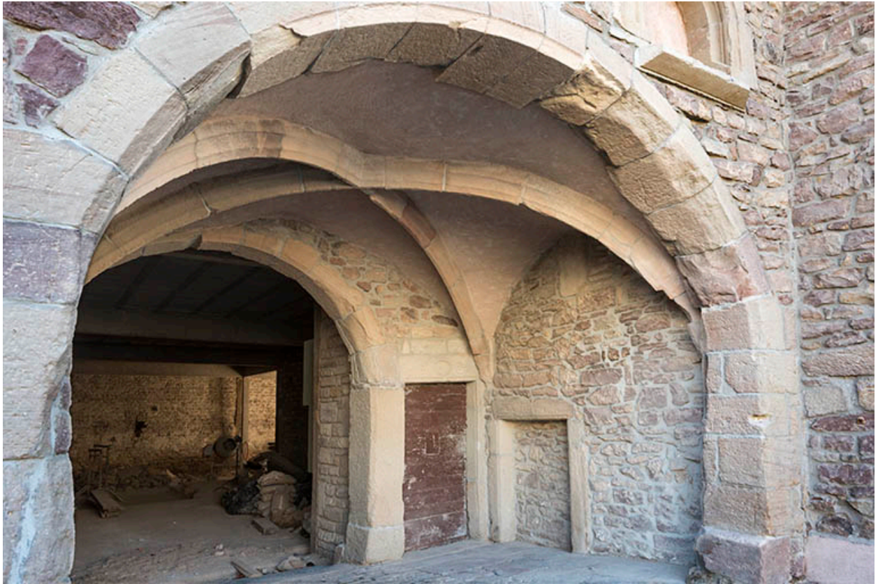
Les voûtes d'ogives du porche.