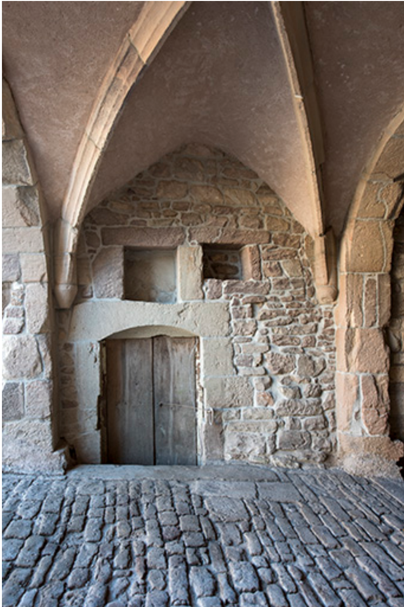
Détail des voûtes.