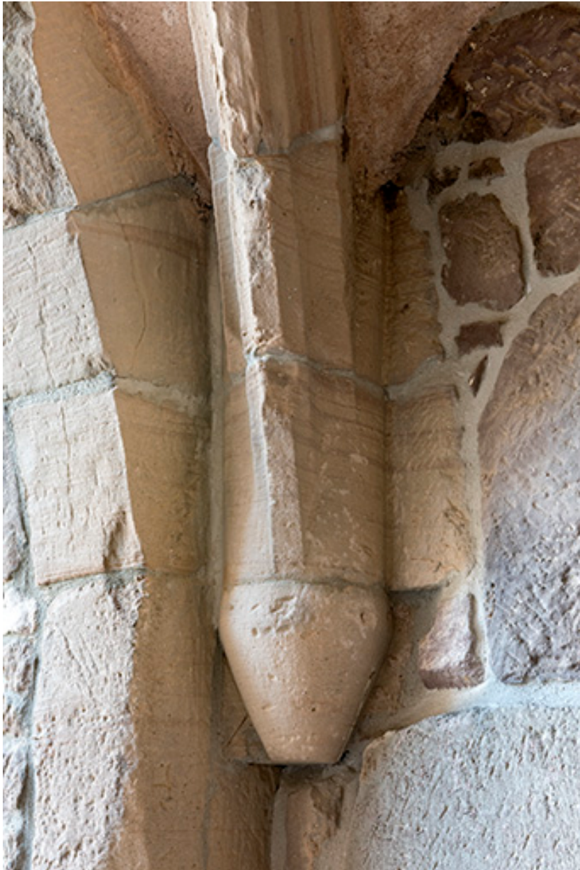
Détail d'un culot.