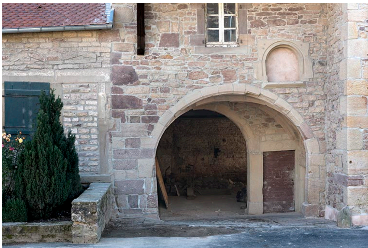
Le porche et l'accès à la grange.