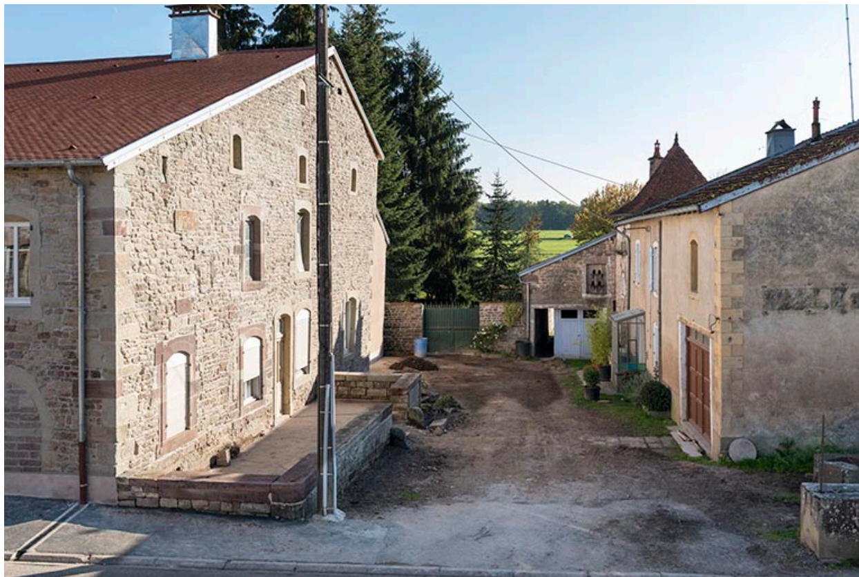
Vue du mur pignon ouest.