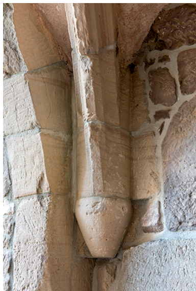
Détail d'un culot. IVR43_20157001213NUC4A