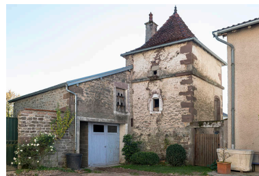
Pigeonnier proche de la ferme. IVR43_20157001208NUC4A