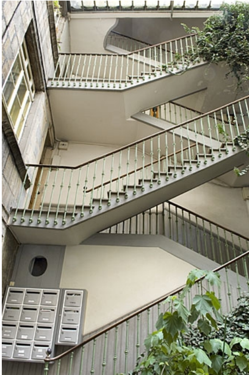
Vue de l'escalier à cage ouverte depuis la cour : partie supérieure.