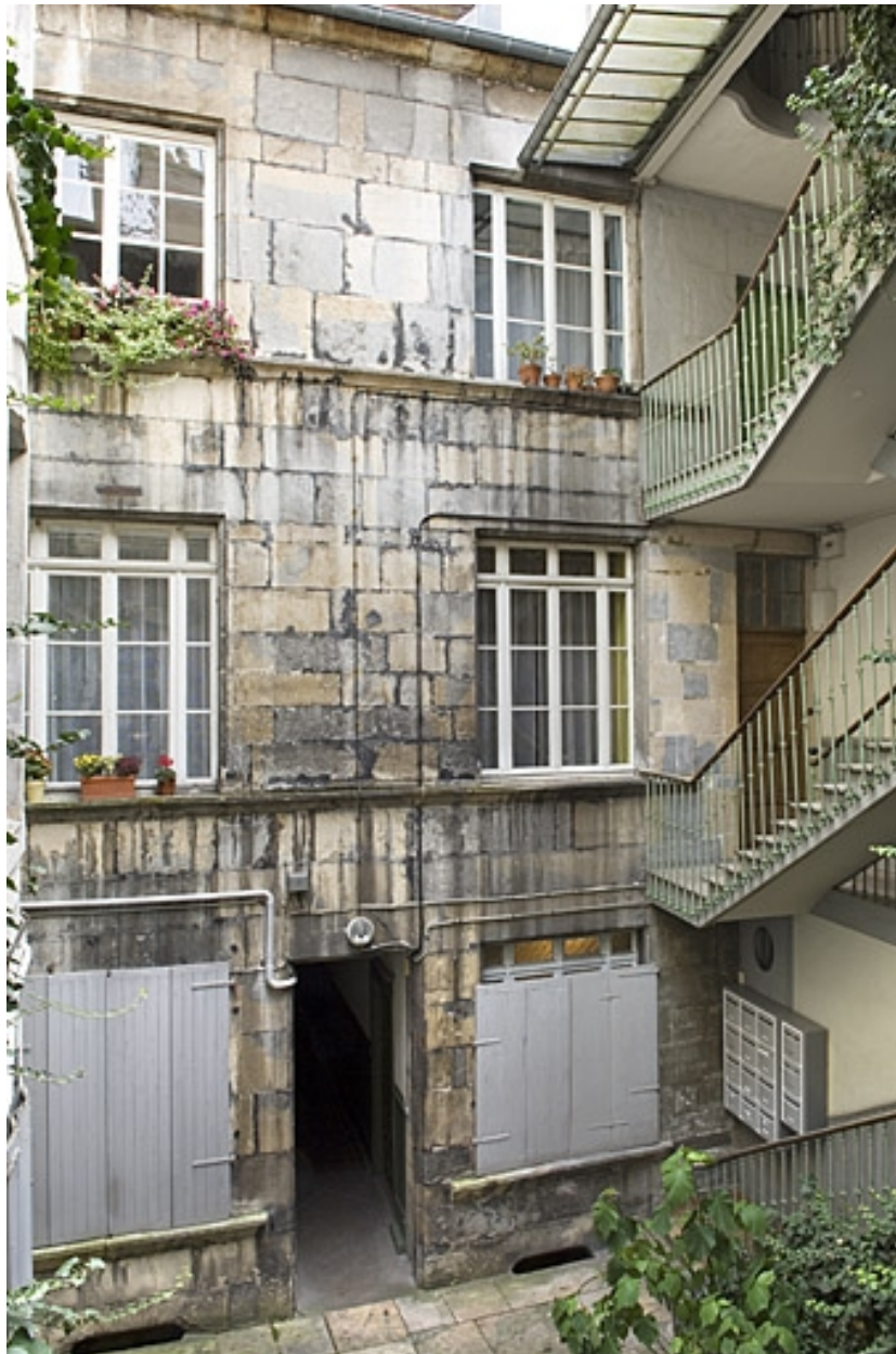
Vue d'ensemble de la façade sur cour du logis principal.