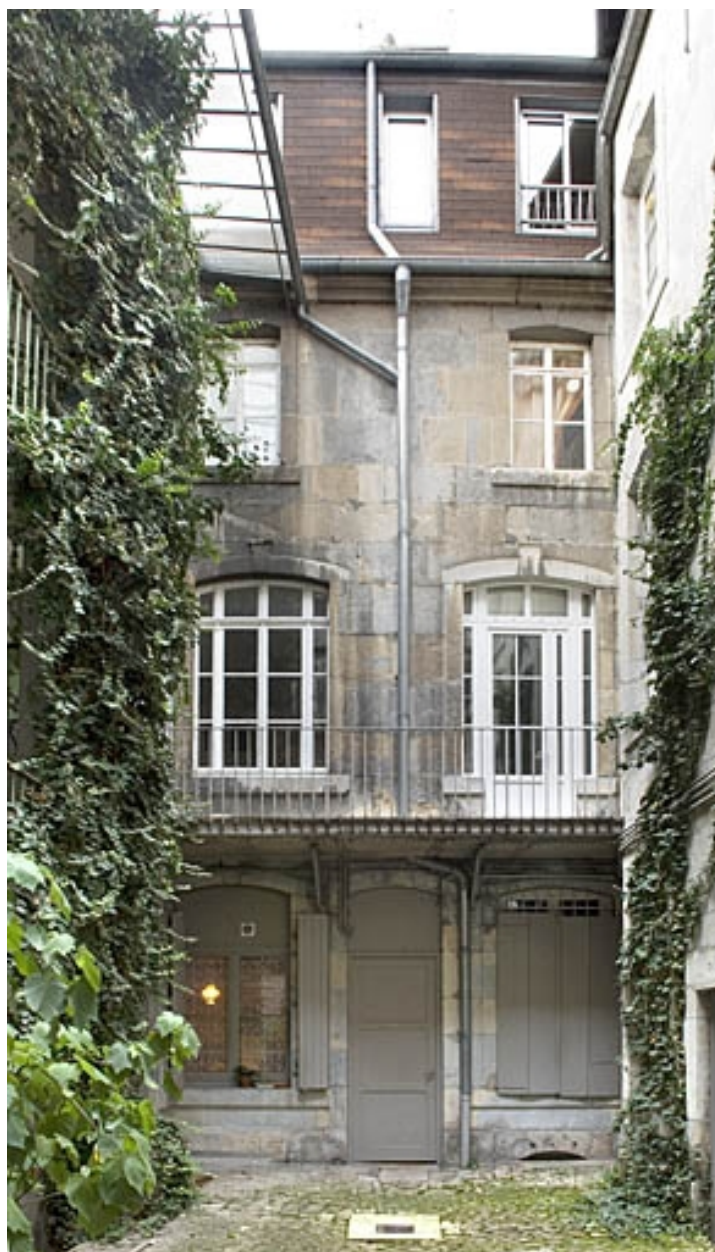
Vue d'ensemble de la façade principale du logis secondaire.