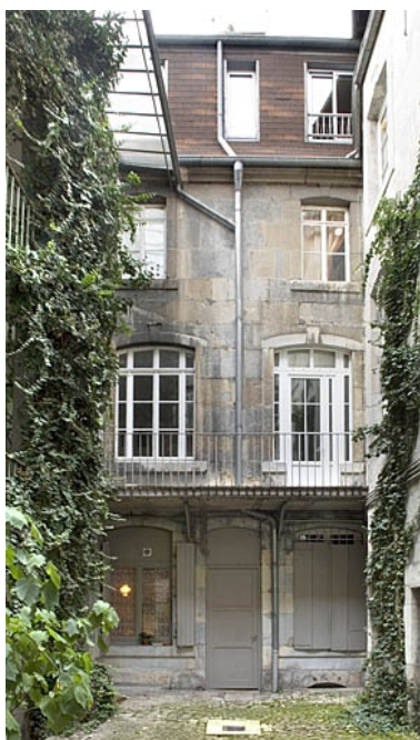
Vue d'ensemble de la façade principale du logis secondaire. IVR43_20072501262NUC2A