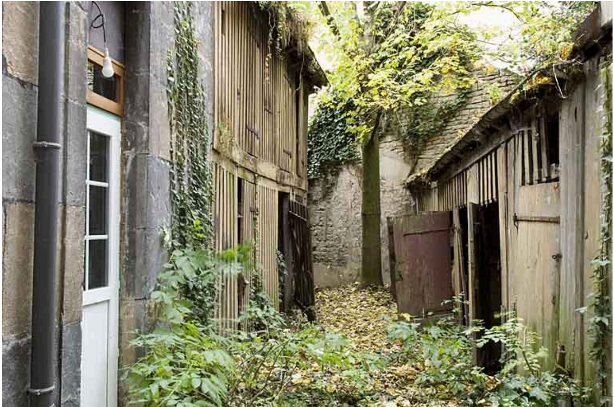
Vue d'ensemble de la deuxième cour depuis l'entrée.