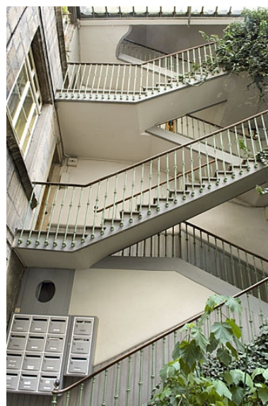
Vue de l'escalier à cage ouverte depuis la cour : partie supérieure. IVR43_20072501261NUC2A