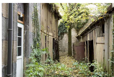
Vue d'ensemble de la deuxième cour depuis l'entrée.