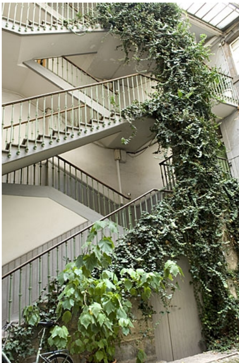
Vue de l'escalier à cage ouverte depuis la cour.