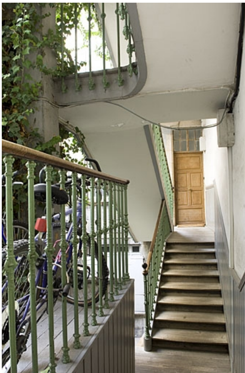
Détail de l'escalier à cage ouverte depuis la première volée.