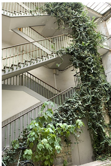
Vue de l'escalier à cage ouverte depuis la cour.