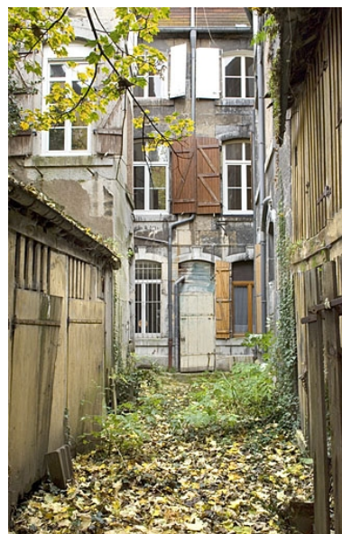
Vue d'ensemble de la façade postérieure du logis secondaire depuis le fond de la deuxième cour. IVR43_20072501264NUC2A