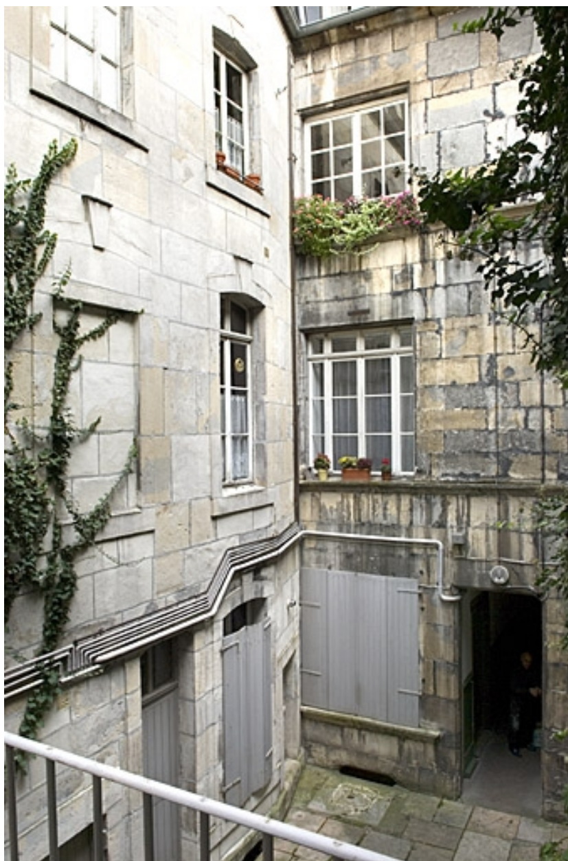
Façades sur cour depuis l'escalier à cage ouverte.