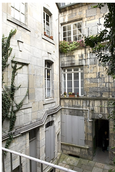
Façades sur cour depuis l'escalier à cage ouverte. IVR43_20072501257NUC2A