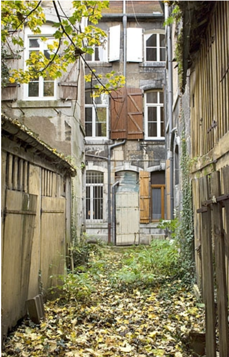
Vue d'ensemble de la façade postérieure du logis secondaire depuis le fond de la deuxième cour.