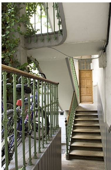
Détail de l'escalier à cage ouverte depuis la première volée.