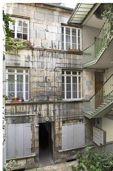
Vue d'ensemble de la façade sur cour du logis principal.