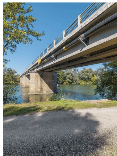
Vue d'ensemble. IVR26_20162101400NUC4A