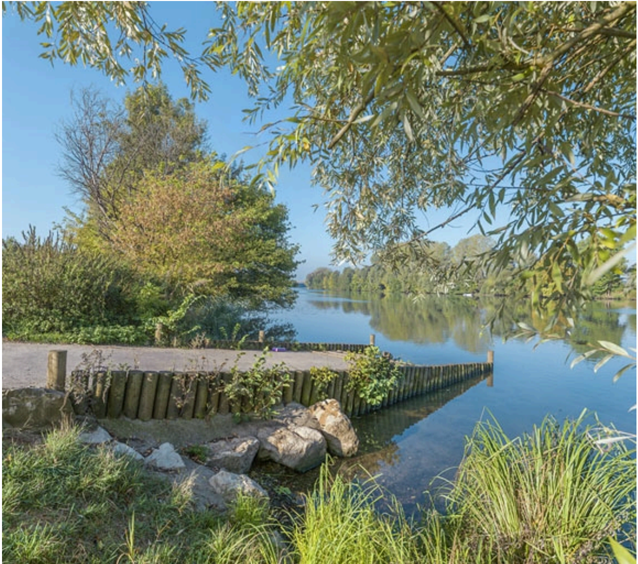
Vue depuis la rampe de mise à l'eau, légèrement en amont du pont.