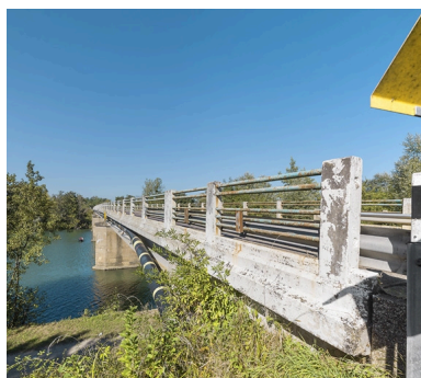
Vue d'ensemble. IVR26_20162101399NUC4A