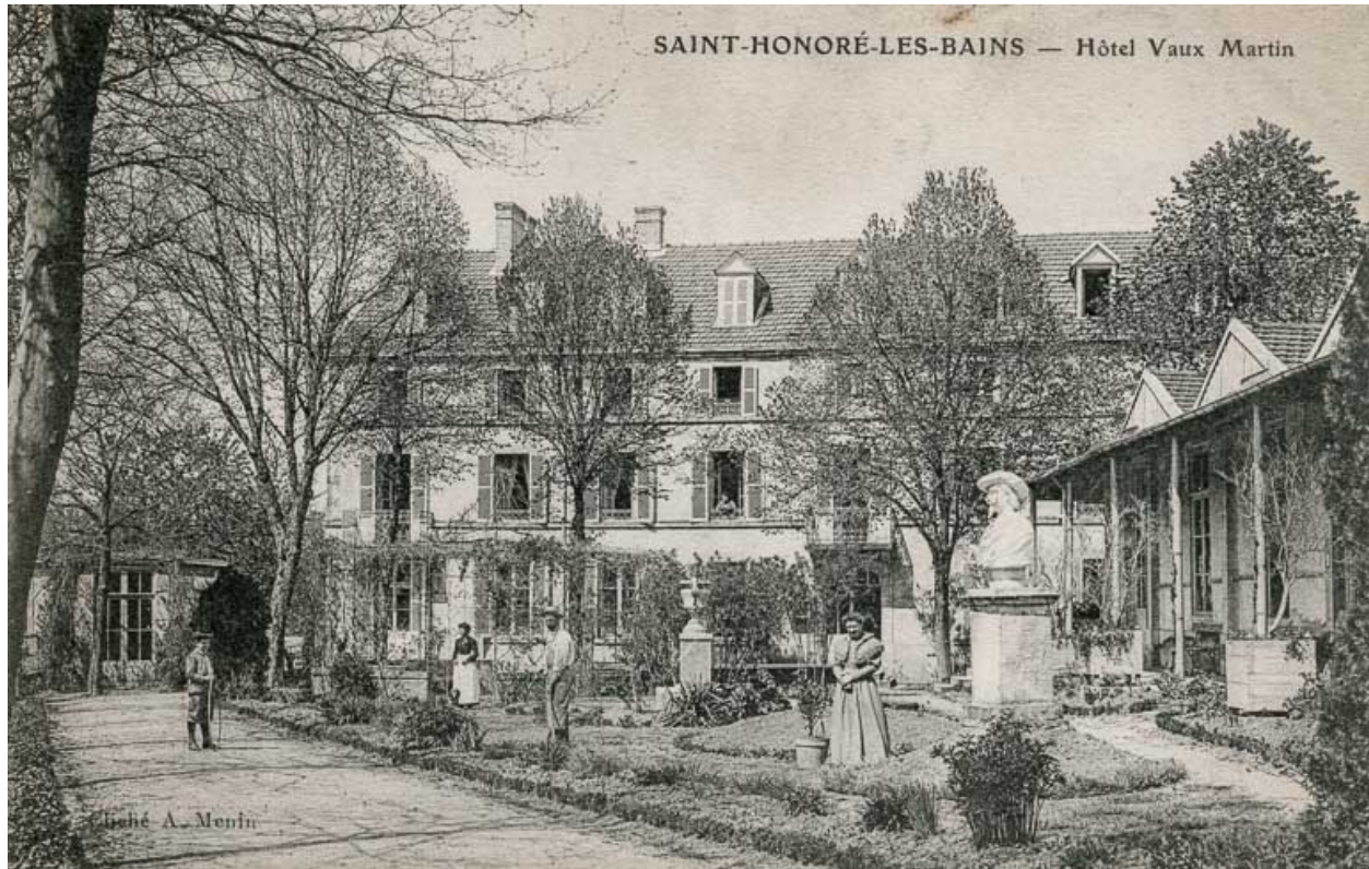
Façade sur le jardin.