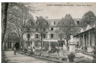
Façade sur le jardin. IVR26_20195800152NUC2A