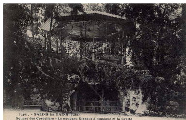
Vue ancienne.