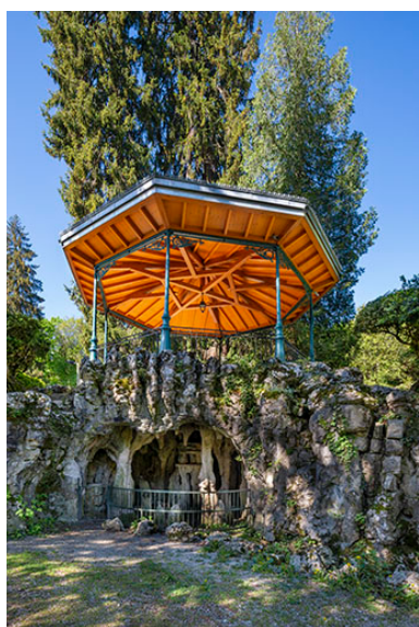
Vue actuelle. IVR43_20223900426NUC4A